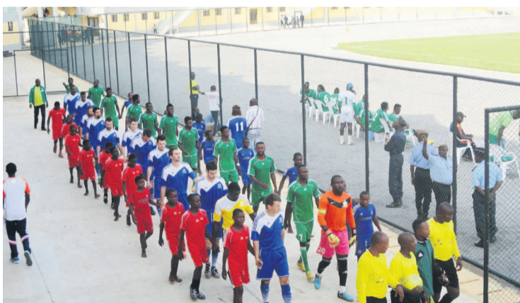
La sortie des deux équipes

Le club de Dolisie était alors obligé de combler les attentes victorieuses du public de Sibiti. Chose faite,