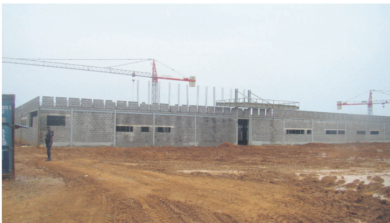
Le chantier de l'hôpital général de Ouesso

Là encore, le gouvernement a concentré ses efforts dans un pro-