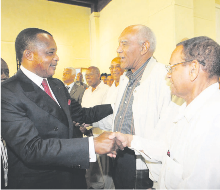
Le chef de l'État avec des personnalités cubaines

Après Dakar, au Sénégal, où il a pris part, aux côtés de ses pairs africains, au XV e Sommet de la Francophonie, le président Denis Sassou N'Gusso s'était rendu à la Havane, à Cuba, pour une visite de travail de trois jours. Dans son agenda, la visite à la Maison de l'Afrique où avait lieu le vernissage de l'exposition Kiebe-kiebe. Arrêt sur les images du volet culturel de ce séjour présidentiel.