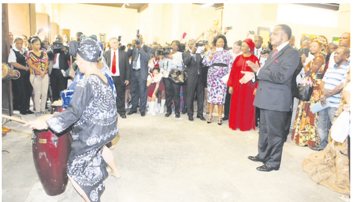
Le président Denis Sassou N'Gusso apprécie l'art des femmes percussionnistes