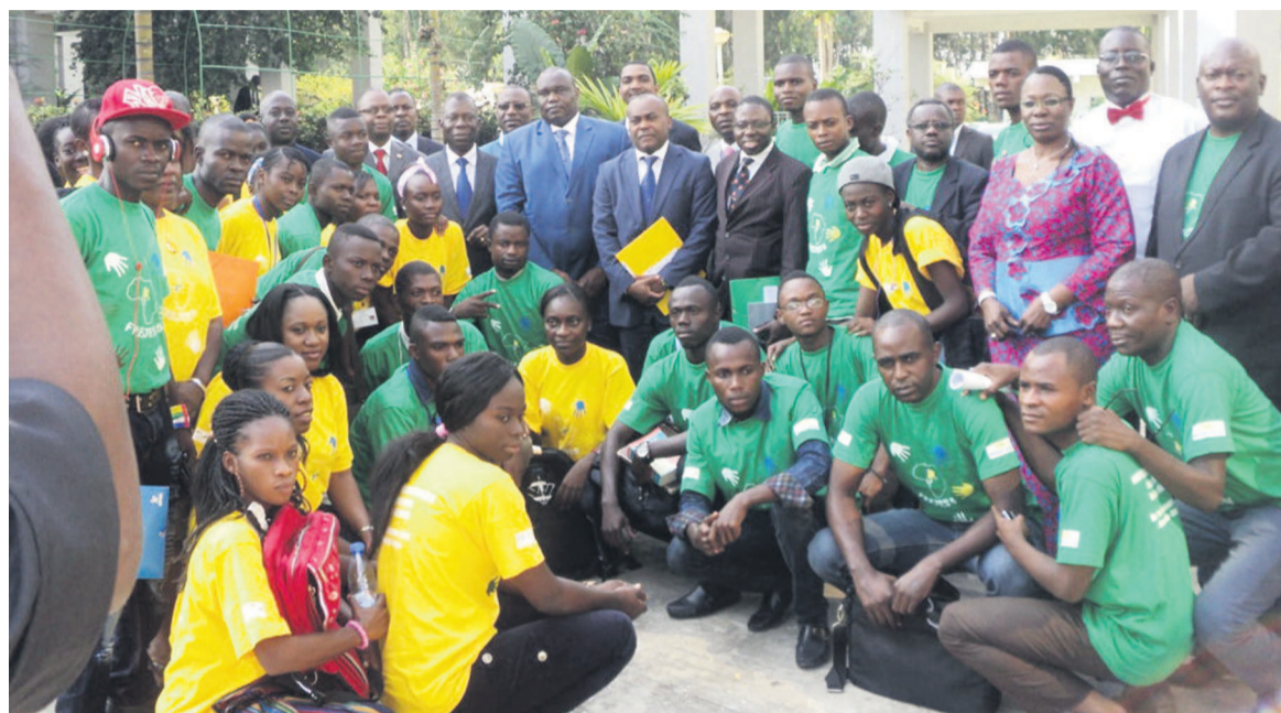
La photo de famille avec les jeunes

Le ministre de la Santé et de la Population, François Ibovi, a ouvert le 17 décembre à Brazzaville, les travaux du forum régional des jeunes de la communauté économique et monétaire d'Afrique centrale (Cemac).