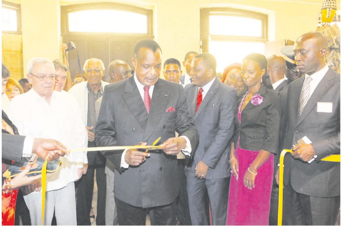
Le président Denis Sassou N'Gusso coupant le ruban symbolique