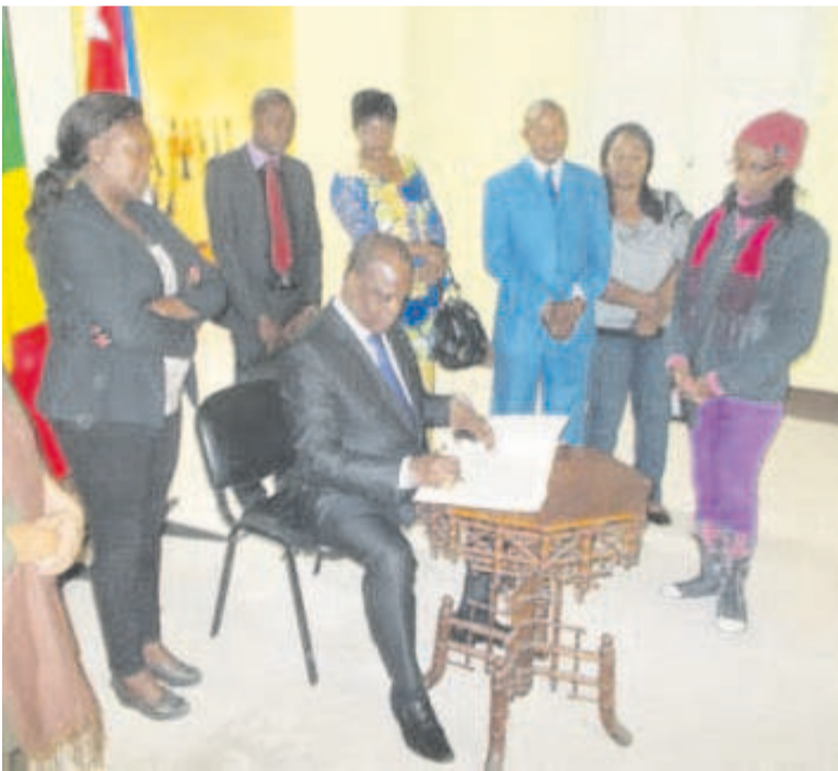
Le ministre Henri Djombo signe le livre d'or à la casa de africa après la visite de l'expo kiebe kiebe