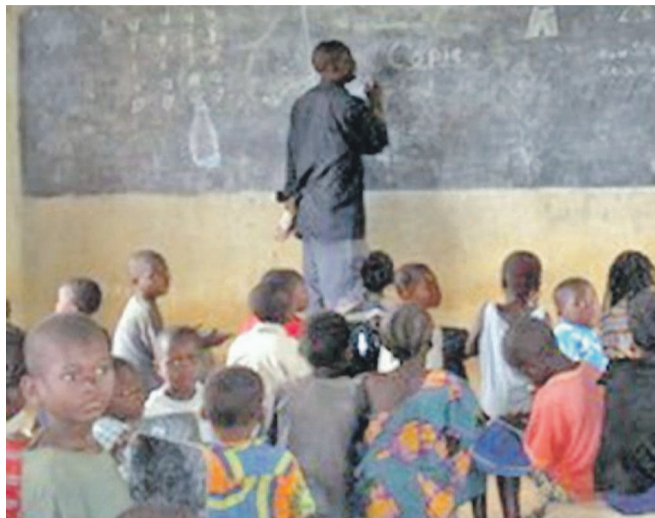
Un enseignant écrivant sur le tableau