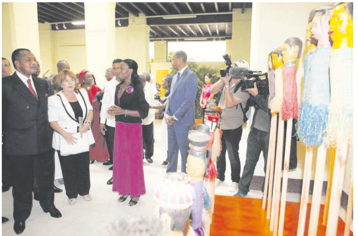
Le président Denis Sassou N'Gusso admirant les statuettes