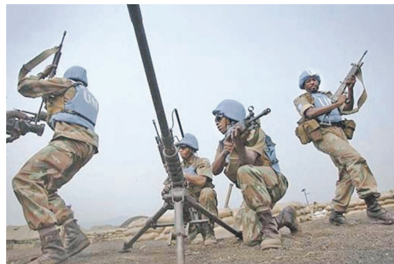
Des casques bleus en pleine action

Les propos du chef de l'État avaient, comme il fallait s'y attendre, provoqué des réactions en sens divers de la part des responsables onusiens qui préfèrent mettre un bémol sur la question bien qu'elle fasse l'objet d'un plan déjà entériné au niveau du Conseil de sécurité des Nations unies. À travers la Résolution 2147 paragraphe 48, fait-on savoir, il y a une revue stratégique pour envisager le retrait progressif de la Monusco en RDC. Tout le problème réside dans la manière d'opérer ce retrait pour lequel