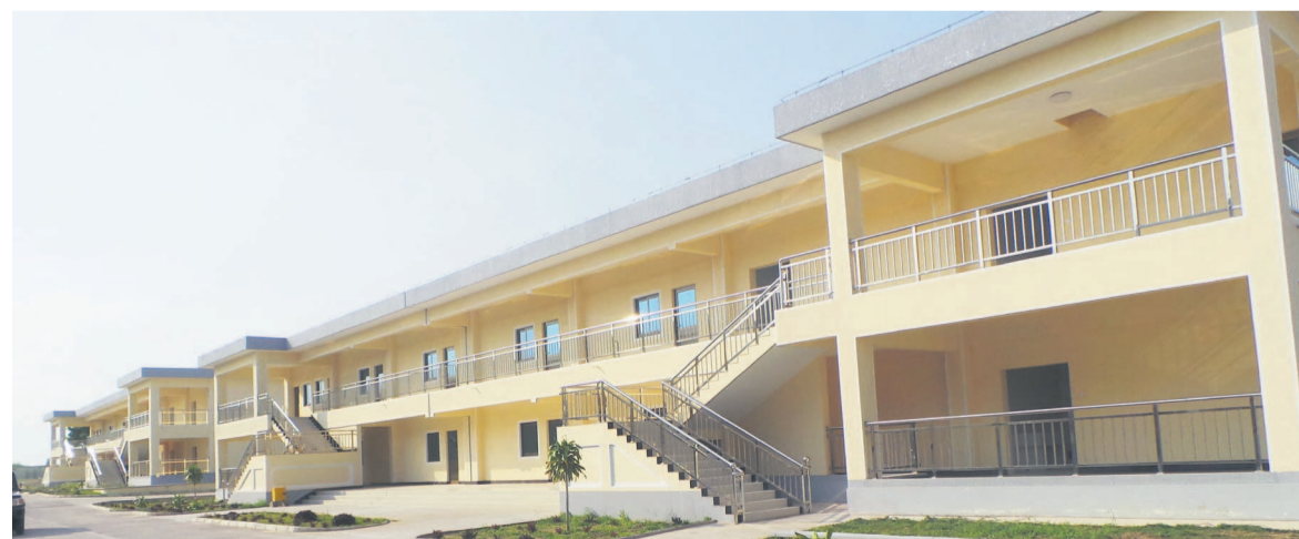
L'un des bâtiments presque achevé à la caserne Ndoou

Réalisés sur trois sites au quartier Tsielampo, les travaux de nouvelles casernes et bases militaires avancent normalement, selon les membres du gouvernement qui ont visité ces chantiers. « Il y a des casernes qui sont presque achevées, car déjà réalisées à 94 ou 95% certaines. Il est possible qu'au début de l'année 2015 quelques casernes soient