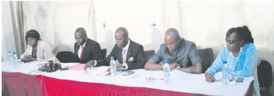
Les représentants de certains partis de l'opposition

boré par tous et qui devrait nous conduire à une alternance démocratique apaisée. « Il serait prétentieux, et même imprudent, de part et d'autre, de penser que l'on peut se passer du dialogue et dormir sans être inquiété. Il s'agit de présenter au chef de l'État le climat réel