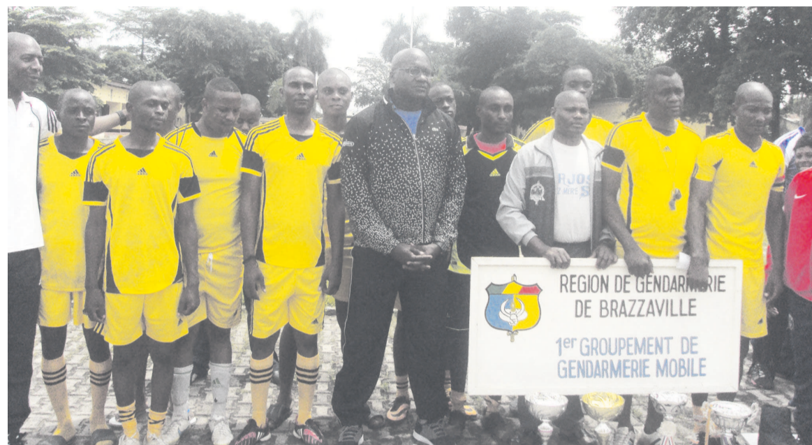
Le colonel Gildas Olanqué posant avec les athlètes de la meilleure formation du tournoi

La deuxième édition de cette compétition qui s'est déroulée du 16 octobre au 27 décembre visait, entre autres, la consolidation des acquis, le renforcement de la cohésion des personnels de la région de gendarmerie de Brazzaville ainsi que l'acquisition des nouvelles expériences