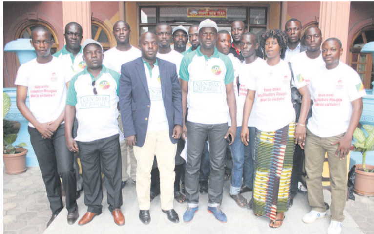
Les membres de l'association «Bana Diablies rouges»