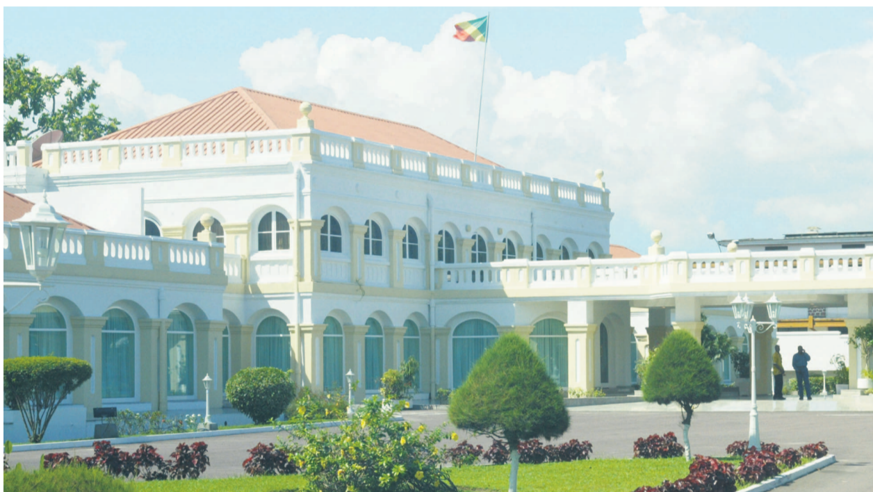
Le palais du peuple

Ce 31 décembre, en fin d'après-midi, le président de la République présidera le traditionnel réveillon d'armes avec la force publique. Un rendez-vous au cours duquel, le chef de l'État écoutera le rapport annuel des Forces armées, de la Gendarmerie et de la Police, livré par le chef d'état-major général des Forces armées congolaises. En retour, le chef suprême des armées instruira les hommes en uniforme sur les engagements de l'année qui commence.