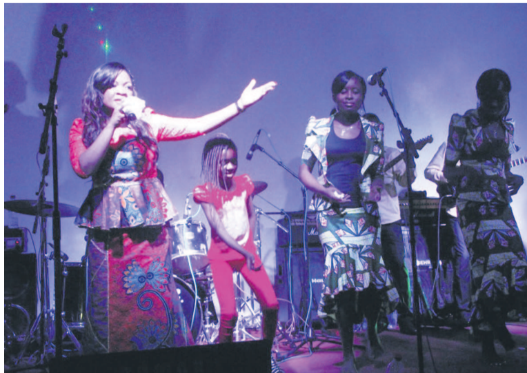
L'artiste en plein concert; Une photo, l'artiste entourée d'enfants