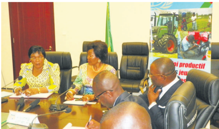
Séance de travail entre les deux parties