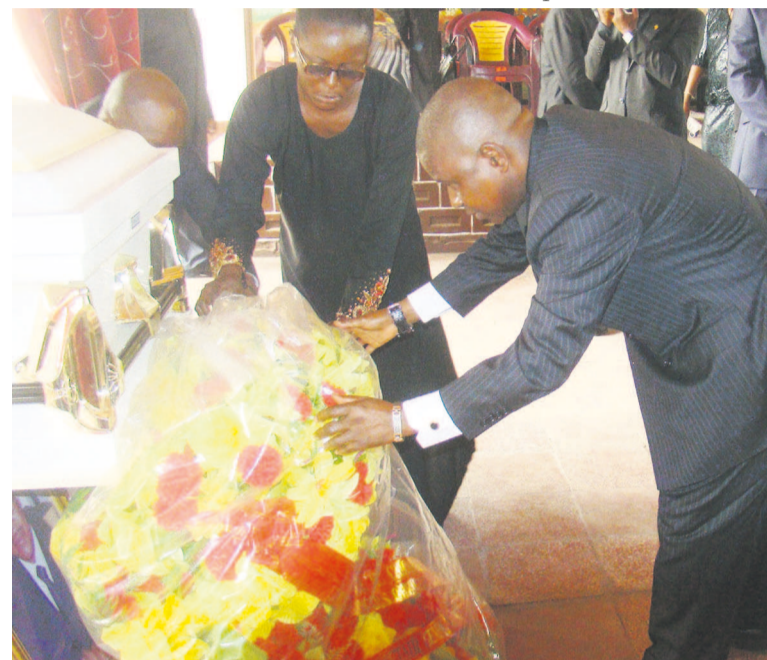
Le secrétaire général du PCT déposant la gerbe de fleurs