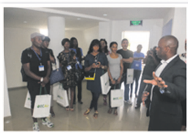
Visite guidée au sein d'ECAir House.