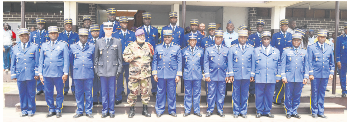
Le commandement et quelques invités après l'échange de vœux

Le commandant de la gendarmerie nationale, le général Paul Victor Moigny, a annoncé récemment au cours de la traditionnelle cérémonie d'échange de vœux, avec les personnels sous sa tutelle, la poursuite de la réforme pédagogique ainsi que celles visant le recadrage juridico-administratif de toute l'institution.