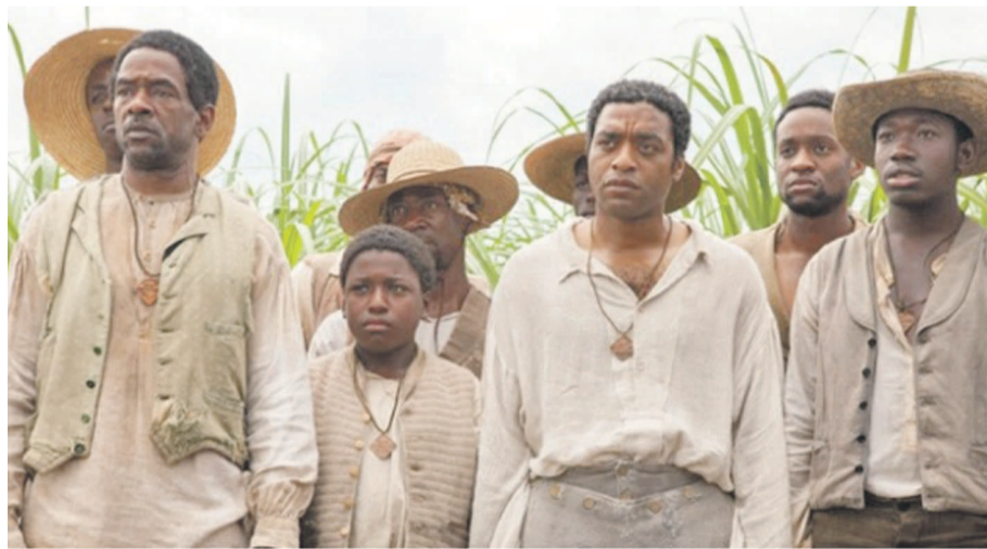
Une vue du film «12 years a slave»