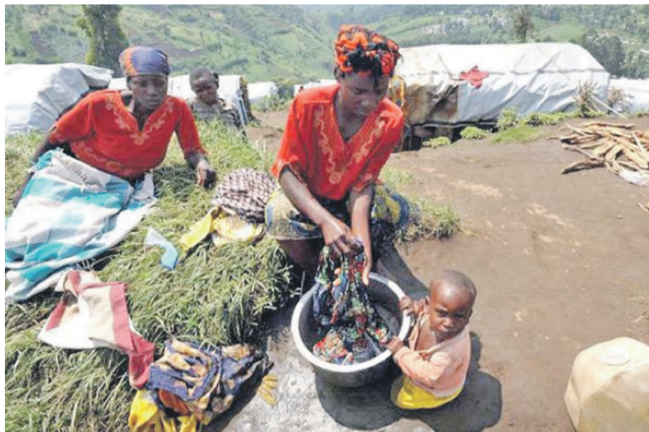
L'aide financière est la bienvenue pour les déplacés de guerres

L'important financement accordé par le coordonnateur de l'Action humanitaire en RDC, Moustapha Soumaré, vise à assister des milliers de personnes confrontées à des besoins urgents principalement dans l'est de la RDC. Les personnes victimes de conflits armés et celles souffrant de la malnutrition, surtout les enfants, en sont les premières bénéficiaires.