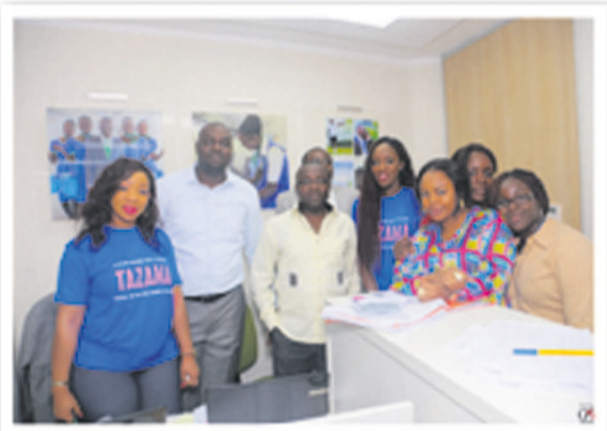
Les cinéastes posent avec des agents ECAir de la direction des finances et de la comptabilité.