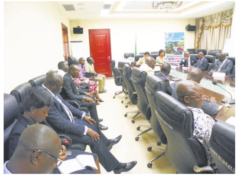
La séance de travail entre les deux parties