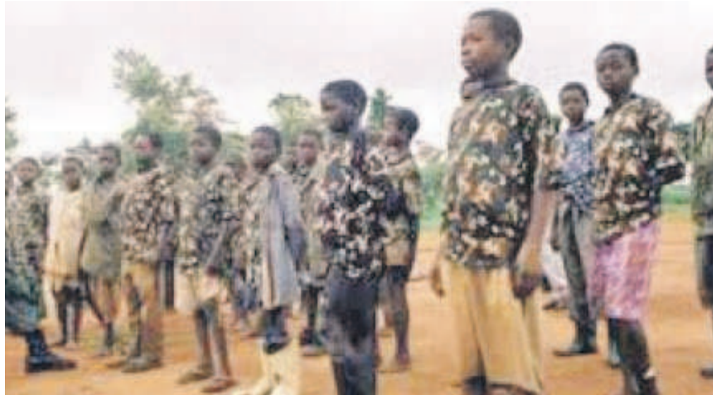
Le CICR condamne l'enrôlement des enfants dans les groupes armés

Pour que l'enfant regagne sa famille, le CICR concerte d'abord la famille et la prépare pour recevoir son enfant. Si le terrain d'entente est trouvé, l'enfant regagne sa famille et le CICR lui remet selon l'âge des fournitures scolaires ou du petit matériel pour lui permettre de s'intégrer plus facilement dans la communauté. L'année