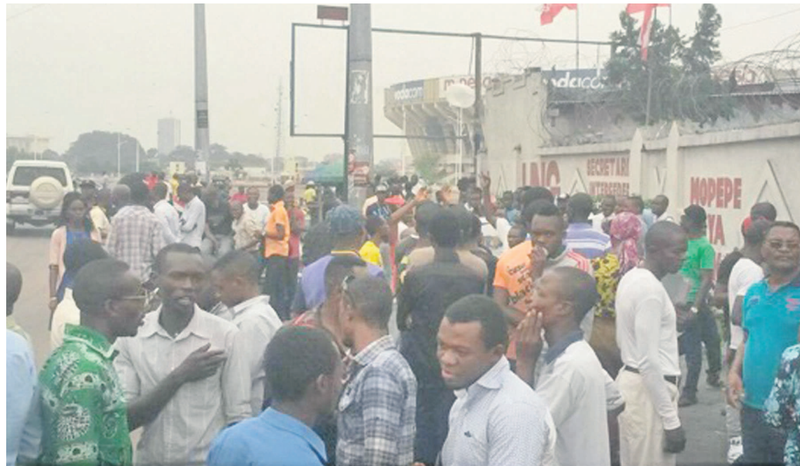
Quelques manifestants aux abords du Palais du peuple

Finis le long suspense qui avait mis en alerte des heures durant la population congolaise au sujet du vote au Parlement de la loi électorale. Le dernier acte de ce long processus a été négocié le 25 janvier lors de la plénière de l'Assemblée nationale. Les députés ont, contre toute attente, entériné l'avis de la commission paritaire mixte Assemblée nationale-Sénat en votant massivement pour la suppression de l'alinéa 3 de l'article 8 controversé du projet de loi modifiant et complétant la loi n°06/006 du 9 mars 2006 telle que modifiée par la loi n°11/003 du 25 juin 2011 portant organisation des élections présidentielle, législatives, provinciales, urbaines, municipales et locales. Ce qui a provoqué des scènes de liesse dans la ville étant entendu que ce dénouement rencontrait les aspirations du souverain primaire qui s'est dressé contre toute velléité à conditionner la tenue des élec-