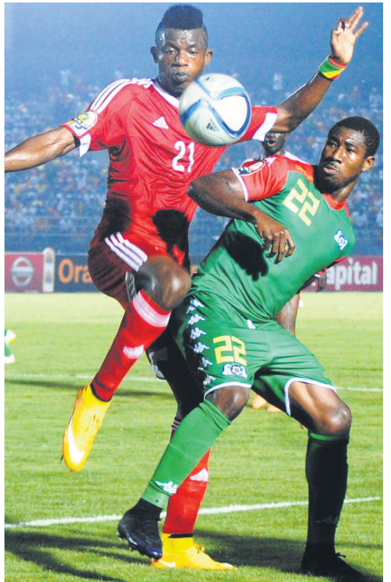
Auteurs de prestations remarquées, le jeune défenseur centrale de l'AC Léopards loue l'état d'esprit de son équipe. Et attise l'intérêt des recruteurs européens