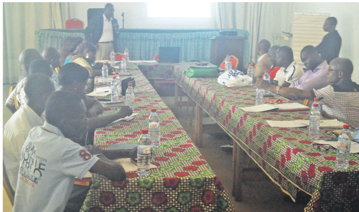
Une vue des aviculteurs pendant l'atelier

Après l'état des lieux de la situation des aviculteurs au niveau de la ville de Pointe-Noire, qui ont décrit comme facteurs bloquants: l'approvisionnement en intrants, la faiblesse et l'inadaptation des financements mis à la disposition de la filière avicole, le faible niveau de structuration au niveau des acteurs, un certain nombre de stratégies et d'actions ont été