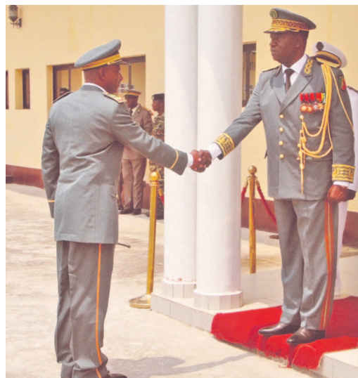
Le général Jean Ondaye Olessongo, à droite lors de la cérémonie de présentation

Au nombre des actions menées figurent : l'organisation de l'exercice de fin d'année d'instruction Lemba 2014 et du cours de Frac, l'inauguration des locaux neufs du service social, lesquels sont équipés d'un atelier de couture et d'un cyber café ; l'élaboration de SME des prévisions budgétaires d'avancement, la poursuite de la ré-articulation du dispositif des postes avancés, dont le couronnement devra être l'ouverture cette année du poste de Boamongo sur l'embouchure de la Louémé, la poursuite de l'opération sécurisation de la frontière Congo-Angola, la participation au séminaire sur la question du genre, organisé par le ministère de la Promotion de la femme et de l'intégration de la femme au développement.