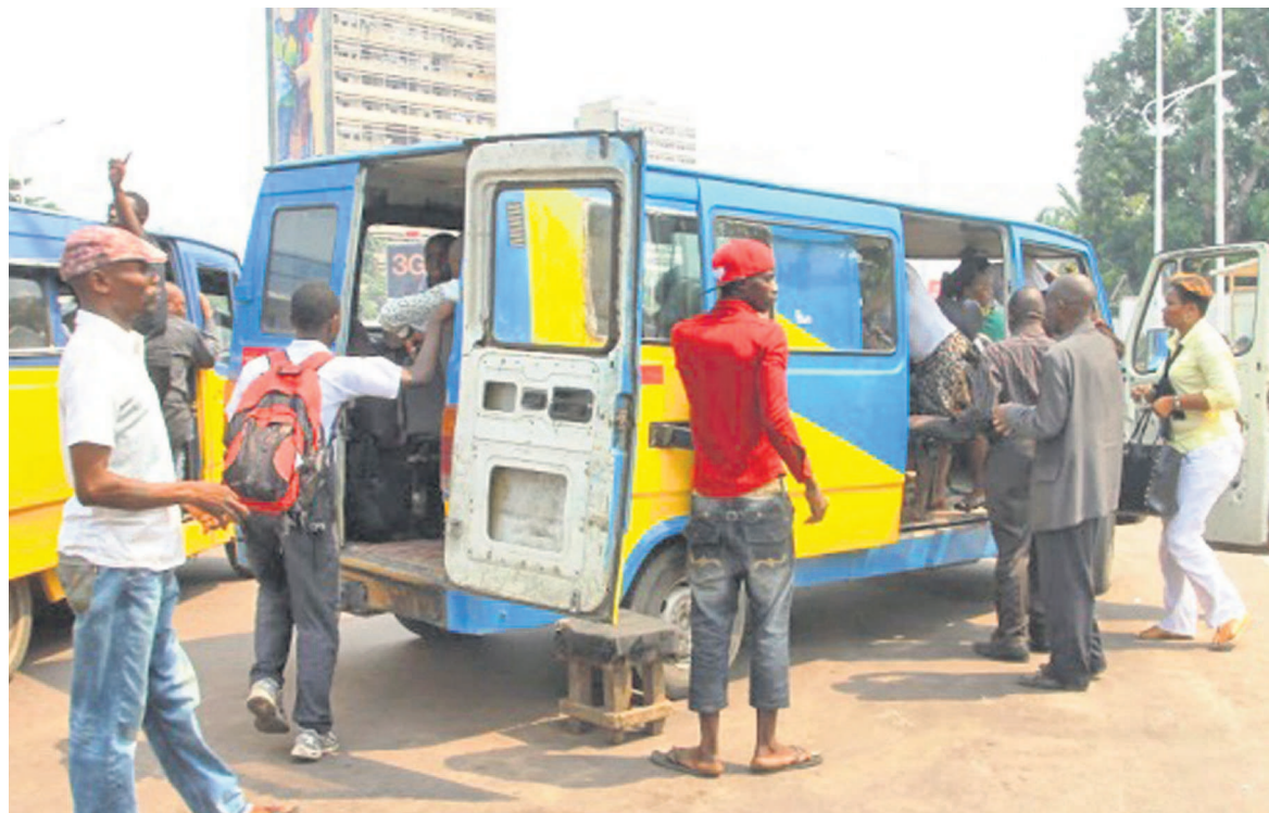
Un taxi-bus attendant des passagers

C'est dans ce décor militarisé que les Kinois ont vécu, la peur au centre, cette journée de lundi toujours prêt à prendre la tangente au premier coup de feu. Entre-temps, commerces, stations-ser-