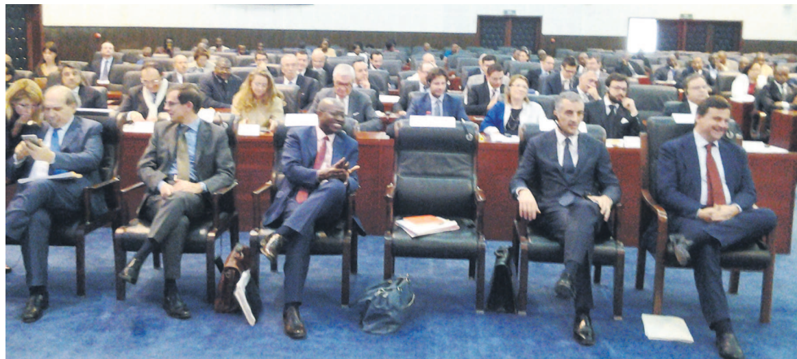
Une vue d'hommes d'affaires italiens

Une quarantaine d'hommes d'affaires italiens conduite par leur vice-ministre chargé du développement économique, Carlo Calenda, séjourne depuis deux jours à Brazzaville. Le but de leur mission est de s'informer des opportunités d'affaires qu'offrent la République du Congo, en vue d'investir.