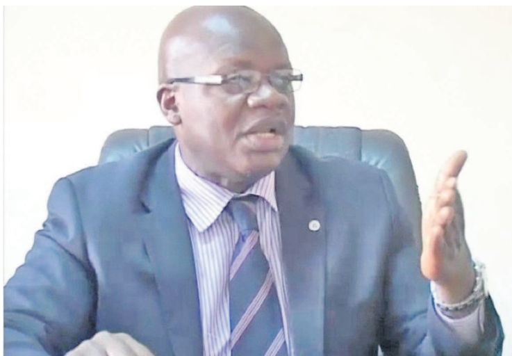
Le vice-Premier ministre et ex-secrétaire général du MLC, Thomas Luhaka Losendjola