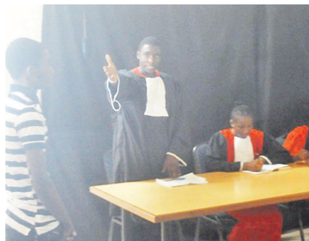
Une pièce de théâtre jouée par les scolaires lors du FTSP-N

La 5 e édition du Festival de théâtre scolaire de Pointe-Noire (FTSP-N) aura lieu du 24 au 27 mars 2015 à Pointe-Noire. Elle réunira une dizaine d'établissements scolaires : primaire et secondaire qui vont prester à travers leurs comédiens et troupes théâtrales dans les différents lieux de spectacles retenus pour la circonstance.