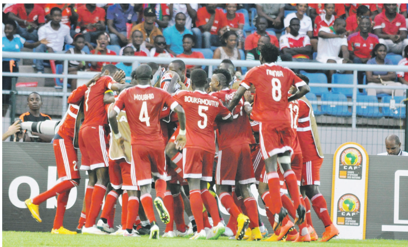
La joie des Diables rouges n'a été que de courte durée

Alors que la mobilisation semblait totale, peu avant le match dans les principales villes du Congo et la victoire presque acquise dans les 70 es minutes de la rencontre (2-0), les Diables rouges se sont inclinés devant leurs adversaires, Les Léopards de la RDC, qui ont fait jouer leur expérience.