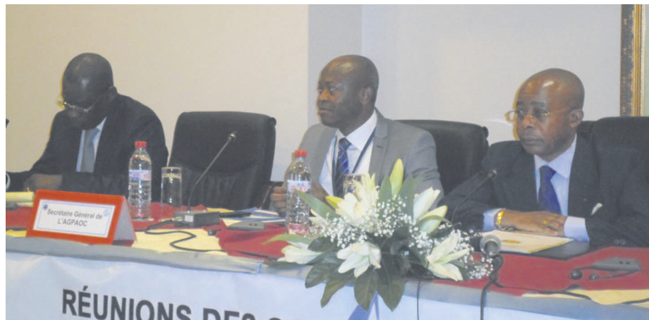
La tribune officielle u00E0 l'ouverture des travaux de la reunion des comiteu00E9s techniques de l'AGPAOC