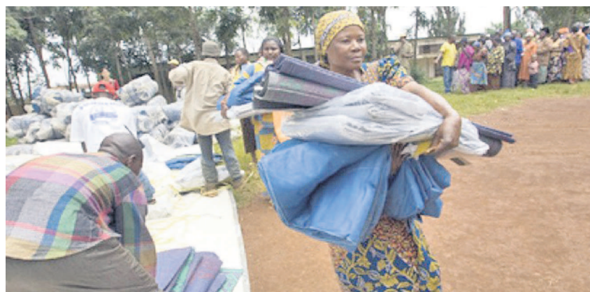
Des déplacés recevant une assistance d'urgence de l'Unicef et de l'ONG internationale IRC

Le Fonds des Nations unies pour l'enfance (Unicef) a lancé, le 29 janvier, un appel de 3,1 milliards de dollars pour venir en aide à 62 millions d'enfants en danger dans les crises humanitaires dans le monde. Par ailleurs, dans le cadre de ses actions humanitaires en RDC, cette agence des Nations unies mobilise 132 millions de dollars américains pour les enfants congolais. Le responsable de la communication de l'Unicef pour la RDC, Yves Willemot, a noté que les fonds serviront entre autre à venir en aide aux plus de 2,7 millions de personnes déplacées suite aux conflits armés dont la majorité d'entre eux vivent en dehors des camps dans des familles d'accueil. « L'appel pour la RDC représente 132 millions de dol-