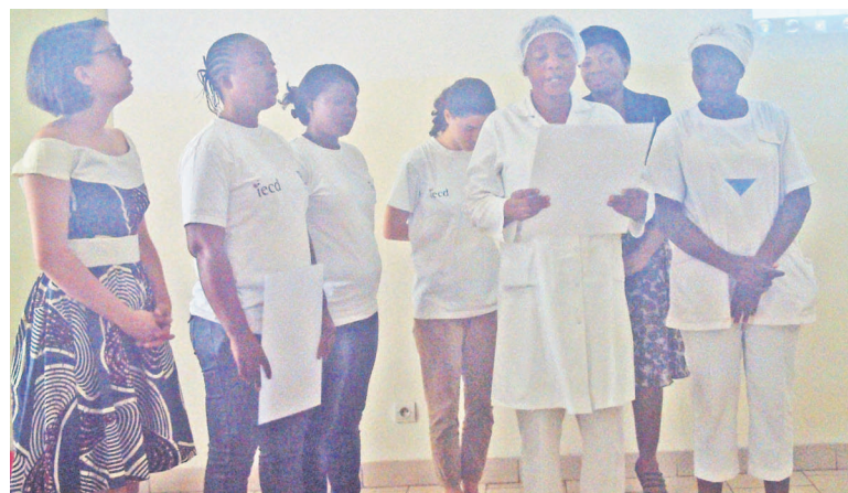
Lecture des engagements par une infirmière de l'hôpital de Base de Tié Tié