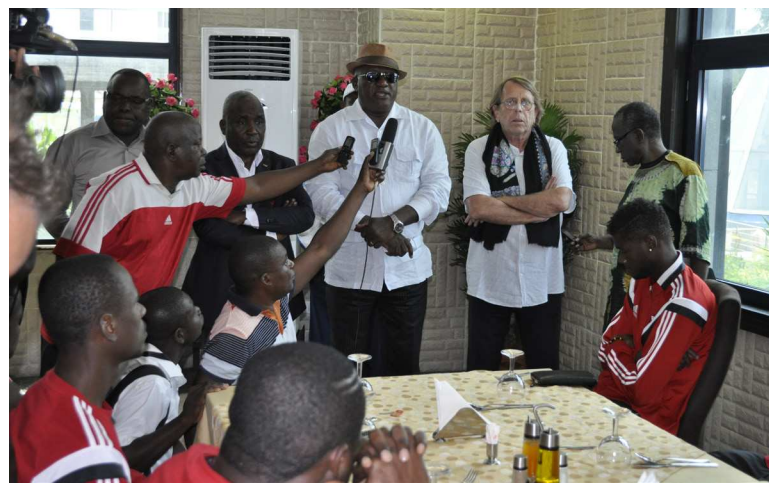
Léon-Alfred Opimbat, le ministre des sports, s'est exprimé devant la sélection congolaise, dimanche matin

Face à la sélection congolaise, Léon-Alfred Opimbat a su trouver les mots justes : « Le Congo n'avait pas gagné le moindre match à une phase finale de la CAN depuis quarante et un an et vous avez su vaincre le signe indien en obtenant deux probantes victoires face au Gabon et au Burkina. Vous êtes également parvenus à vous qualifier au second tour de cette compétition, rendant positif le bilan global de la participation congolaise. Notre football est revenu, avec fierté, sur le devant de la scène africaine, et ceci est votre œuvre ». Le ministre des Sports a par ailleurs rappelé l'apport du gouvernement quant aux bonnes conditions de la sélection nationale. « Vous êtes venus en Guinée Equatoriale avec l'onction du peuple congolais et avec la bénédiction du président de la République, qui vous a apporté tout son soutien. Je crois que l'on peut dire que le gou-