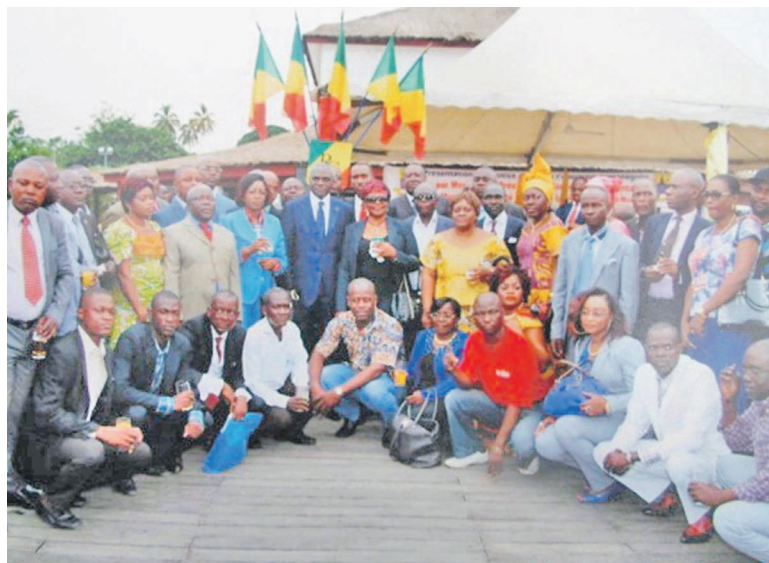
La photo de famille avec les journalistes

Depuis 6 ans, le conseil municipal et départemental de Pointe-Noire dédie chaque année ses vœux de Nouvel An à une corporation. Pour 2015 le Conseil a porté son choix sur les journalistes. Cette communion avec la presse a eu lieu le 28 janvier.