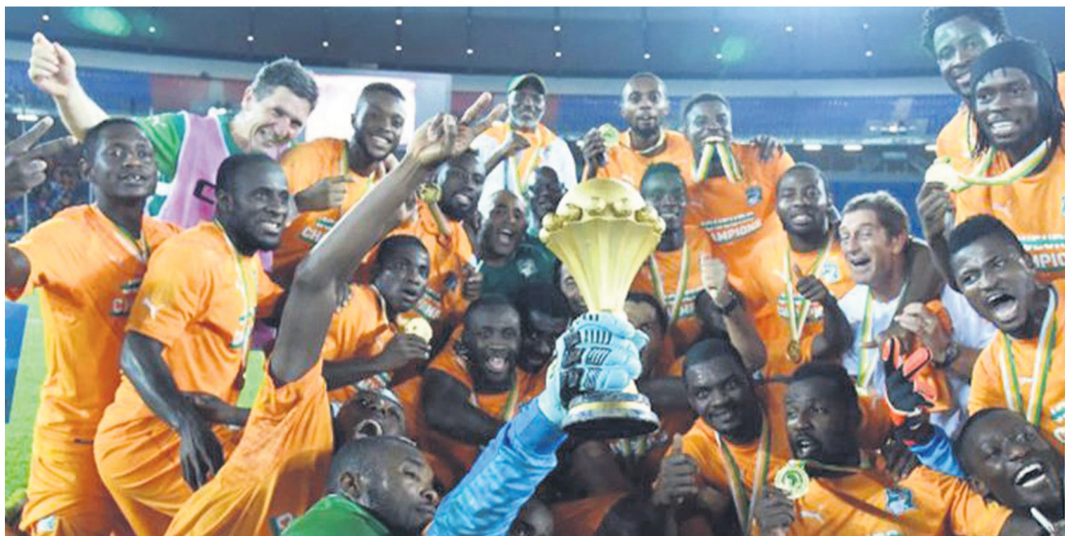
La jubilation des Ivoiriens

Les Éléphants de la Côte d'Ivoire ont remporté, après une finale âprement disputée pendant les 120 minutes de temps réglementaire, la trentième édition de la Coupe d'Afrique des nations en s'imposant aux tirs au but (9-8) face au Ghana.