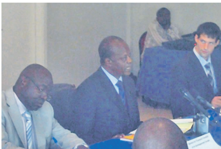
La tribune officielle lors du séminaire de capitalisation du PAGEF

Les participants ont demandé entre autres, la poursuite du Programme d'aménagement des forêts du sud-Congo afin d'atteindre l'objectif d'achever l'ensemble des