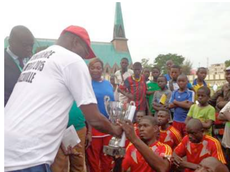
La remise des trophée

« En marge de cette conférence, nous avons voulu faire participer ceux qu'on estime « handicapés » mais qui participent à la vie sportive. Le terme handicapé, je ne l'aime pas. Je ne le supporte pas parce qu'il fixe les