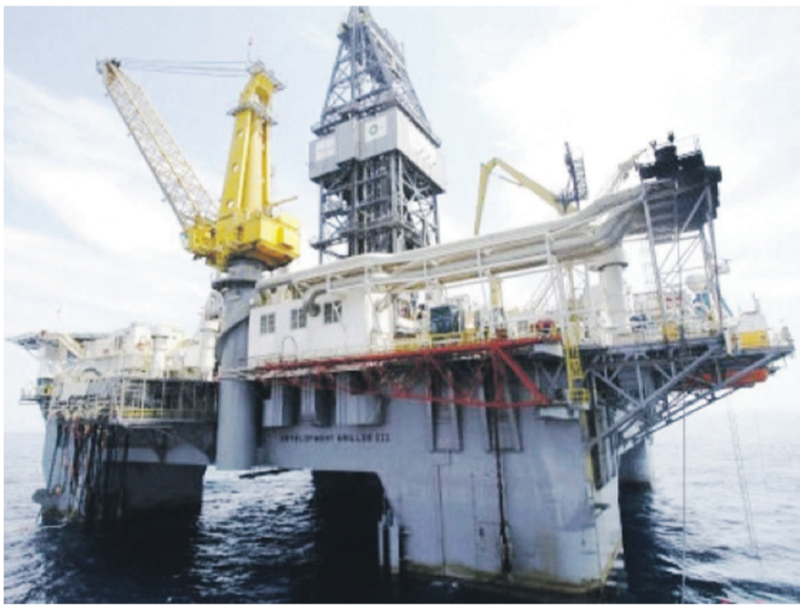
Exploitation pétrolière aux larges de la Côte Atlantique