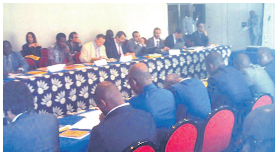
Une vue des participants

Cinq ans après sa mise en place, le projet d'appui à la gestion durable des forêts (Pagef) arrive à son échéance le 28 février de cette année. Et le Centre national d'inventaire et d'aménagement des ressources forestières et fauniques (Cniac) a été choisi le 06 février lors de la dixième session du comité de pilotage du Pagef qui s'est déroulée à Pointe-Noire pour perpétuer la gestion durable des forêts.