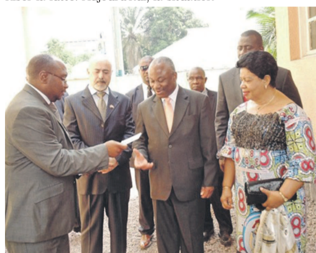
Le ministre de la Santé remettant sa carte de visite au ministre libérien