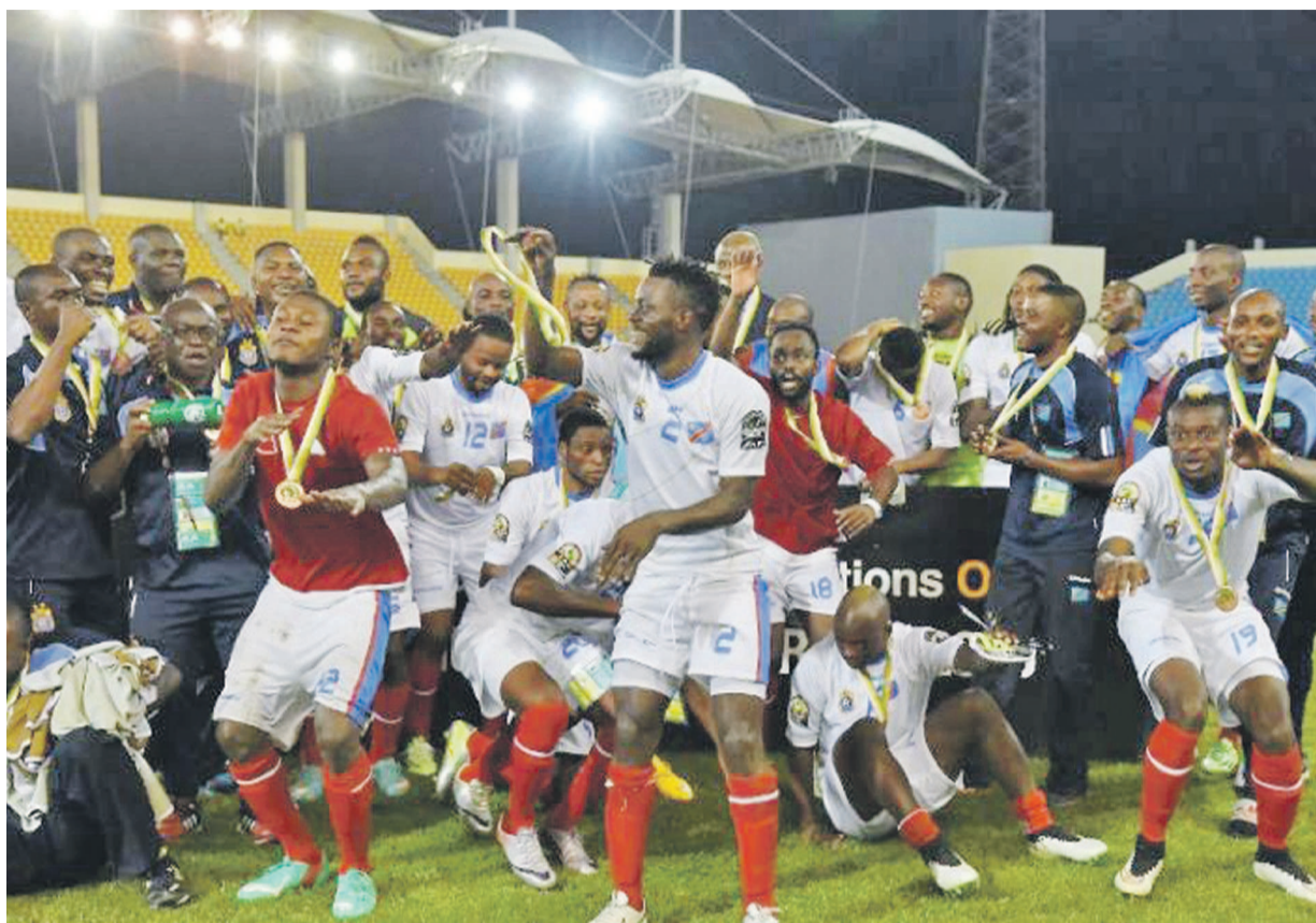
Les Léopards de la RDC, médaillés de bronze à la CAN 2015