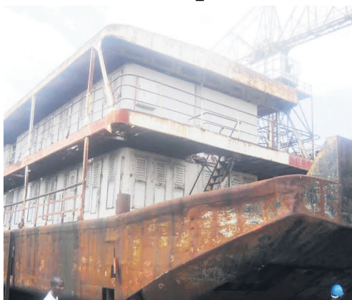
L'ITB Kokolo

La cérémonie d'inauguration du bateau récemment réhabilité dans sa totalité, de la fondation à la tôlerie, a eu lieu le 7 février au port de Kinshasa, en présence du président de la République, Joseph Kabila. Actuellement, c'est le plus gros bateau de la Société commerciales des transports et des ports (SCPT) avec huit barges dont cinq passagers et trois cargos.