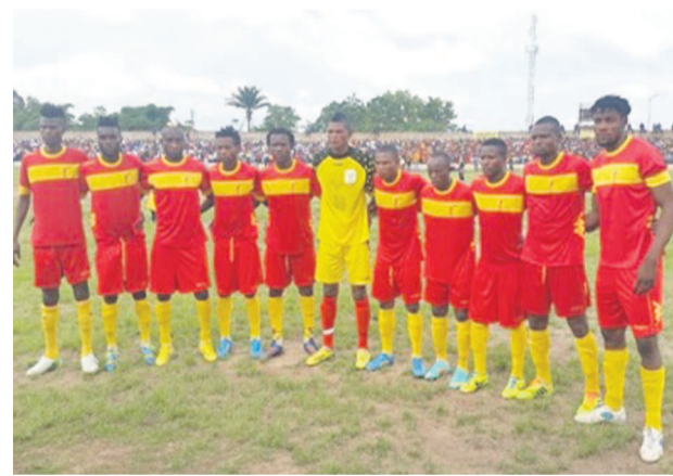
< Sans données à partir du lien >

L'on rappelle que le club de Mbuji-Mayi avait loupé de près de finir champion du Congo en 2014, se contentant de la deuxième position derrière le TP Ma-