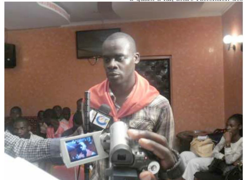
Le président nouvellement élu