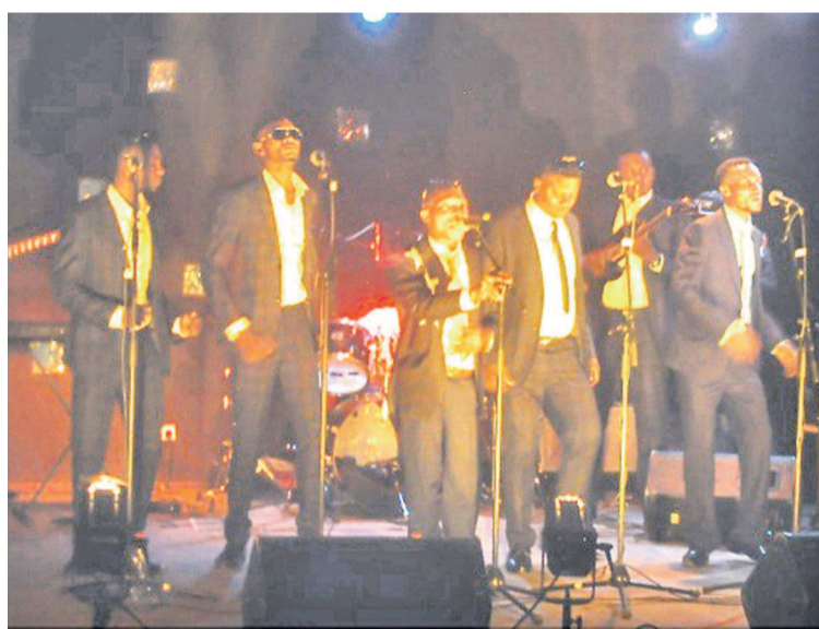
L'orchestre Dolisiana à l'Ifc

artistes français et congolais, l'Institut français de Pointe-Noire souhaite entretenir des relations privilégiées avec la Commune de Dolisie, notamment en ce qui concerne le repérage et le suivi des artistes locaux.