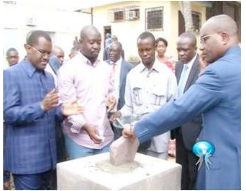
Pose de la première pierre du bâtiment multimédia à Bayardelle