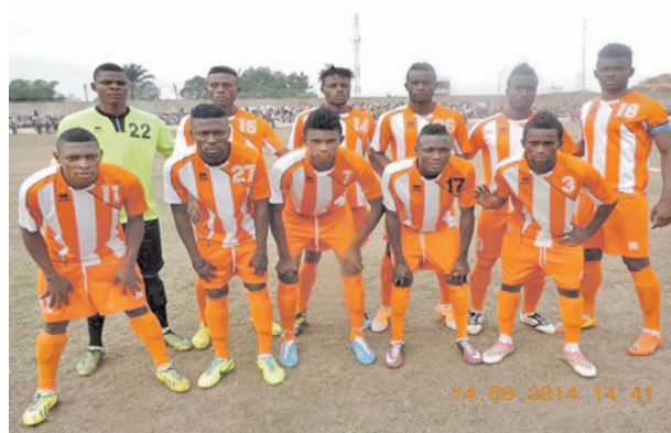
< Sans données à partir du lien >