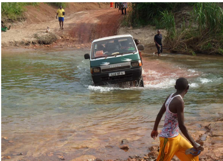
Un bus en partance pour Kindamba dans le Pool