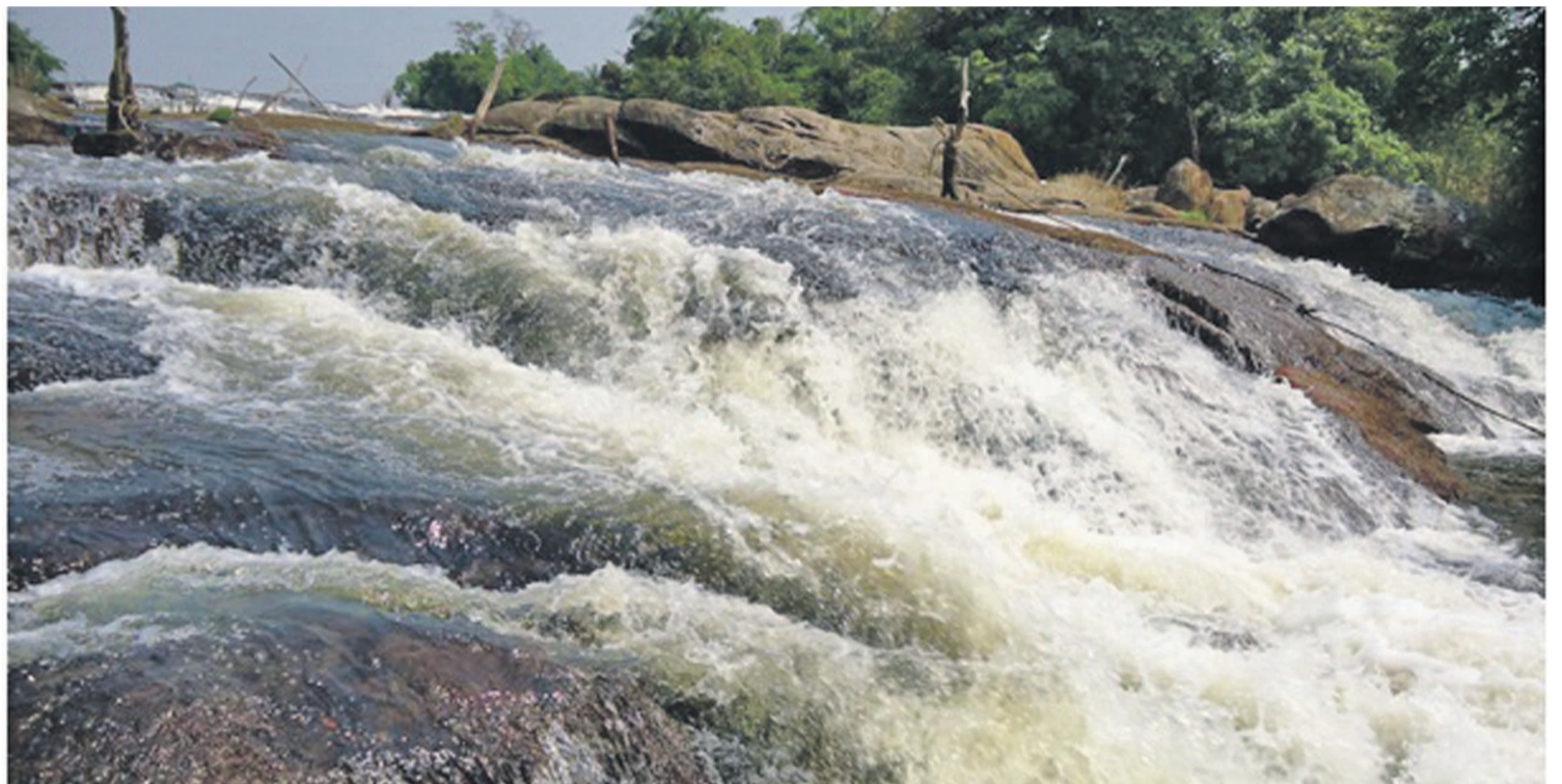
Les chutes de Katende

L'ouvrage est réalisé grâce à un financement mixte du gouvernement indien, à hauteur de 168 millions de dollars et du gouvernement congolais qui va décaisser 112 millions. Au total, l'ouvrage coûtera 280 millions de dollars. Selon les détails techniques recueillis, la centrale devra avoir une capacité de 64 MW. Les provinces bénéficiaires sont principalement les deux Kasaï.