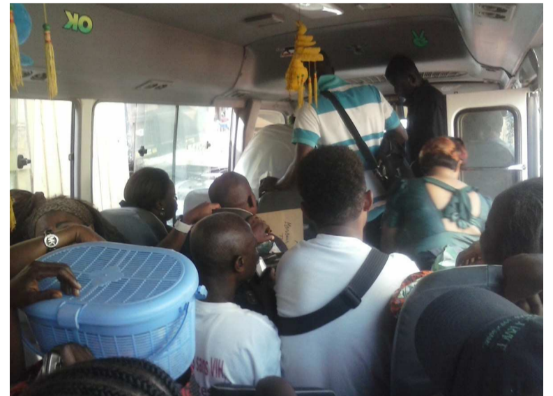
Des voyageurs dans l'inconfort

Derrière ces arguments, une préoccupation se lit : la totale implication de l'État, car le bien-être des populations se vérifie aussi dans la façon de voyager. Et cet enseignement croisé à la gare routière de Bourreau, à Makélékélé (premier arrondissement de Brazzaville),