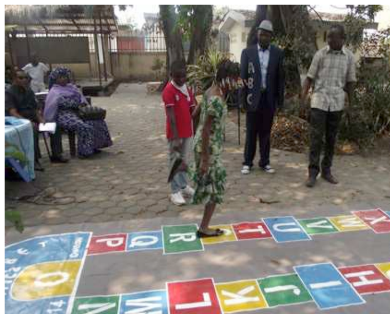
Une fille s'exerçant à la marelle

Quant à son utilité, les connaissances des lettres de l'alphabet étant la base pour l'apprentissage de la lecture et de l'écriture, l'association a choisi la marelle pour les raisons suivantes : jeu éducatif complet à l'impact rapide associant le plaisir à l'apprentissage (jeux de règle, d'adresse, de mémoire visuelle et auditive) ; jeu d'extérieur relativement peu coûteux et durable dans le temps; située dans des lieux publics. Elle est visible et accessible gratuitement à tous. L'objectif de la marelle étant de mémoriser les vingt-six lettres de l'alphabet. Déjà en 2012, lors de l'inauguration de