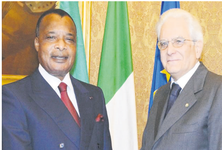
Denis Sassou N'Gouesso et Sergio Mattarella

Un cadre global a été dressé qui fait du pays dont les atouts, au cœur de l'Afrique Centrale, avec un port en eau profonde et des projets qui montent en puissance. Le chef de l'État congolais : « une opportunité qui trouve du bien à tirer de la coopération avec un pays industriel comme l'Italie. Dans les domaines des infrastructures routières, de la