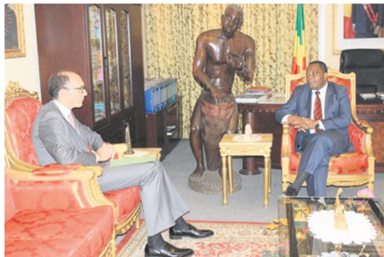
Les deux hommes d'État lors de l'entretien