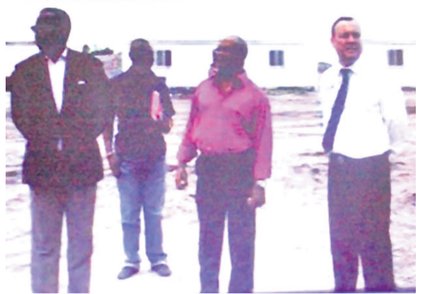
Le ministre, les hommes d'affaires et le DG Roc Roger visitant le site

quelques mots de sa société, le directeur général gérant a souligné que Maisons sans frontières compte près de 1200 salariés présentement. Et depuis le lancement de son projet de construction des habitats modernes en 1999, celle-ci a déjà entrepris diverses réalisations dans les départements de Pointe-Noire et du Kouilou en vue d'accompagner les pouvoirs publics dans la politique d'habitat.