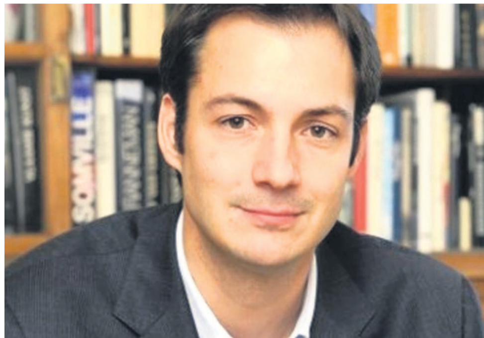
Alexander De Croo

émaillé les troubles du 19 et 20 janvier. L'officiel belge a, au passage, stigmatisé le lot d'arrestations sur fond d'une justice arbitraire sans oublier l'interruption de l'Internet