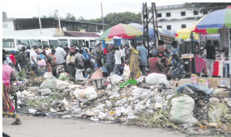
À l'entrée du marché Total, un dépotoir met à mal commerçants et acheteurs

municipal de Brazzaville, de la gestion des marchés de la capitale. L'opérateur a confié à son tour l'exécution des tâches liées à la salubrité et à la sécurité des lieux à une société congolaise nommée Miledi et basée à Poto-Poto.