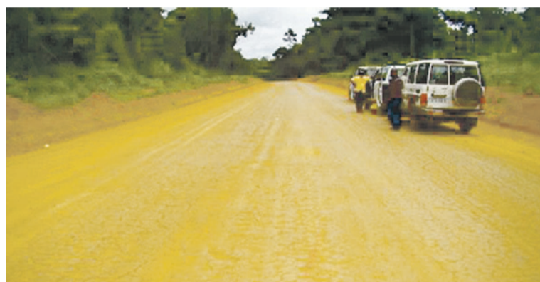
L'une des routes aménagées

À l'image d'autres départements du Congo, qui savourent déjà les bienfaits de cette politique du gouvernement, les départements du Niari et de la Lékoumou bénéficieront bientôt, eux aussi, de l'aménagement de plusieurs routes. Ces travaux ont été lancés, le 25 février à Mossendjo, par le ministre de l'Équipement et des travaux publics, Émile Ouosso.