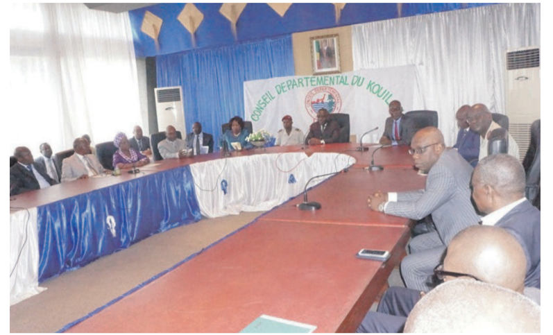
Les participants à la session

Rappelons que cette première session est convoquée conformément à l'arrêté n°002/DK/BE/S du 29 janvier 2015, du président départemental du Conseil départemental du Kouilou. Clôture ainsi les travaux de la dite session, Alexandre Mabiala a signifié que : « Cette première session a été déterminante pour assurer la marche du devenir du département du Kouilou vers