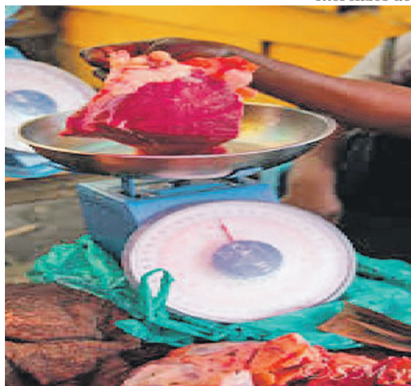
Une vente à la balance

Où sont donc passées les balances que la direction départementale du commerce intérieur avait distribuées aux commerçants de Pointe-Noire ? Cette question a conduit à une enquête dans certains marchés de la ville. Le constat est négatif.