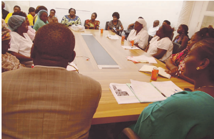
Une vue de la salle pendant la rencontre

Au cours de la rencontre, les participantes ont reconnu qu'en général, la femme congolaise ne s'adonne pas à la lecture, qu'elle continue de jouer les seconds rôles au foyer, au service et ailleurs. Elles sont nombreuses à continuer de nourrir des idées qui empêchent leur autonomie. Certaines participantes ont stigmatisé le comportement des femmes elles-mêmes, sou-