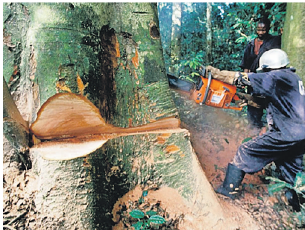
Abattement d'un arbre dans la forêt

Pour ces associations, près de 90% du bois produit en RDC l'est en dehors de tout cadre légal, sans que l'autorité étatique concernée n'ait un droit de regard sur toutes les transactions souvent opérées dans la stricte opacité. L'on apprend, en effet, des sources précitées, qu'environ un million de m 3 de bois part chaque année de l'est de la RDC vers les pays voisins de façon totalement clandestine. Des groupes armés qui gèrent des pans entiers des forêts et certains notables en ont trouvé une aubaine pour s'enrichir au détriment de l'État.