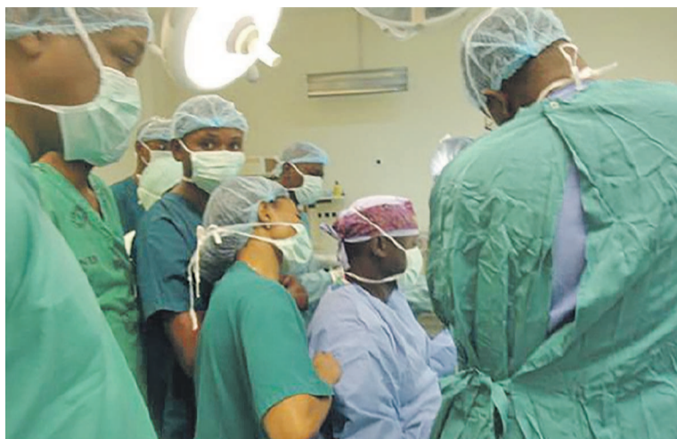
Des médecins dans la salle d'opération de l'HBMM