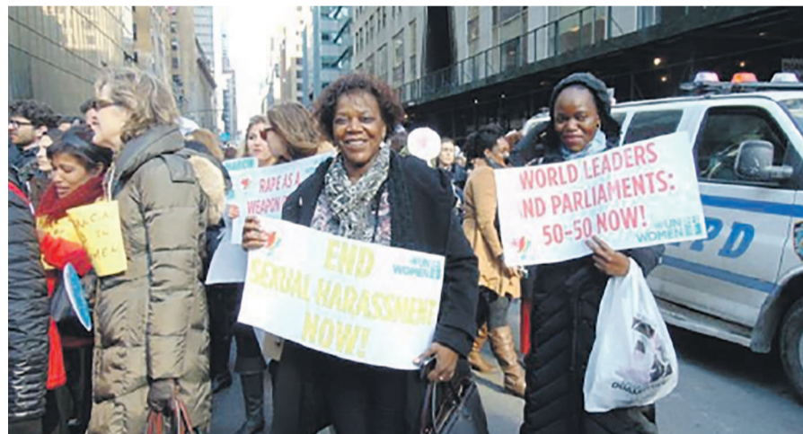
La Représentante personnelle du Chef de l'Etat à la Francophonie aux côtés de femmes du monde entier pour la marche de femmes « march in march »

Selon un communiqué du cabinet de Mme Tshombe, cette rencontre a permis aux ministres en charge du Genre et aux chefs de délégation des États et gouvernements, membres de la Francophonie, d'examiner le bilan de la mise en œuvre de la plate-forme d'action de Beijing et de partager leurs expériences de cette mise en œuvre ainsi que leurs priorités pour le nouveau programme de développement pour l'après-2015. Alors que l'adoption par les ministres en