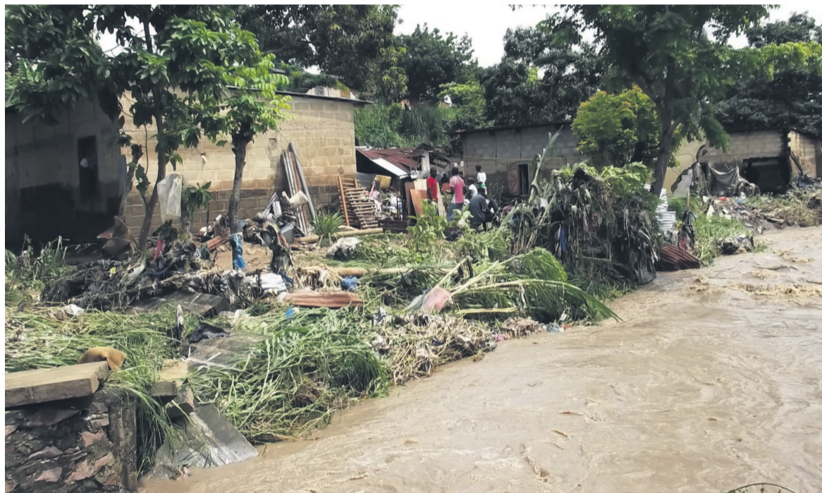
Débordement du lit de la rivière Mfilou

Dans la perspective d'un démarrage imminent des travaux de leur assainissement, les services techniques de l'Etat et leurs partenaires ont validé hier les études de faisabilité portant sur les rivières Tsiémé, Kélékélé, Mpila 1 et 2 et Mfilou. Les études réalisées par le cabinet Iqip planifient les travaux à exécuter dans le cadre du projet global de drainage des eaux de pluie à Brazzaville, en vue de mettre un terme aux inondations, glissements de terrain et ensablements