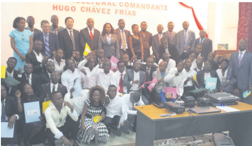
La photo de famille des diplômés et du corps diplomatique présent