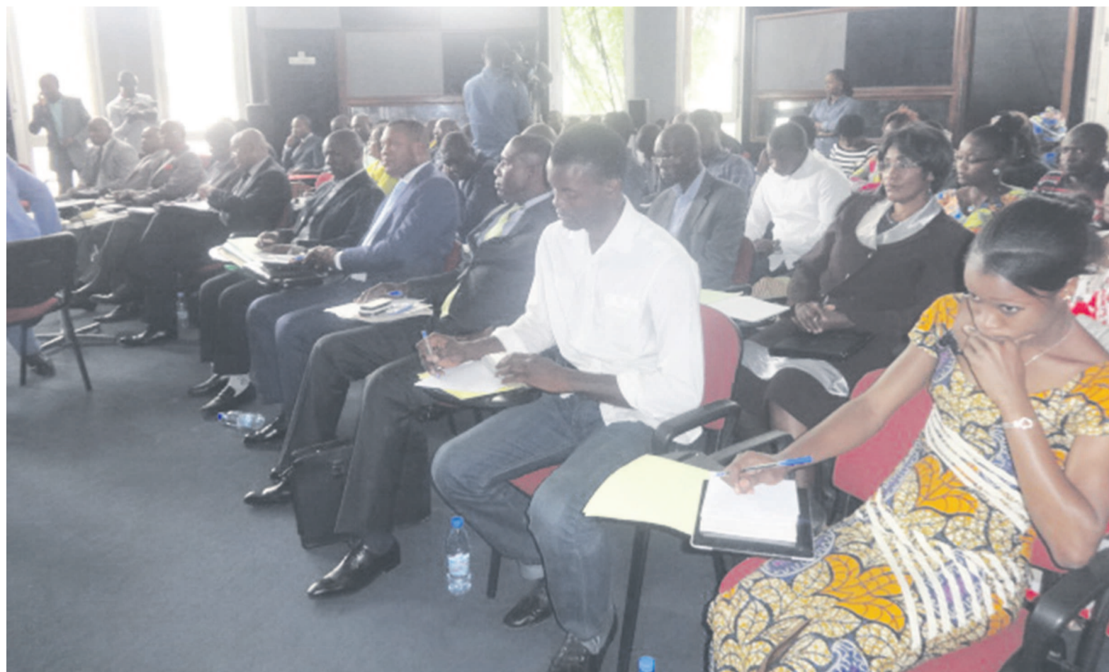
Les acteurs économiques

« Cette banque de projets aura l'avantage de développer des synergies entre les différents acteurs économiques du sec-