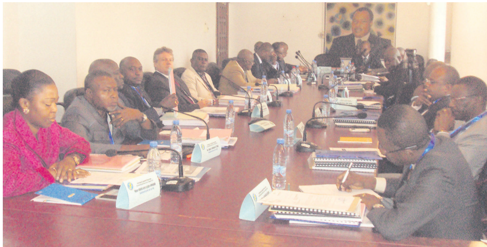
Les membres du conseil d'administration