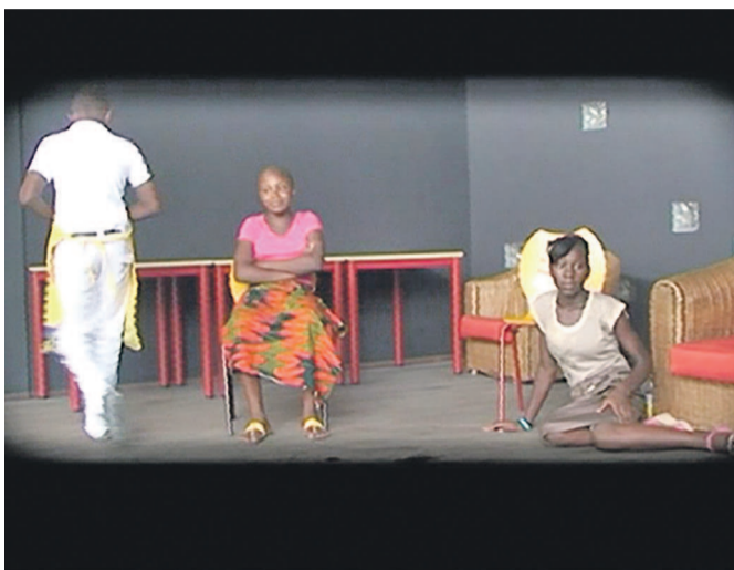
Une représentation théâtrale lors du FTSPN à l'IFC