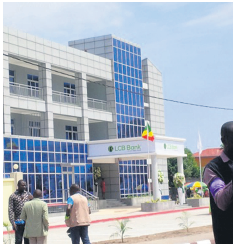
Une vue du siège de la LCB d'Oyo