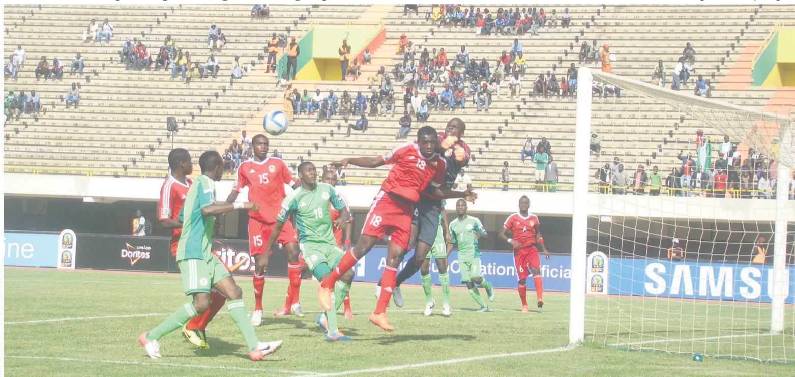
Le gardien congolais s'impose dans les airs

De notre envoyé spécial à Dakar, Rominique Nerplat Makaya