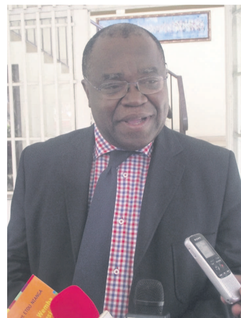
L'auteur de l'ouvrage répondant aux questions de la presse

Il compte présenter ce livre à la dixième édition du Festival pa-