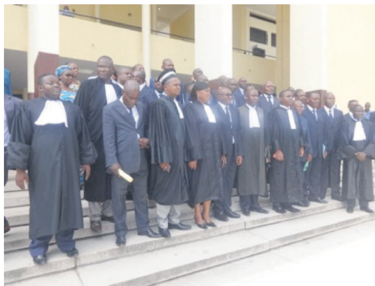
Les inspecteurs de l'Anac et les magistrats

La fonction d'inspecteur au sein de l'agence nationale de l'aviation civile (Anac) a toujours existé. Cependant, ceux qui l'exercent n'étaient pas en conformité avec le Code Cémac sur l'aviation civile, qui exigeait la prestation de serment. Le tort a été réparé avec l'acte d'engagement pris par 28 inspecteurs, dont le directeur général de l'Anac.