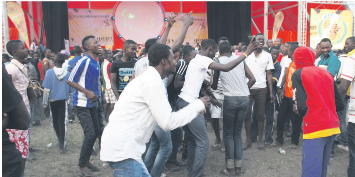
La joie des Brazzavillois lors d'une des éditions du spam