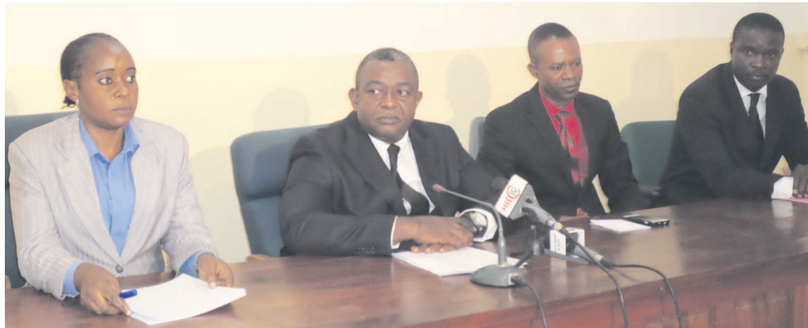
Le présidium des travaux

Selon les participants à cette rencontre qui s'est déroulée au Centre d'informations des Nations unies, le dialogue permettrait de trouver un compromis national sur les problématiques liées à la réforme constitutionnelle et institutionnelle ainsi qu'à la gouvernance électorale et démocratique. « La société civile a relevé qu'en cette phase