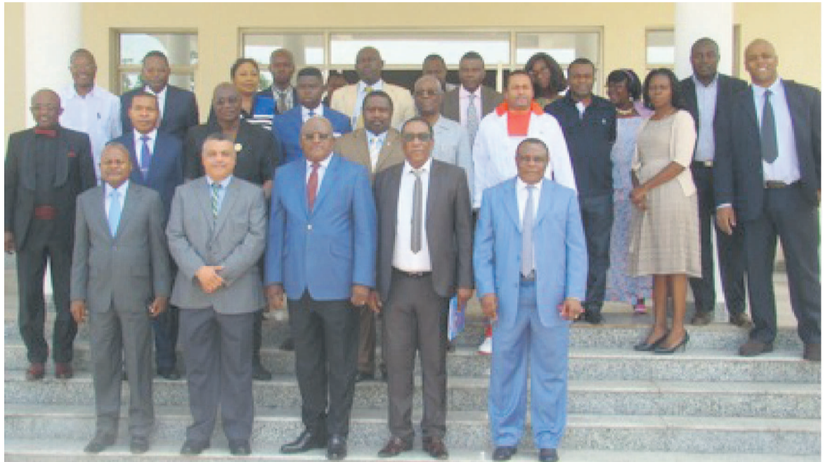
Les membres de l'ORAD, de l'AMA, du COJA en compagnie du ministre des Sports

de l'ORAD se poursuivent à Brazzaville. C'est le 22 avril que les conclusions desdits travaux