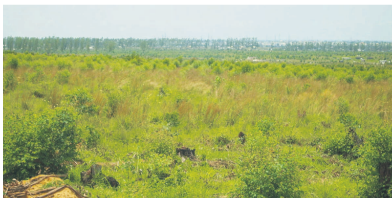
Vue d'un relief avec une petite forêt plantée et une autre poussant naturellement

En rapport avec cette journée, le secrétaire général de l'Organisation des Nations unies, Ban Ki-moon, demandait à la population mondiale en 2014 de prendre soin de notre terre nourricière : « Prenons soin de notre terre nourricière, afin qu'elle puisse continuer à prendre soin de nous, comme elle l'a fait pendant des millénaires ». Et de son côté, en mars 2005, l'Unesco publiait la première évaluation des écosystèmes pour le millénaire, un rapport accablant sur l'impact de l'homme sur la planète. Car il