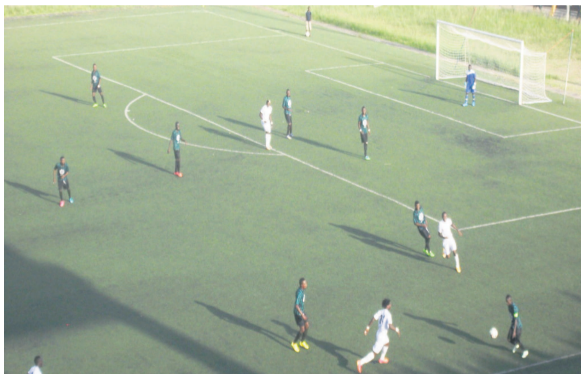
Un extrait du match Diabes noirs vêtus en blancs et VC Club Mokanda en vert noir «adiac»

Battu 0 - 2 le 18 avril au Complexe sportif de Pointe-Noire par Diable noirs, V.Club Mokanda régresse d'une marche au classement provisoire du championnat national de football d'élite alors que son tombeur en a gagné trois