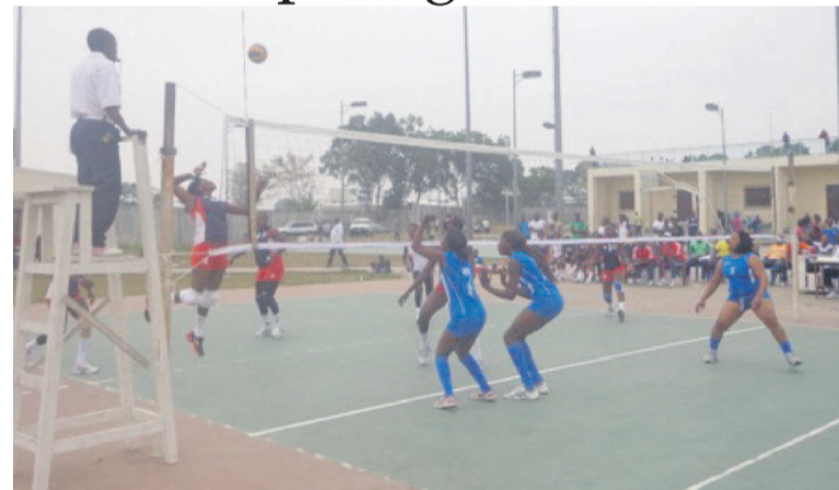
Une rencontre DGSP-Kinda Odzoho

Les dames de la DGSP, comme la saison passée, ne se sont pas laissées faire. Championnes en titre, elles ont conservé leur couronne en terminant sur la première marche du podium juste devant leurs rivales de Kinda Odzoho. En séniors hommes, les militaires de l'Inter club ont fait la loi. Les hommes de la DGSP se sont essouffés à la deuxième place. Les juniors de la DGSP ont vengé leurs aînés en occupant la tête du classement devant le Club Volleyball Espoir alors que chez les cadets, c'est le club Espoir qui s'est imposé. La DGSP2 s'est contentée de la deuxième place. Les minimes de cette même équipe ont dominé leurs adversaires et