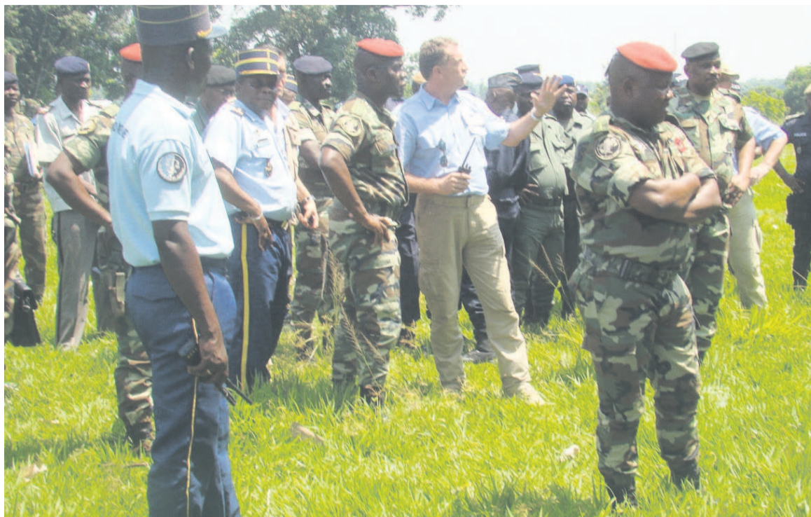
Le chef d'état-major en train de suivre un exercice de simulation

La préparation opérationnelle s'appuie sur le principe de réalité et se traduit par des choix clairs : tester individuellement le candidat à un certain nombre d'exercices comme le tir et la capacité à s'exprimer. La mise en condition et l'effort sont portés là où cela est