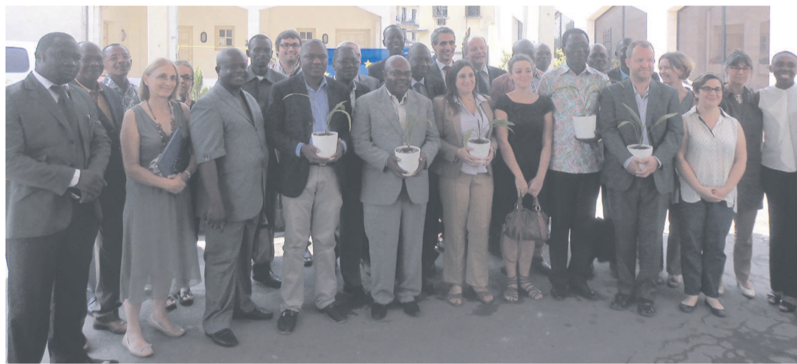
La photo de famille

Enfin, le projet sur la protection et l'étude des tortues marines et leur habitat au Congo porté par la RENATURA sera financé à hauteur de 37 681 500 FCFA pour une durée de trois ans. Il a pour objectif entre autres, de contribuer à la réduction de la perte de la biodiversité ; au renforcement du partenariat autorité locales/société civile ; à l'amélioration des connaissances scientifiques sur le milieu marin et côtier, etc.