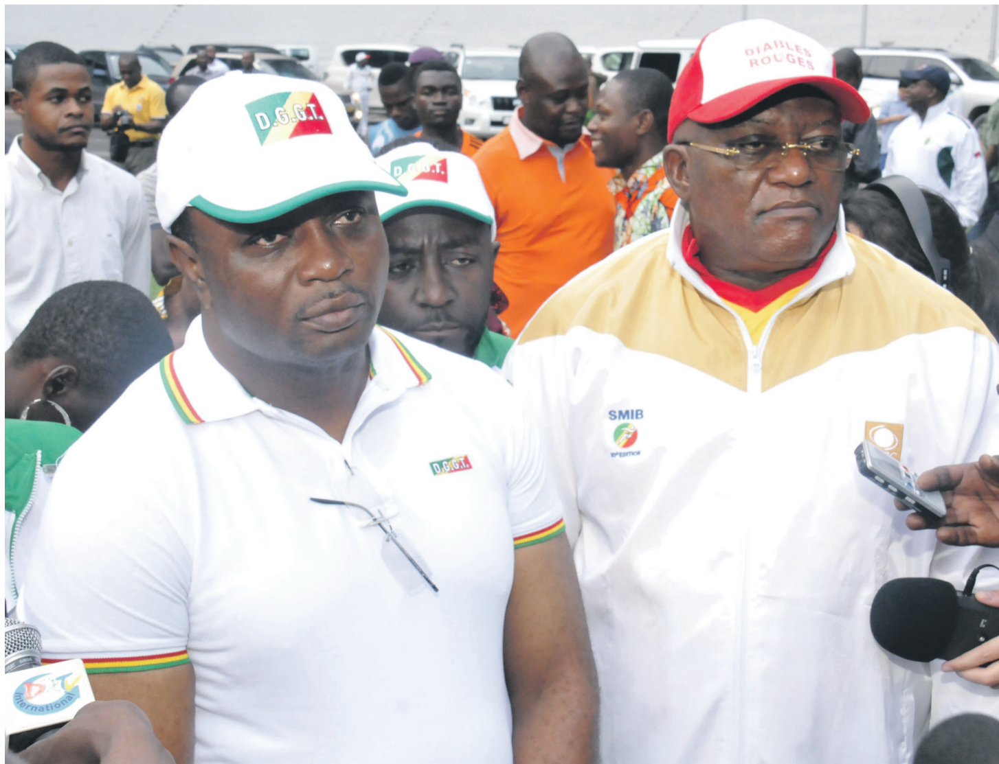
Le ministre d'État ghanéen Elvis Afriyé Ankra et le ministre congolais des Sports, Alfred Opimbat

sièges est également en cours. Dans la cour du complexe, l'hôtel, l'héliport, le bâtiment administratif ainsi que la cabine de presse sont aussi achevés du point de vue technique. Actuellement, le travail des opérateurs chinois se focalise sur l'aménagement des aires de stationnement malgré le retard à cause de huit parcelles encore non indemnisées.