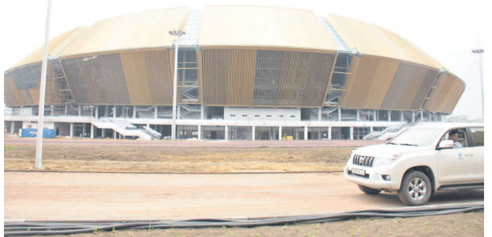
Le complexe sportif de Kintélé, qui abritera le cinquantenaire des J.A., inspire déjà confiance

Au niveau du palais des sports, plus de 16 mille places, et du complexe nautique qui compte plus de 10 mille places, les travaux sont presque achevés et l'installation des