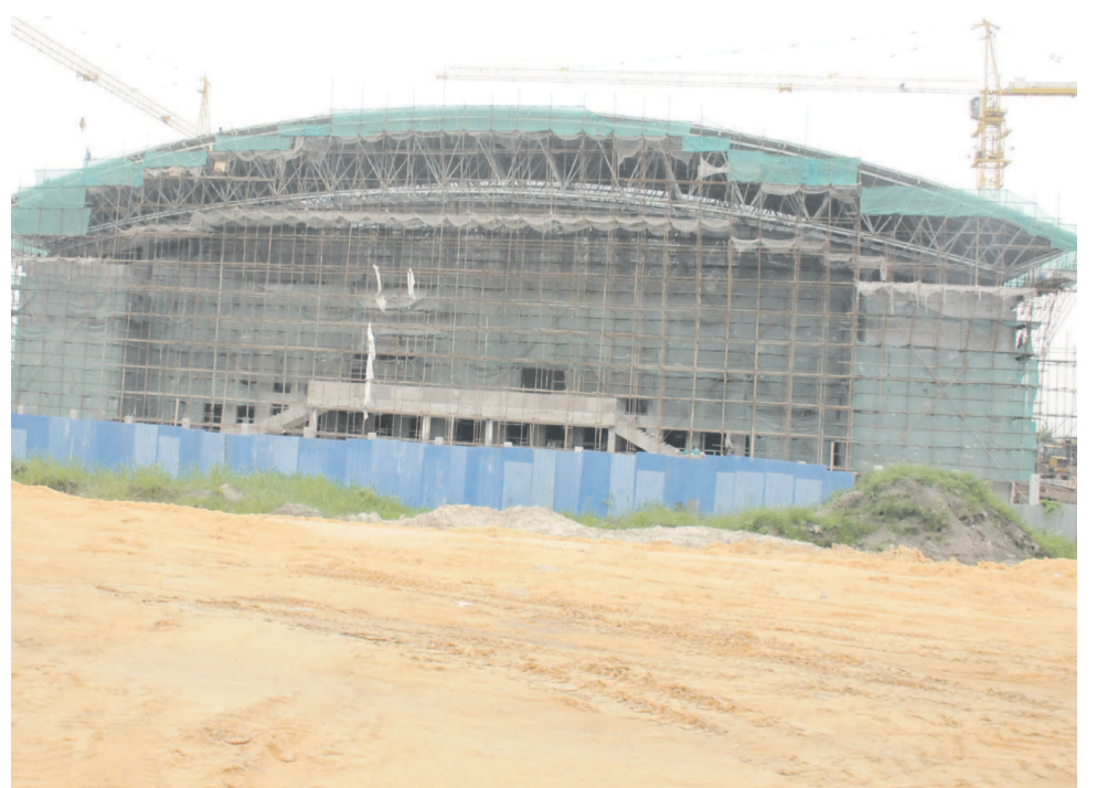
Les travaux du gymnase de Keba na virage avancent à grands pas