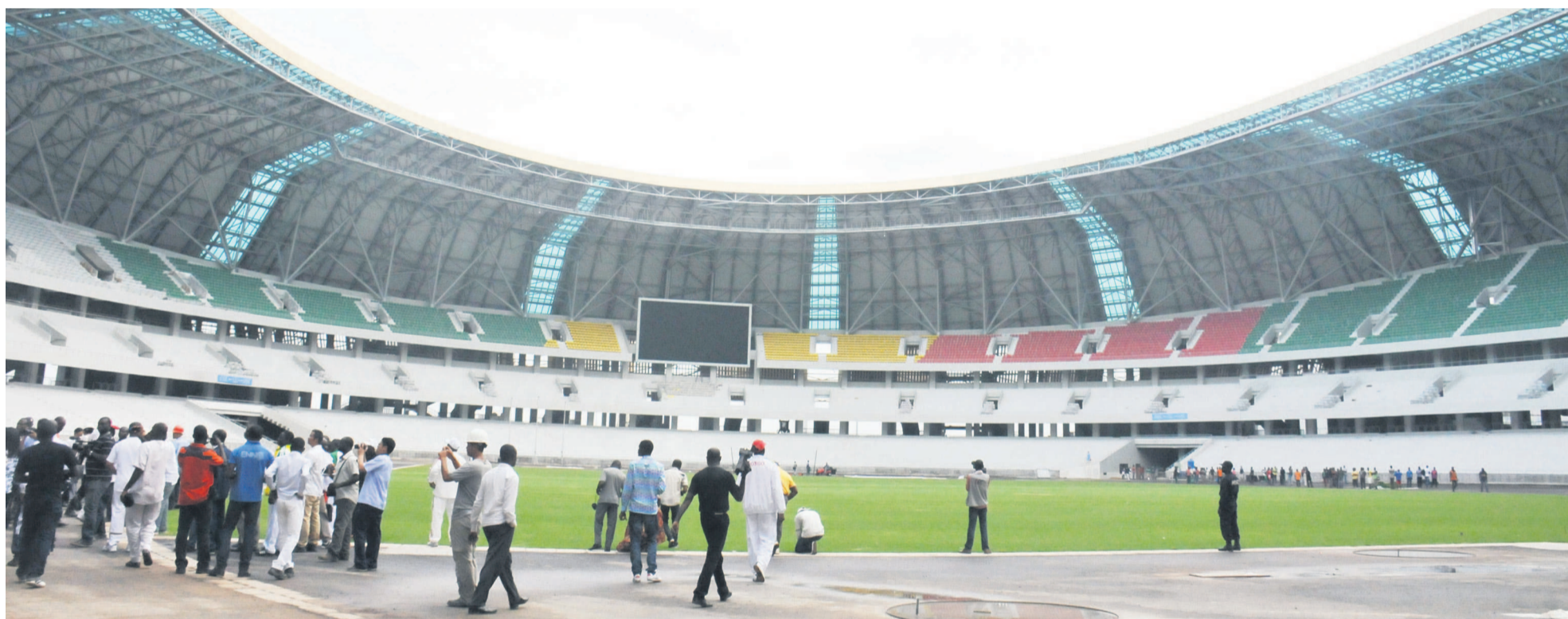
Le complexe sportif de Kintélé est fin prêt