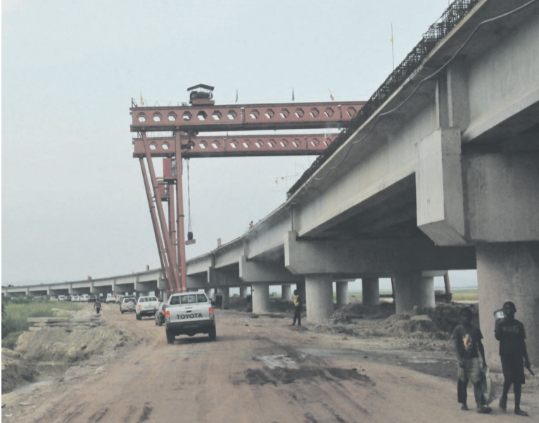
Le viaduc qui conduit au complexe sportif