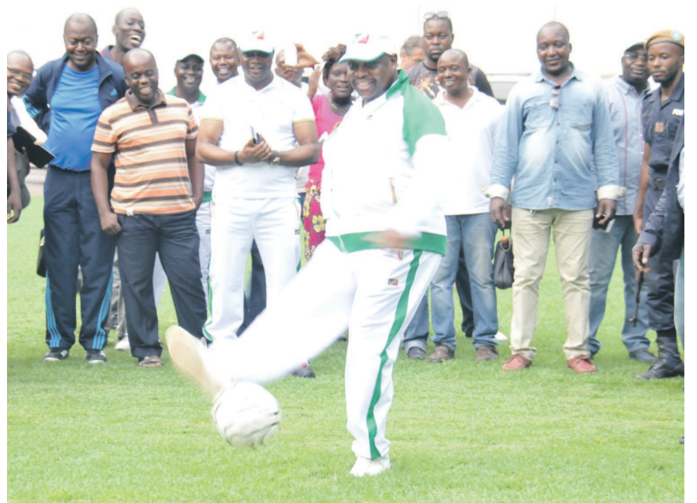
...Le ministre Jean Jacques Bouya...