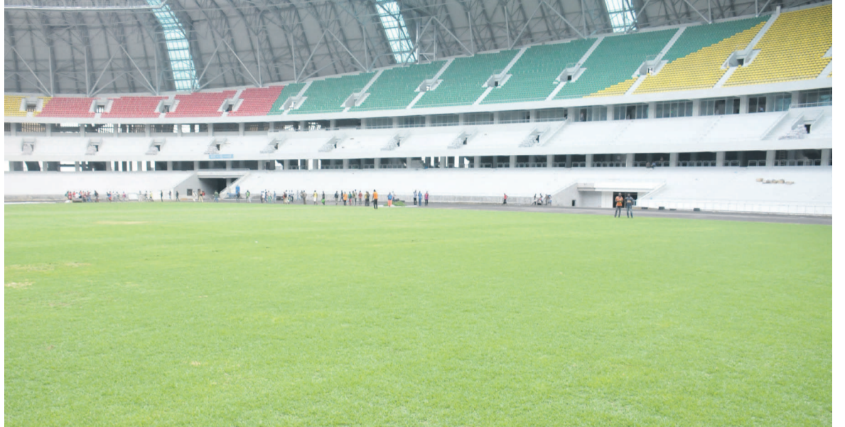
La pelouse du stade obéit aux normes