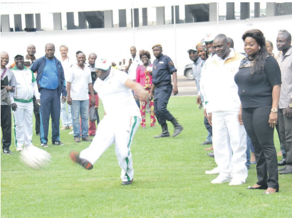
Le ministre d'État ghanéen...