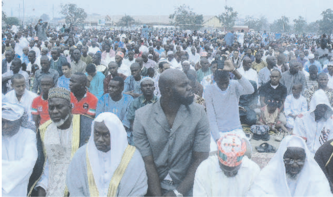
Séance de prière des frères musulmans