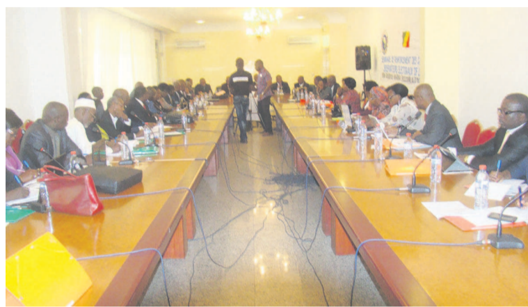
Les participants au séminaire

« La communauté a d'autre part intérêt à faire jouer son droit d'appréhension en formant elle-même ses