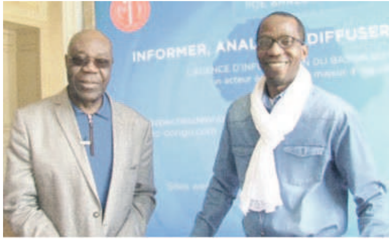
Manu Dibango lors de la Journée des diasporas africaines à Bordeaux en partenariat avec les Dépêches de Brazzaville.

La capitale girondine a rassemblé les diasporas africaines, le samedi 25 avril sur le thème de l'innovation. Les Dépêches de Brazzaville étaient partenaires de cette manifestation qui a connu un grand succès. C'est dans une salle comble de la mairie de Bordeaux qu'Alain Juppé, maire de la ville, au côté de Manu Dibango, a inauguré samedi matin la troisième édition de la Journée des diasporas africaines dans la salle municipale de la capitale girondine.