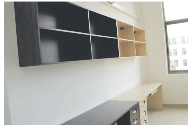
Le site de l'université de Kintélé, avec ses chambres déjà équipées, accueillera aussi des athlètes