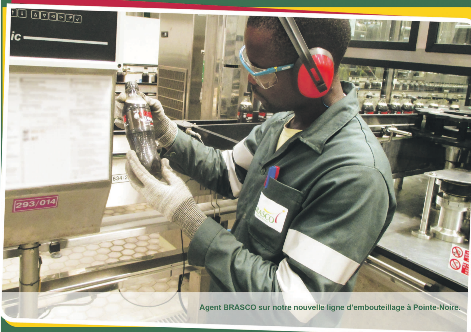
Agent BRASCO sur notre nouvelle ligne d'emouteillage à Pointe-Noire.

Le 28 avril, le monde professionnel célèbre la journée mondiale de la santé et de la sécurité au travail. 24 heures pour mettre en lumière les mesures prises pour la création d'un environnement professionnel sain et sécurisé.