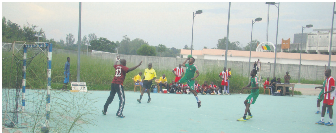
Une des rencontres de l'Inter club