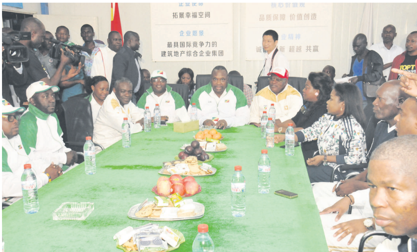
Séance de travail entre les ministres congolais et le ministre d'État ghanéen