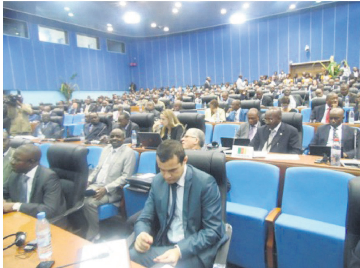
Les experts

« Il s'agit d'un enjeu de développement humain au regard de l'interaction entre l'Homme et son environnement (...) le nombre de touristes chutent dans les pays qui ont désespérément besoin de revenus et les économies locales sont profondément affectées. Force est d'admettre que les crimes qui affectent la faune et la forêt équivalent à des actes de pillage de biens publics », a souligné le coordonnateur résident du système des Nations unies au Congo. Insistant sur le fait, le ministre de l'Économie forestière et du Développement durable estime que ce trafic n'affecte pas qu'uniquement les espèces et les écosystèmes mais aussi les moyens de subsistance des populations. Ainsi, la conférence internationale est