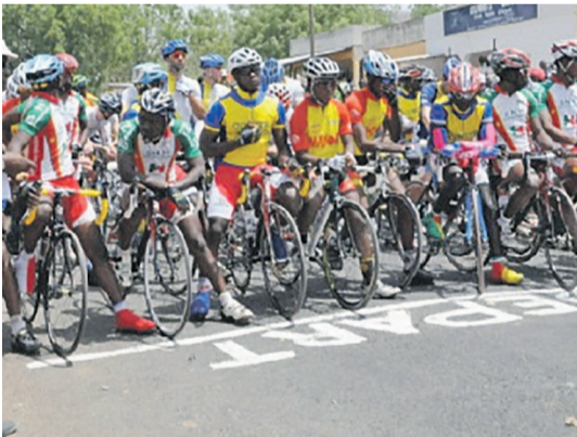
Des cyclistes au départ d'une course

Depuis le lancement par le Premier ministre, Augustin Matata Ponyo, du Tour cycliste inter-