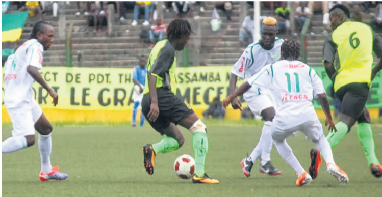
Vue d'un match entre V.Club contre DCMP au stade Tata-Raphaël

Le manque d'ambiance, le 25 avril, dans les tribunes du stade Tata-Raphaël, n'a pas empêché que la rencontre soit totale sur l'aire de jeu entre les deux clubs rivaux de Kinshasa, le Daring Club Motema Pembe (DCMP) et l'AS V.Club. Le premier recevait le deuxième en match remis de la quatrième journée de play-off de la 20e édition du championnat national de football