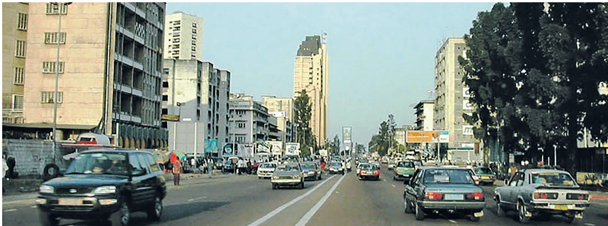
Le centre-ville de Kinshasa

Une certaine opinion est d'avis qu'on ne peut pas organiser toutes les élections prévues entre 2015 et 2016 concomitamment avec l'installation de nouvelles vingt-six provinces, sans budget conséquent ni loi de répar-