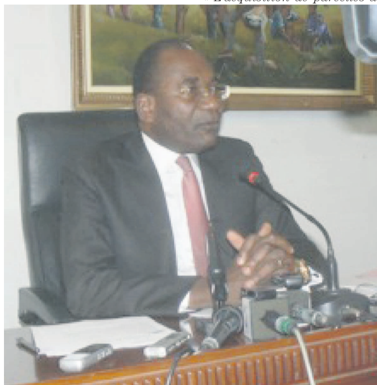
Le ministre Pierre Mabiala

Dans ce dispositif, le livret de contrôle de la gestion foncière