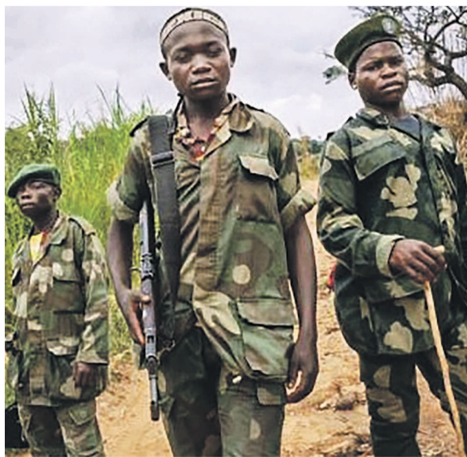
Quelques enfants soldats recrutés par des groupes armés