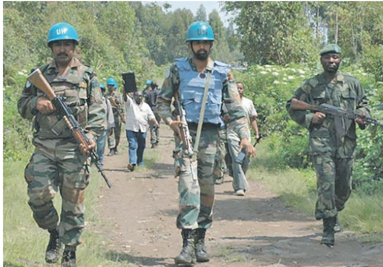
Une patrouille mixte Fardc-Monusco dans l'est de la RDC

Dans une déclaration du 7 mai, le porte-parole de l'Union européenne a réagi pour l'attaque mortelle contre les troupes de la Monusco qui a eu lieu le 6 mai. Soulignant qu'il s'agissait là de la deuxième attaque contre les soldats de la paix en quelques jours, le porte-parole a noté que cet acte est un défi au mandat de la Monusco, tel que spécifié dans la résolution 2211 du Conseil de sécurité des Nations unies. « La mission des Nations unies agit au nom de la communauté internationale en vue de protéger les civils et de contribuer à la neutralisation des groupes armés à l'est de la RDC. Toute attaque contre la Monusco est une