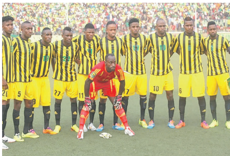
V.Club victorieux du FC MK

Le succès pas du tout surprenant de V.Club sur le FC MK, V.Club a le mérite d'exercer la pression sur le TP Mazembe qui a déjà achevé la phase aller de play-off de la Division 1.