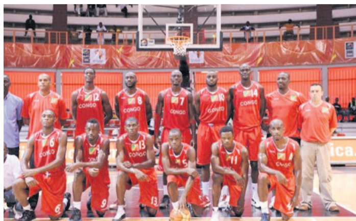
Présents en 2013, les Diables rouges n'iront pas en Tunisie, pays hôte de l'Afrobasket 2015

Les Diables rouges n'auront pas de 19 au 30 août.