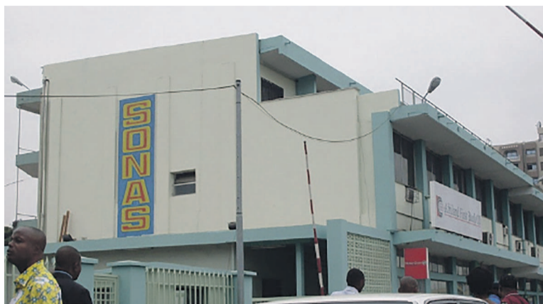
La direction générale de la Sonas

La source a également souligné que la semaine dernière, ce groupe de retraités a obtenu du tribunal de travail de Kinshasa la saisie d'un compte de la Sonas. Ce qui aurait conduit les deux parties à signer un acte qui lève la