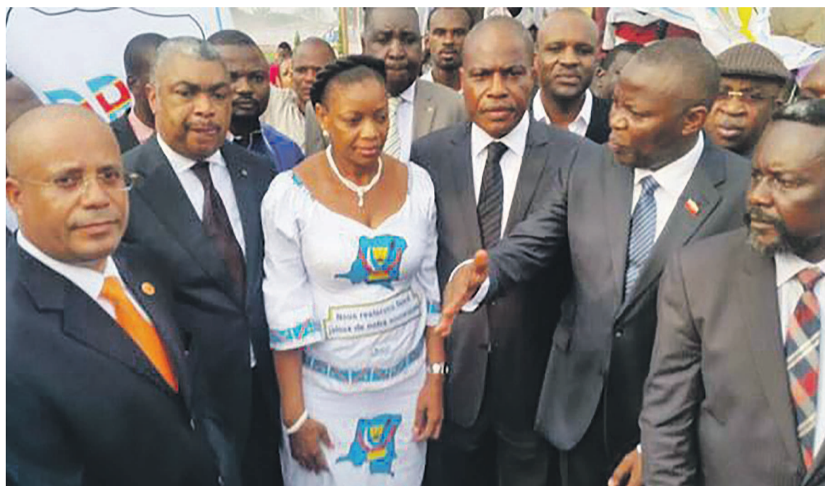
Quelques leaders de l'opposition congolaise

pays vers une nouvelle transition politique sur fond de redistribution des cartes. L'opposition fait, par ailleurs, assortir sa participation à ce forum de quelques préalables au nombre desquels l'enrôlement des nouveaux majeurs, le recadrage du