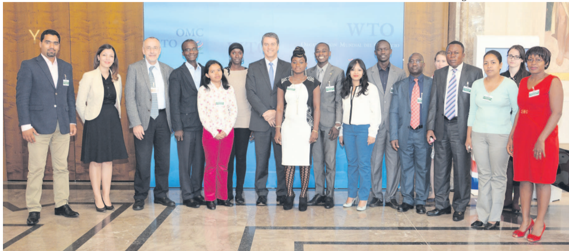
Photo de famille du DG de l'OMC et les journalistes africains francophones

Ainsi, une initiative dite Aide pour le commerce est mise en place par cette organisation afin d'aider les pays en développement et les pays les moins avancés (PMA) à participer effectivement au système commercial mondial. Du 30 juin au 2 juillet prochain, des experts internationaux procéderont à un examen global de cette initiative. Selon Roberto Azevêdo, l'un des grands défis du développement du commerce en Afrique demeure le manque de financement. « On estime que les besoins en financement du commerce qui ne sont pas satisfaits atteignent 120 milliards de dollars en Afrique. Ce problème est sérieux, et il nous faudra y remédier en travaillant de concert avec une série de par-