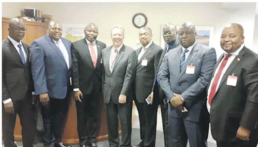
Des opposants congolais lors de leur dernière visite aux USA

En s'alliant les principales forces politiques et sociales du pays à travers un échange inclusif, il est clair qu'une nouvelle donne politique sera mise en branle, rendant ainsi caduque tout ce qui a été fait. D'où les appréhensions que suscite ce dialogue dans le chef d'une poignée d'opposants qui redoutent tout basculement vers une transition politique sur fond de redistribution des cartes. Dans le camp de l'opposition, une vive controverse s'est installée sur l'opportunité d'adhérer ou non à cette initiative. Si le principe est acté, les termes de référence (date, format, ordre du jour, nombre des participants, exigence de parité, quitus de la communauté internationale, etc.) posent encore