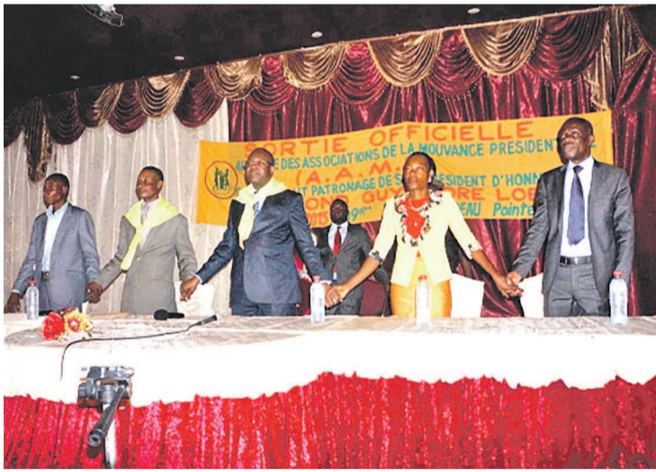
Tribune officielle de la cérémonie

En effet la déclaration de cette alliance, exhorte l'ensemble de la classe politique congolaise à proscrire l'hésitation politique car la vertu cardinale consiste à doter le Congo des nouvelles institutions dont la participation de chaque congolais y est conviée. Cette déclaration demande aussi au président de la République, Denis Sassou N'Guesso à re-