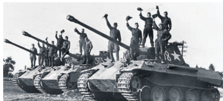
Les photos de la seconde Guerre Mondiale