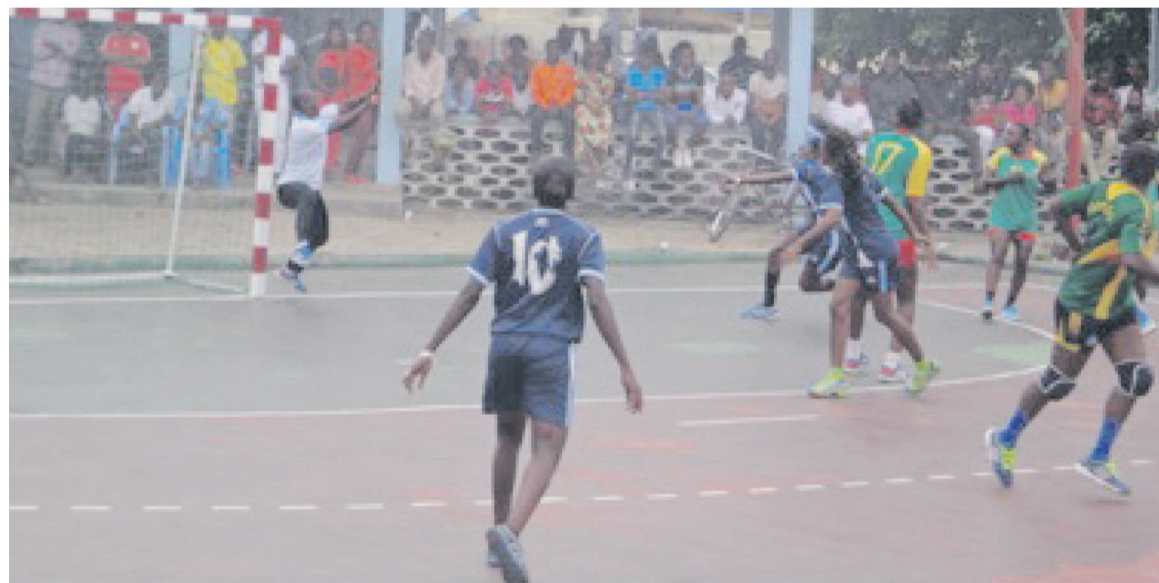
Le match très engagé et très disputé entre l'Etoile du Congo et Abo sport

quel les forces s'annulent. Les deux équipes ont fait jeu égal 37 partout. Au delà du résultat, l'entraîneur d'Abo sport a relevé les faiblesses de son équipe. « Nous devons corriger la finition avant le voyage. On ne peut pas se retrouver devant la gardienne et de ne pas marquer.