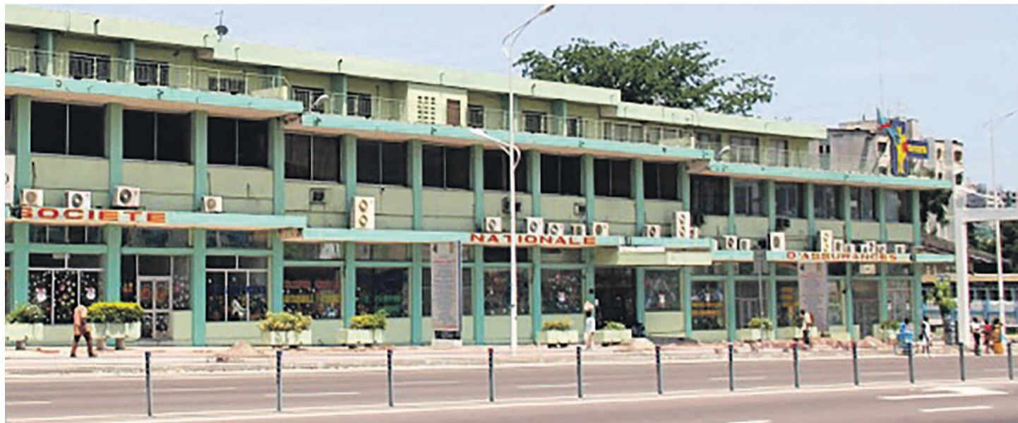
Le siège de la Sonas sur le boulevard du 30 juin