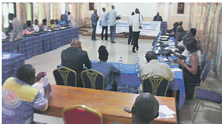
Une vue des participants à la formation

Cette session de formation qui se clôturera le 15 mai à Kinshasa a pour objectif d'outiller les participants, acteurs de la société civile, des connaissances nécessaires sur l'éducation civique et électorale afin de leur permettre de mieux sensibiliser la population en la matière, de mieux former et informer la population sur le processus électoral, pour son appropriation effective. Parmi les exposés arrêtés pour les cinq jours des travaux, il y a notamment : « État des lieux du processus électoral en RDC », « Quid de la sensibilisation à l'éducation civique et électorale », « Quid de la démocratie », « Considérations générales sur l'organisation des élections démocratiques », « Monitoring de différentes phases du processus électoral », « Quid de l'État de droit et de la bonne gouvernance », « Monitoring des violations des droits humains liés au processus électoral en RDC », etc. Alors que dans les travaux en groupes, les participants établiront notamment sur les stratégies pour un monitoring efficace de la situation des droits humains pendant les différentes phases du processus électoral, etc.