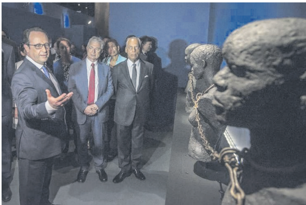
François Hollande visite l'exposition permanente du Mémorial ACTe lors de l'inauguration de ce plus grand centre du monde dédié à l'histoire de la traite, le 10 mai 2015 à Pointe-à-Pitre (Martinique)

Sur le cahier d'or, François Hollande a écrit : « c'est avec émotion que j'ai inauguré le mémorial ACTe. Les oeuvres exposées, les faits restitués, les personnages rappelés, et surtout le souvenir des femmes, hommes, enfants victimes de la traite, nous font obligation de ne rien oublier et de lutter encore aujourd'hui pour la dignité humaine ». Pour Mi-