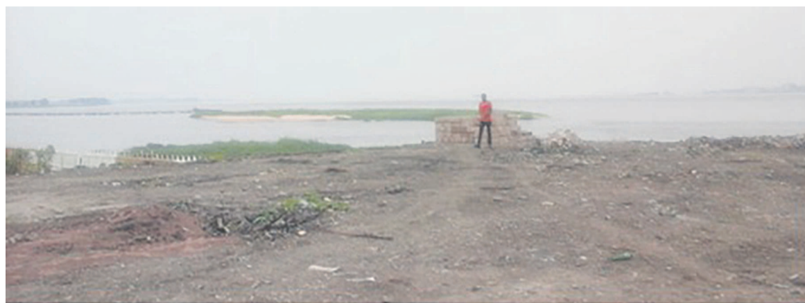
L'hôtel vue sur le fleuve

Le développement du tourisme requiert des établissements d'hébergement de qualité pour mieux appliquer la tryptique : déplacement, réceptif et motif de séjour. Le gouvernement consent des efforts mais Brazzaville reste confrontée à un