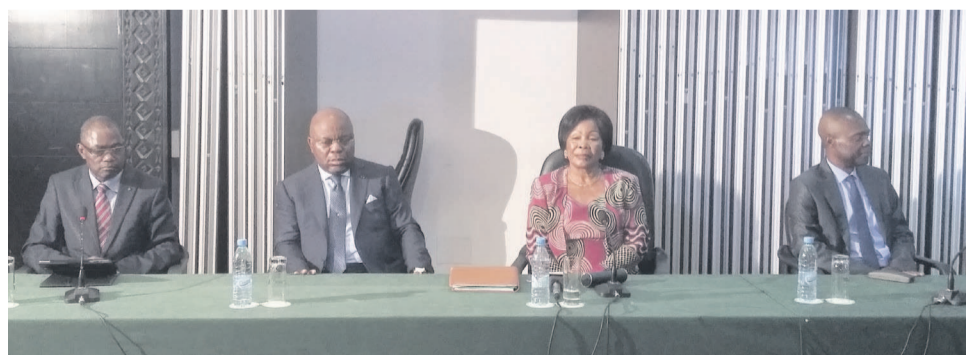
Le présidium des travaux

Le recensement lancé le 20 mai à Brazzaville fait suite à celui réalisé en 2012, jugé incomplet. Il s'agit désormais de disposer d'une base de données fiables sur ce secteur.