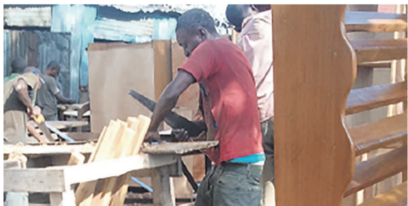
Un atelier de menuiserie à Kinshasa

L'initiative vise l'auto-prise en charge des jeunes sourds à Kinshasa.