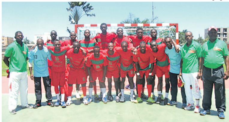
AS Cheminots messieurs «adiac»

Les deux équipes de Cheminots affûtent leurs armes depuis le 27 avril pour bien affronter la compétition que la ville de Pointe-Noire abritera du 23 juin au 2 juillet. « Nous avons fait deux semaines et demi de préparation physique générale où nous avons travaillé à la côte mais, les ressources humaines ont fait défaut car certains joueurs étaient encore en