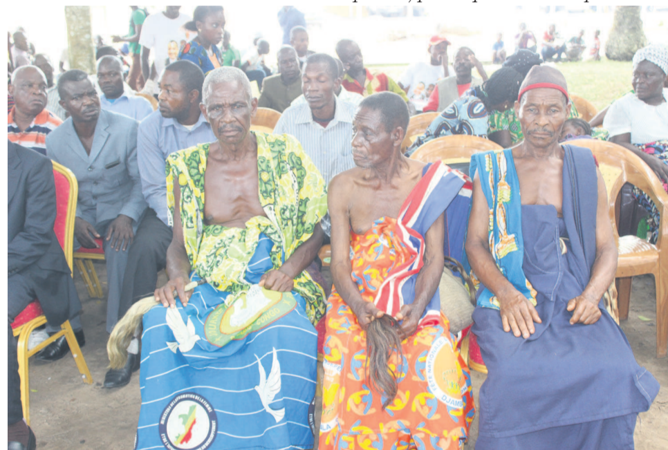
Les sages du district d'Ongogni

morphoser. Nous lui sommes infiniment reconnaissants, et prêts à le soutenir jusqu'à la fin. »