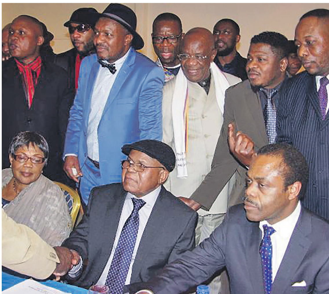
Etienne Tshisekedi entouré par quelques cadres de son parti

Pour l'UDPS qui reste dans l'esprit de l'Accord de paix d'Addis-Abeba prônant une médiation internationale, il ne sera nullement question de contourner les exigences constitutionnelles régissant les échéances électorales ni favoriser un quelconque glissement. Page 12