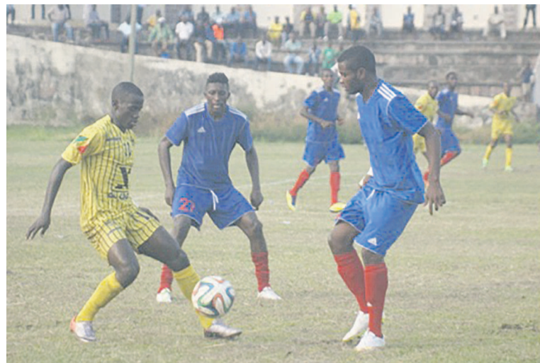
Un match du championnat national opposant les Diables noirs au FC Kondzo

Le 17 juin à 14 h au stade Eboué, Tongo FC jouera face à l'Interclub avant le match Patronage Sainte-Anne- Diables noirs prévu à 16h. Au Complexe sportif de Pointe-Noire à 14 h, l'ASP accordera son hospitalité au FC Kondzo pendant qu'à 16 h, Munisport défiera La Mancha. Le 18 juin au stade Eboué à 14 h, la JST recevra l'Etoile du Congo puis à 16 h, le Cara affrontera l'AS Cheminots. Au Complexe sportif de Pointe-Noire, Nico-Nicoyé va se mesurer avec le FC