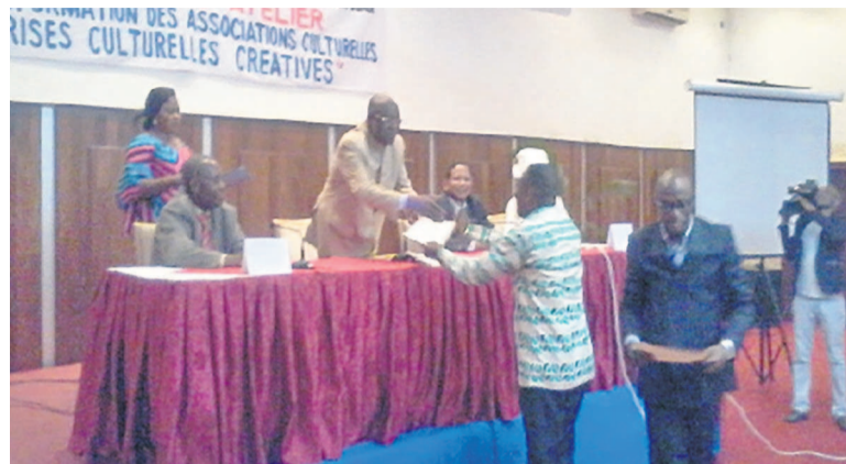
Remise de brevets aux participants

Dans les grandes lignes, du point de vue des textes, il a été demandé, entre autres, l'accélération de l'élaboration de la politique culturelle, la ratification de la charte de la renaissance culturelle africaine et la libéralisation des droits selon les secteurs. Et voulant s'assurer de la continuité du processus déclenché avec les travaux, les participants ont tenu à l'organisation, dans un délai raisonnable, d'un second atelier. Elle est envisagée comme une