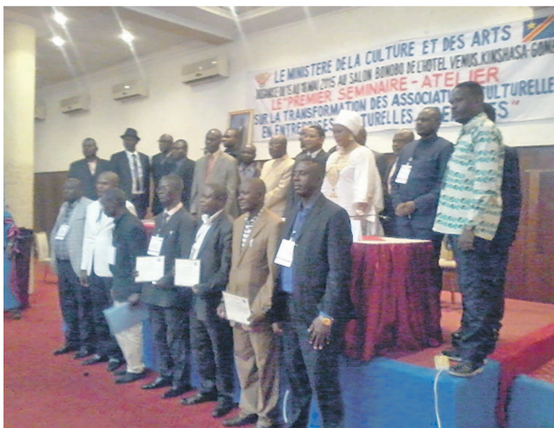
Photo de famille des participants