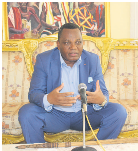
Jean Claude Gakosso s'adressant à ses mandants

C'est la réaction d'un sage du district d'Ongogni en réponse à l'exposé de Jean Claude Gakosso, député de la circonscription. « Ongogni est une terre de sagesse. Nous préférons manger des fruits mûrs qui n'agacent pas les dents. Le président Denis Sassou N'Guesso est ce fruit mûr, parce qu'il est un homme d'expérience que nous connaissons bien et qui sait supporter nos caprices. Et c'est sous sa houlette que nous avons vu Ongogni se méta-