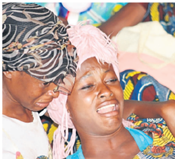
Un extrait de Ngando par la Cie La Seringu'Arts à Kipushi (Katanga) en 2014

La troupe du Katanga est à l'affiche du mercredi 20 mai au vendredi 22 mai au centre culturel belge avec les pièces Œil du cyclone, De la chaire au trône et Ngando.