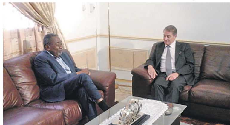
Les deux personnalités

Cette convention est aujourd'hui signée par 120 pays qui sont partie contractante à cette convention. Ils restent souverains pour la mise