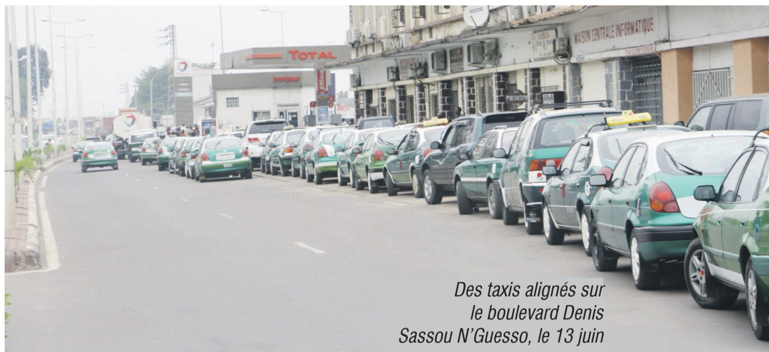
Des taxis alignés sur le boulevard Denis Sassou N'Guesso, le 13 juin

Depuis une semaine environ, les Brazzavillois connaissent des pénuries récurrentes de carburants qui rendent ainsi difficile le transport public au point de susciter la surenchère chez les taximen où la course passe parfois du simple au double ou plus encore, selon les distances.