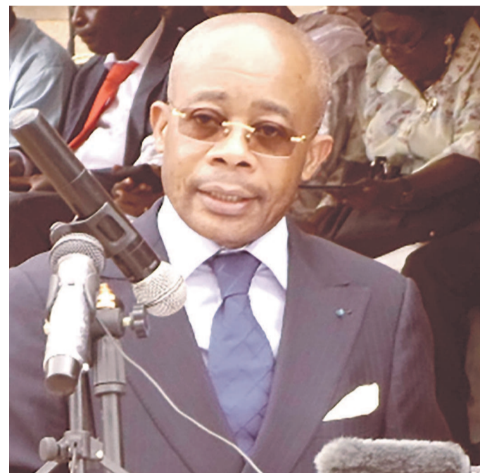
Le ministre Martin Parfait Aimé Coussoud-Mavoungou

Par cette rencontre, l'administration mari-