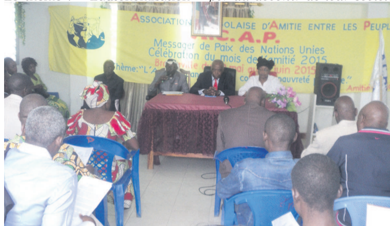
Les échanges entre ACAP et les habitants de Djiri

sur la définition des concepts, les critères d'autonomisation, les enjeux et défis ainsi que les obstacles auxquels sont confrontées les femmes pour leur autonomie. « Promouvoir l'autonomisation des femmes, c'est les encourager à participer au devenir de leur société