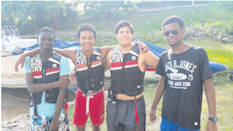
Quelques athlètes du club nautique de Brazzaville