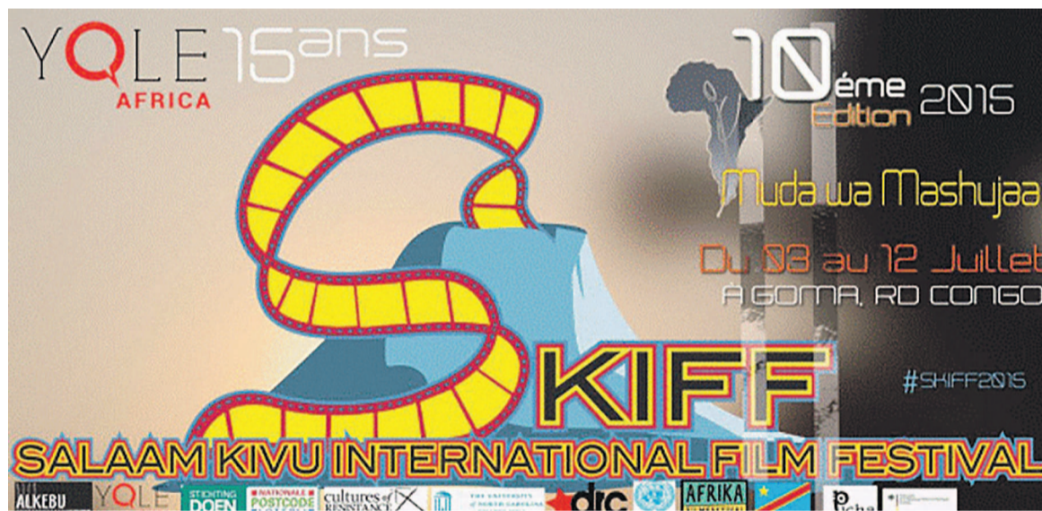
L'affiche de Skiff 2015

Le Skiff n'est plus un événement à présenter à Goma. Il participe au paysage culturel de la contrée se targuant d'être « le plus ancien festival international du film au Congo ». Ainsi, le cinéma sera à l'honneur certes, mais pas que. En effet, la double commémoration prévoit à l'affiche des ateliers intensifs, un forum académique, des projections de films suivies de conférences-débats, des spectacles et des défilés de mode. Avec cette série de rencontres, il y a de quoi créer une sérieuse effervescence dans la ville. Dans