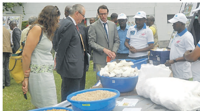
L'ambassadeur Jean-Michel Dumond visitant des stands à la clôture de l'atelier

Pour le chef de la délégation de l'Union européenne (UE) en RDC, des avancées sont réalisées dans le cadre de ces projets financés par l'UE dans le pays mais ces résultats sont fragiles. Ce qui appelle à un effort pour les phases suivantes afin d'affermir ces résultats.