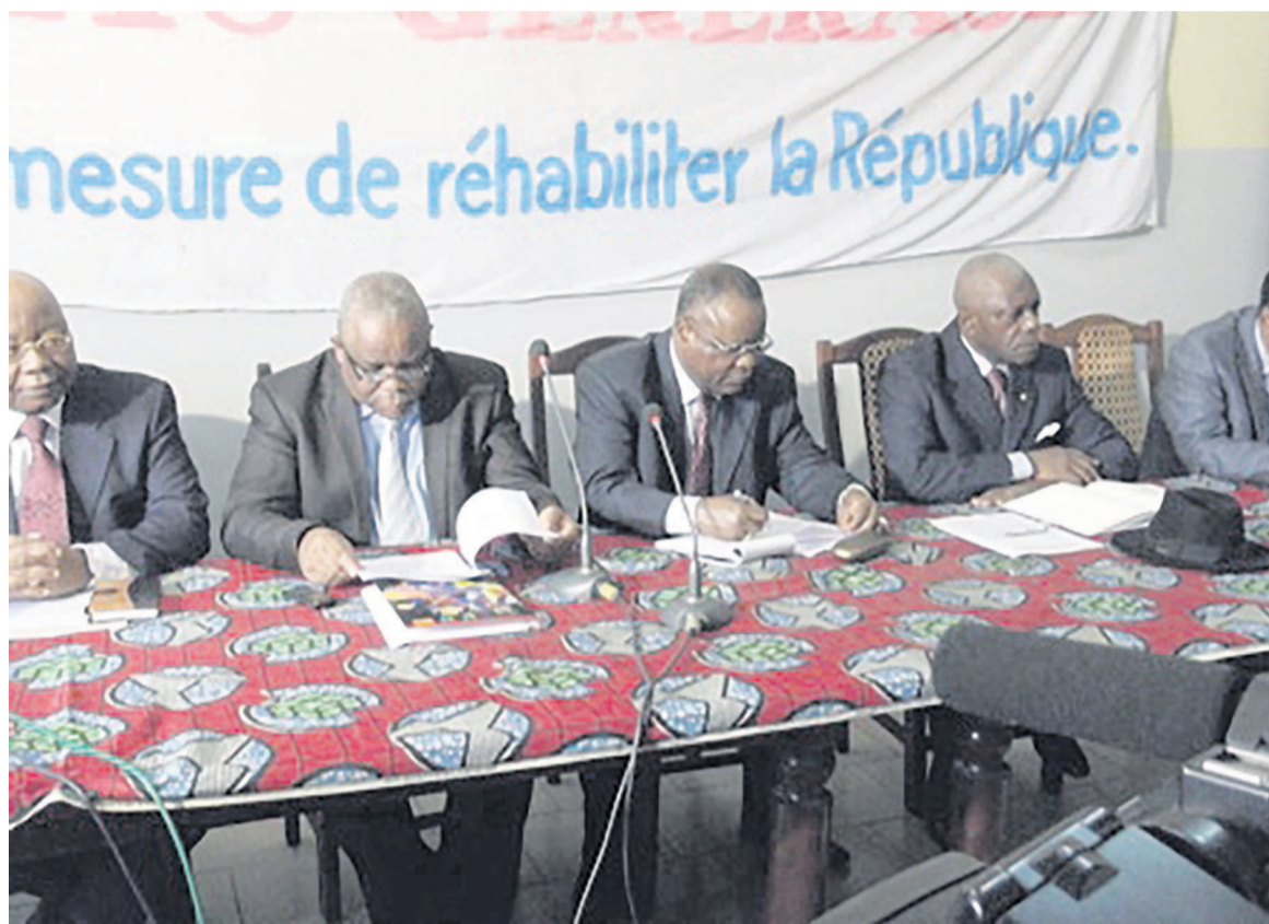
Le collectif de l'opposition congolaise

Devant la presse, ces partis ont promis de recourir, à cette occasion, à tous les moyens légaux pour mobiliser massivement le