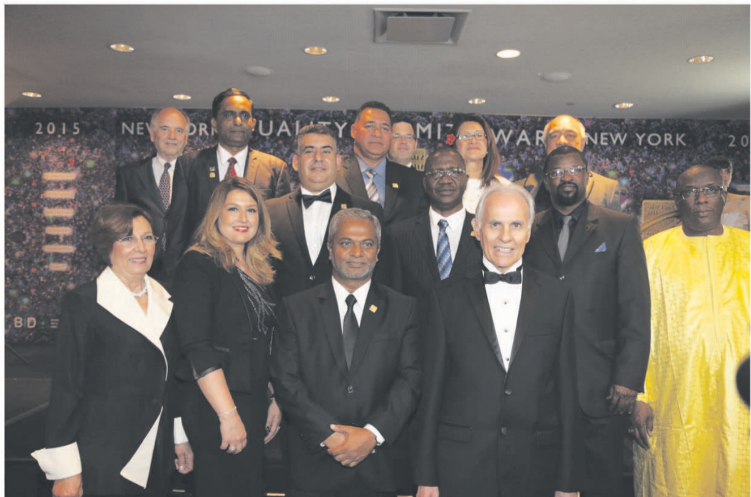
Le Président de BID avec les membres de quelques sociétés lauréates