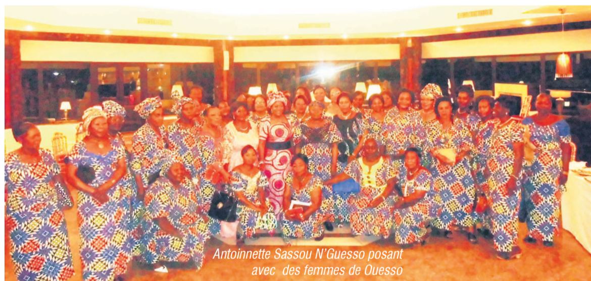
Antoinette Sassou N'Guesso posant avec des femmes de Ouesso

Venues de différentes localités du Congo, des femmes originaires du département de la Sangha se sont entretenues avec Antoinette Sassou N'Guesso en vue d'apporter leur appui à la réussite des festivités de l'indépendance nationale à Ouesso. « Ces dispositions permettront (entre