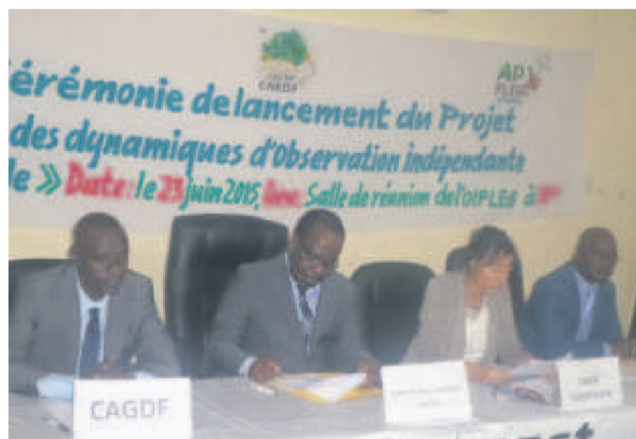
Cérémonie de lancement du projet Renforcement des dynamiques d'observation