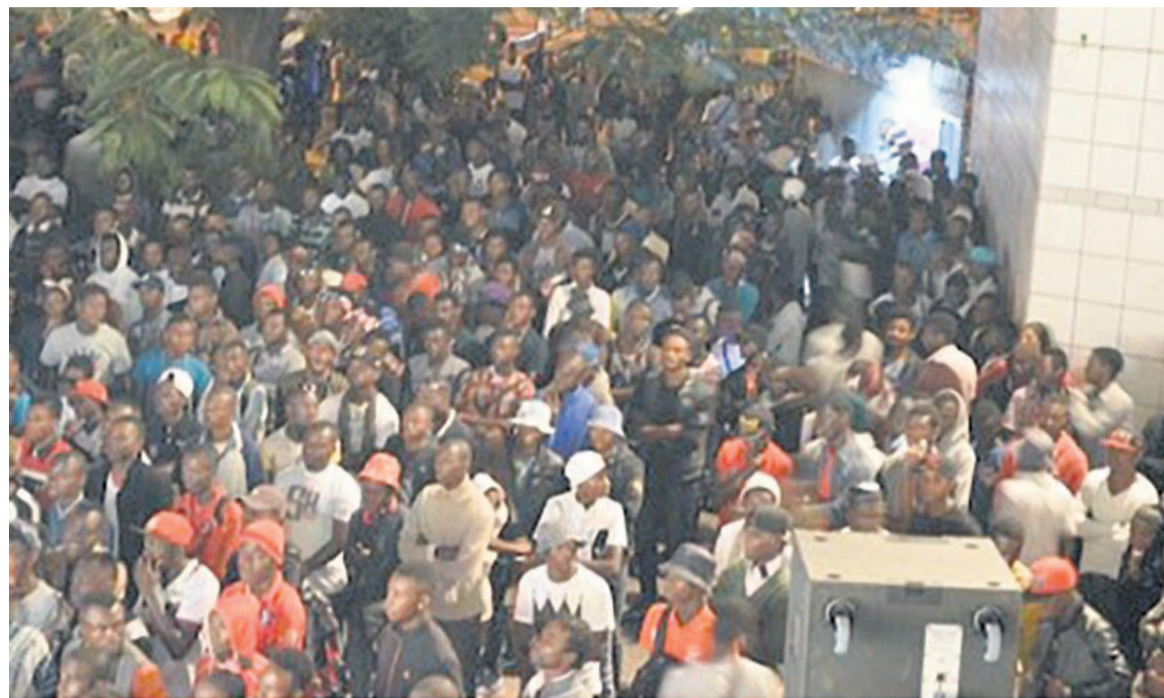
Le show à l'IFC (communion entre les artistes et le public)

L'innovation sans nul doute pendant cette fête de la musique est le concert dit de la « musique sacrée » organisée par la société de télécommunication Azur Congo, à