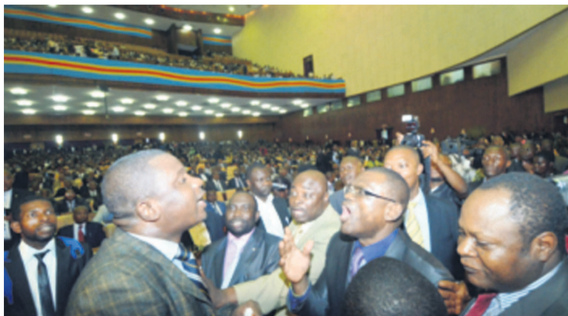
Une séance à l'Assemblée nationale

Ces organisations de la société civile des droits de l'Homme signataires de ce communiqué conjoint ont, par ailleurs, exprimé leur préoccupation face à « l'agitation au sein de l'opinion autour des consultations présidentielles sélectives en vue d'un dialogue national » à tenir plusieurs années après la Conférence nationale souveraine (1992), le Dialogue inter congolais de Sun City (2003) et les Concertations nationales