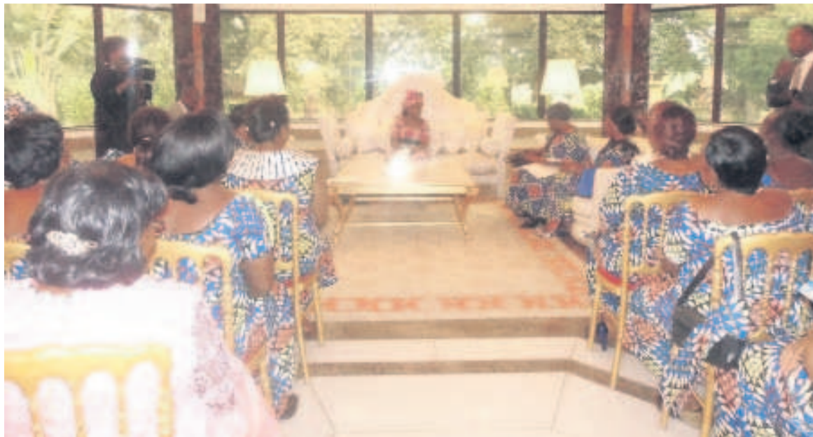
Antoinette Sassou N'Guesso s'entretenant avec les femmes

Leurs doléances n'ont malheureusement pas reçu l'assentiment de l'épouse du chef de l'Etat qui leur a expliqué comment fonctionne le mécanisme d'utilisation des fonds lors de la célébration de la fête de l'indépendance, sur-