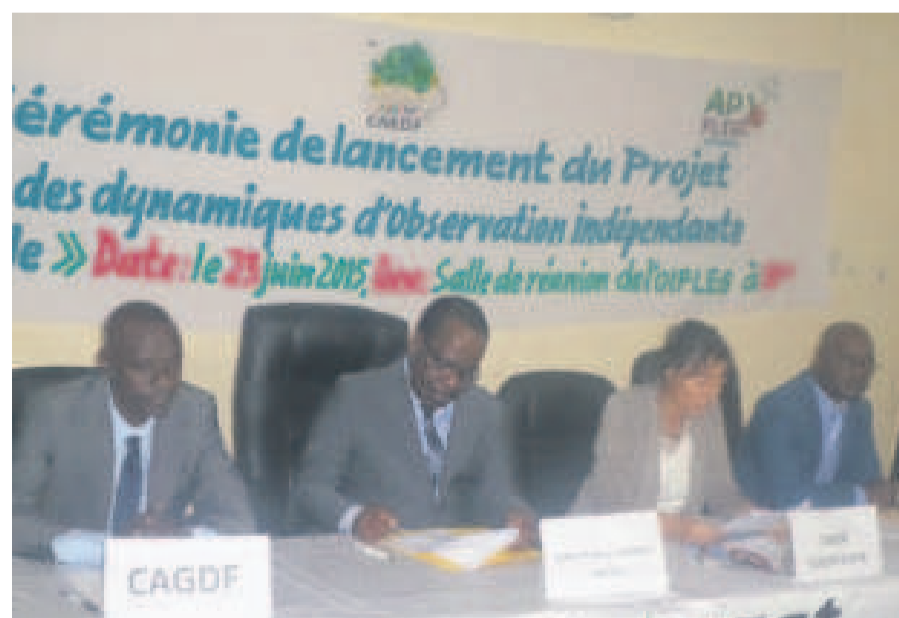
Cérémonie de lancement du projet Renforcement des dynamiques d'observation