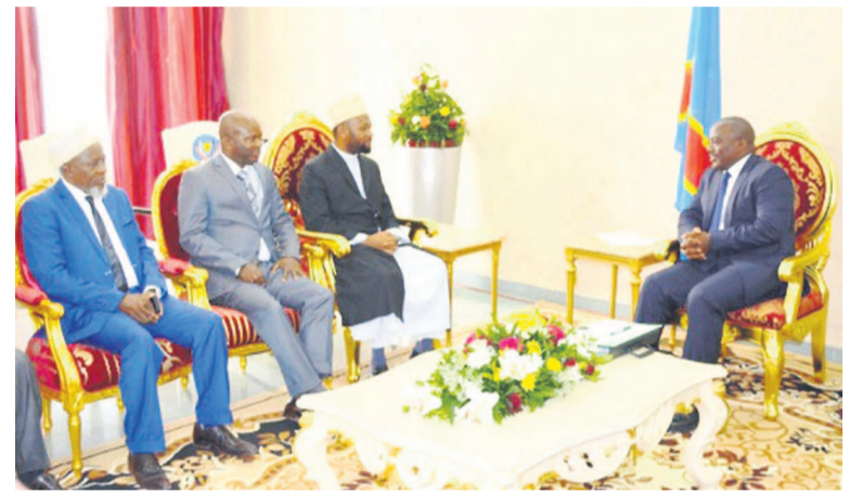
Joseph Kabila en consultation avec des chefs religieux

La libération de tous les militants de la démocratie et des droits l'Homme et des prisonniers politiques d'opinion est également considérée comme l'une des prémisses à la tenue d'un dialogue sincère pouvant donner des résultats attendus. Page 12