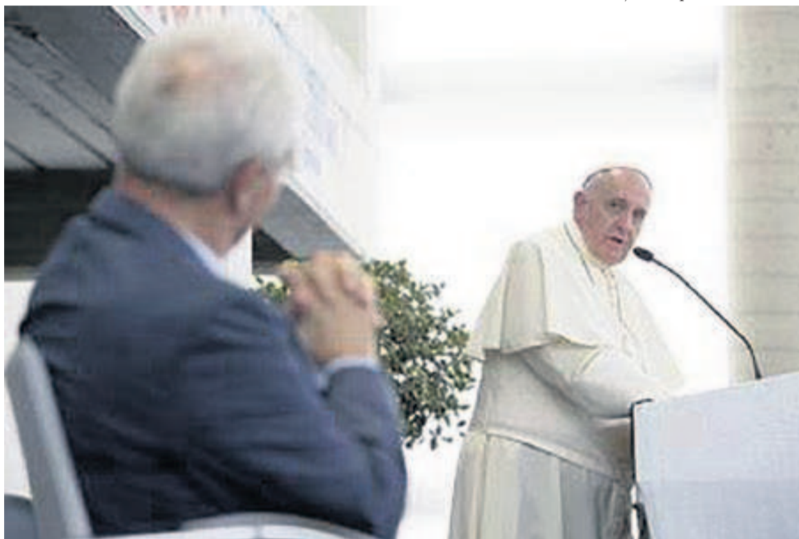
Une rencontre qui s'inscrit dans la logique des rassemblements d'unité initiés par les charismatiques catholiques et évangéliques.

Tout cela se passait au 12 e siècle. Et l'ancien moine Luther, père de la Réforme qui allait donner naissance au protestantisme, n'était pas encore né. L'Église (catholique) veillait à la pureté