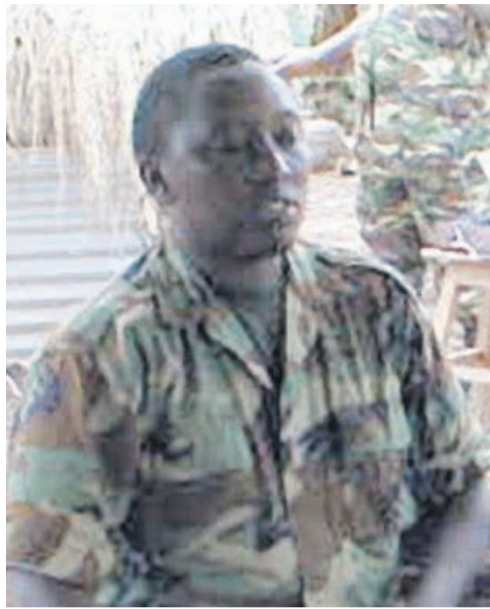
Le général Emmanuel Karenzi Karake

Selon le juge d'instruction, des preuves existent d'opérations menées par les renseignements militaires visant à « éliminer