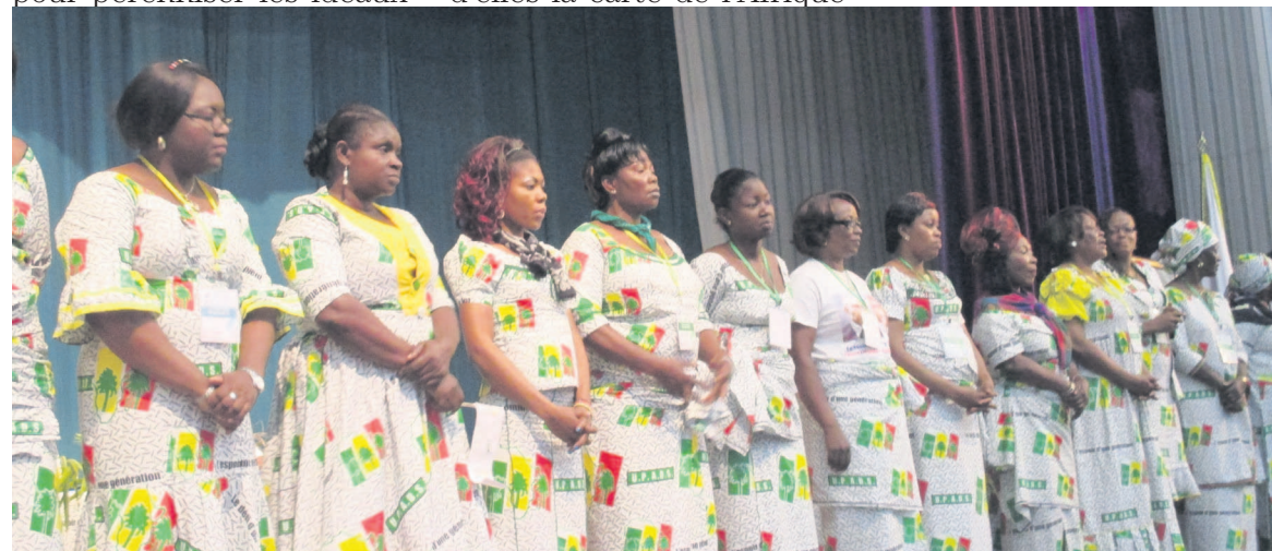
Une vue des congressistes

national des femmes. « Le chemin pour y parvenir était long et difficile. Fini le temps des plaintes. Nous devons à présent passer à l'action et nous affirmer tant dans la vie de notre parti que dans la gestion des affaires publiques. L'heure a sonné pour que les femmes de l'Upads se lèvent afin de défendre la démocratie torturée depuis