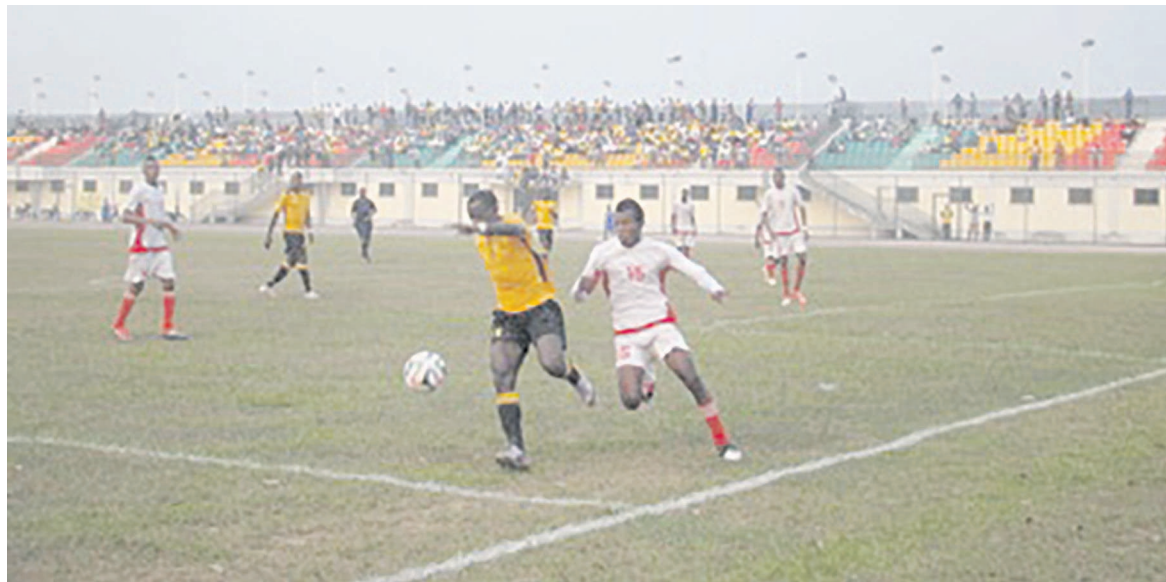
Une contre attaque de Diables noirs face à AS Tsiemba

pas l'équipe adverse de cette oreille. Ce n'est donc pas en claquant les doigts qu'une équipe