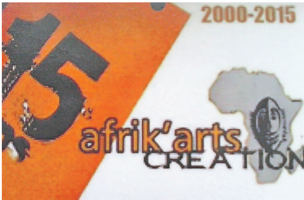
Des affiches marquant cet événement.

La présentation, par Afrik'arts Création de son nouveau spectacle « Lemba ma terre » a été parmi les moments forts de