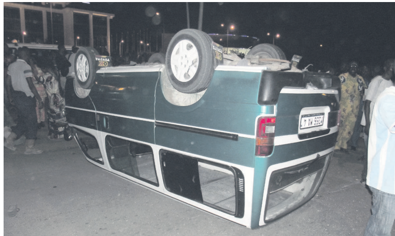
Le minibus renversé après l'accident

L'accident a eu lieu samedi 4 juillet dernier aux environs de 18 h 30 sur le Boulevard des Armées Alfred Raoul à Brazzaville.