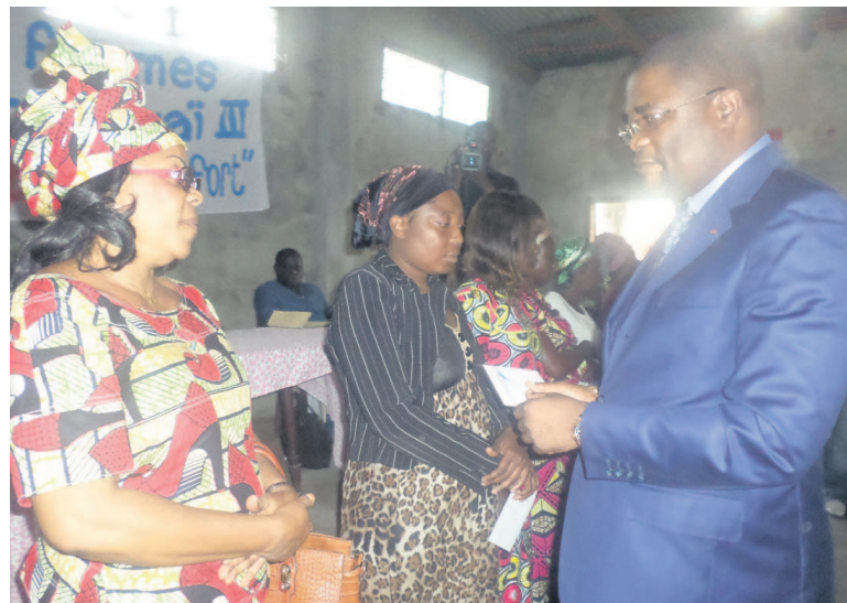
Sylvestre Ossiala remettant les enveloppes aux bénéficiaires

Le deuxième vice-président de l'Assemblée nationale a, par ailleurs, demandé aux bénéficiaires d'en faire bon usage