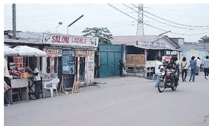
Une vue de la ville de Goma, au Nord-Kivu

Selon le rapport conjoint de la Banque mondiale et de l'Organisation mondiale du commerce, la nouvelle option vise à réduire le coût des échanges et à démanteler les barrières entre les pays. Intitulé « le rôle du commerce dans la lutte contre la pauvreté », le rapport réitère l'intérêt stratégique des échanges commerciaux dans la redynamisation de la lutte contre la pauvreté. L'on estime que près d'un milliard d'individus vivent avec moins de 1,25 dollars américains US. Toutefois, l'on ne saurait rien attendre de cette approche sans des initiatives concrètes visant à maximiser les revenus des plus pauvres. En effet, si les échanges commerciaux participent à revigorer le secteur privé et à créer des emplois, l'on peut espérer également des résultats plus intéressants des politiques de réduction de la pauvreté et d'augmentation des