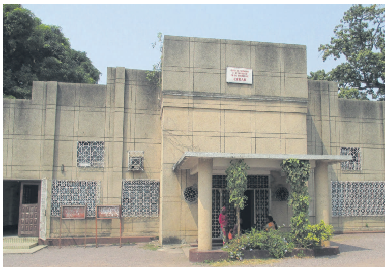
La façade Cfrad

L'État, en sa qualité de promoteur principal du développement culturel, peut engager par le biais des grands travaux, des crédits nécessaires à ces opérations que l'on peut inscrire dans le cadre des infrastructures liées à la Municipalisation accélérée. En dépit