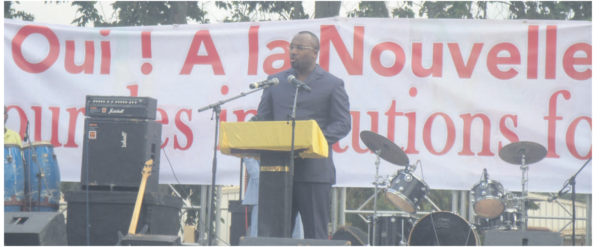
Denis Christel Sassou N'Guesso s'adressant aux populations du Niari

Prenant acte de l'engagement des associations signataires de la déclaration de Dolisie, le parrain de