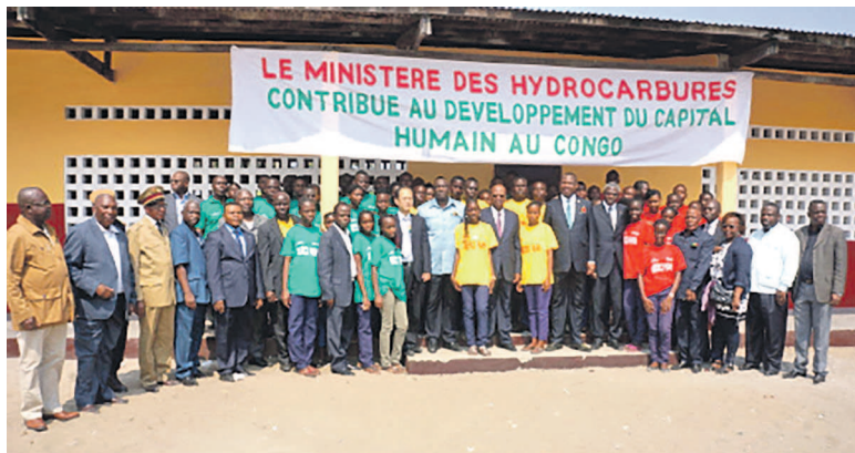
Photo de famille à l'école Emmanuel Dadet Damongo