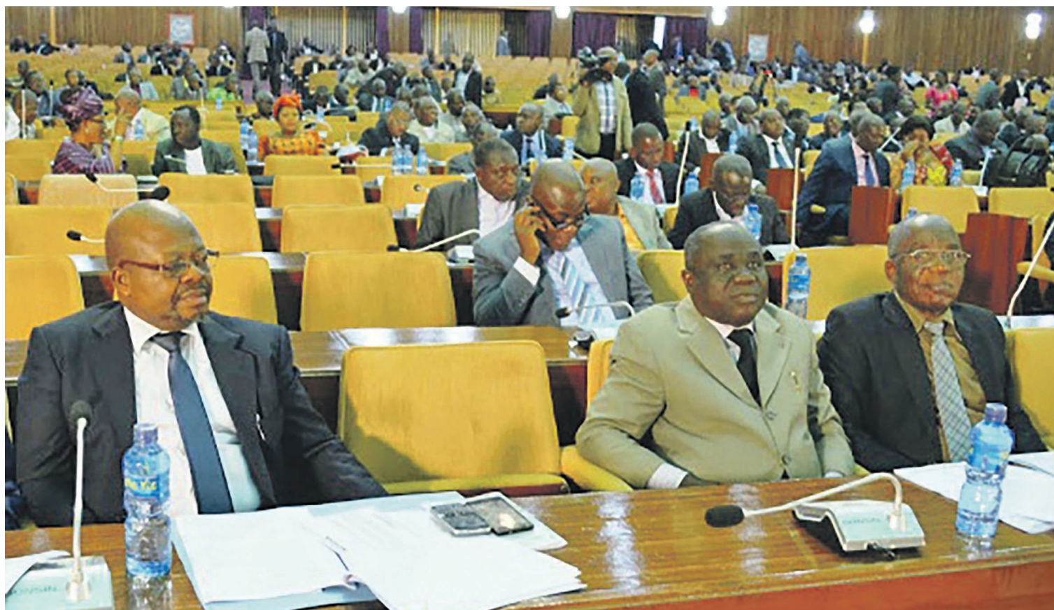
Une vue des députés en séance plénière

À peine qu'elle vient de s'ouvrir, la session extraordinaire du Parlement, convoquée du 4 juillet au 2 août, est déjà gangrenée par une forte tension qui risque de compromettre son bon déroulement. La matière essentielle, à savoir l'examen du projet de loi portant sur la répartition des sièges aux élections municipales et provinciales, est loin de recueillir l'adhésion des députés et sénateurs.