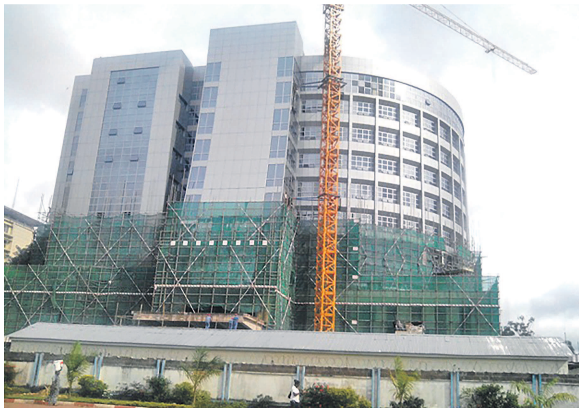
Prévue pour le 30 juin dernier, l'inauguration de l'Hôtel du gouvernement a été décalée

L'inauguration officielle de l'imposant immeuble situé en bordure du boulevard du 30 juin pourrait intervenir avant le 17 juillet 2015. Toutefois, sur le terrain, cet immeuble d'une dizaine d'étages n'est plus protégé par les tôles ondulées qui empêchent l'accès au public au point que quelques images ont filtré dans la presse nationale en attendant le grand événement qui n'est plus qu'une question d'heures. Les travaux exécutés par l'entreprise