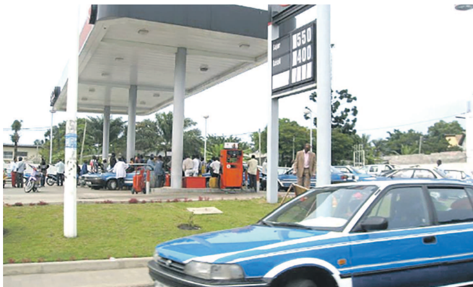
Une station d'essence prise d'assaut»

En effet, du fait de cette pénurie plusieurs stations services sont en rupture de carburant, et les quelques unes