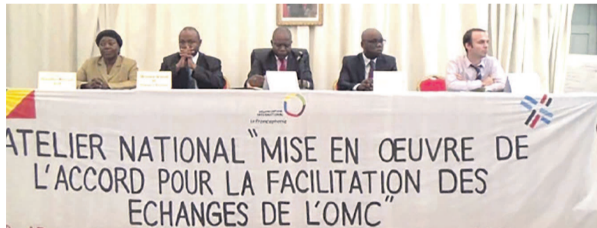
La tribune officielle à l'ouverture de l'atelier pour la facilitation des échanges OMC

L'atelier organisé par le ministère du Commerce et des approvisionnements avec l'appui du Centre du commerce international (CCI) de Genève en Suisse et de l'Organisation internationale de la francophonie (OIF) à travers le programme Hub et Spokes II du Congo a pour but de fluidifier le commerce international, de catégoriser les mesures et de réfléchir plus en détails sur les modalités de mise en œuvre de l'accord. En effet, en décembre 2013, les membres de l'Organisation mondiale du commerce (OMC) ont conclu les négociations relatives à l'accord pour la facilitation des échanges (AFE) lors de la conférence ministérielle à Bali. Dès l'entrée en vigueur, l'AFE crée des obligations qui contraignent les membres de l'OMC à améliorer leurs procédures, leur transparence et leur efficacité douanières, ainsi que la coopération entre les organismes de régulation des frontières et le secteur privé. Les pays en voie de développement et les pays moins avancés devront classer