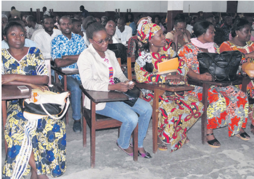
Une vue des enquêteurs

Sur le terrain, ces enquêteurs et contrôleurs feront le porte à