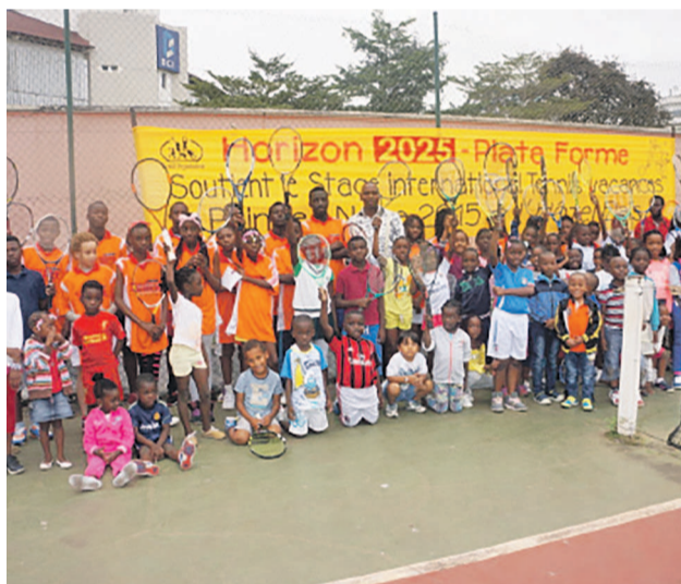
Photo de famille à l'ouverture du stage