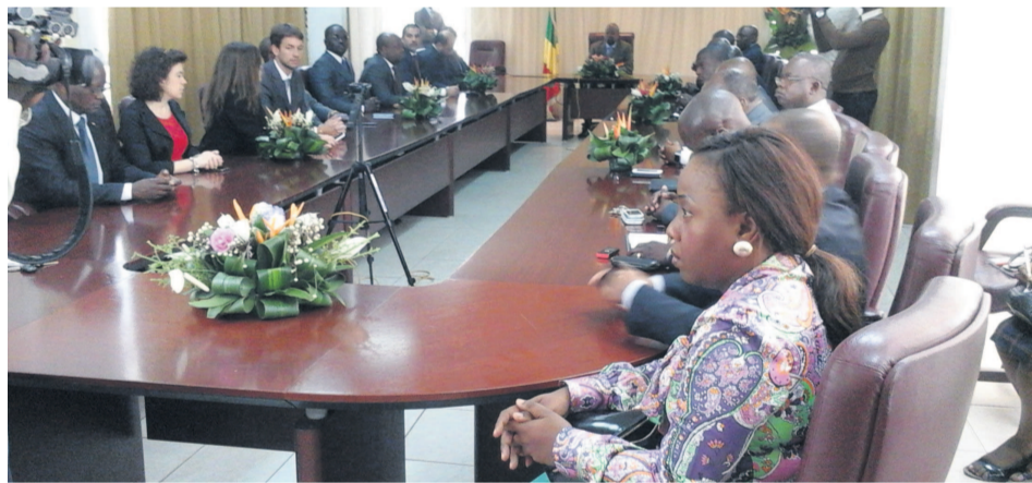
La cérémonie de signatures de contrats

Africa Oil & Gas corporation (AOGC), Kontinent Congo et Petro Congo sont les premières sociétés locales congolaises à intervenir sur le périmètre des permis pétroliers autrefois détenus par les « majors ». Une disposition qui participe du nouveau code des Hydrocarbures en vue.