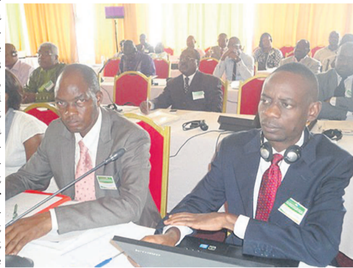
Le représentant du Congo (droite) au séminaire de Yaoundé

Par conséquent, les participants ont recommandé l'implication des consommateurs, des syndicats des travailleurs et patronaux, des groupes vulnérables (jeunes, femmes, handicapés et populations autochtones) ainsi que des producteurs dans le processus d'élaboration du programme indicatif national de chaque pays. Face au retard qu'accuse l'Afrique centrale dans la conclusion de son accord de partenariat économique avec l'Union européenne, les participants ont reconnu la nécessité de sensibiliser les parties prenantes à la signature de cet