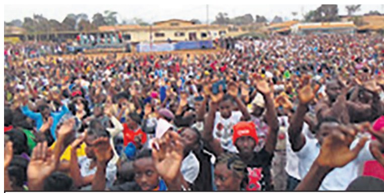
Les fidèles pendant la campagne d'évangélisation

Environ 22675 chrétiens de l'Eglise Evangélique du Congo et ceux d'autres confessions religieuses ont pris part à la campagne d'évangélisation organisée du 8 au 12 juillet au cercle culturel de Dolisie, par le département synodal de l'évangélisation de cette église, sous le thème « un si grand salut vous a été annoncé » tiré du livre de Hébreux 2:3-4.