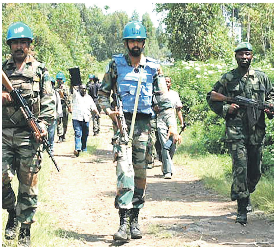
Les opérations militaires conjointes FARDC-Monusco requises dans la traque des groupes armés