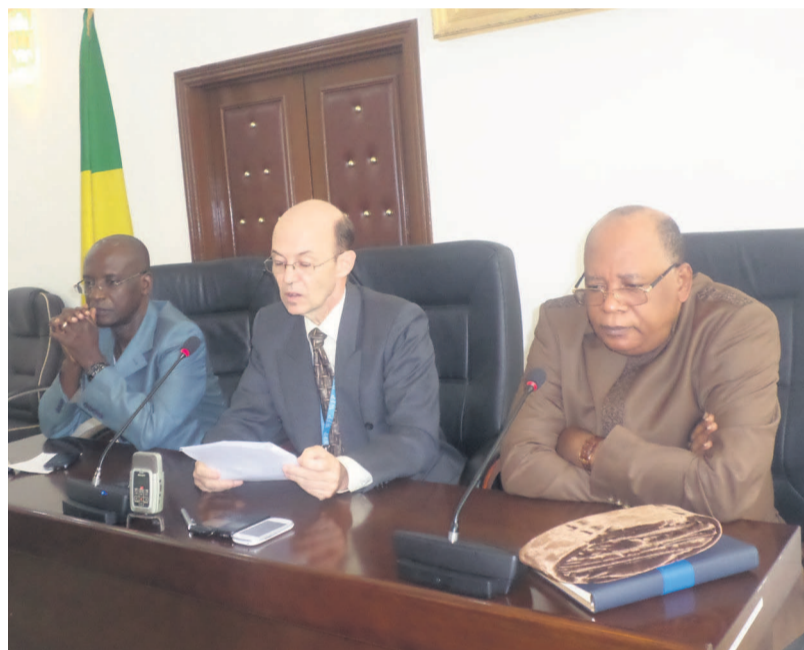
Le présidium des travaux

tion alimentaire limite est passé de 2,1% à 4,7%. Pointe-Noire est la seule ville qui ne présente pas des ménages avec consommation alimentaire pauvre. Bref, les résultats de l'analyse indiquent que la situation alimentaire est globalement acceptable pour une grande majorité de ménages mais avec cependant un niveau de vulnérabilité très élevé face aux différents chocs potentiels. Des résultats de l'analyse, il res-