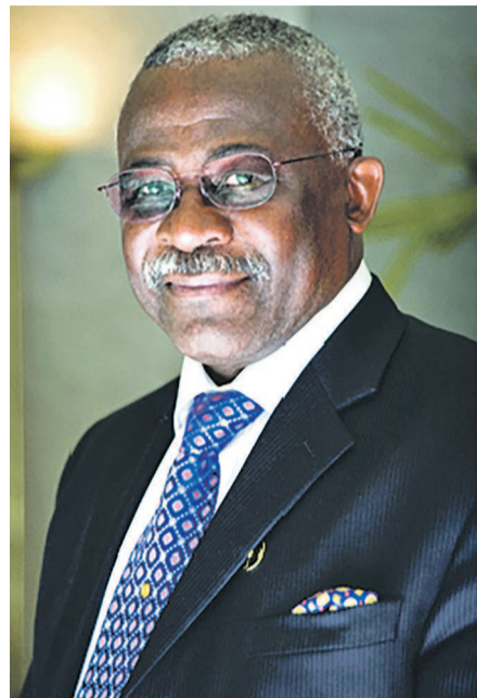
Le président du FIDA, Kanayo F. Nwanze

Dans un communiqué annonçant cette visite, le FIDA a noté que la bonne gouvernance est fondamentale pour booster l'investissement dans l'agriculture en RDC. Cette agence des Nations unies a déploré que l'insécurité alimentaire demeure encore un problème en RDC, bien que 80 % de la population rurale du pays soient constitués de petits agriculteurs de subsistance qui produisent 70 % de la nourriture consommée dans le pays. Le taux d'enfants souffrant de malnutrition, a souligné le FIDA, est aussi très élevé. « Les petits agriculteurs ont un énorme potentiel pour développer le secteur agricole, contri-