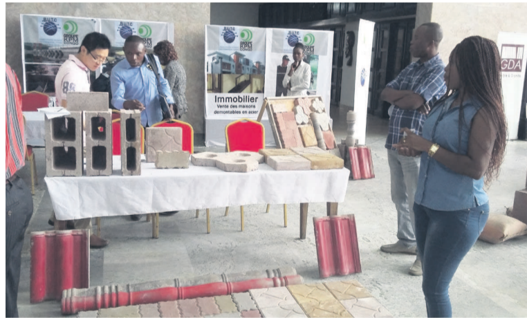
Une exposition de briques