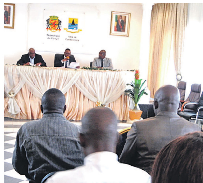
Une vue de la salle lors de la réunion

Dans le cadre des préparatifs de cet événement, la commission d'organisation a eu une séance de travail le 21 juillet dans la salle de la mairie centrale. La rencontre a permis, entre autres, d'examiner les itinéraires proposés par la commission technique et de retenir les lieux des inscriptions et des visites médicales. Ainsi, les athlètes âgés de 16 ans et plus de la ville de Pointe-Noire et de ses environs désireux de participer au cross peuvent se faire inscrire, à partir du 24 juillet, à la permanence du Conseil départemental et municipal (à la mairie centrale), aux sièges des 6 arrondissements et de la communauté urbaine de Tchianza Nzassi où se feront