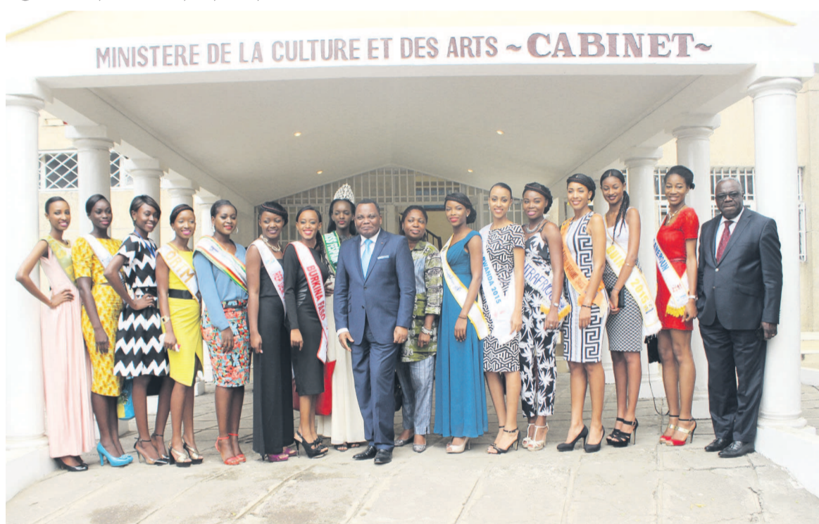
Les treize candidates posant avec le ministre de la culture, le commissaire général du Fespam et la présidente du comité Miss Fespam peu avant l'élection