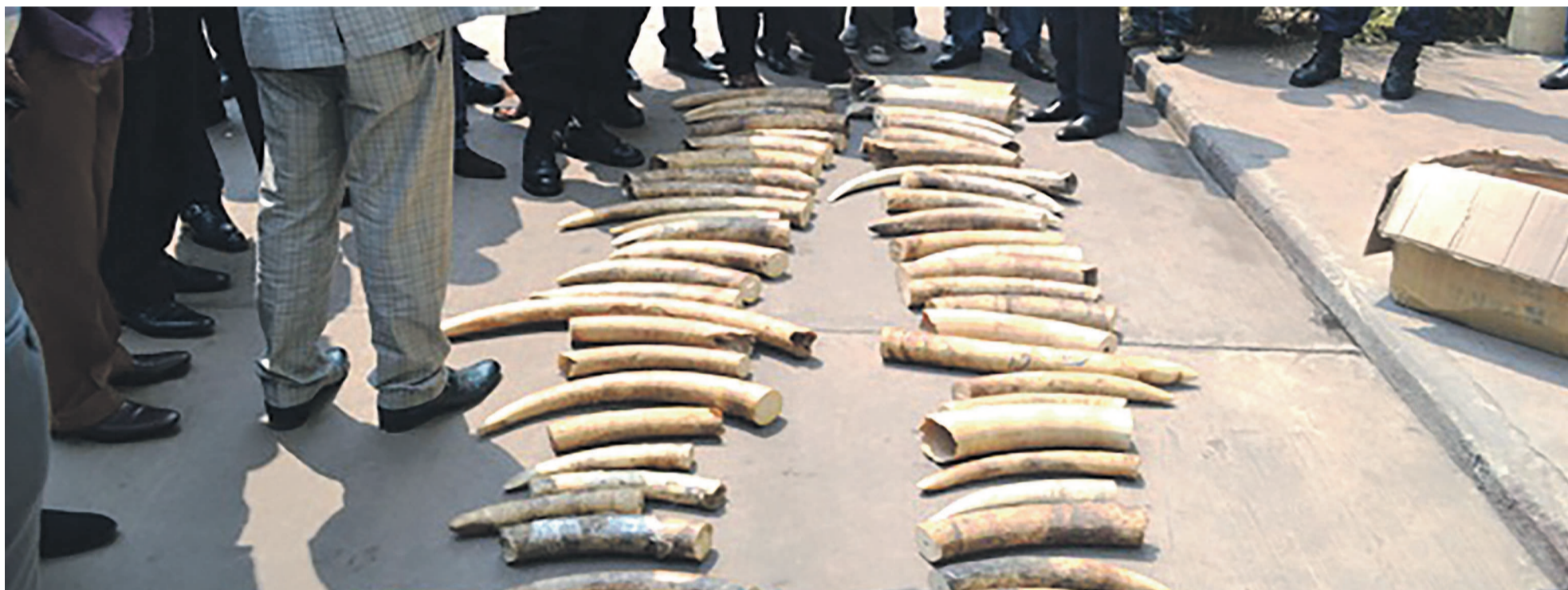
Des pointes d'ivoire saisies

L'opération menée hier en matinée par la brigade de la Direction générale des douanes et accises (DGDA) s'est soldée par la trouvaille de cet important lot au domicile d'un sujet guinéo-nigérian sur l'avenue Kabambare. Les Dépêches de Brazzaville tiennent des estimations faites