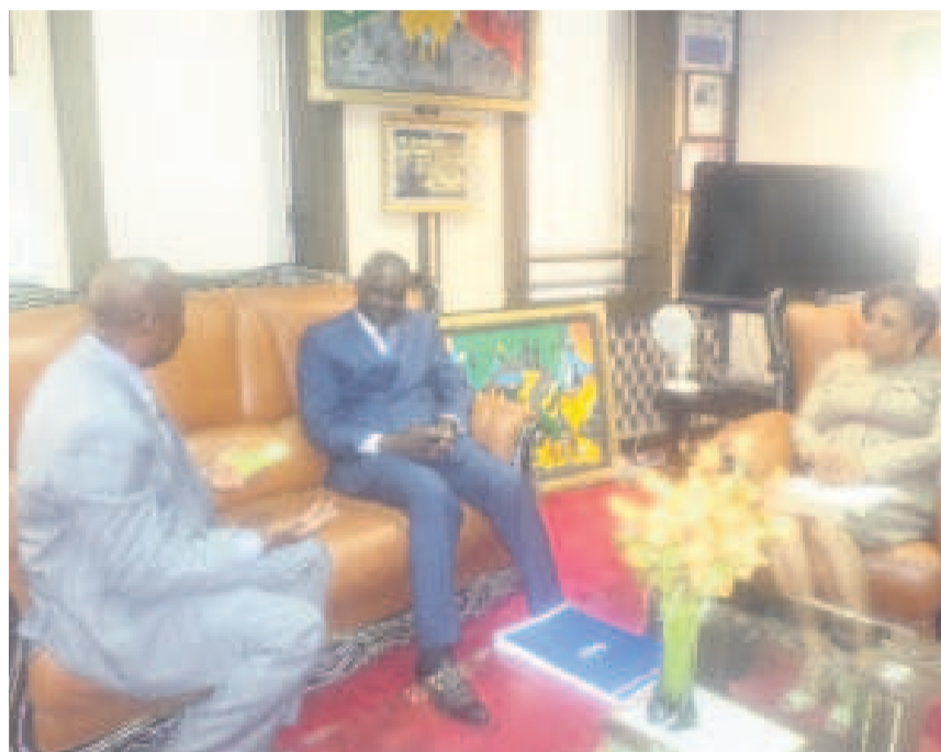
Anatole Collinet Makosso échangeant avec le représentant de l'Unesco pour l'Afrique centrale

sé sur la jeunesse, la culture et les sports de l'Union africaine, Anatole Collinet Makosso. En effet, les deux personnalités ont échangé sur les perspectives