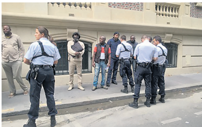
Une partie des assaillants neutralisés par la police devant le consulat du Congo en France

Sur place, le constat fait est celui d'un mode opératoire