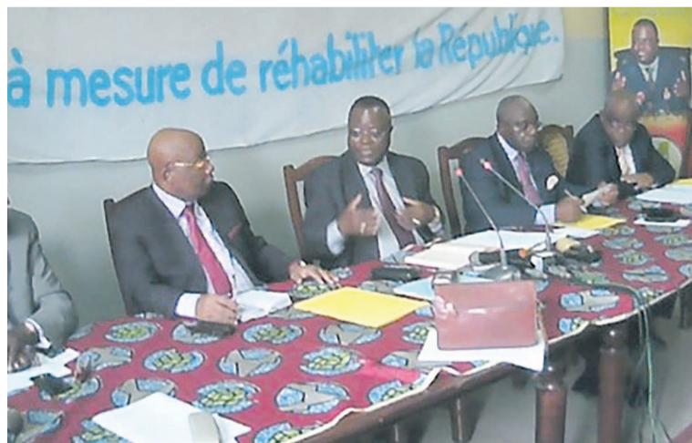
Une vue du collectif

Le collectif des partis de l'opposition congolaise, signataires de la déclaration de 2012, a animé une conférence de presse, le 22 juillet à Brazzaville.