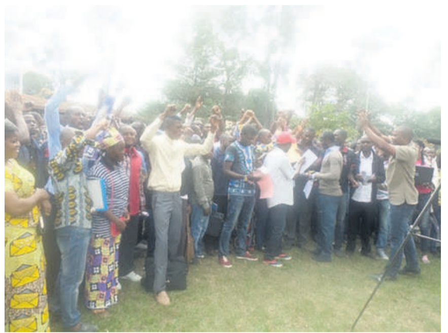
Les membres de la CCDEP pendant la déclaration

« Le cas contraire susciterait une chaîne des sit-in spontanés à partir de la date ci-dessus jusqu'aux 11e Jeux africains et dont l'arrêt est conditionné par la publication desdits quotas », averti la déclaration issue de l'assemblée générale extraordinaire. Elle compte, par ailleurs, sur la bonne foi du président de la République qui agit, d'après ces diplômés sans emploi, en père et en