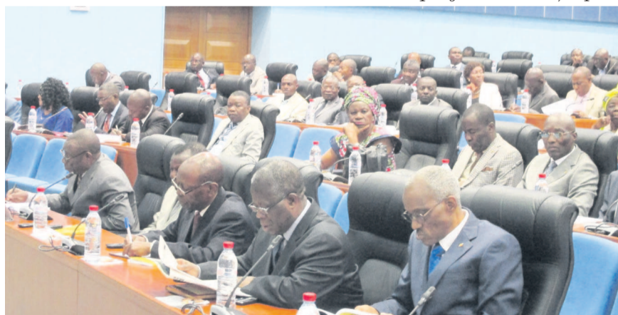
Une vue des parlementaires

cette institution de jouer un rôle beaucoup plus actif aussi bien en matière de ratification que de transposition des conventions internationales. « Une des pistes est le respect du contrôle préalable de constitutionnalité par le juge constitutionnel et une meilleure organisation du travail gouvernemental en matière de préparation des avant projets de loi », a pré-