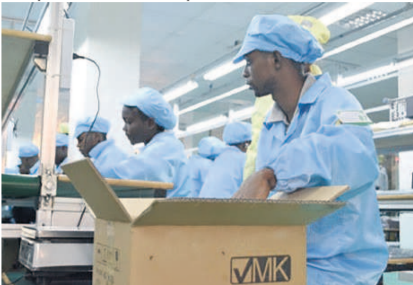
Une centaine de congolais travaillent dans cette usine

née prochaine 100% de nos produits soient faits sur place », souligne-t-il. Dans ces ateliers où travaillent une centaine de jeunes congolais recrutés sur la base de 500 dossiers et formés sur place, ajoutés à ceux envoyés en Chine plusieurs mois avant et des spé-