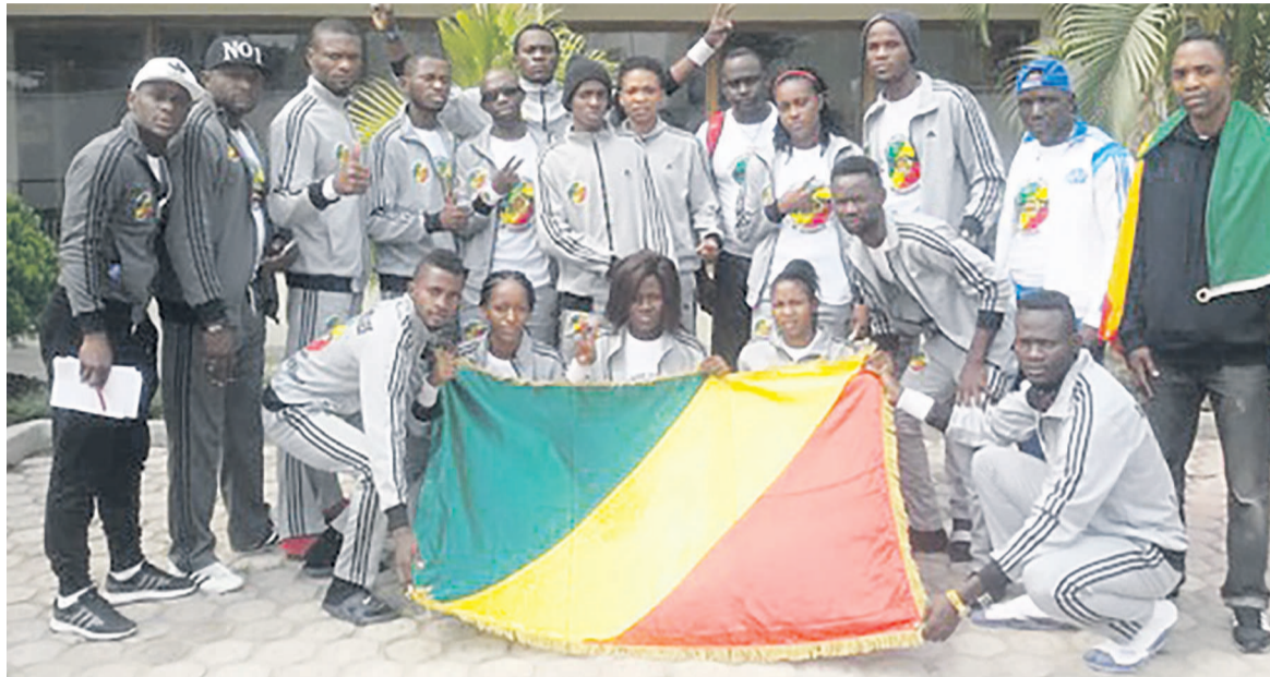
Les Taekwondoïstes arborant le drapeau national

Le président de la Fédération congolaise de Taekwondo (Fecotae), Sta-