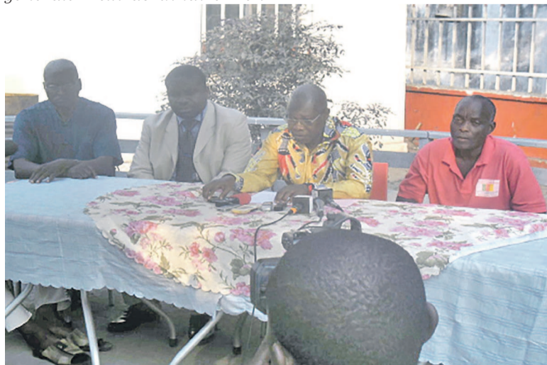
Les responsables de clubs expliquant leurs motivations