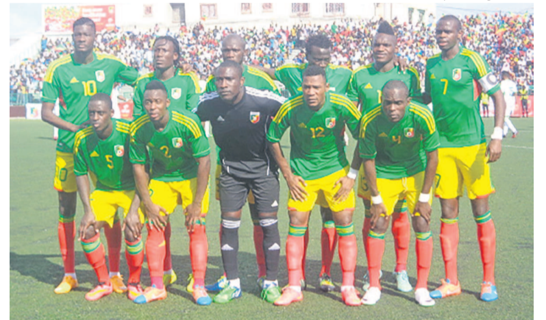
Les Diables rouges

53 sélections africaines vont négocier les cinq places réservées au continent en trois étapes. Les 26 pays les moins bien placés au classement FIFA de juillet 2015 rentrent en compétition dès le 5 octobre pour l'aller et le 13 octobre pour le retour, selon le programme dévoilé par la FIFA. La Somalie affronte le Niger pendant que le Soudan du Sud reçoit la Mauritanie. La Gambie affronte la Namibie, le Sao Tomé défie l'Éthiopie et le Tchad sera aux prises à la Sierra Leone. Les Comores affrontent le Lesotho, le Djibou-