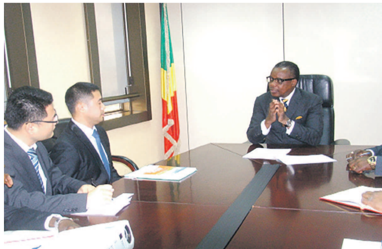
Les deux parties lors de l'entretien

« A Brazzaville, ils vont générer quelque 21.000 emplois à l'horizon 2020, plus de 70.000 d'ici 2030 à Pointe-Noire, et plusieurs milliers d'embauches à Ouessou, Oyo et Ollombo. Les zones économiques vont diver-