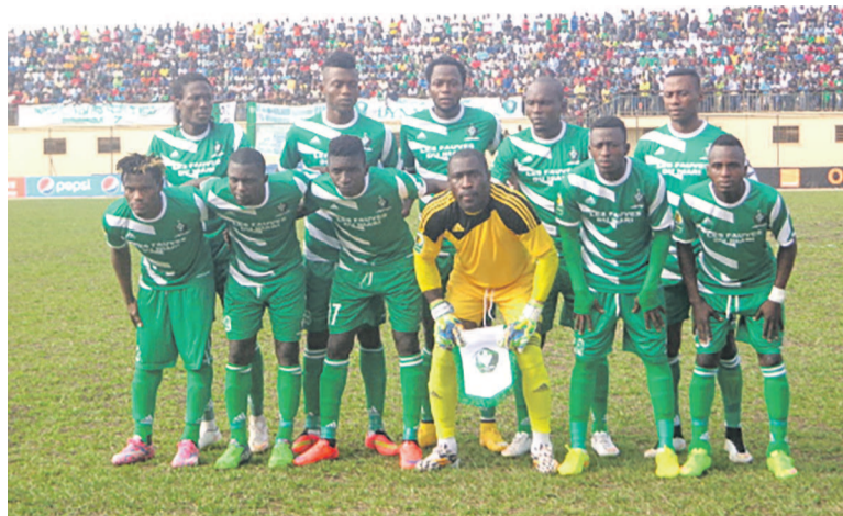
L'AC Léopards doit faire un carton plein au retour

Pour toucher à ce but, les Fauves du Niari doivent faire un carton plein c'est-à-dire, gagner tous les matches de la manche retour. Un défi difficile mais pas insurmontable au football. Les Léopards de Dolisie ont compliqué leur équation le 26 juillet en concédant en Égypte leur deuxième défaite dans la phase de poules de la 12e édition de la Coupe africaine de la confédération. Ils accusent désormais huit points de retard sur le club égyptien, lequel a réalisé un carton en alignant trois victoires en autant de match. Le représentant congolais est aussi distancé de cinq longues unités par les Sud-africains d'Orlando Pirates, lesquels ont réalisé la bonne opération en Tunisie en s'imposant face au Club sportif Sfaxien sur un score d'un but à zéro, plaçant les deux vainqueurs sur la voie royale. La position qu'occupent Zamalek et Orlando Pirates, accentue la pression sur les épaules des hommes de Rémy Ayayos Ikounga. Ils ont été obligés à sortir juste après leur défaite et celle de Sfax, les caulettes pour