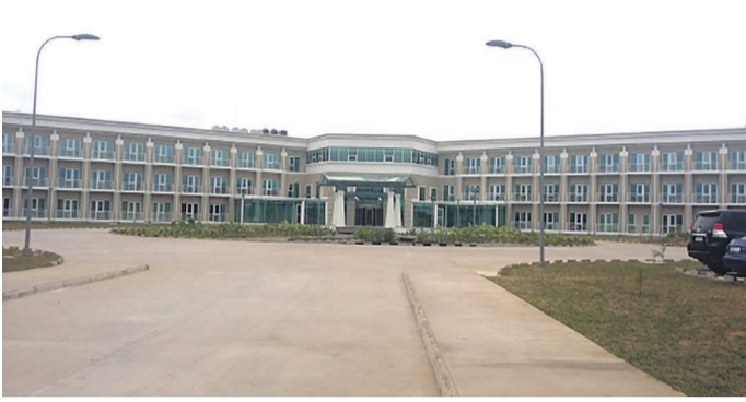
Une vue de l'hôtel de l'aéroport