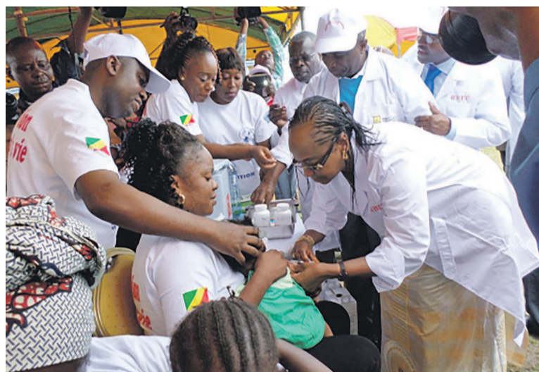
Lancement de la campagne de vaccination à Pointe-Noire

La campagne nationale de vaccination sera organisée du 30 juillet au 2 août par le gouvernement congolais en collaboration avec l'Organisation mondiale de la santé (OMS), l'Unicef ainsi que d'autres partenaires, dans le cadre de la poursuite de la lutte contre la poliomyélite dans le pays.