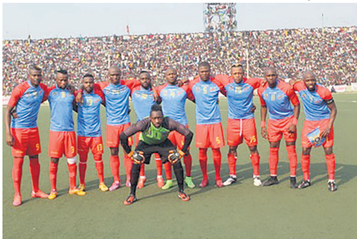
Les Léopards de la RDC

Notons-le, cinquante-trois équipes africaines, hormis le Zimbabwe suspendu, sont désormais en course pour cinq places qualificatives du Mondial russe en 2018. Au départ, les vingt-six pays moins bien placés au classement Fifa de juillet 2015 disputeront le tour préliminaire le 5 octobre (match aller) et le 13 octobre 2015 (match retour). Treize équipes s'extirperont de ce tour préliminaire pour rejoindre les vingt-sept nations exemptées de ce premier tour des élimina-