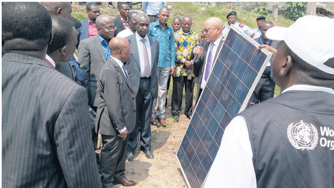
Ces équipements serviront au renforcement des activités de surveillance dans la lutte contre la polio