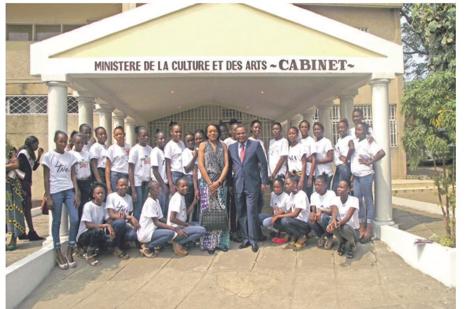
Le ministre de la culture et des arts posant avec la présidente du comité Miss Congo et les candidates