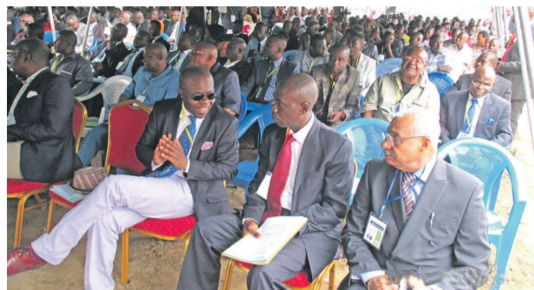
Les participants au dialogue

«La crise n'est pas institutionnelle» Deux commissions ont été mises en place suivant les thèmes qui