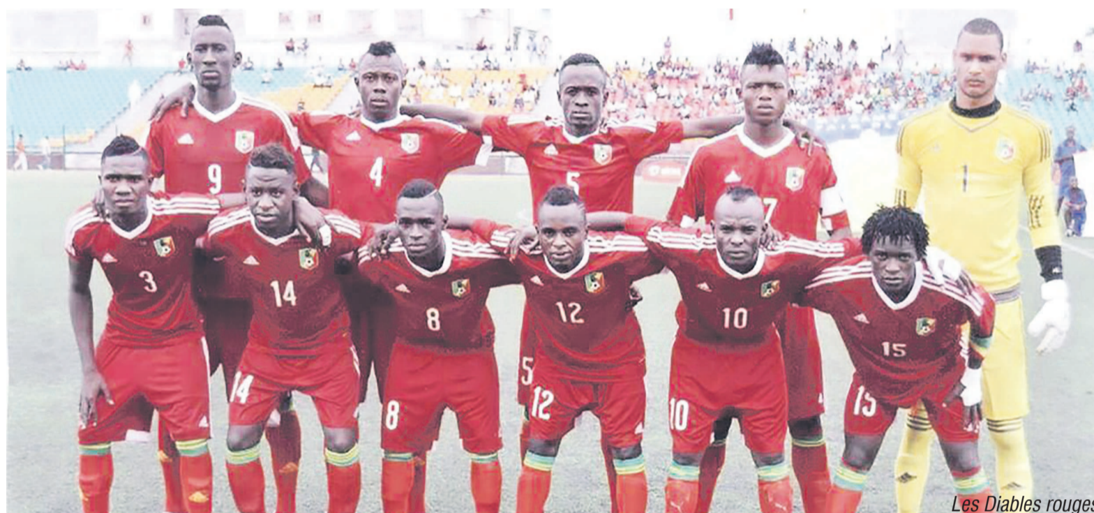
Les Diabes rouges

Lire calendriers des tournois de football des JA dans le supplément