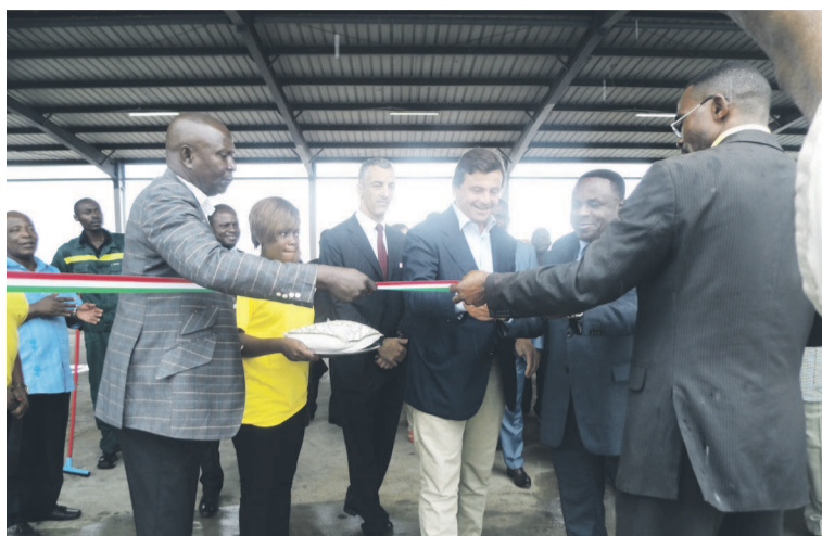
La coupure du ruban symbolique par les ministres

La formation portera sur les métiers de la fonction ou-