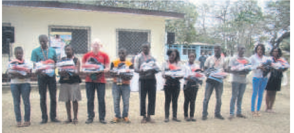
Quelques uns des 100 jeunes retenus