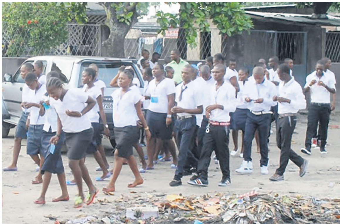
Des élèves du cycle secondaire à Kinshasa

C'est en principe ce 7 septembre que les élèves renouent, sur toute l'étendue du pays, avec leurs établissements scolaires après trois mois de vacances. Apparemment, rien de fâcheux ne pourrait compromettre cette rentrée des classes, surtout que les enseignants eux-mêmes ont, en âme et conscience, accepté de reprendre la craie. Comparativement aux années antérieures, la rentrée scolaire 2015-2016 semble se négocier dans un climat plutôt apaisé. C'est dans cet environnement favorable que le gouvernement et l'Intersyndicale des enseignants tentent d'aplanir leurs divergences. La rencontre du 4 septembre entre les représentants des deux parties a débouché sur l'engagement ferme de l'exécutif national de prendre en charge 36000 enseignants non payés au dernier trimestre de l'exercice budgétaire 2015. L'on rapporte que tous les autres problèmes administratifs qui concernent la rémunération, la bancarisation et la retraite seront débattus lors des prochaines né-