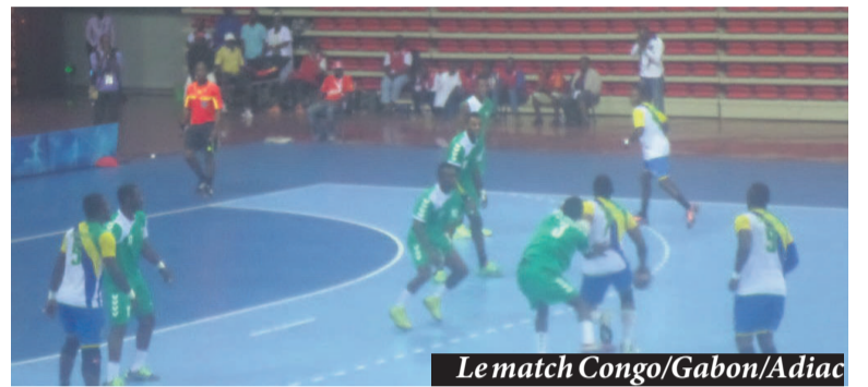
Le match Congo/Gabon/Adiac

Après les dames le 16 septembre, les quarts de finale messieurs du tournoi de handball des 11es Jeux africains se sont disputés le 17 septembre au Palais des sports de Kintélé. L'Angola a battu la Libye, 30-18, le Nigeria a eu raison du Sénégal, 29-18, l'Égypte s'est imposée face à la Côte d'Ivoire, 27-17, et le Congo a défait le Gabon, 25-24.