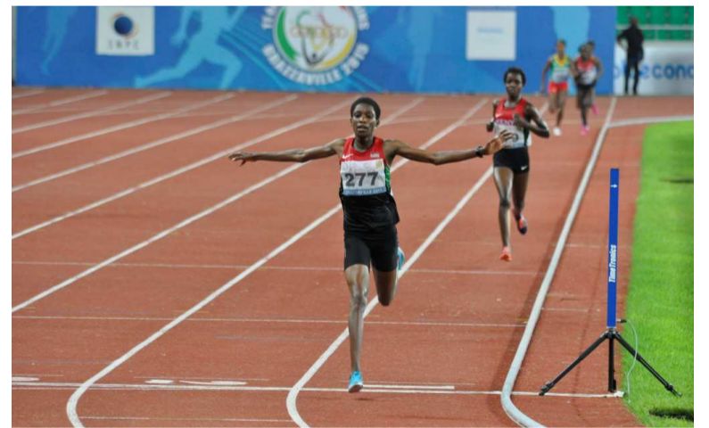
La Kenyane Alice Aprot a placé une accélération fatale dans l'avant-dernier tour et bat le record des Jeux africains sur le 10 000 féminin

Médaillée de bronze sur le 5000, la Kenyane Alice Aprot a survolé le 10 000 ce mercredi, battant au passage le record des Jeux africains en parcourant les 25 tours de pistes en 31 minutes, 24 secondes et 18 centièmes contre les 21.26.05 de l'Éthiopienne Mestawet Tufa (à Alger, en 2007).