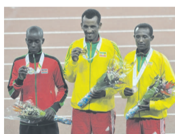
Les Ethiopiens ont pris deux médailles sur trois sur le 10.000 mètres masculin, marquant un coup important dans la rivalité avec le Kenya