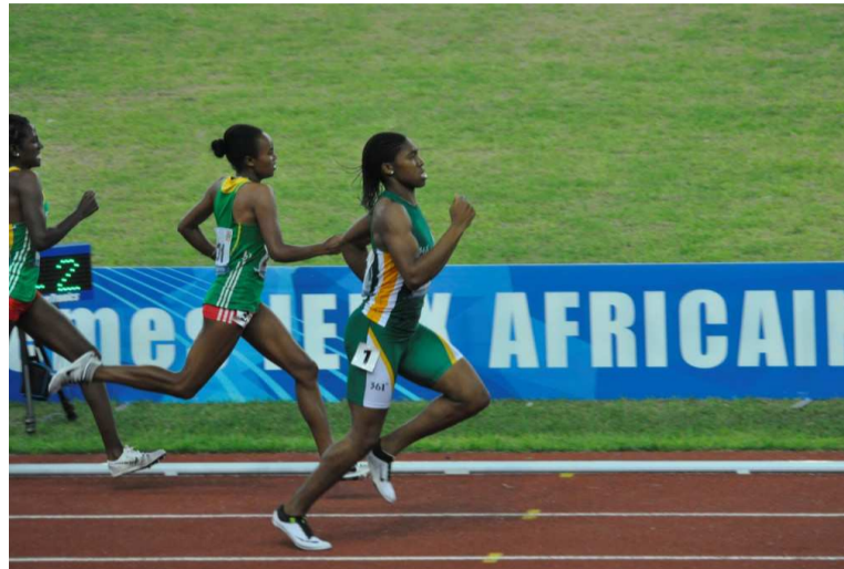
Menée à l'entame de la dernière ligne droite, la Sud-africaine Caster Semenya a déposé ses adversaires éthiopiennes au sprint Longtemps dominée par les Ethiopiennes Annet Mwanzi et Chaltu Shume, la Sud-africaine Caster Semenya a finalement remporté la médaille d'or après une fin de course de folie : dans la dernière ligne droite, elle a déposé ses deux adversaires avec

une facilité déconcertante. La championne du monde 2009 du 800 mètres boucle les deux tours de pistes en 2 minutes et 97 centièmes, soit près de 5 secondes de plus que la mythique Maria Mutola, détentrice du record des Jeux en 1.56.99 (Johannesburg 1999). Les Ethiopiennes Mwanzi et Shume sont respectivement deuxième et troisième en 2.01.54 et 2.01.59 (nouveau record personnel). Eliminées lors des séries, les Congolaises Leo Bafoundissa Missamou et Elizabeth Nabiala Nkengue ont couru en 2 minutes 12 secondes 53 pour la première et 2 minutes, 19 secondes 87 pour la seconde. Et se classent respectivement 15e et 18e sur 20 participantes.