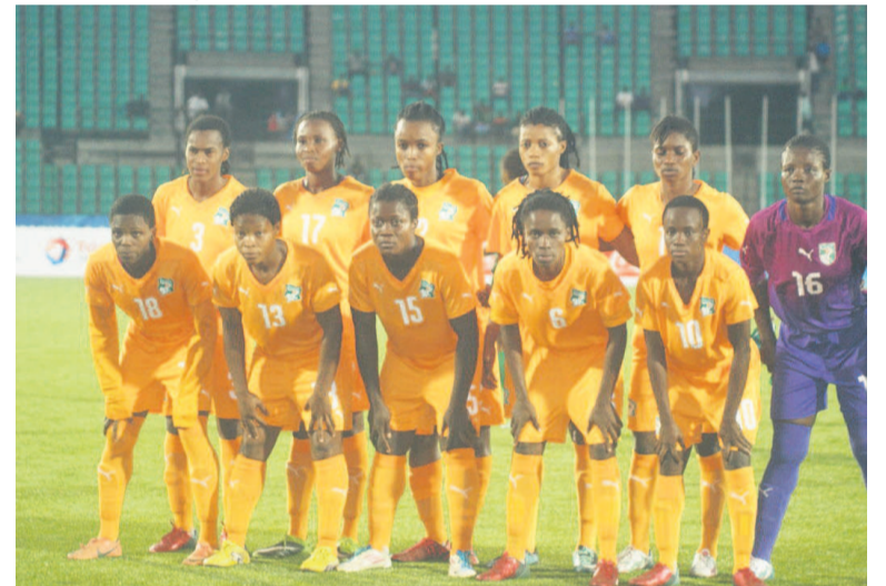
La Côte d'Ivoire médaillée de Bronze des 11èmes Jeux africains

La Côte d'Ivoire termine la compétition au podium après sa victoire 2-1 face au Nigeria.