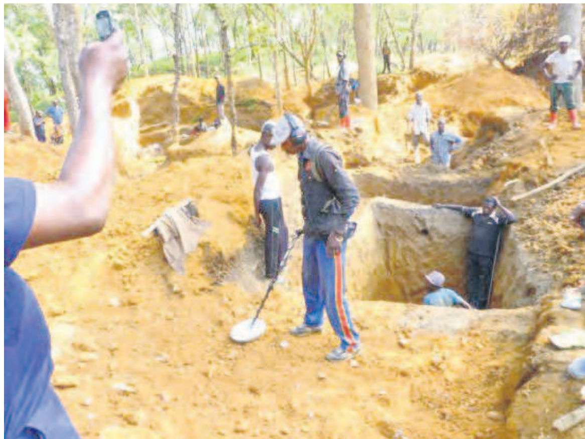
Des creuseurs artisanaux dans une mine à l'Est