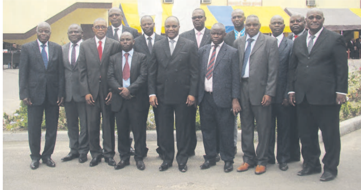
La photo de famille

elles-mêmes parlantes. « Alors que nous nous plaignions en 2014 de l'insuffisance des candidatures sur les différentes listes d'aptitude (seulement 32 le plus faible depuis 5 ans),