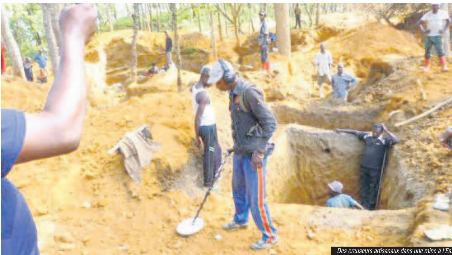
Des creuseurs artisanaux dans une mine à l'Est

La Banque mondiale a publié la troisième édition du Rapport de suivi de la situation économique et financière pour la RDC sur le thème du renforcement de la résilience de long terme de la RDC et les rôles-clés que peuvent jouer la « dédollarisation », la prospection artisanale et la diversification économique. Il ressort de cette étude que la résilience de la RDC va dépendre de la diversification de son économie et de son exportation qui est orientée essentiellement vers la Chine (41%) et limitée essentiellement au pétrole et aux mines (95%). La survie de l'économie congolaise repose sur les efforts de diversification. Et la petite mine remplit bien des atouts. En formalisant ce secteur, il sera possible de retenir les devises, de créer des emplois, de générer des revenus pour les ménages et des recettes fiscales tant au niveau local que provincial. Page 12