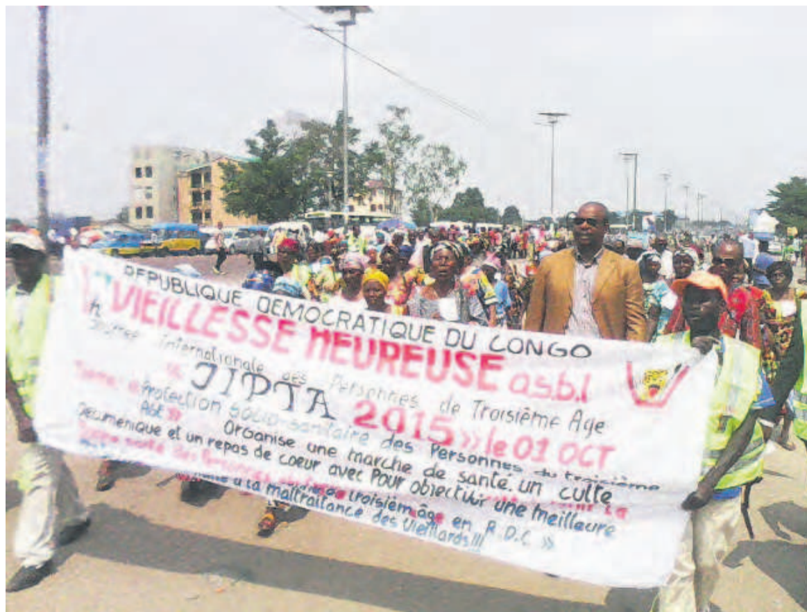
Marche de santé des PTA

L'ASBL VH, a rappelé son président, est née en réaction aux conditions malheureuses, alarmantes, pitoyables et sans référence dans le monde entier dans lesquelles vivent les PTA en RDC, qui, délaissées souvent par leurs familles respectives, ne bénéficient pas du soutien de la part de la société. « Les vieillards sont délaissés, humiliés,