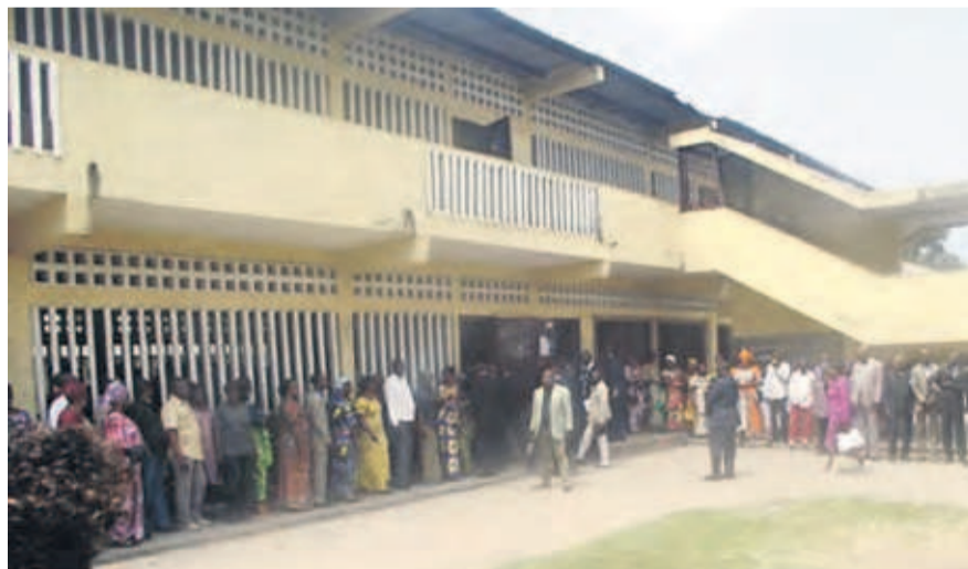
Le personnel du CEG et école primaire Lheyet Gaboka saluant l'arrivée du ministre Josué Rodrigue Nguonimba

les antivaleurs qui ont dégradé le métier de l'enseignant et revaloriser ensemble votre métier. A toutes et à tous, chacun à son poste, votre mission est d'apporter une efficacité afin que les résultats scolaires soient améliorés et que vous soyez exemplaires dans votre conduite. Vous êtes appelés à travailler avec vos chefs hiérarchiques pour obtenir une meilleure performance dans vos établissements. Vous avez la responsabilité du développement