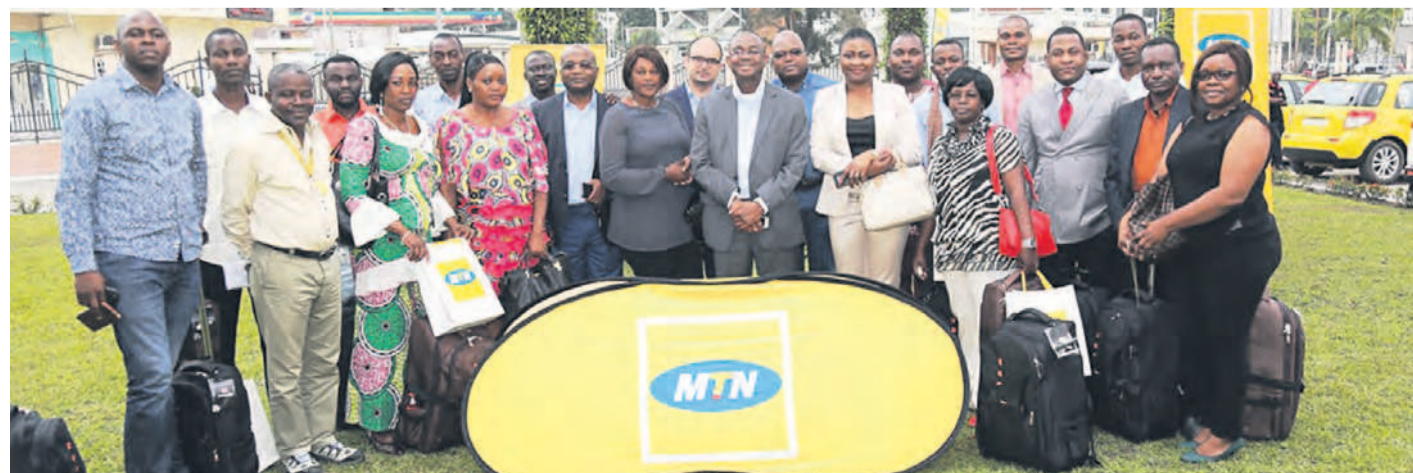
Les journalistes et le Management de MTN Congo

Cette démarche innovante, entreprise par MTN Congo, dans la capitale économique a eu pour objectif simple de "professionnaliser" la presse locale dans le domaine des télécommunications, afin que celle-ci soit plus amène à informer les abonnés et, par voie de conséquence, l'ensemble de l'écosystème de la capitale économique. En guise de cerise sur le gâteau, MTN Congo a procédé à une remise d'outils techniques au 13 journalistes. Il s'agit de Dictaphones, Appareils photo numérique, Sacs de reporter, clés USB 32Go, Lampes-torches, les bottes, imperméables