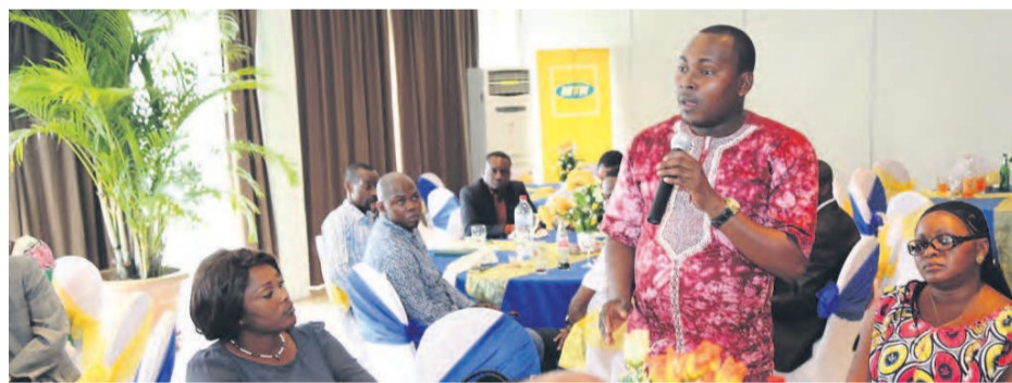
Séance de sharing

sont eux-mêmes moins outillés et peu documentés pour les comprendre et les expliquer à leurs auditeurs. C'est au regard de cette problématique que le vendredi 25 septembre dernier une importante rencontre avec les journalistes de Pointe-Noire a été organisée par le Top Management de MTN Congo. L'objectif consistait à assister les membres des médias à comprendre les enjeux de l'écosystème des télécoms en République du Congo. Mieux connaître les télécommunications pour mieux communiquer sur les sociétés de téléphonie mobile, a été la clé de voûte de cette rencontre. Treize (13) Journalistes des différents médias de Pointe-Noire ont été au cœur du système de cette rencontre. Les principales questions étaient Comment ça marche ? Quels types d'équipements techniques utilisent MTN Congo pour connecter et relayer les communications à travers les villes ou zones ?