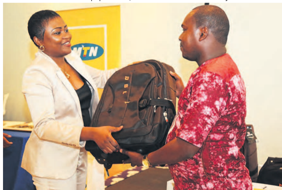
Remise de don à un journaliste