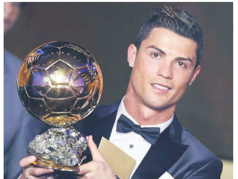
Qui succèdera à Cristiano Ronaldo?

L'Ivoirien Yaya Touré est le seul joueur représentant le continent africain. D'autres clubs européens, notamment Manchester United, Liverpool, l'Inter et l'AC Milan ainsi qu'Athletico Madrid n'ont pas été représentés.