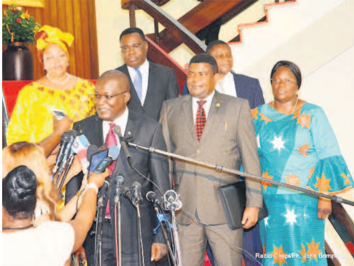
Les membres du bureau de la Céni

La démission présumée du vice-président de la Céni annoncée par certains médias de la capitale est l'une des stratégies auxquelles recourent désormais les partisans de la restructuration dans l'objectif de positionner des nouveaux candidats dont la fidélité ne fait l'ombre d'aucun doute. Le coup serait porté par la hiérarchie de la majorité présidentielle et quelques membres influents du gouvernement. L'on estime que cette deuxième démission sonnerait définitivement le glas de l'actuelle Céni.