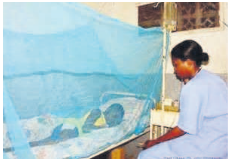
Les soins de santé de qualité pour tous

miner les secteurs prioritaires d'intervention auxquels sera affecté ce nouveau financement. Au nombre des sujets abordés : le porte feuille du renforcement du système sanitaire en RDC et l'appui actuel sur différents projets que la BM finance en collabo-