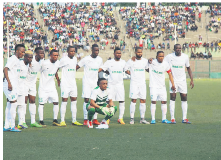
DCMP de Kinshasa

Un but partout a été le résultat entre le Daring Club Motema Pembe et la formation de Shark XI FC.