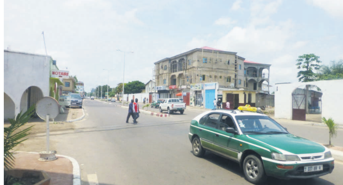
Une avenue en vie à Brazzaville

« J'ai ouvert ma boutique depuis ce matin, parce que je constate qu'il y a du calme par rapport à la journée d'hier. Effectivement,