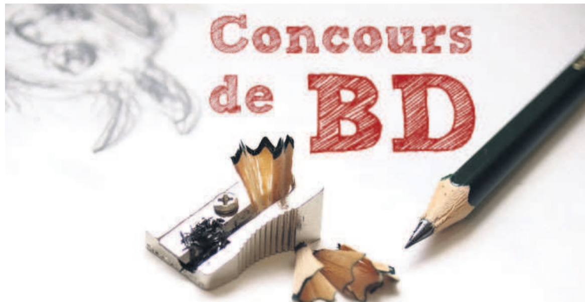
L'affiche du concours de BD de la Halle de la Gombe

Et pour ce qui est du reste, la Halle de la Gombe précise bien qu'« un jury de professionnels de la BD et de l'édition sélectionnera les deux meilleures productions qui