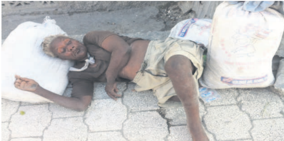
La prise en charge des malades mentaux s'impose

malades mentaux heurte parfois les moeurs locales. « À côté de la station Quin-Med, deux fous ont consommé une activité sexuelle à 17 heures », témoigne le coordonnateur provincial de l'OCDH, Me Ngulandjoko. De son côté, le ministre provincial de la Santé indique que les démarches sont en cours pour la remise en marche des structures pouvant prendre en charge tous ces malades mentaux. Ces struc-