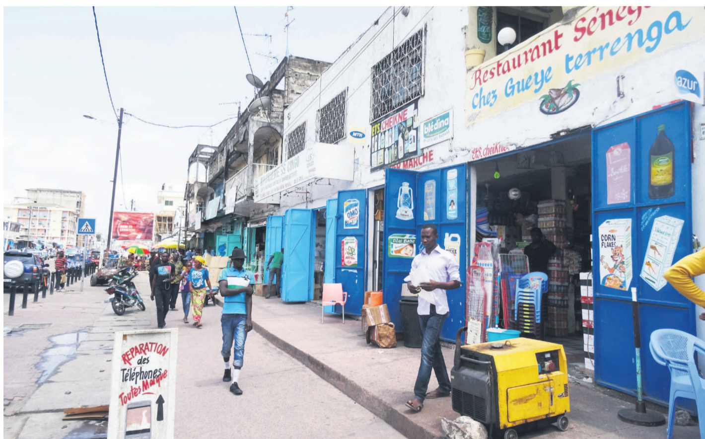
Une vue des boutiques ouvertes à Poto-Poto