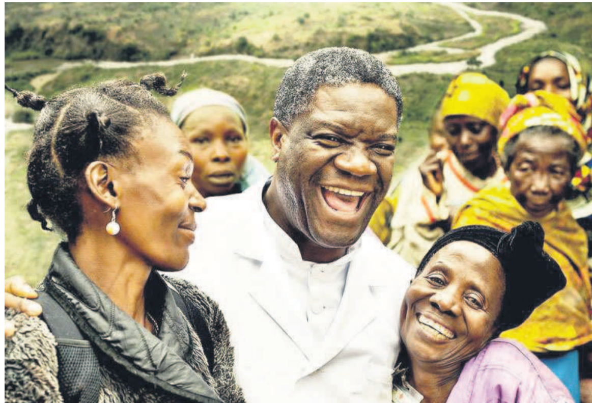
L'homme qui répare les femmes, la colère d'Hippocrate