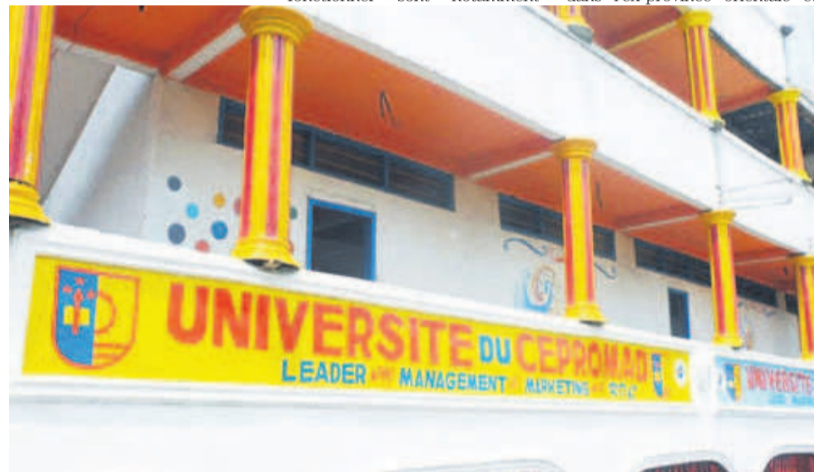
Bâtiment de l'Université du Cepromad à Kinshasa

Quarante extensions sont fermées au Sud-Kivu, trente-sept dans l'ex-province orientale et