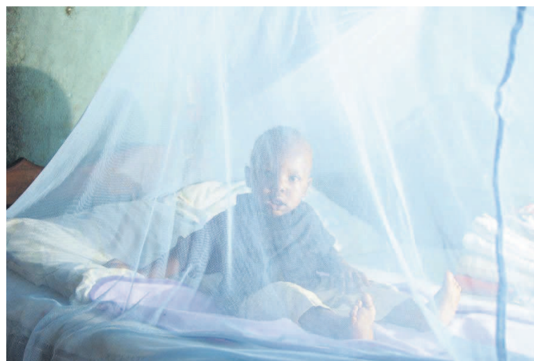
Un enfant qui dort sous la moustiquaire est à l'abri de la malaria

Le paludisme ou la malaria constitue un problème majeur de santé publique en RDC. En plus des pertes en vies humaines, la prise en charge de cette maladie coûte cher en dépenses de santé publique. Selon une étude menée à l'Université de Kinshasa, révèle l'enquête démographie et de santé 2014, un épisode de paludisme grave revenait à au moins 69 dollars américains pour la femme enceinte et 95 dollars pour l'enfant, sachant qu'un enfant congolais fait, en moyenne, dix épisodes de fièvre par an.