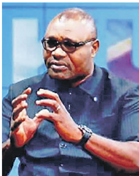
Denis Kambayi, actuel ministre des Sports de la RDC

Dans ses propos, Denis Kambayi a vivement condamné les violences perpétrées dans les infrastructures sportives, ajoutant que le stade des Martyrs, qui sera ouvert en novembre, ne pourra être accessible qu'aux personnes majeures et responsables. Les jeunes de moins de quinze ans seront interdits d'accès au stade qui sera quadrillé par deux cent cinquante-sept caméras afin d'enregistrer faits et gestes des spectateurs et dévoiler les fauteurs de troubles. Le ministre