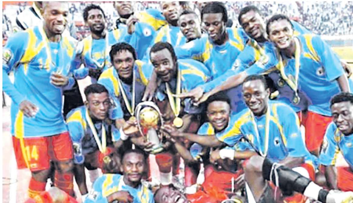
Les Léopards locaux de la RDC vainqueurs du Chan en 2009

Le sélectionneur des Léopards locaux de la RDC, Florent Ibenge, a rendu publique, le mardi 27 octobre 2015 à Kinshasa, une liste des vingt-six joueurs retenus au sein de la sélection A' pour le tournoi international organisé à Luanda à l'occasion des festivités relatives au quarantième anniversaire de l'Indépendance de l'Angola. Ce tournoi va regrouper l'Angola pays hôte, la Zambie, le Zimbabwe et la RDC. Les Léopards de la RDC s'opposeront le 6 novembre au Chipolopolo de la Zambie, alors que les Palancas Negras seront face aux Warriors du Zimbabwe. Les Léopards locaux qui sont qualifiés pour la phase finale de la 4e