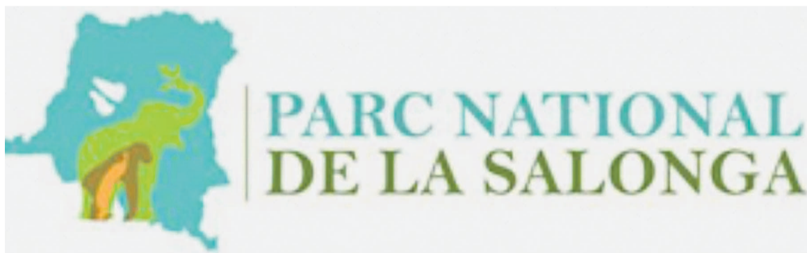
Logo du PNS

Ce jugement public, comme l'a souligné le chef de site et conservateur principal au parc, est un moyen de sensibiliser et d'éduquer la population au respect de la loi en matière de conservation de la nature en RDC et va servir de leçon à tous les braconniers qui circulent encore dans cette aire protégée.