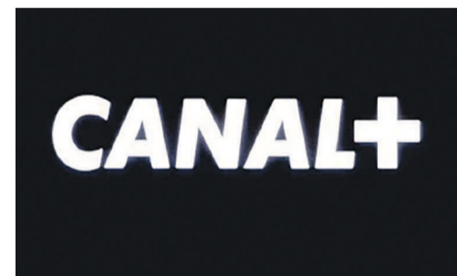
Logo Canal +

L'accompagnement et le financement de la production de pilotes de fiction humoristique mais aussi les moyens donnés aux jeunes talents africains pour enrichir leur expérience témoignent de l'engagement de CFI et Canal+ auprès de la fiction africaine et de la création originale. Ils ont trouvé là le moyen de promouvoir les talents africains qui participeront à la création de nouveaux programmes courts comiques dans les années à venir. L'on peut dire que le projet MDR ! arrive à point nommé vu qu'il est lancé au moment où les programmes courts enre-