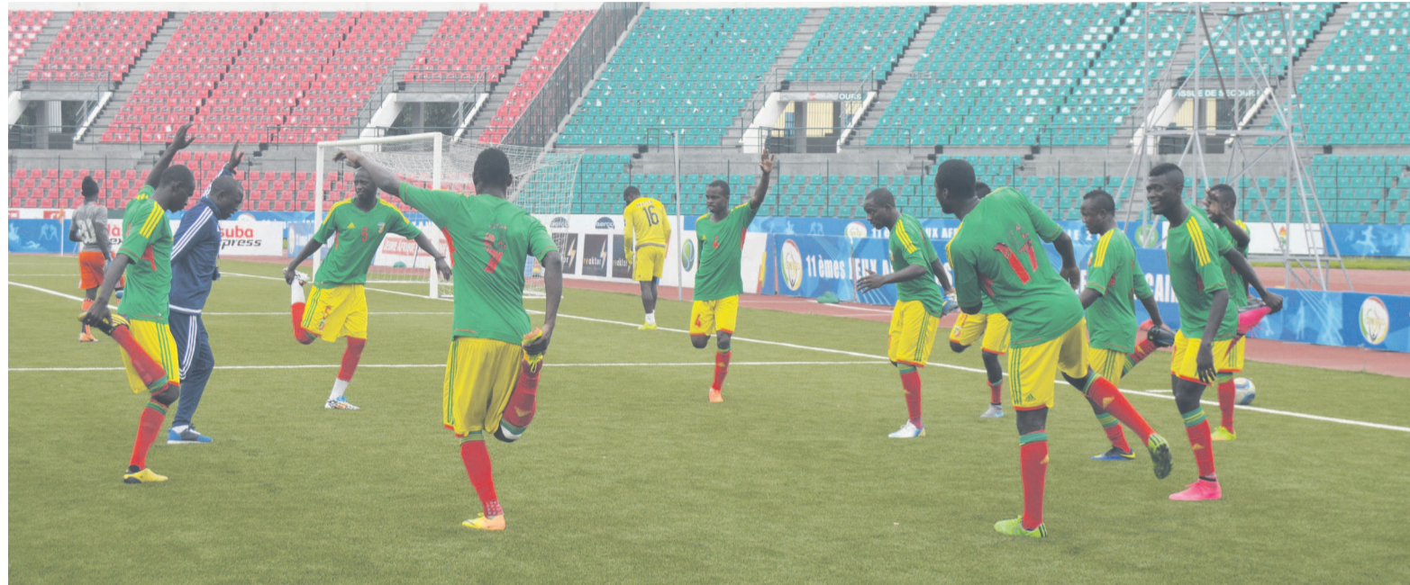
Les Diables rouges à l'entraînement

À dire vrai, la rencontre Congo-Cameroun est taxée de piège pour les Diables rouges parce qu'ils ont concédé un nul de zéro but partout le 18 octobre à Yaoundé au match aller. Le samedi prochain, au match