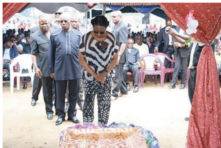
Les responsables du Frocad lors de la cérémonie de recueillement

et sociale, et là, un tableau marqué de l'effigie des disparus, de leurs noms ainsi que du lieu où ils ont trouvé la mort. « Forte émotion, en effet, car partagée entre la douleur et l'espoir. La douleur, bien sûr, de dire adieu