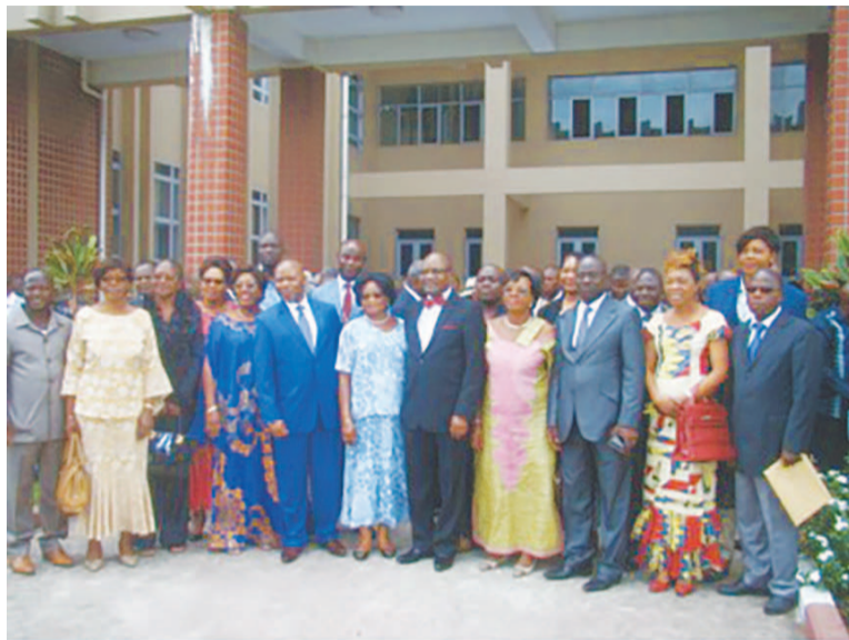
Photo de famille : au milieu, le recteur sortant en costume Bleu de nuit, assorti d'un noeud papillon

Les différents intervenants, notamment le directeur du cabinet du recteur sortant, le représentant des chefs d'établissements, le représentant de l'intersyndicale, ont salué la clairvoyance et le lea-