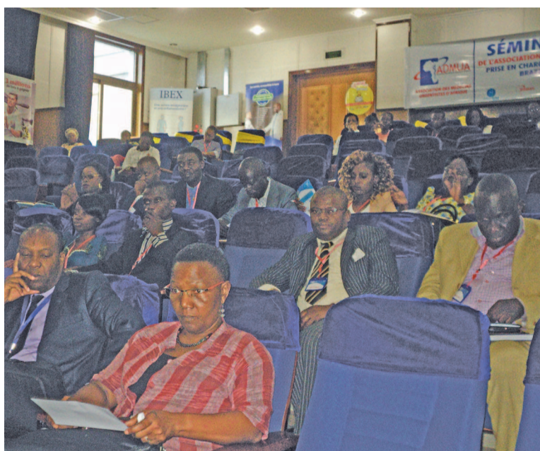
Les personnel de santé suivant les communications