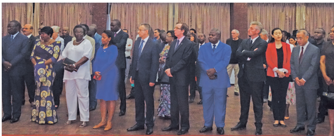
Une vue des diplomates et autres invités de marque

dans les cadres multilatéraux, notamment celui de la présidence turque du G20. Cette année, l'Agence turque de coopération et de coordination a aussi entamé son action d'aide au développement au Congo », a indiqué le diplomate turc, Can Incesu.