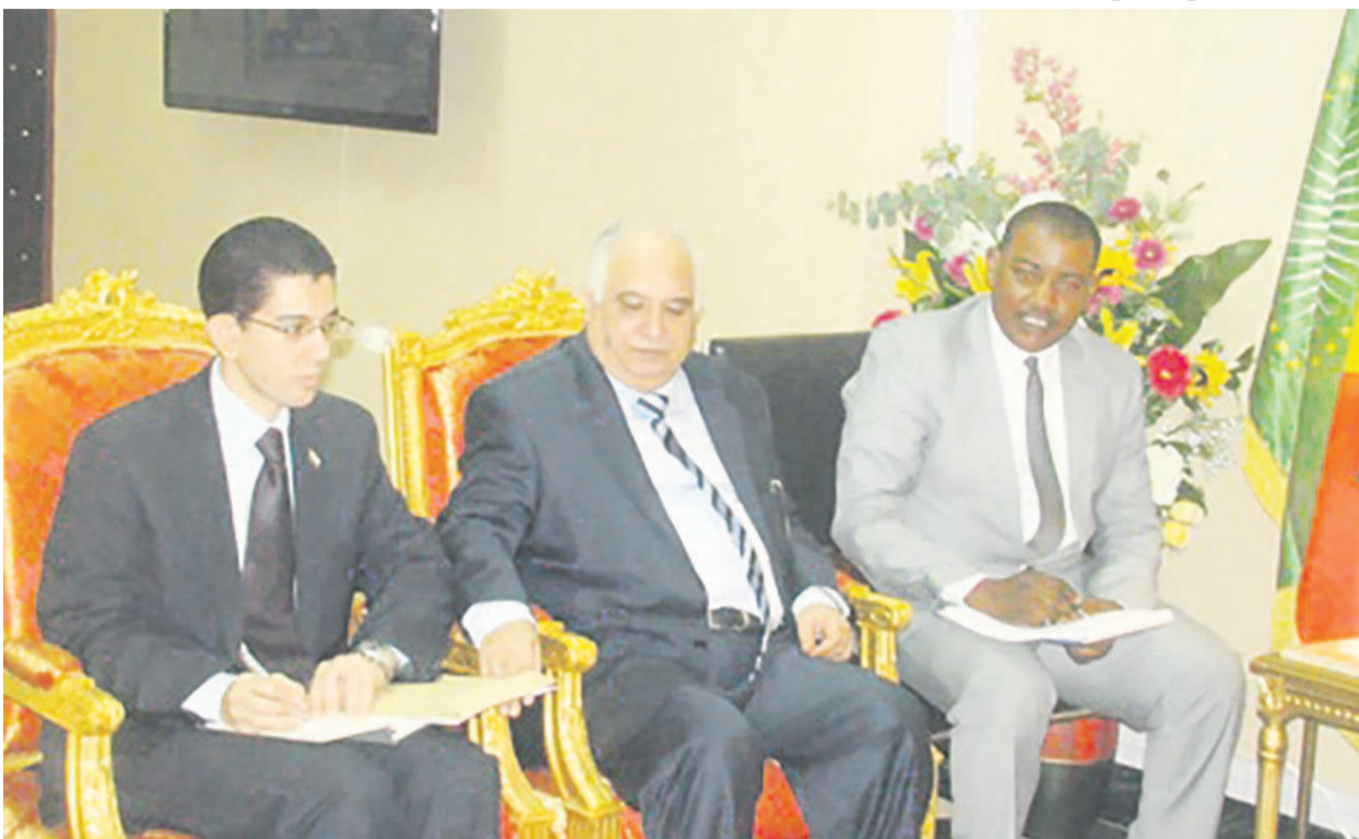
Le nouvel ambassadeur égyptien juste au milieu