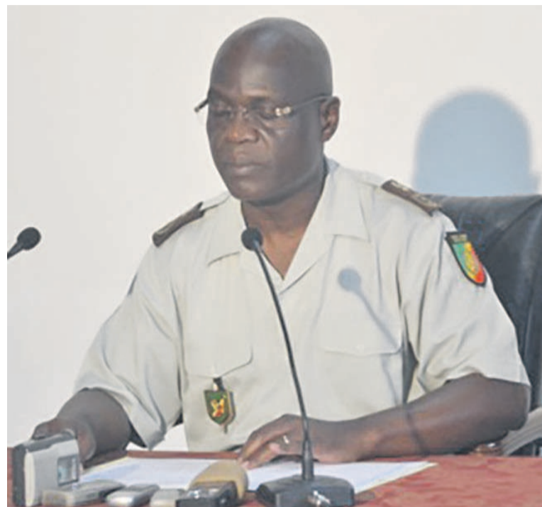
Le chef d'état-major général des Forces armées congolaises (FAC)

« La paix ne s'obtient pas par la haine » Dans ce même esprit agressif et hostile, il est rapporté entre autres dans les comptes rendus exploités que la liberté de circuler a été pendant un moment altérée dans les quartiers