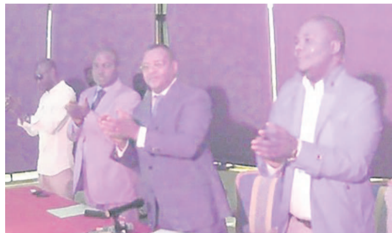
Une vue des membres de la coordination

Au cours d'une réunion d'évaluation où il a fait le bilan du travail réalisé avant, pendant et après le référendum, le Rassemblement du OUI s'est dit déterminé à poursuivre ce travail de mobilisation, dans la perspective de l'élection présidentielle de 2016. Ainsi, cette plateforme s'est, en outre, réjouie de la victoire du OUI au référendum du 25 octobre dernier, tout en félicitant les Congolais de s'être mobilisés pour leur participation à ce scrutin référendaire. Elle a adopté, à cet effet, le nouveau programme d'activités couvrant la période allant de novembre 2015