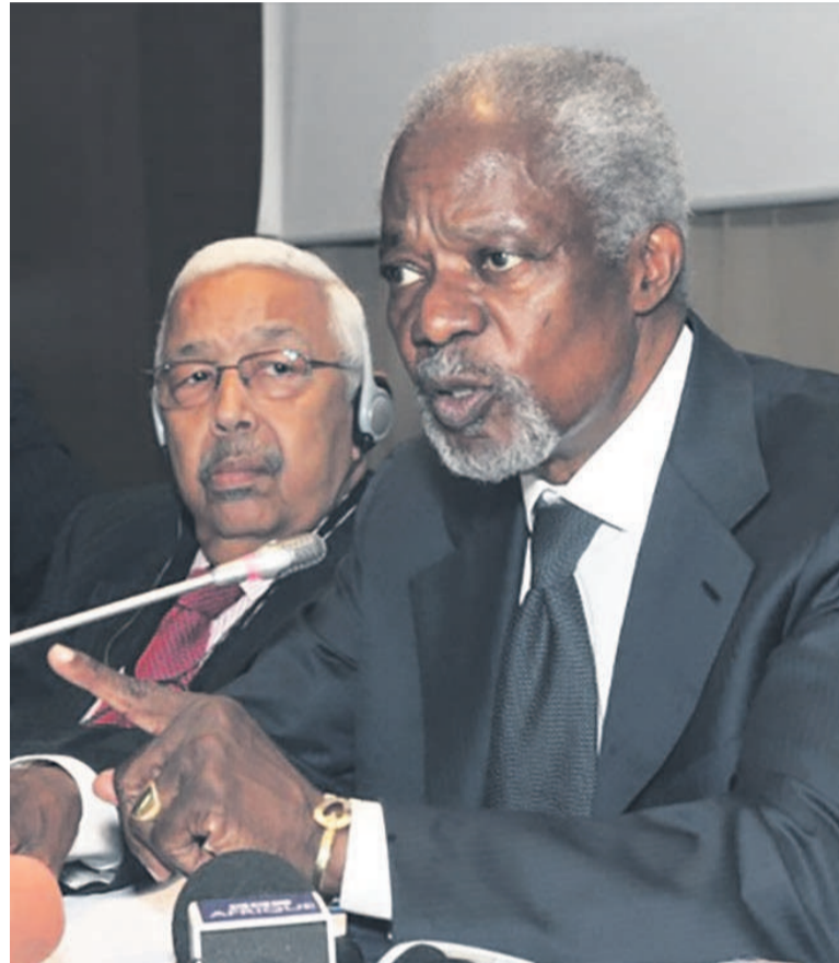
Kofi Annan

L'édition 2016 du Forum de Tana intitulé : « L'Afrique dans l'agenda sécuritaire mondial », se tiendra les 16 et 17 avril 2016, avec comme conférencier d'honneur l'ancien secrétaire général des Nations unies, Kofi Annan. Il est actuellement président de la Fondation Kofi Annan.