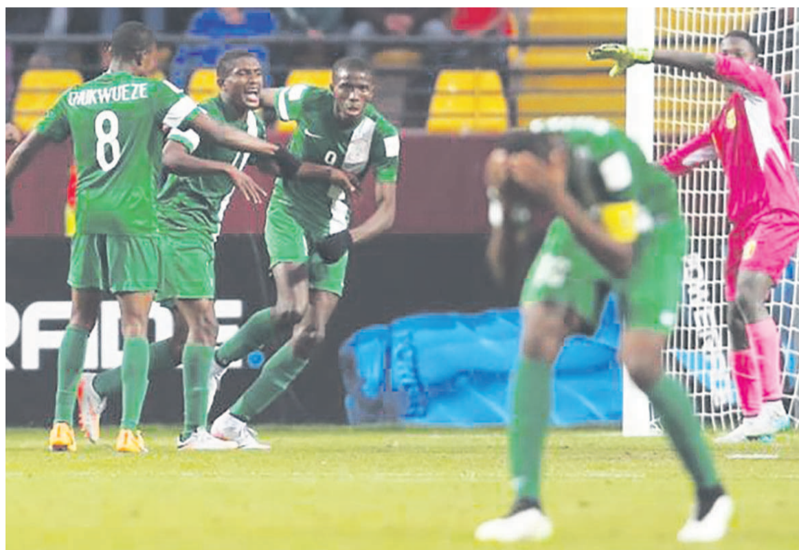
Le Nigeria reste roi (DR)