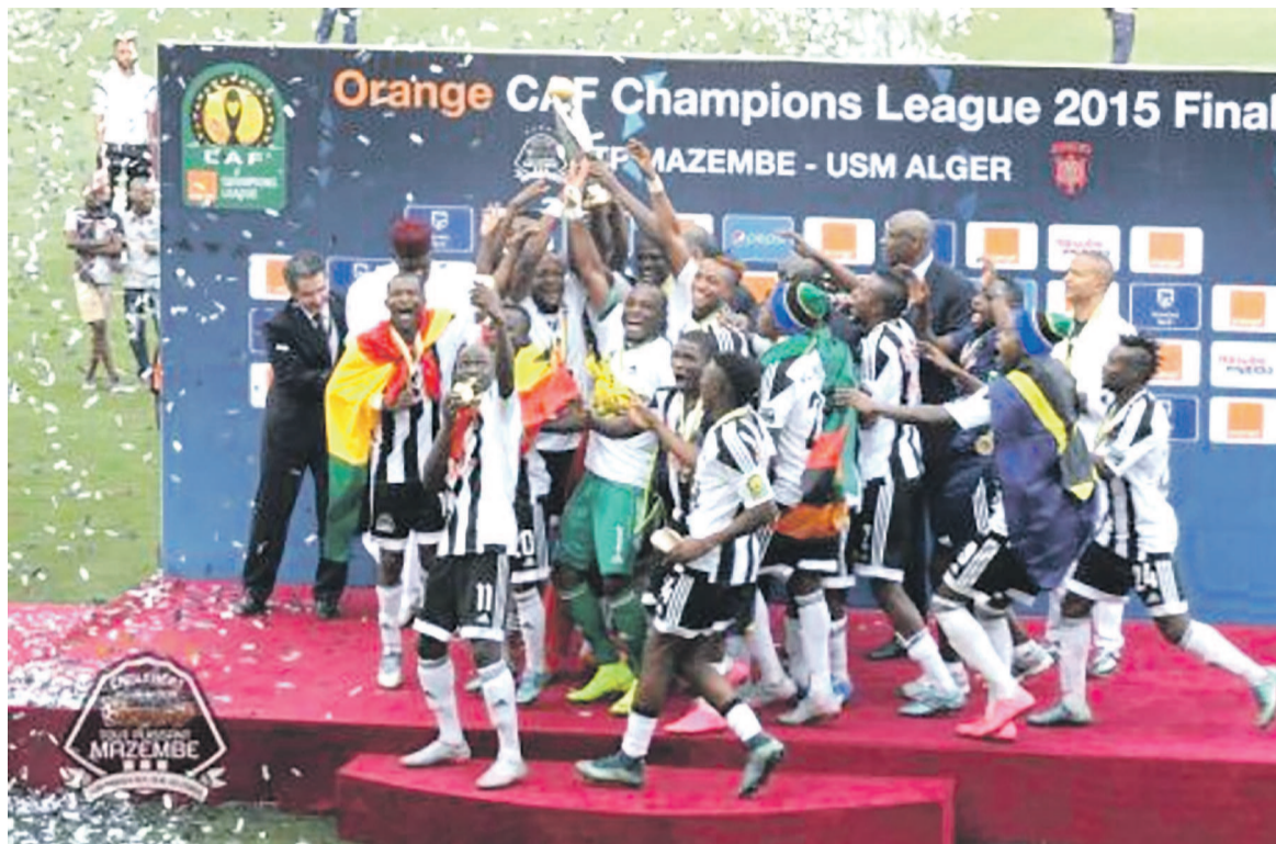
Mazembe champion d'Afrique pour la cinquième fois en 2015