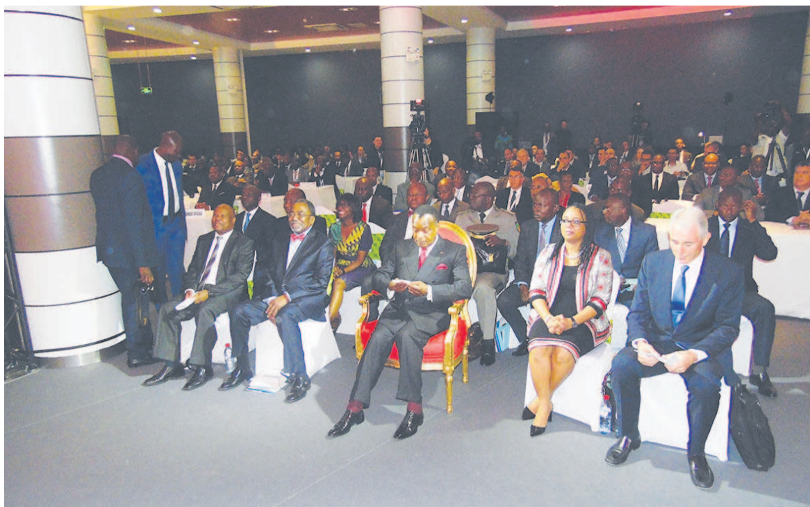
La cérémonie d'ouverture s'est déroulée en présence du président de la République

« (...) il s'agit à l'AFRAA d'opérer des choix stratégiques et efficaces, reposant entre autres sur la nécessité de se pencher sur des modèles de développement qui permettent d'affronter le marché du transport aérien avec ce qu'il comporte de contraintes en termes de capacités et d'atouts inégaux, d'innover et de se lever au rang des concurrents, de créer la valeur ajoutée aux tâches quotidiennes, tout en veillant