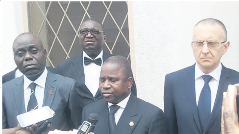
Le secrétaire général du PCT entouré de l'ambassadeur de Russie au Congo et du secrétaire général adjoint du PCT

de tout temps été très proches. A travers le monde, nous avons défendu la même cause, mené le même combat. Comme aujourd'hui, les amis de Russie se retrouvent dans cette situation dramatique, il est du devoir du PCT de venir dire sa solidarité et son soutien. Nous espérons que le peuple russe sortira de cette épreuve très fort et plus vigilant. Parce que le combat