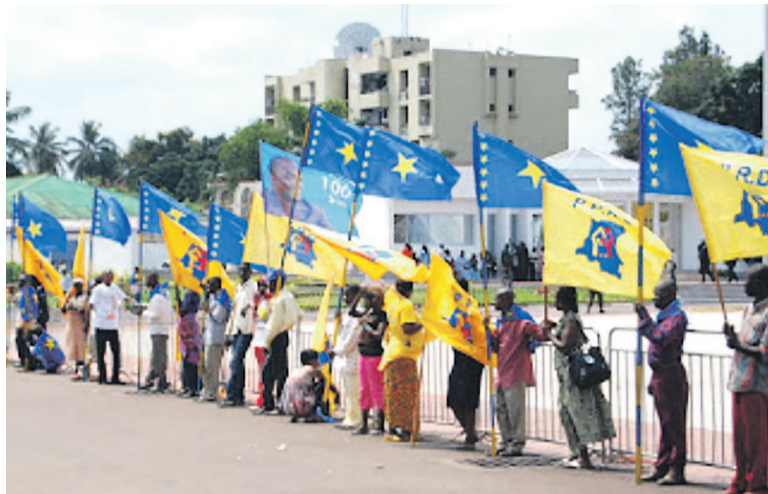
Les partis de la MP lors d'une manifestation à Kinshasa

Selon le sondeur, le Palu prend la tête de file des partis politiques regroupés aux seins de la majorité présidentielle suivi de la Convention des Congolais unis de Lambert Mende Omalanga et du Parti du peuple pour la reconstruction et la démocratie font respectivement 17%. Le parti Eveil de la conscience pour le travail et le développement de Felix Kabange Numbi arrive à la quatrième marche avec 8% et se fait suivre de l'Alliance des forces démocratiques du Congo de Bahati Lukwebo qui totalise 6%. Avec 3%, le Congrès national congolais de Puis Mwabilu clôture la liste des partis ayant réalisé plus de 1%. Au niveau de l'opposition institutionnelle où l'on retrouve l'opposition républicaine, l'UFC de Léon Kengo wa Dondo s'arrose un total de 77% contre 4%