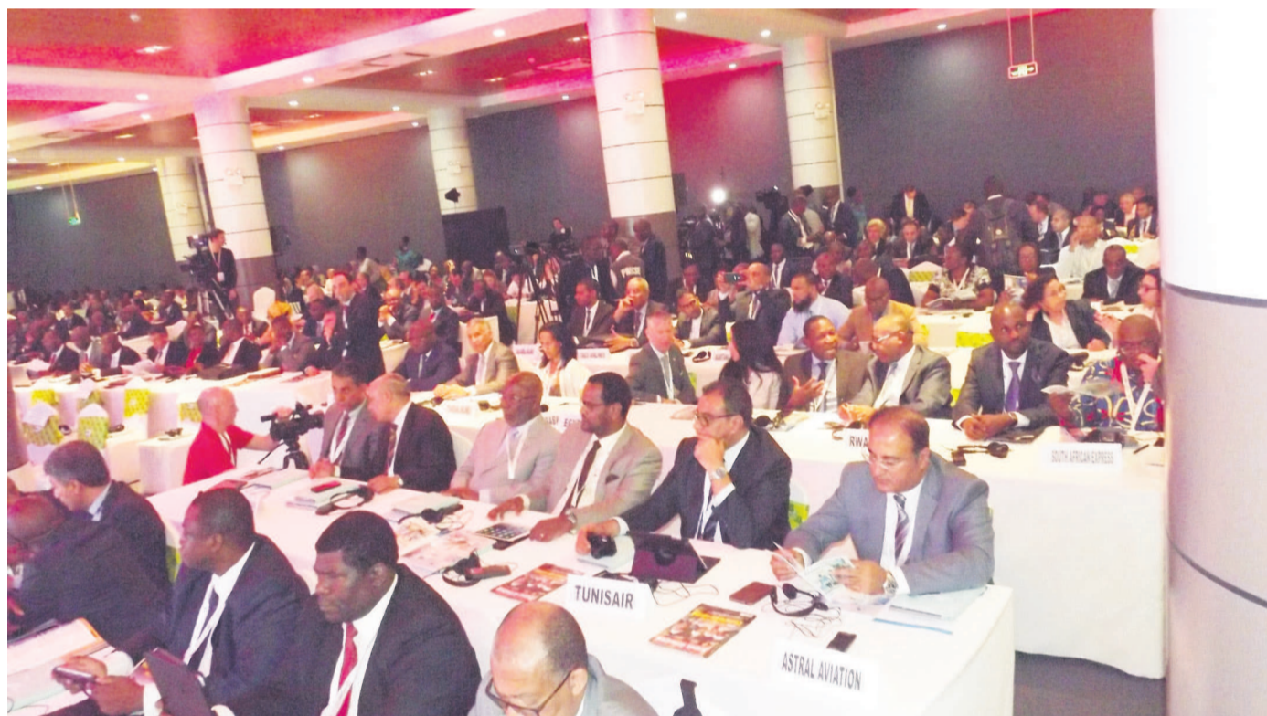
Les experts lors des travaux