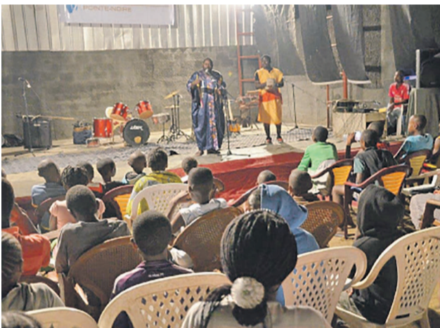
Le public à Yaro suivant un spectacle de conte

La grande innovation à l'espace culturel Yaro dans le 4 e arrondissement Loandjili, dans la ville océane, en cette rentrée artistique est la programmation le 17 novembre du colloque animé par l'économiste et ethnologue malien, Many Camara, il y a 7 ans à Angers en France.