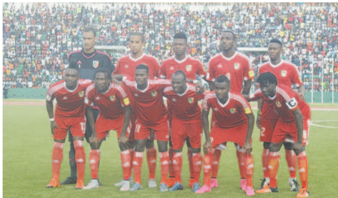
Les Diabes rouges du Congo qualifiés pour la phase de poules des éliminatoires