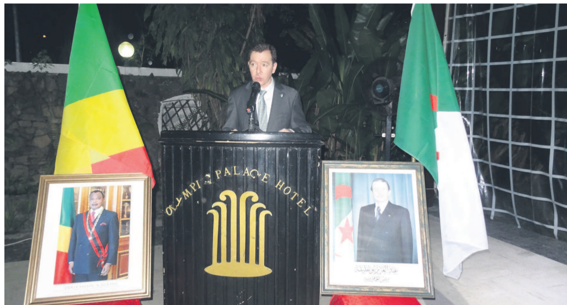
L'ambassadeur d'Algérie prononçant son discours

années 70 et 80, devraient, a-t-il précisé, connaître un essor certain et ce, « à la faveur de la re-