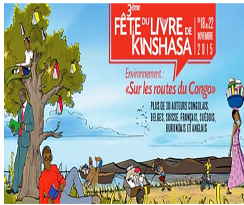
L'affiche annonce de la troisième fête du livre

Répertorié pour la première fois parmi les huit sites qui vont accueillir la troisième édition de l'évènement qui ouvre ses portes ce 18 novembre, le cadre de Masina sans fil sera dans l'ambiance des festivités dès le lendemain à partir de 11 heures.