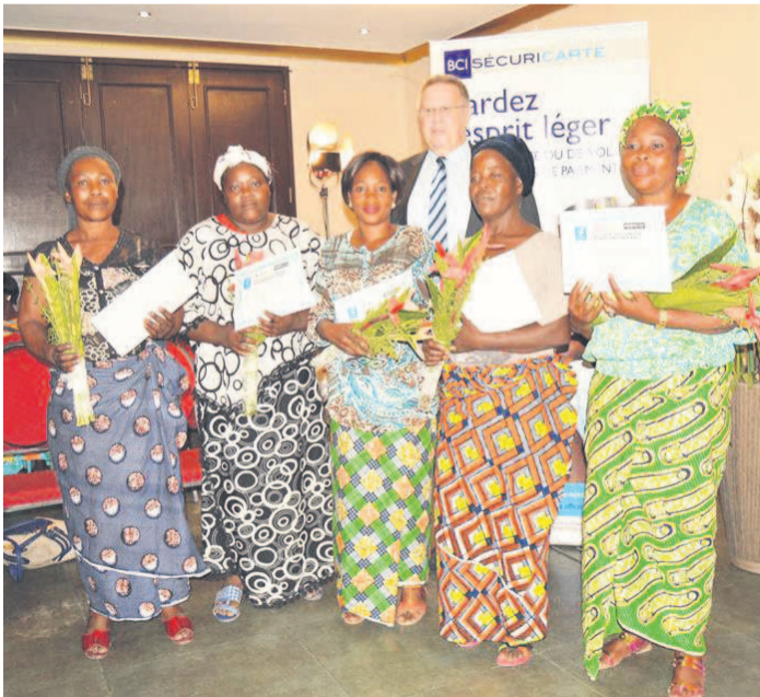
Les cinq femmes bénéficiaires d'un diplôme de transformation de manioc

La quatrième édition aura lieu en octobre-novembre