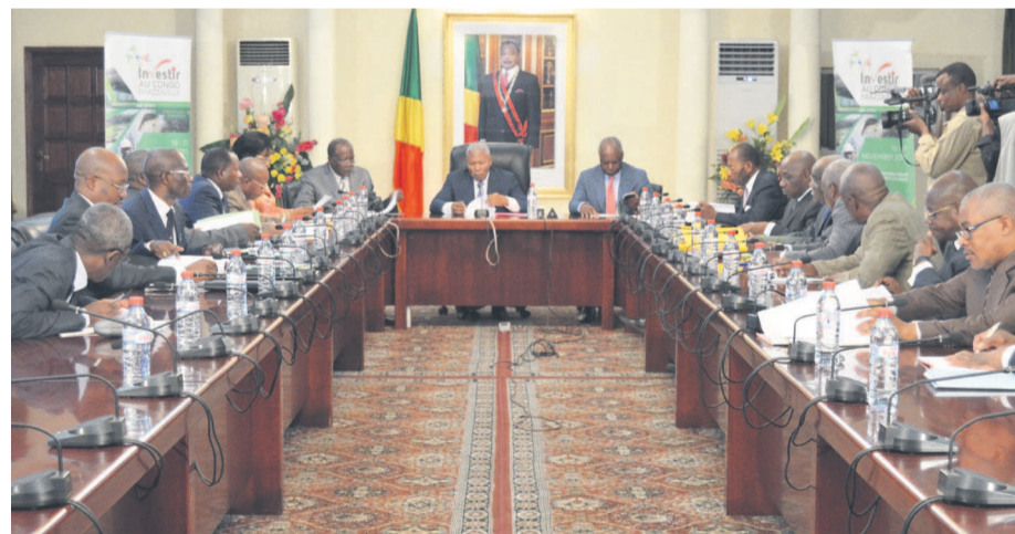
Une vue des participants lors de la réunion du conseil national du crédit

Le gouvernement avait déclaré que l'année 2015 serait celle de l'entrepreneuriat. Pour concrétiser ce défi, il se tiendra du 19 au 20 novembre le forum Investir au Congo Brazzaville.