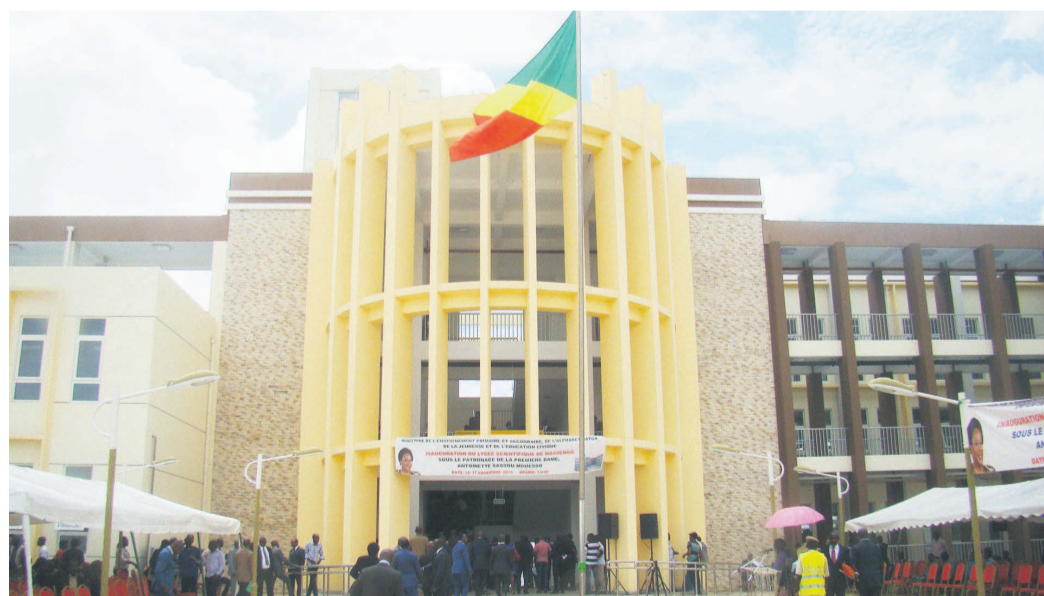
Une vue de la façade principale du lycée scientifique de Massengo

Dédié essentiellement à la formation des élèves des séries scientifiques, le lycée de Massengo, dans le 9 e arrondissement, Djiri, a ouvert officiellement ses portes hier en présence de quelques membres du gouvernement conduits par le ministre de tutelle, Anatole Collinet Makosso. L'établissement, un don du gouvernement chinois, offre d'excellentes conditions d'études à près de 3000 élèves repartis en deux vagues. « Un lycée scientifique est un