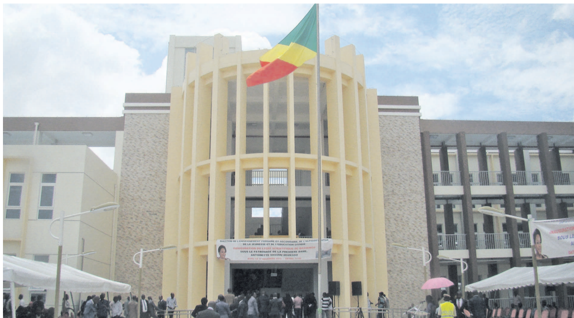
La façade du lycée

Selon le proviseur de cet établissement, Firmin Mougala, qui a présenté les caractéristiques techniques de l'ouvrage, outre les salles de classes, chaque palier dispose de deux salles de laboratoire pouvant accueillir quarante élèves. Concernant les laboratoires, ce lycée de Massengo en compte deux de biologie, cinq de chimie et cinq autres de physiques. Il est aussi érigé au 1 er et au 2 e niveau deux bibliothèques d'une capacité de 20 000 livres avec un système informatique de contrôles de sortie et d'entrée des ouvrages. « Que de bonnes conditions d'apprentissage! Pour des conférences animées aussi bien par les apprenants que par les enseignants, un amphithéâtre au rez-de-chaussée attend d'accueillir 165 élèves. Celui-ci est