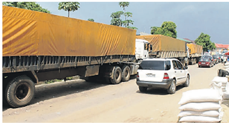
Des camions poids lourds

Dans cette action, les grévistes, par le président de leur organisation, André Tshikoj, dénoncent la mauvaise foi des employeurs des véhicules poids lourds qui, depuis trois ans, n'ont respecté aucun des engagements contenus dans ce document signé il y a près de trois ans déjà. «Les promesses faites par les patrons de ces entreprises de transport n'ont pas été tenues. Aucune avancée, pas d'augmen-