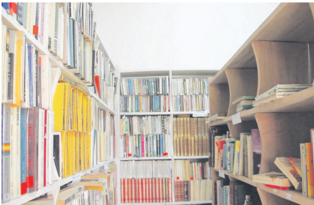
Une vue partielle de la bibliothèque publique de Kellé

Les autres orateurs qui lui ont succédé à la tribune ont salué son geste et l'ont encouragé. Ils sont revenus sur la nécessité pour un district d'être