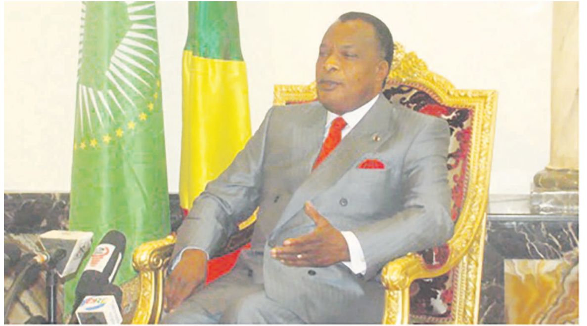
Le président de la République répondant aux questions de la presse au salon d'honneur de l'aéroport Maya-Maya

loin de ce que nous avons arrêté ici au niveau national, dans notre projet, le Chemin d'avenir.