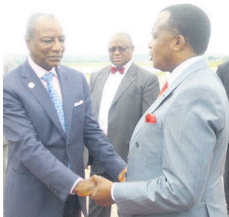
Denis Sassou N'Guesso et Alpha Condé

Alpha Condé : Vous savez que depuis quarante ans, nous avons les mêmes positions avec mon homologue congolais, Denis Sassou N'Guesso et nous pensons que la Chine est une chance pour l'Afrique et vice versa. Le président chinois a promis à l'Afrique, outre les 60 milliards de dollars, des partenariats stratégiques très bénéfiques pour les deux parties. Nous sommes sortis très contents de ce sommet. Il reste aux africains de s'entendre pour privilégier des projets interrégionaux qui vont