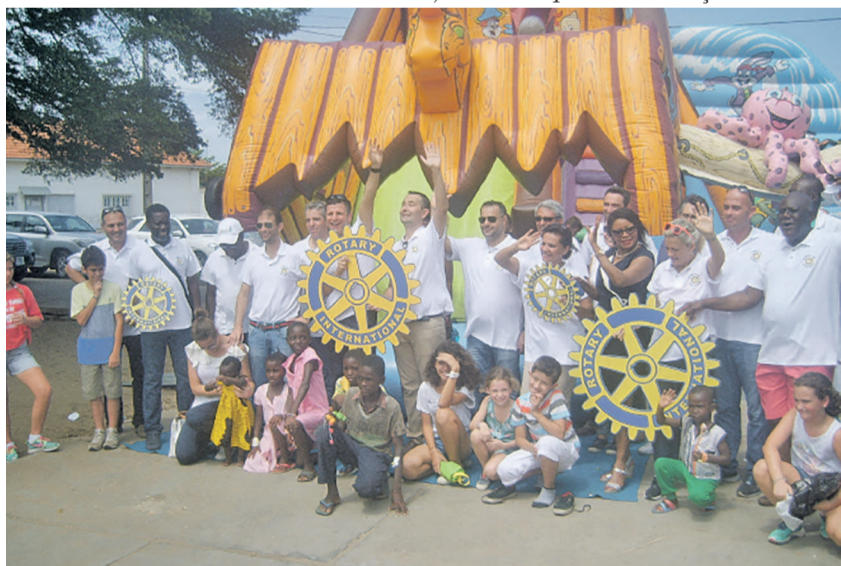
Les membres du Rotary club doyen et les enfants.

Apporter la joie aux enfants malades est la symbolique de ce geste d'amour et de cœur que le Rotary club doyen de la ville océane a fait à l'endroit des enfants malades à l'hôpital général Adolphe-Sicé. « Les rotariens et rotariennes