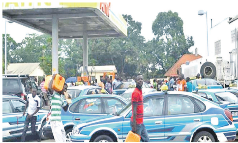
< Sans données à partir du lien >

À l'entendre, cette situation serait occasionnée par une panne survenue au niveau de la Congolaise de raffinage (Coraf). « Les travaux sont en cours de réalisation jusqu'en ce mois de décembre, période probable de fin des travaux et de démarrage des activités de raffinage. A la suite de cela, les approvisionnements programmés ont été effectués,