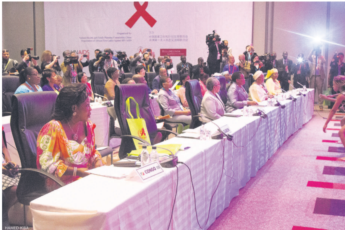
Une vue des premières dames d'Afrique

En marge du Forum de coopération Chine-Afrique, tenu du 4 au 5 décembre dernier à Johannesburg, en Afrique du Sud, l'Organisation des premières dames d'Afrique contre le sida (OPDAS) et l'épouse du chef de l'Etat Chinois, Peng Liyuan se sont réunies en parallèle pour mettre en place des politiques fiables pouvant contribuer à la réduction de nouvelles infections à VIH/Sida.