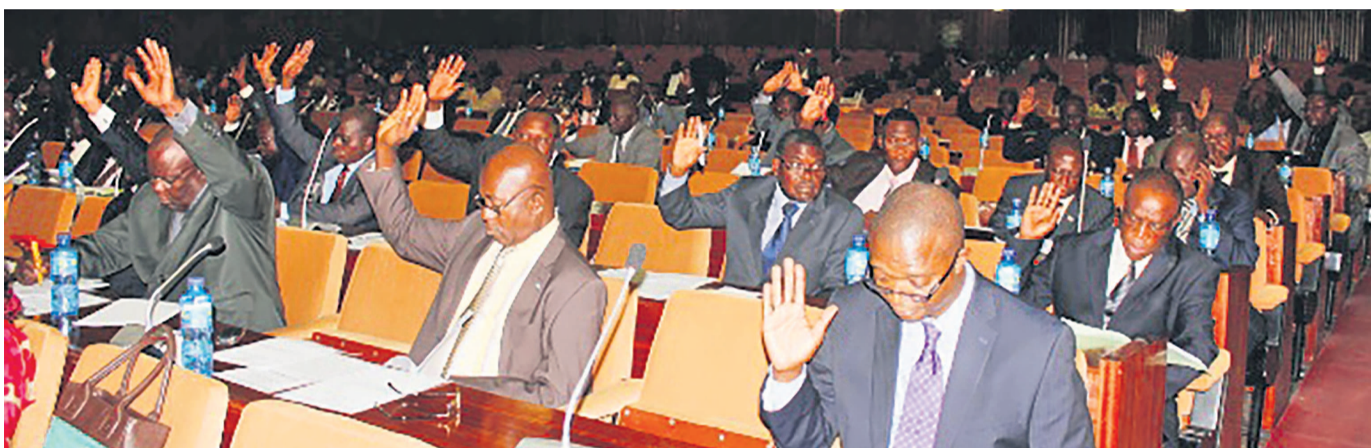
Des députés nationaux au cours d'une plénière

Une cinquantaine de députés ont signé une pétition demandant le départ du gouvernement du vice-Premier ministre et ministre de l'Intérieur et de la Sécurité, à en croire BBC/Afrique. Principal artisan de la