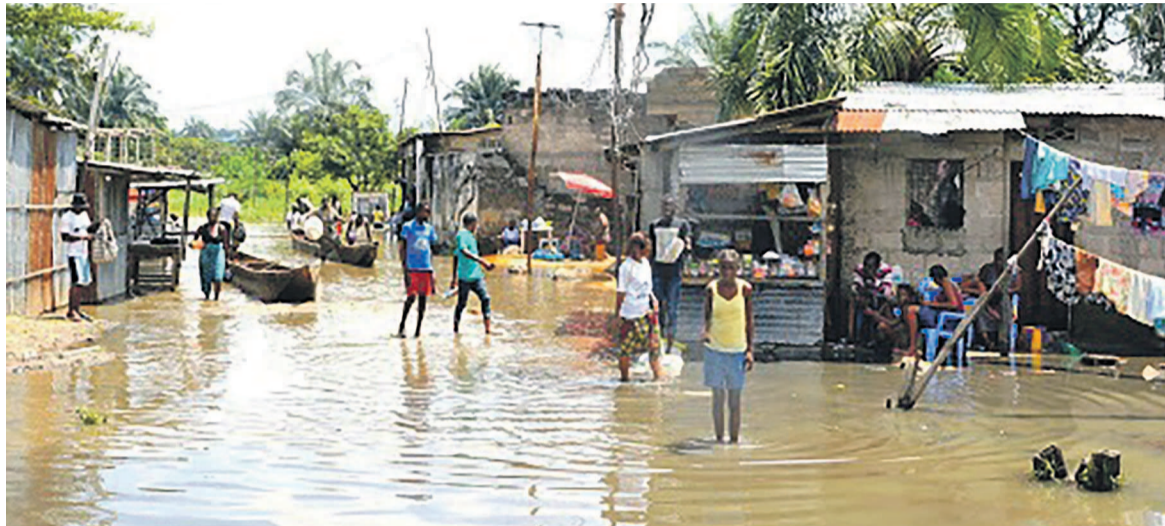
Le quartier Maziba, dans la commune de Matete, après la pluie

A l'opposé, dans la périphérie ouest, des éboulements des terres entraînant des fortes érosions