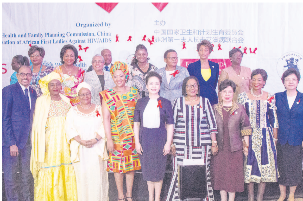
Photo de famille des premières dames