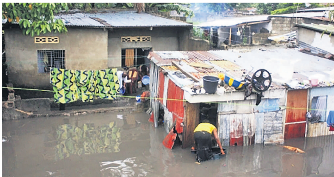
Des maisons inondées après les dernières pluies à Kinshasa

De nombreuses familles kinoises passent la nuit à la belle étoile à la suite des pluies qui s'abattent sur la capitale depuis cinq jours. Au quartier des Marais dans la commune de Matete, la rivière Ndjili a débordé de son lit au grand désarroi des personnes habitant dans ces périmètres. Au quartier Mososo dans la commune de Limete, les eaux de pluie ont atteint des niveaux impressionnants jusqu'à engloutir de nombreuses maisons.