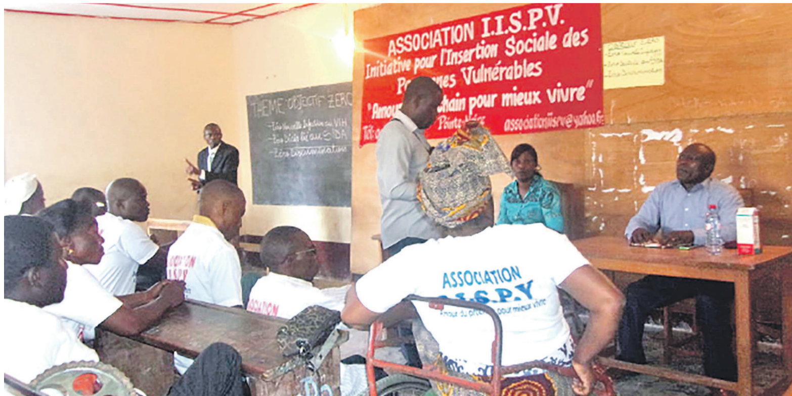
Une vue de la salle pendant la cérémonie «adial»