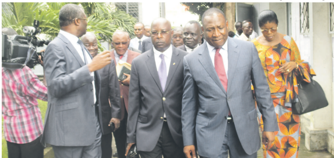
La délégation des députés en visite au ministère de la Fonction publique

« Nous n'arrivons pas à travailler parce que les conditions ne nous le permettent pas. Les dossiers sont entassés à même le sol. 70 personnes travaillent sur 30 chaises. C'est vraiment impossible qu'on travaille dans