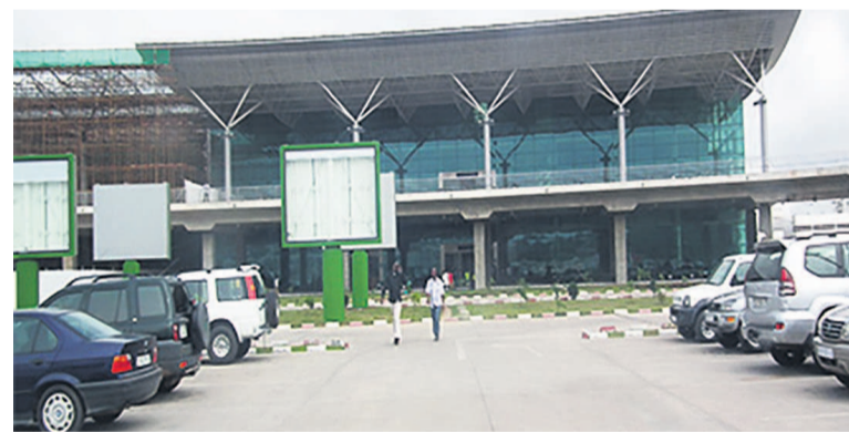
Façade principale de l'aéroport Maya-Maya