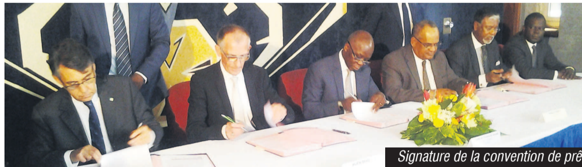
Signature de la convention de prêt

La société Aérco (Aéroports du Congo) vient de contracter, auprès des partenaires financiers, un prêt global de 18 milliards FCFA pour lui permettre d'engager des travaux de modernisation des aéroports de Brazzaville, Pointe-Noire et Ollombo qu'elle gère.