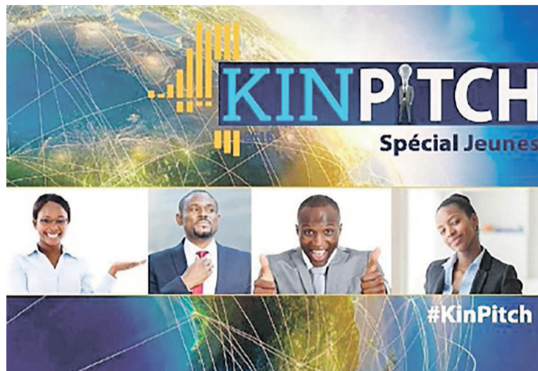
L'affiche du KinPitch

L'activité se déroulera durant le Kinshasa international forum 2016 (KINFOR) prévu pour les 26 et 27 janvier 2016 et organisé par l'ASBL Africa Rise.