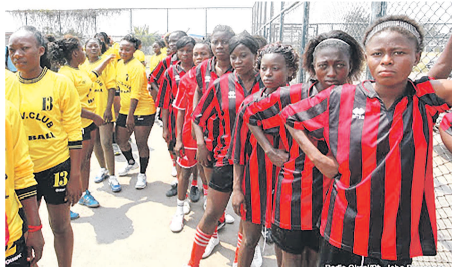
Des clubs de basket-ball dames à Kinshasa

Le BC INSS a été battu par Dolphins du Nigeria en match de la cinquième place alors que BC Radi s'est inclinée face à INSJ du Cameroun en match de la sixième place de cette compétition de basket-ball dames organisée en terre angolaise.