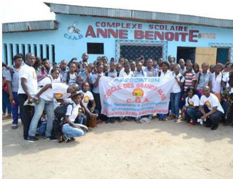
Les membres du CGA et les élèves du complexe scolaire Anne-Benoîte

Les jeunes du Cercle des grands amis (CGA), une association juvénile à caractère socio-humanitaire et environnemental ne sont pas restés en marge de la célébration de la journée mondiale de lutte contre le Sida. Ils ont réalisé une activité de sensibilisation au profit des élèves du collège du complexe scolaire Anne Benoîte de Diata dans le premier arrondissement de Brazzaville.