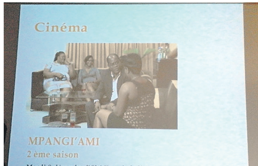
Annonce du lancement de Mpangi'ami saison 2

Une grande soirée TV-cinéma est organisée ce 8 décembre à 19h à l'Institut français (IF) autour de deux épisodes inédits de la série congolaise en prélude à sa prochaine diffusion sur TV5 Monde prévue pour le 13 décembre.