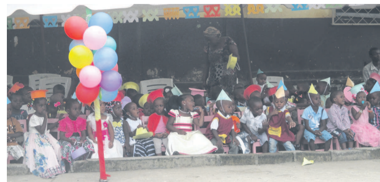
Une vue des enfants du Complexe la pouponnière crèche/garderie de Makélékélé