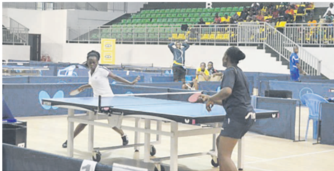
Une rencontre remportée par la pongiste de Brazzaville

Par équipe, les athlètes de la ville capitale ont remporté les deux premiers matchs qu'ils ont livrés en versions hommes et dames. La compétition se poursuit.