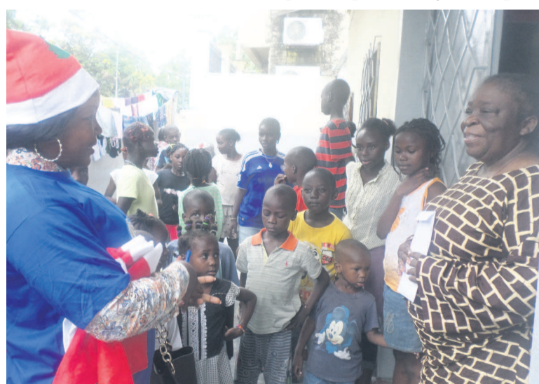
Une déléguée des travailleurs de la société Ragec s'entretenant avec une mère de famille

Au terme de cette ronde, le directeur général de la société