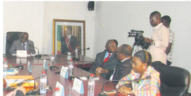
Les administrateurs de la SNE lors des travaux

Malgré le bilan 2015, qu'il a jugé positif, le conseil d'administration a formulé quelques recommandations. Il demande au directoire de la SNE de présenter la situation détaillée de l'endettement de la société, concernant la dette fiscale et celle des fournisseurs. Par ailleurs, le conseil exige