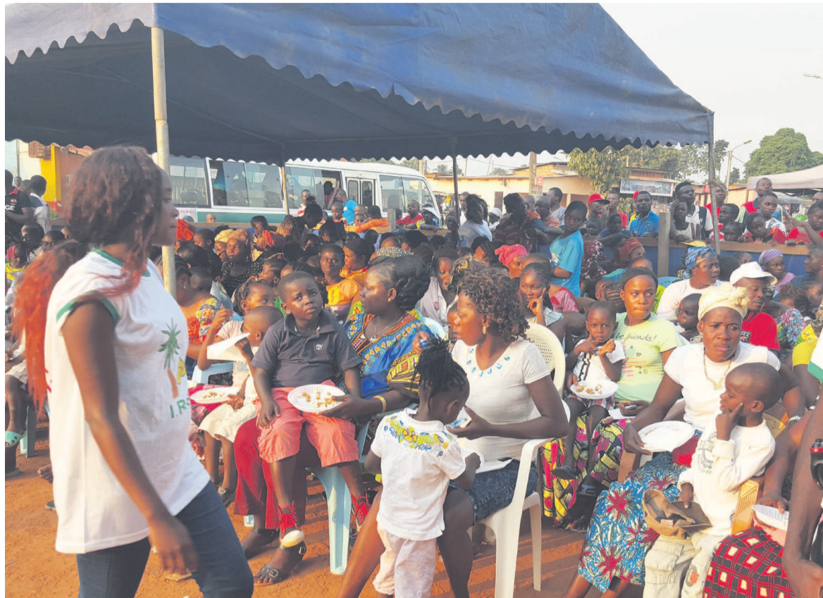
Idées et Rêves pour la Sangha a réuni plus de 2000 enfants à la place Rouge de Ouesso

Dans la perspective des festivités de la fête de Noël célébrée le 25 décembre de chaque année, l'Association « Idées et rêves pour la Sangha » a remis le 19 décembre à la place Rouge de Ouesso, 3000 jouets à plus de 800 familles des deux arrondissements de la commune.