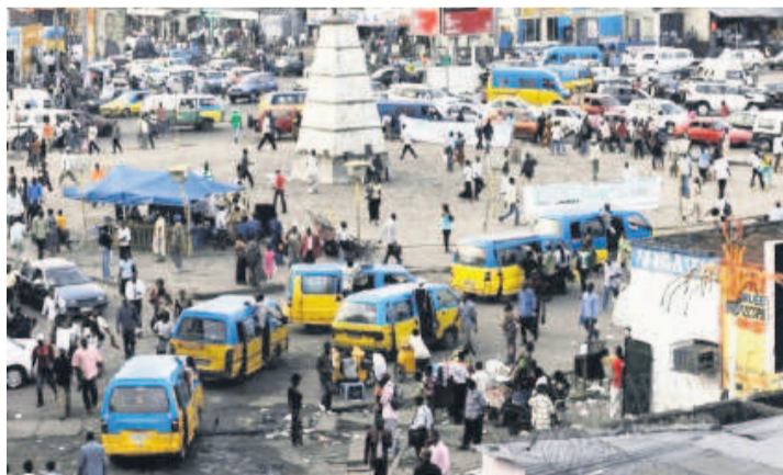
Forte affluence à la Place Victoire avant sa réhabilitation

Les six principaux pays d'origine des migrants sont la Somalie, le Burkina Faso, le Soudan, la RDC, le Nigéria et la Côte d'Ivoire. Au total, renseigne le rapport, l'on a compté en 2015 un peu plus de 23 millions de migrants originaires d'Afrique subsaharienne. 26% d'entre eux vivaient dans les pays de l'OCDE tandis que la grande