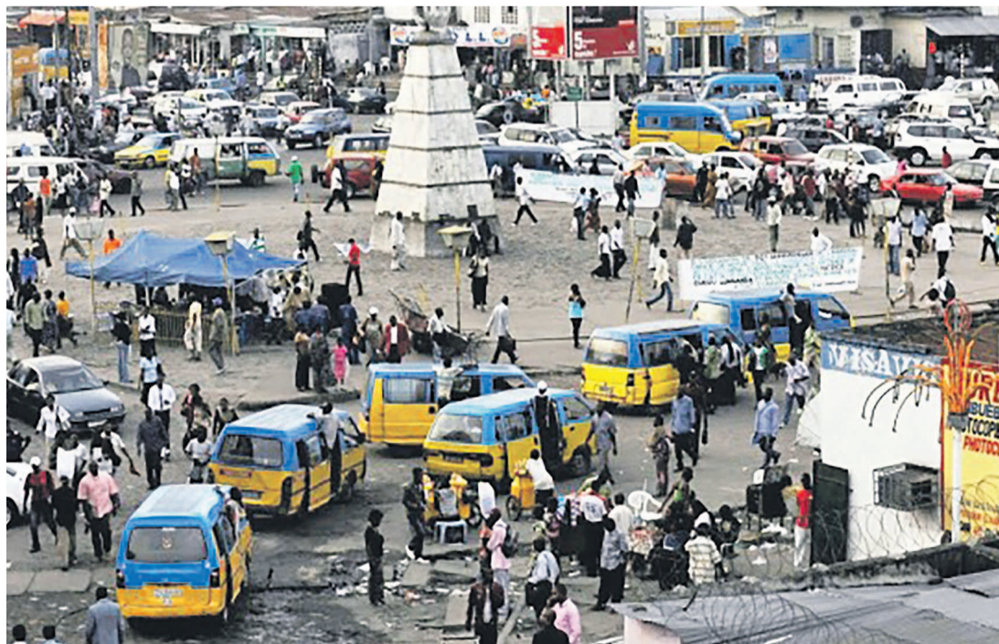
Forte affluence à la Place Victoire avant sa réhabilitation