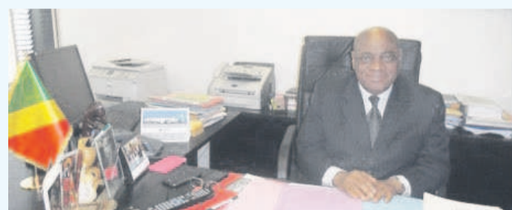
Jean-Marie Adoua, ambassadeur du Congo auprès de l'UNESCO désormais », a confié le président du CRAN.

A cette occasion, le président du CRAN a prononcé une allocution devant les ambassadeurs du groupe africain de l'Unesco en leur proposant d'adopter, à l'unanimité, un texte ou une résolution demandant que les pays membres, possesseurs de biens mal acquis, s'engagent dès maintenant dans un processus d'inventaire et de restitution. Remerciant les ambassadeurs du Congo et du Bénin qui ont rendu possible cette audition,