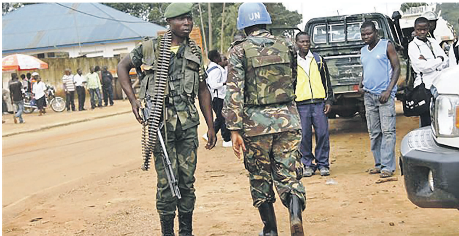
Un soldat des Fardc et un élément de la Monusco en train de déviser

De passage récent dans les territoires de Beni et Butembo (Nord-Kivu), le président de la République serait, à en croire le gouverneur du Nord-Kivu, Julien Paluku, ouvert à la relance des opérations conjointes entre l'armée congolaise et la Monusco pour neutraliser les rebelles ougandais des Forces démocratiques alliées (ADF).