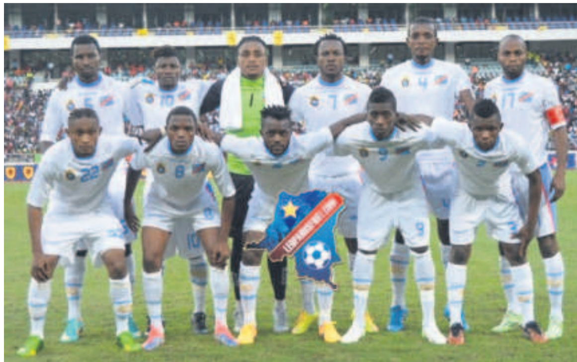
Les Léopards locaux de la RDC

Trente-deux joueurs ont été convoqués par le sélectionneur des Léopards en vue de préparer la phase finale de la 4e édition du Chan, compétition de la Confédération africaine de football (CAF) réservée aux sélections nationales africaines composées des joueurs évoluant dans leurs championnats nationaux respectifs. C'est le 22 décembre que le patron du staff technique national a rendu publique cette liste des présélectionnés pour ce tournoi continental prévu du 16 janvier au 7 février 2016 au Rwanda. Parmi les joueurs appelés, on compte onze joueurs de l'AS V.Club, club entraîné par Florent Ibenge, cinq du Daring Club Motema Pembe (DCMP) coaché par son adjoint Mwinyi Zahera, quatre joueurs du TP Mazembe de Lubumbashi récent vainqueur de la Ligue des champions. Il y a également quatre joueurs du FC Renaissance du Congo, actuel