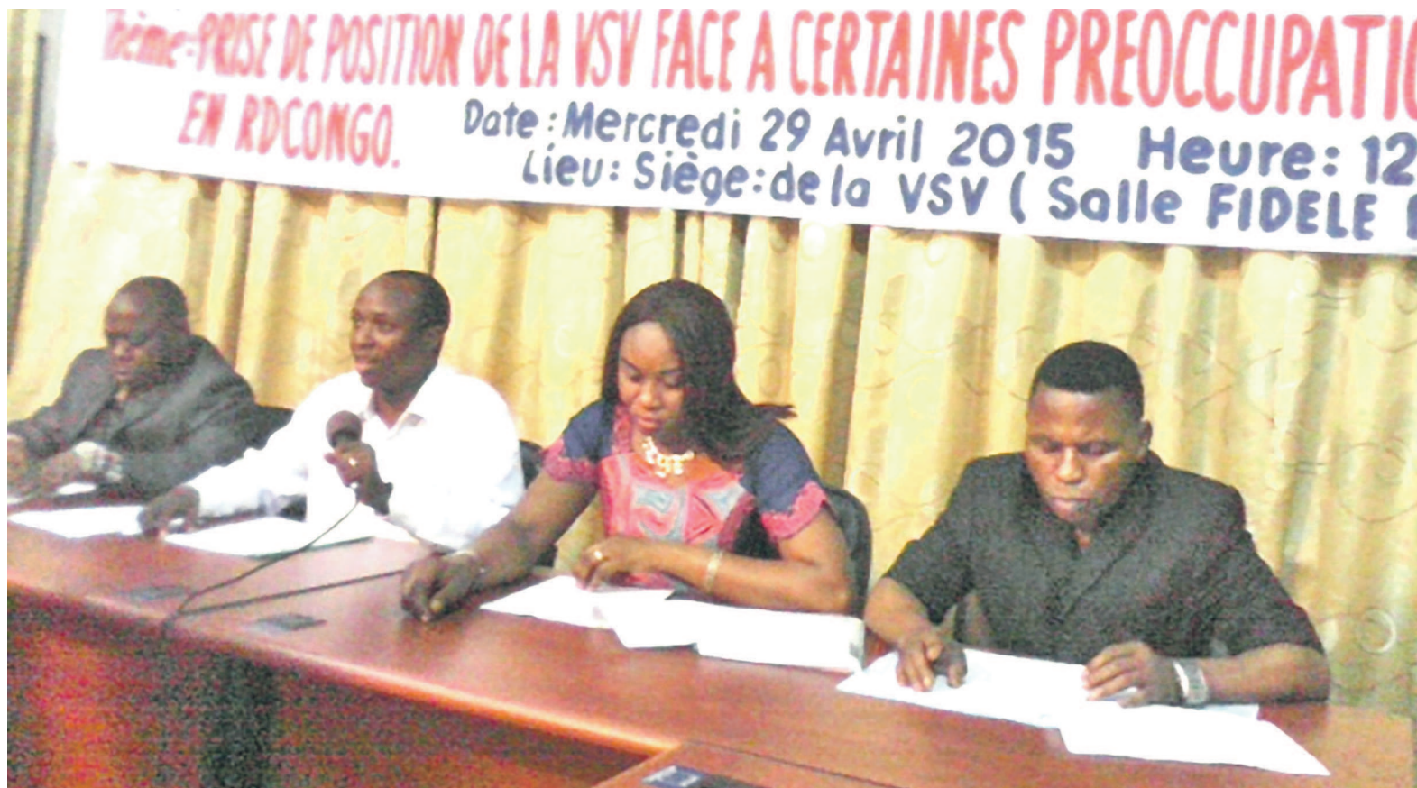
Des membres du directoire de la VSV lors d'un point de presse au siège de l'ONG

Selon la Voix des sans-voix pour les droits de l'homme (VSV), il serait souhaitable que tous les acteurs de l'opposition politique prennent une part active au dialogue national, si ce dernier n'a réellement pour objectif que l'organisation d'un processus électoral apaisé, complet, inclusif et crédible, comme repris dans l'ordonnance signée par le président de la République, en respectant la Constitution de la RDC et l'alternance politique en 2016. « La VSV invite les acteurs politiques de l'opposition qui, pour des raisons tout à fait légitimes, hésitent encore à rencontrer le facilitateur, le moment venu, de ne pas commettre l'erreur de décliner d'éventuelles invitations adressées à eux par ledit facilitateur mais plutôt de rencontrer ce dernier, de l'écouter et, à l'occasion, de présenter leur cahier des charges consécutives au respect strict de la Constitution », a