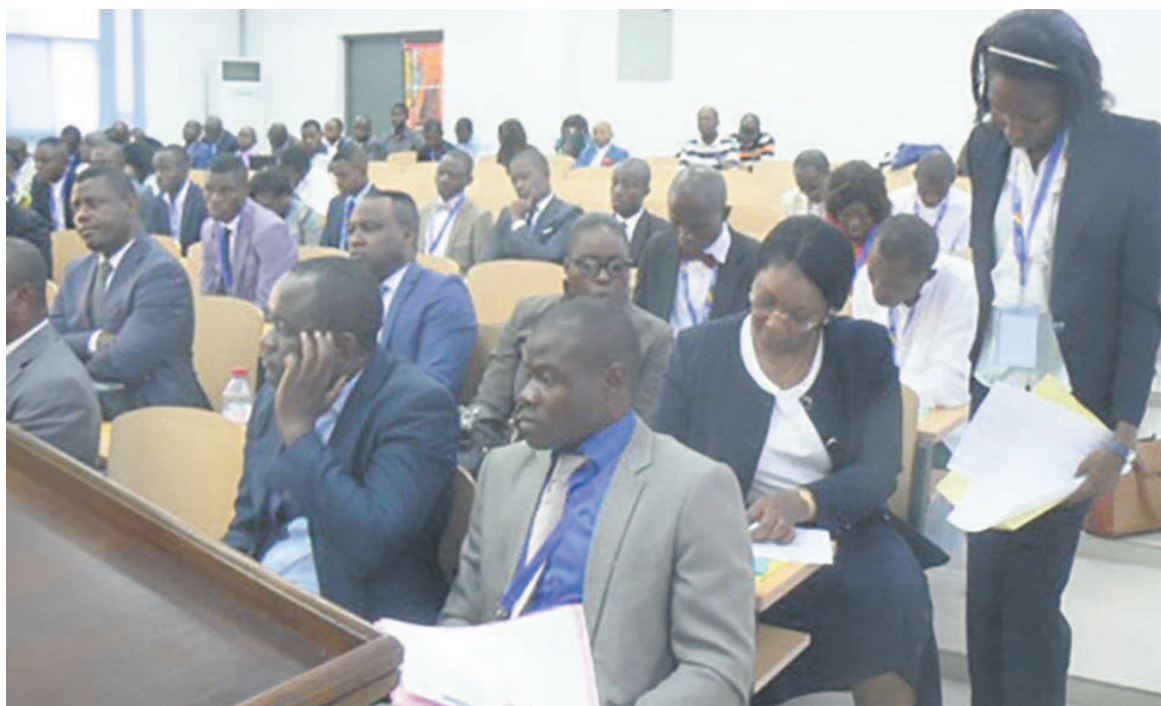
Les participants à la première journée d'étude de la Société Congolaise pour le Droit International (Scdi)

culturel, la relation Congo-ONU est marquée par sa coopération avec le Programme des Nations unies pour le développement (PNUD), la promotion du statut de la femme, la surveillance des traités aux droits de l'homme, l'apport des Nations unies dans la construction du droit pénal congolais et la réception du droit onusien dans l'ordre juridique congolais.