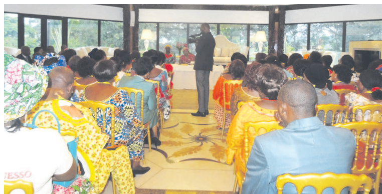
Les femmes s'entretenant avec l'épouse du chef de l'Etat.

toinette Sassou N'Guesso. Comme toutes les autres forces sociales et politiques, les associations féminines de développement ont accompagné leur appel d'une contribution