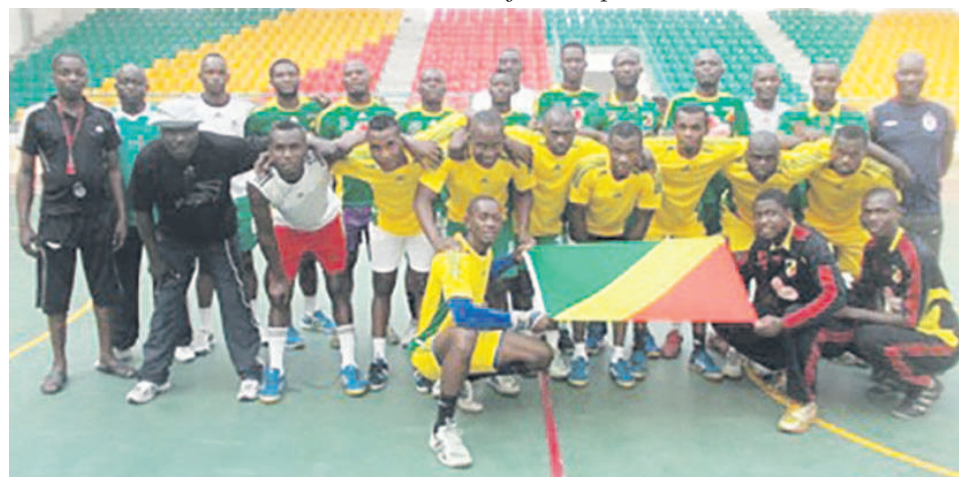
Les Diables rouges du Congo

Après la RDC, les Diables rouges vont, tour à tour, en découdre avec le Kenya, le 22 janvier après la cérémonie d'ouverture. Le