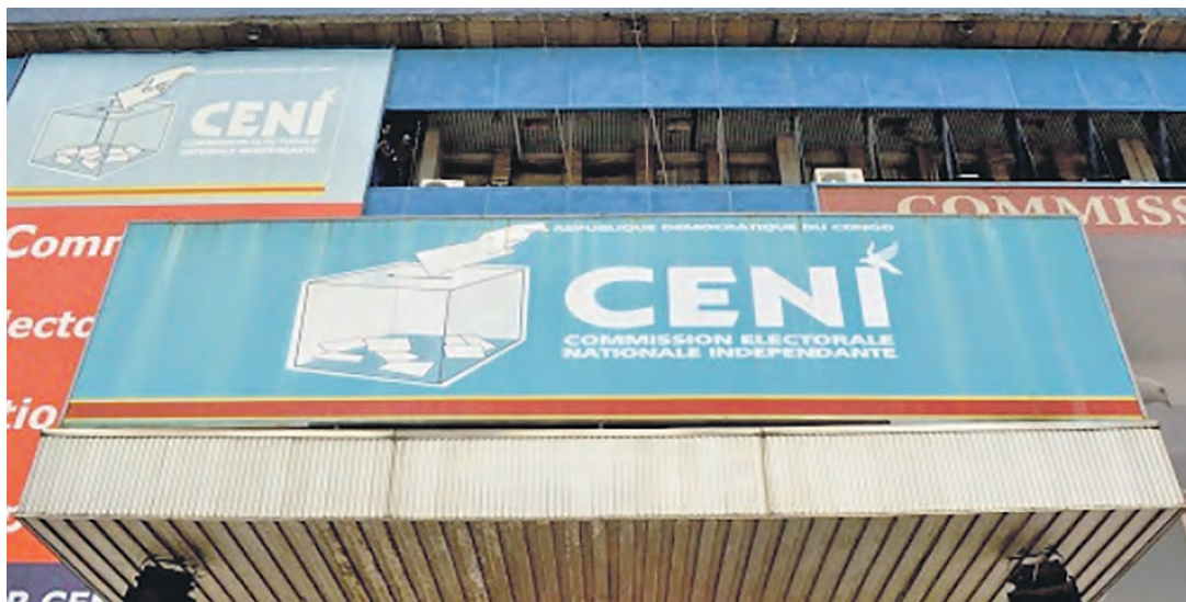
Le siège de la Céni

Après moult atermoiements, la Commission électorale nationale indépendante (Céni) se dit être en mesure de lancer les opérations de révision du fichier électoral qui débutent d'ici le 10 février par la publication d'un avis d'appel d'offres à l'endroit des fournisseurs du matériel électoral. Cette opération devrait, en principe, booster le processus électoral en RDC dont la poursuite dépend de la révision du fichier électoral. C'est non sans raison que le président de la Céni, Corneille Naanga, a toujours insisté sur l'impératif de cette opération sans laquelle le respect du délai constitutionnel pour les prochaines élections ne sera qu'un vœu pieux. L'option de lancer cette révision du fichier électoral découle d'une réunion tripartite tenue le 28 janvier entre le gouvernement, la Céni et les bailleurs de fonds. La réunion a permis de donner « des indications claires en termes d'engagements de chaque partie », mais aucune n'a donné d'indication précise sur la teneur chiffrée de ses engagements.