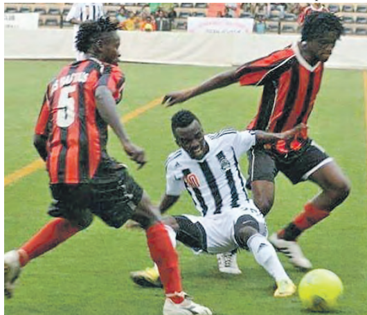
Vue d'un match entre Mazembe et AS Bantous (archives)

Le TP Mazembe de Lubumbashi ne repartira de la