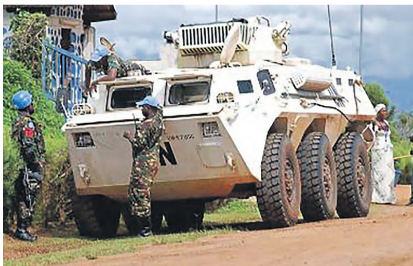
Un engin blindé de la Monusco