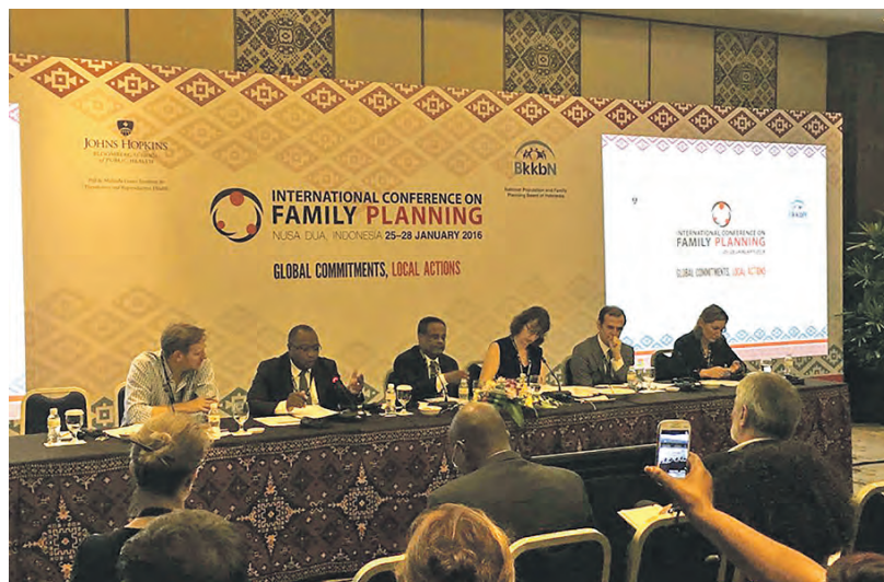
Le ministre de la Santé dans un panel

Le ministre de la Santé publique, le Dr Félix Kabange Numbi, prend part à cette conférence ouverte le 25 janvier à Nusa Dua à Bali.