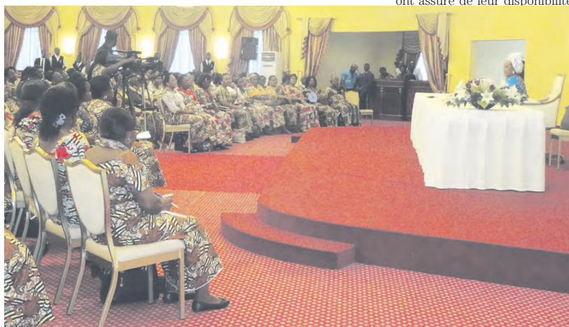
Antoinette Sassou N'Gusso s'adressant aux femmes