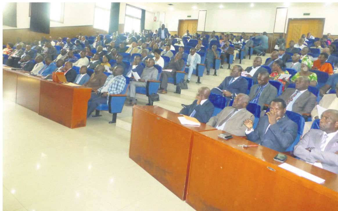
Les représentants des partis et de la société civile

précisé, en outre, que les candidatures individuelles à la CNEI seront rejetées. « Nous attendons les propositions des groupements, des partis politiques et de la société civile impliquée dans le processus