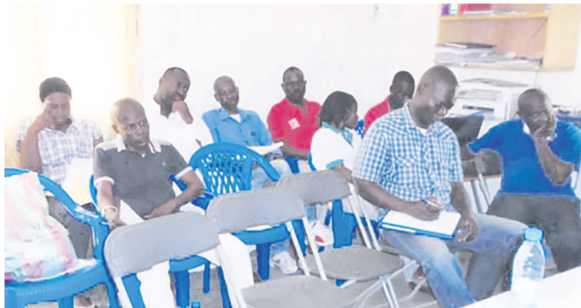
Les membres de la Ligue de Brazzaville en réunion inaugurale

Le problème du manque d'équipes, des joueurs et des arbitres de qualité sont autant de défi qu'ils souhaiteraient résoudre dans l'urgence. La ligue a promis aller au déla en apportant le soutien aux équipes en création et ce afin d'accroître le nombre des clubs à Brazzaville. Dans son programme d'activités qu'ils