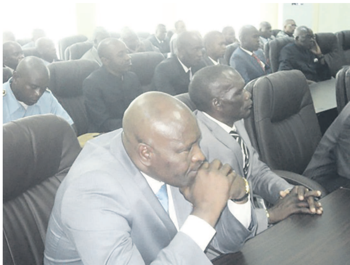
Les cadres attentifs à la communication du ministre

Au niveau de la CRF poursuit-il, des directives ont été données afin