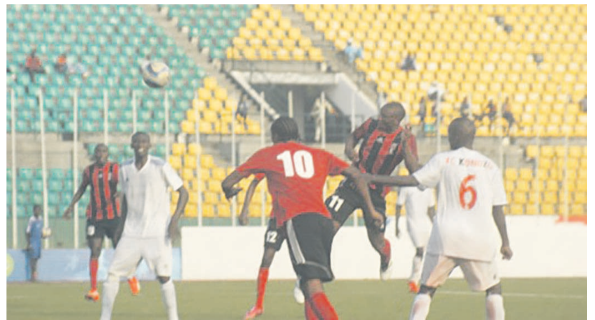
Les joueurs de Cara à l'assaut des buts du FC Kondzo

Le Club athlétique renaissance aiglon (Cara) a manqué, le 2 février, une occasion de prendre provisoirement la tête du championnat vingt-quatre heures avant la rencontre des Diables noirs (18 points) face à la Jeunesse sportive de Poto-Poto.