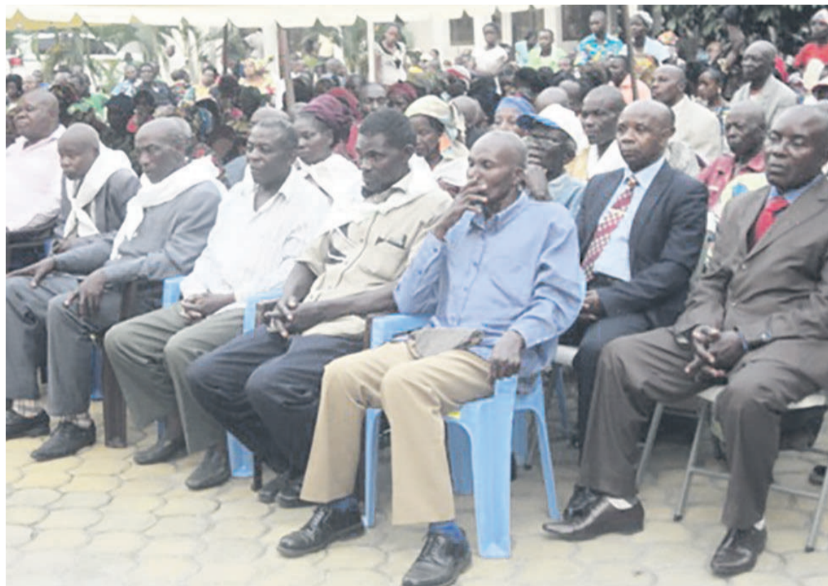
Une vue de la population de Djambala

Le soutien au président de la République a été le même à Djambala qu'à Lékana, où des femmes regroupées au sein d'une association dénommée « Les douze terres de Lékana », profitent de cette occasion pour présenter également leurs doléances: « Monsieur le ministre, tous les sages de Lékana vous chargent d'aller dire au président Denis Sassou N'Guesso que notre population est derrière lui. Nous vous chargeons également de lui dire de penser à nous dans les domaines de l'électricité, l'adduction d'eau potable et