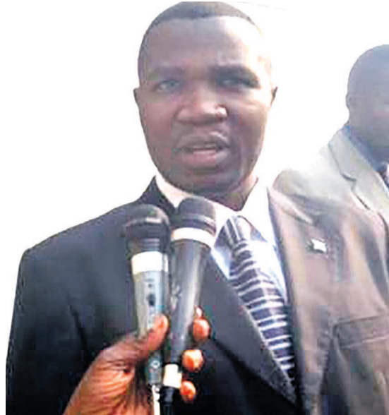
Le gouverneur du Nord-Kivu Julien Paluku

Cette réouverture de la frontière a réjoui toute la population de Goma et, particulièrement, les commerçants dont les affaires ont subi l'effet de la fermeture décrétée en 2013 à la suite du différend sécuritaire