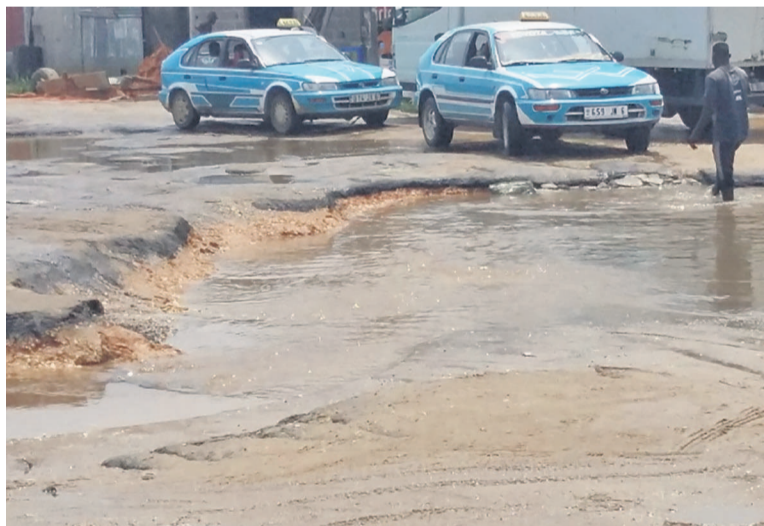
Le trou au coin du marché sur l'avenue Jean-Félix-Tchicaya

Depuis près de trois semaines, voire un mois, des grincements de dents et lamentations des vendeurs, acheteurs et tous ceux qui fréquentent ce deuxième marché, c'est-à-dire celui de l'OCH