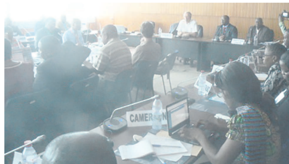
Échange direct entre membre du Réseau Africain des Registres du Cancer au siège de l'OMS Afrique à Brazzaville (adiac)

Par ailleurs, rappelons que du 08 au 17 février le cancer a été largement évoqué lors de la formation à l'enregistrement. Les points focaux des rencontres du 08 au 12 février 2016 ont porté par exemple sur l'échange d'expériences des pays sur la collecte, la saisie, l'analyse et l'utilisation des données relatives à la maladie