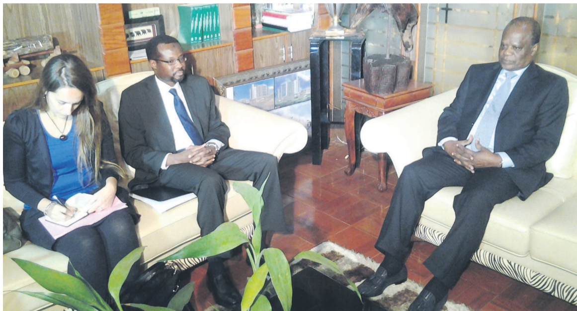
Le ministre de l'Économie forestière et le représentant de la BM lors de l'audience

Intervenant dans deux domaines essentiels de la forêt, notons que