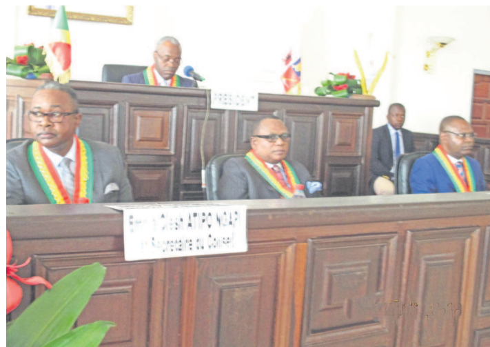
Les membres du bureau du Conseil départemental et municipal

Au terme de sa quatrième session ordinaire, le Conseil départemental et municipal de Brazzaville a décidé, entre autres, de supprimer les barrières de police, gendarmerie et douane sur la sortie sud de Brazzaville. Outre les délibérations, le Conseil a adopté le budget de la commune de Brazzaville au titre de l'exercice 2016. Il est arrêté en recettes et en dépenses à la somme de 32 milliards 053 millions 211 mille 350 FCFA.