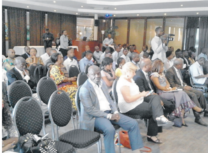
Une vue partielle de l'auditoire