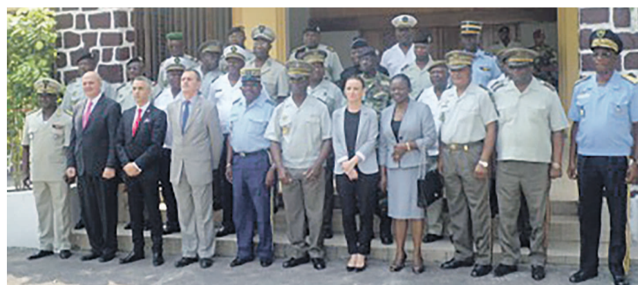
Les représentants de la Croix-Rouge et le haut commandement

Le chef d'état-major général des Forces armées congolaises a lancé, hier à Brazzaville, la formation de 167 militaires, gendarmes et policiers chargés de diriger les opérations de sécurisation de l'élection présidentielle du 20 mars prochain. Guy Blanchard Okoi qui a interpellé les membres de la force publique sur l'exigence de professionnalisme et le respect des normes, a estimé que la sécurité doit