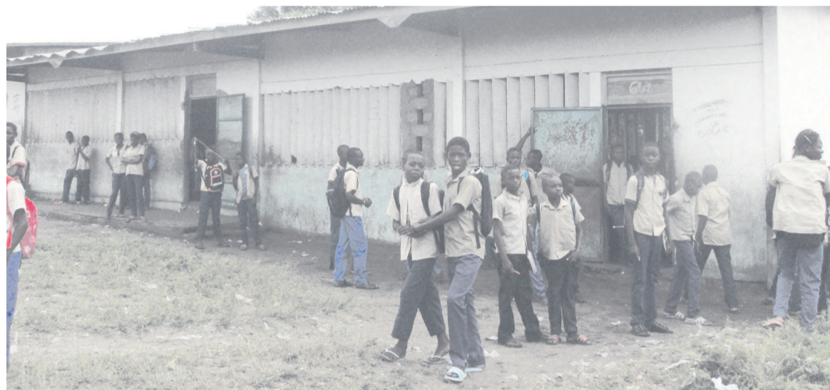
Une vue des élèves