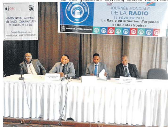
Le panel des orateurs de la Journée mondiale de la radio

diffusion des émissions non seulement en français mais aussi dans les quatre langues nationales que sont le swahili, le kikongo, le lingala et le ciluba ont renforcé le sentiment d'appartenance à une même nation ». Et, qui plus est, d'ajouter : « Pour coller au thème de cette année de la Journée mondiale de la radio, il faut rappeler que Radio Okapi a couvert, au cours de ces quatorze années, toutes les crises,