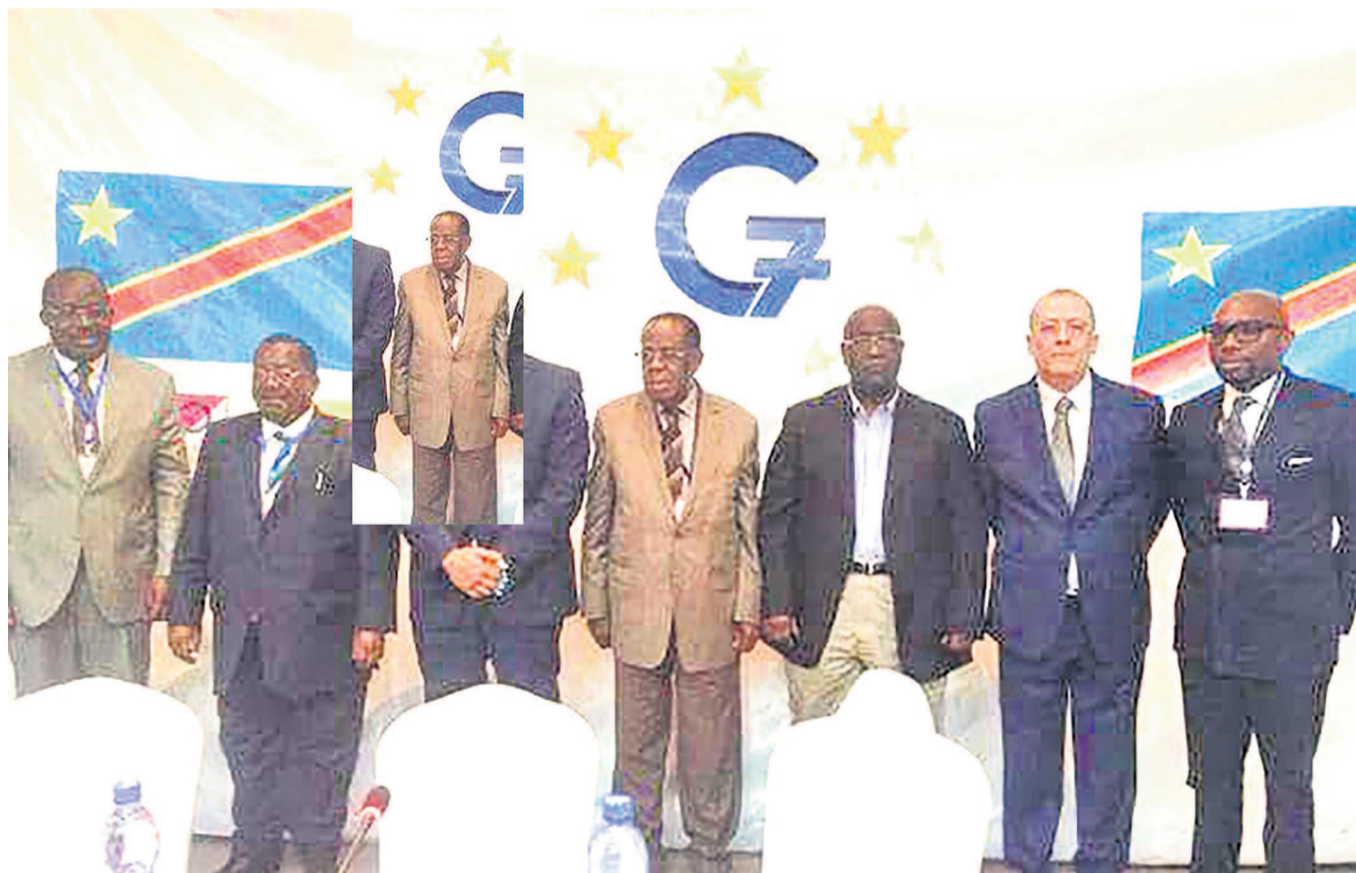
Les leaders du G7

La plate-forme des sept partis politiques exclus de la majorité présidentielle estime qu'un tel forum sera différent du dialogue prôné par le chef de l'État qui s'apparente, selon elle, à « une institution de légitimation » des objectifs et stratégies politiques de ceux qui sont au pouvoir.