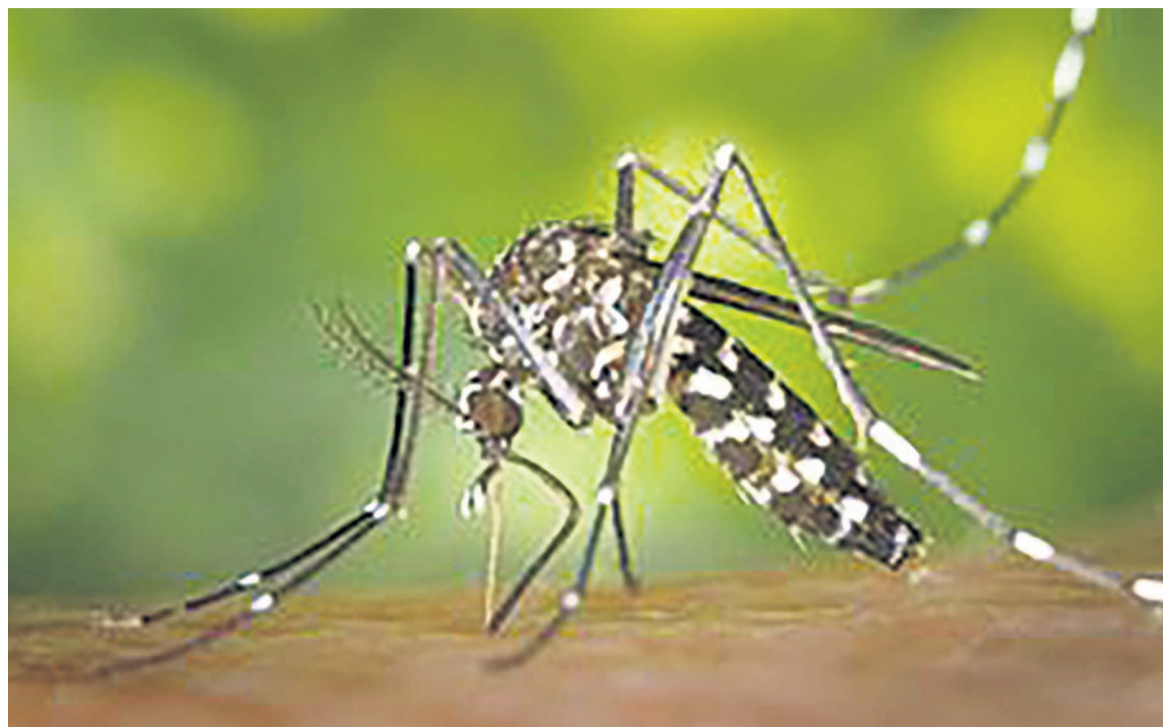
Le moustique du genre aedes, vecteur de la maladie à virus zika

Dans le cadre du nouveau programme d'urgence de l'OMS, un