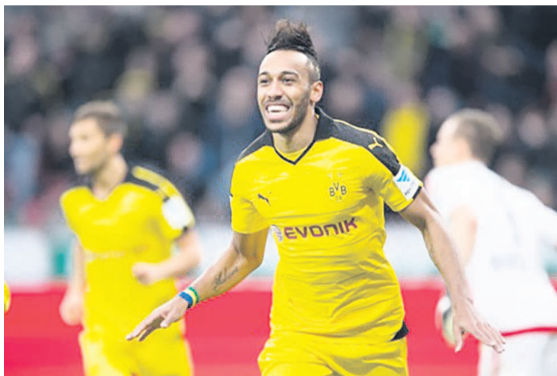
Le Gabonais Pierre-Emerick Aubameyang offre une courte mais précieuse victoire au Borussia Dortmund sur le terrain de Leverkusen

Pierre-Emerick Aubameyang a inscrit son 21 e but de la saison pour permettre à Dortmund de gagner (1-0) à Leverkusen, dimanche, au terme d'un choc marqué par une interruption de jeu historique en Bundesliga. En effet, le match a été interrompu une dizaine de minutes par l'arbitre après un échange virulent avec le coach de Leverkusen Roger Schmidt, qui estimait que le coup franc à l'origine du but d'Aubameyang (64 e ) avait été trop rapidement joué. L'officiel et ses assistants sont rentrés aux vestiaires et ne sont retournés sur la pelouse que neuf minutes plus tard, le temps pour Schmidt d'accepter son renvoi dans les tribunes. Avec 51 points, Dortmund (2 e ) revient à huit longueurs du leader, le Bayern Munich, vainqueur la veille de Darmstadt (3-1), après la 22 e journée. Notons la prestation remarquable de Thomas Müller, auteur d'un doublé, et le but du Polonais Lewandowski, qui reste ainsi en tête du classement des buteurs avec 22 unités. Mais le fait marquant est l'entrée en jeu de Franck Ribery, qui n'avait plus foulé la pelouse de l'Allianz Arena depuis près d'un an : trente-cinq minutes de jeu et une passe décisive ponctuée la bonne soirée de l'ancien international