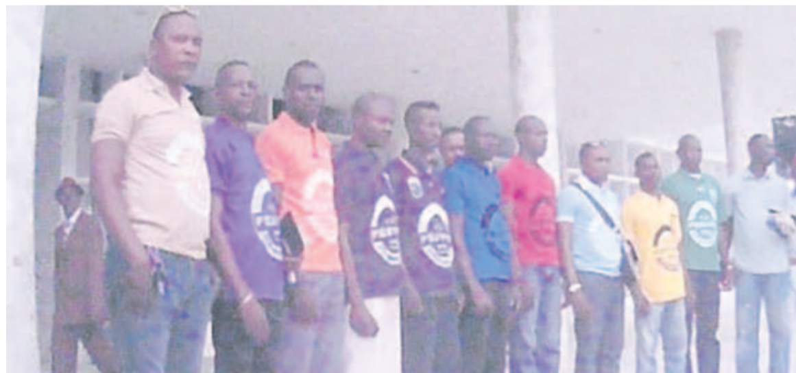
Une vue des régulateurs en tenue

« La présentation de ces régulateurs habillés en tenues de différentes couleurs représentant les neuf arrondissements de Brazzaville est synonyme de leur prise en compte au niveau de la mairie centrale et du conseil municipal. Ces gens-là sont dans la rue en train de travailler non seulement pour leur compte, mais aussi pour le bien de tous »,