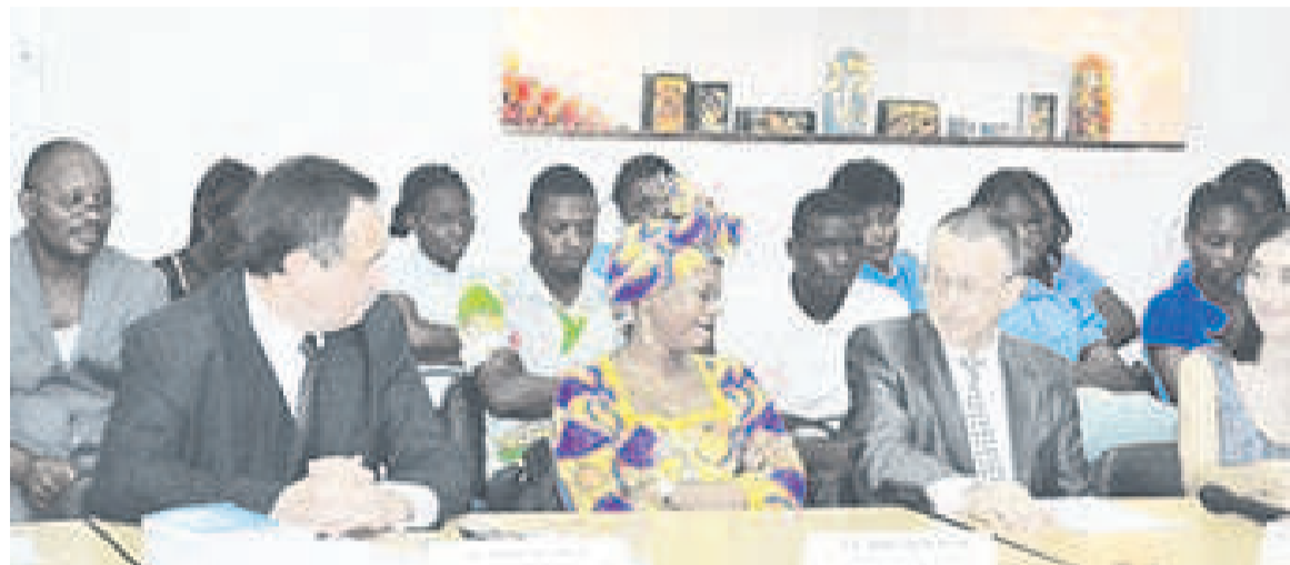
Le directeur du Centre culturel russe, la conseillère du chef de l'Etat congolais, l'ambassadeur de la Fédération de Russie en République du Congo

l'Enseignement supérieur, avec la formation des étudiants congolais dans les universités russes. Ces bourses sont octroyées soit par le ministère de l'Education et de la science de Russie