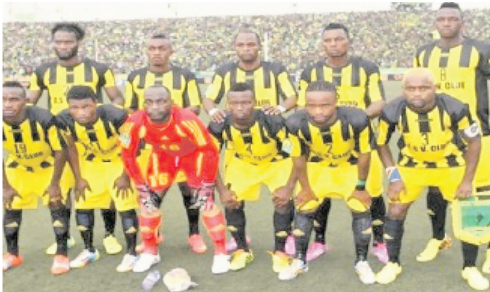
V.Club de Kinshasa