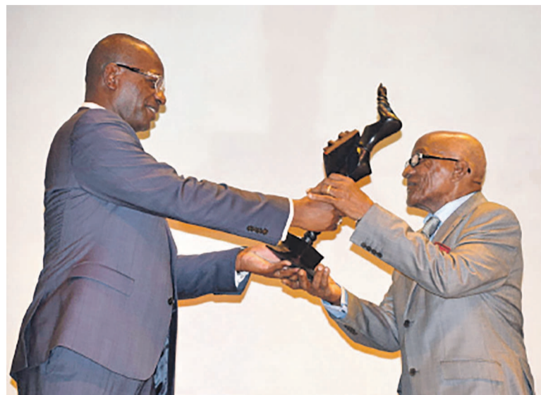
Le ministre de la culture et des arts, remettant le prix Reconnaissance à Edo Ganga (musicien)

L'autre récipiendaire est le ministre de la Culture et des arts, Bienvenu Okiemy, qui a rassuré l'ensemble des culturels présents que, son département entend accorder une place importante à tous les domaines de la culture.