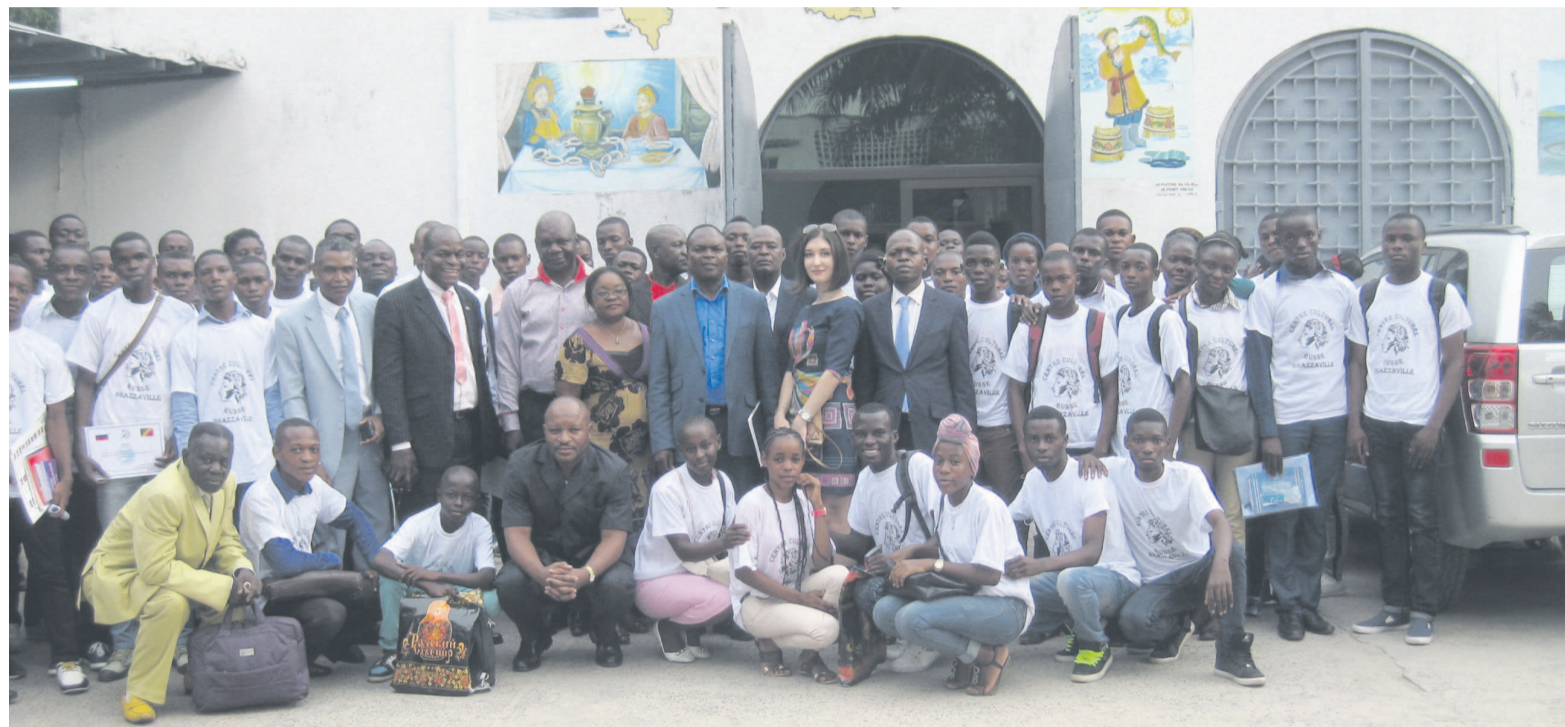
Photo de famille, lauréats, membres du jury et autres candidats

depuis 1976. A cette époque, il s'agissait d'une olympiade nationale (organisée dans chaque pays où la langue russe est étudiée) et l'olympiade internationale (qui avait lieu à Moscou, regroupant les différents vainqueurs nationaux). Le Congo