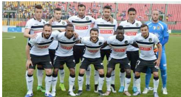
L'ES Sétifienne a tenu en échec l'Etoile du Congo au stade Alphonse-Massamba-Débat

Le Wydad athlétique club de Casablanca a connu la même réussite face à CNaps sport football de Madagascar (5-1). Zesco United de la Zambie a dominé Horoya FC de la Guinée 4-1. LUS Douala s'est inclinée à domicile face au Zamaïek d'Egypte 0-1. Kaizer Chiefs d'Afrique du sud est tombé sur ses propres installations devant Asec Mimosas de la Côte d'Ivoire 0-1. Warri Wolves du Nigeria a été battu à domicile par El Merreikh du Soudan sur ce score identique. APR FC du Rwanda s'est incliné à Kigali 1-2 devant Young Africans de la Tanzanie. Vita club de Kinshasa a pris le meilleur devant Club Ferroviario de Maputo 1-0. Le Stade Malien a dominé Coton sport de Garoua 2-0. Mamelodi Sundowns d'Afrique du sud a fait autant devant l'AC Léopards de Dolisie. Le Club africain de Tunis a eu raison de Mouloudia Olympic Bejaia 1-0. Al Ahly Tripoli s'est imposé face à El Hilal du Soudan 1-0. L'Etoile du Congo a été accroché par l'Entente sportive Sétifienne d'Algérie 1-1. Olympique de Khouribga et l'Etoile