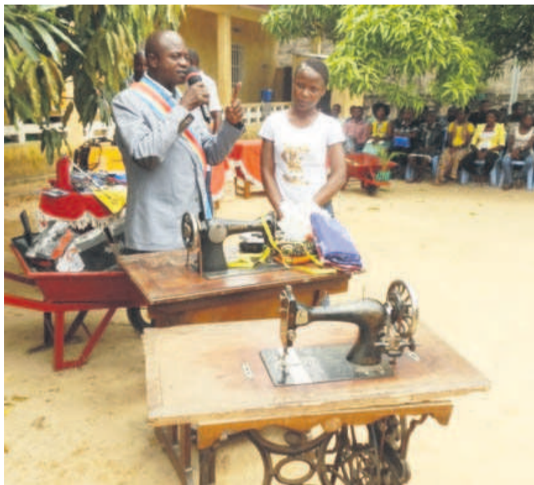
Les conseils du bourgmestre de Makala lors de la remise des kits aux bénéficiaires.

Les kits sont constitués des éléments de base pour chaque métier, qui puissent permettre aux acquéreurs de créer chacun son atelier ou son unité de production afin d'être autonome. Ils sont consti-