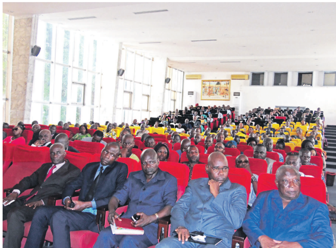
Une vue des observateurs nationaux