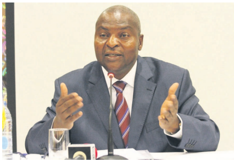
Faustin Archange Touadéra

Le président centrafricain s'est également rendu à l'Agence française de développement (AFD). Il a également rencontré le Médef. Les Centrafricains attendent avec beaucoup d'impatience le déclenchement du programme de désarmement, le désengagement de 900 militaires des forces sangaristes prévu pour la fin de cette année. Conscient de la dépendance de son pays à l'aide internationale, Faustin Archange Touadéra, a indiqué que ses priorités et ses objectifs concernent la paix et le désarmement, le développe-