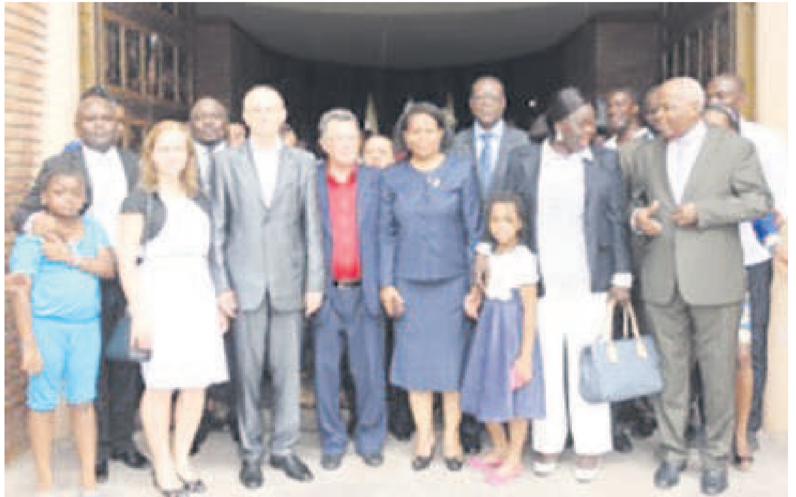
Photo de famille à l'issue de la messe

Leader charismatique, figure emblématique de la lutte pour la liberté, l'égalité, le président Hugo Chavez a su prêcher avec l'exemple, l'amour du prochain, la justice et la solidarité entre les peuples. Le président Chavez appartient à l'histoire et au patrimoine commun du peuple vénézuélien, il est une source