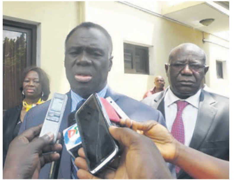
Michel Kafando répondant aux questions des journalistes lors d'une conférence de presse. Rappelons que Michel Kafando a dirigé la transition Burkinabé intervenue après la chute de Blaise Compaoré en octobre 2014 par insurrection populaire.

A la question de savoir si l'OIF enverra des observateurs pour le scrutin du 20 mars, Michel Kafando a répondu : « Je ne sais pas. Elle a encore quelques jours pour le faire. Je répète que le but de notre mission est d'appeler les acteurs politiques congolais à demeurer dans la paix pendant et après l'élection prési-