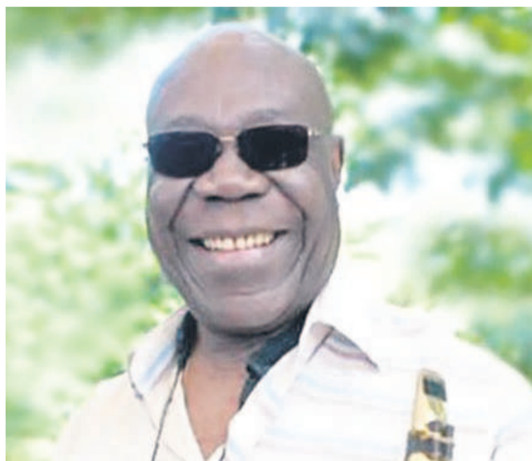
Le chanteur camerounais de world jazz, Manu Dibango