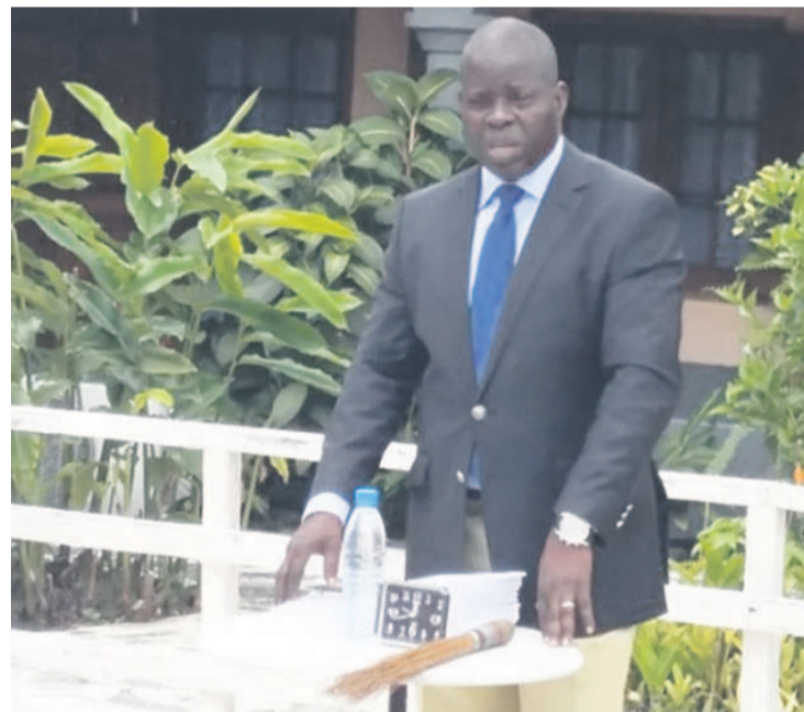
Anguios Ganguia Engambé

Le candidat à la présidentielle du 20 mars, Anguios Ganguia Engambé, l'a dit à l'occasion d'un point de presse qu'il a tenu, le 14 mars, dans la ville océane après un bref séjour dans les départements de la Lékoumou et du Niari.