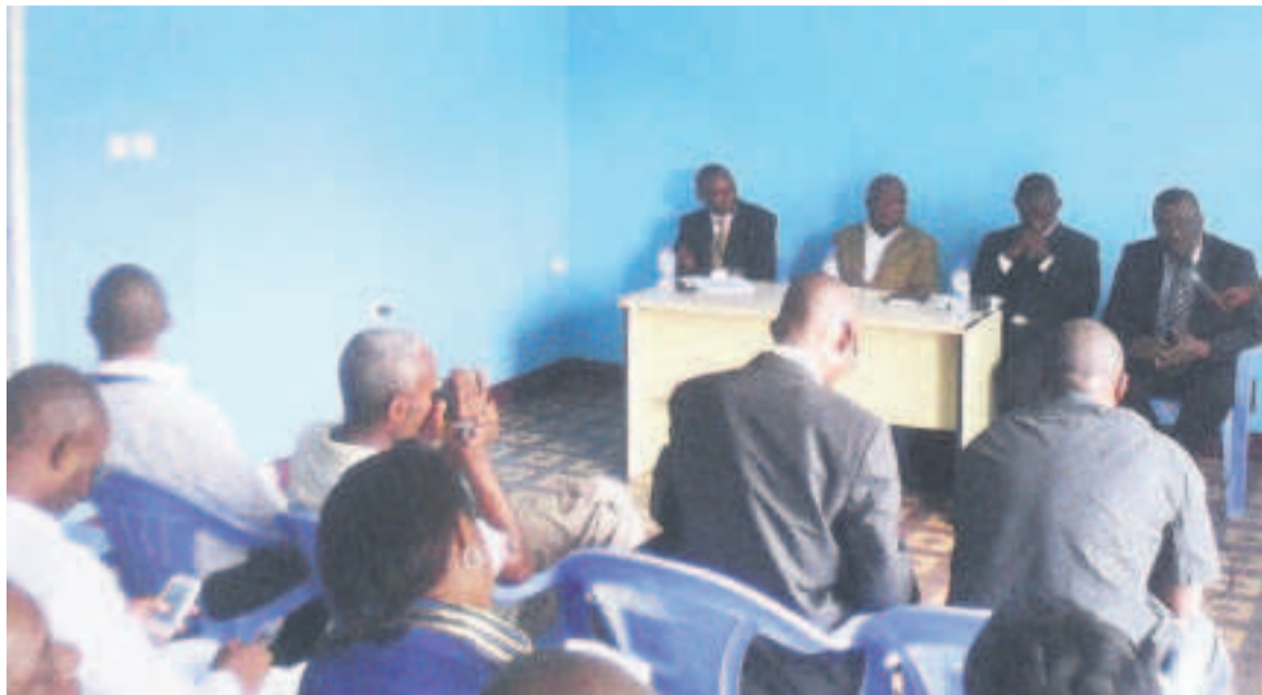
Des responsables de FFJ entourés par les présidents de l'Omec et de l'UNPC.