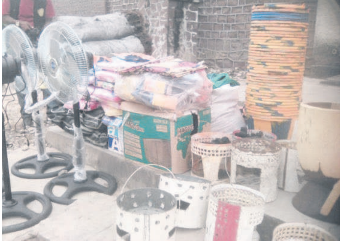
Le don des femmes de MTN