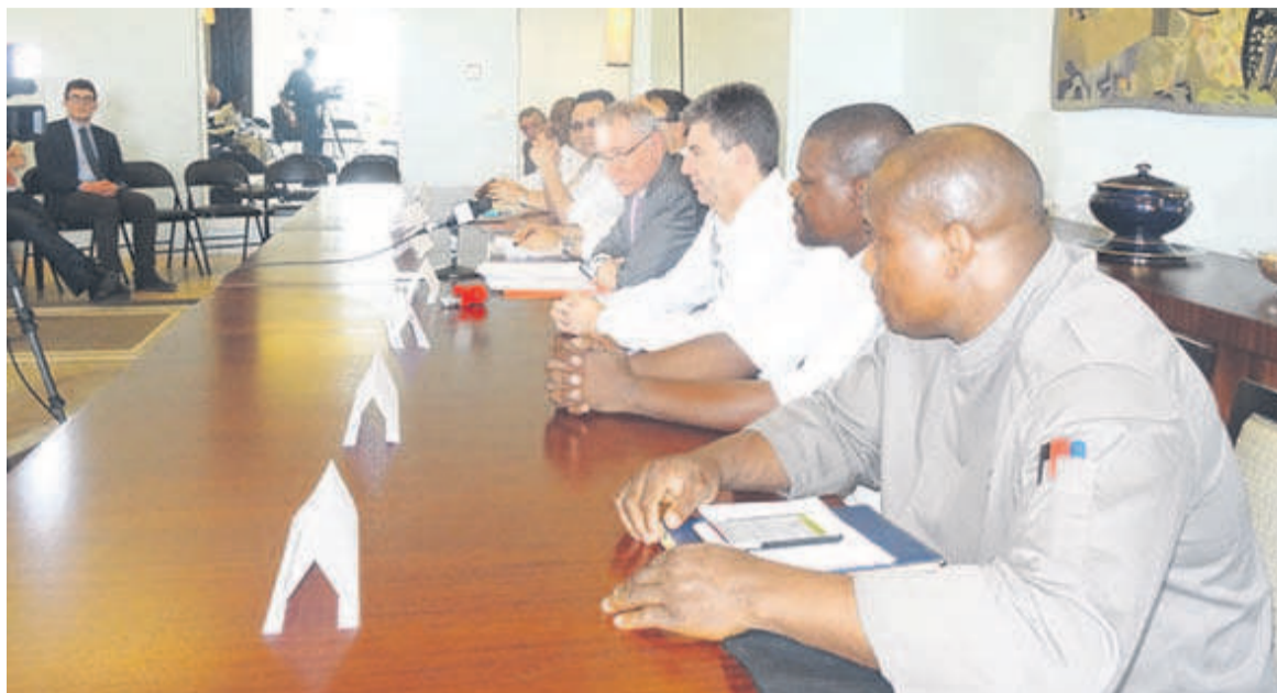
L'ambassadeur de France au Congo, encadré par les responsables des différents restaurants de la place.

Chaque chef proposera un menu à la française dans son restaurant tout en restant libre de mettre en avant ses propres traditions et pratiques culinaires. Dans