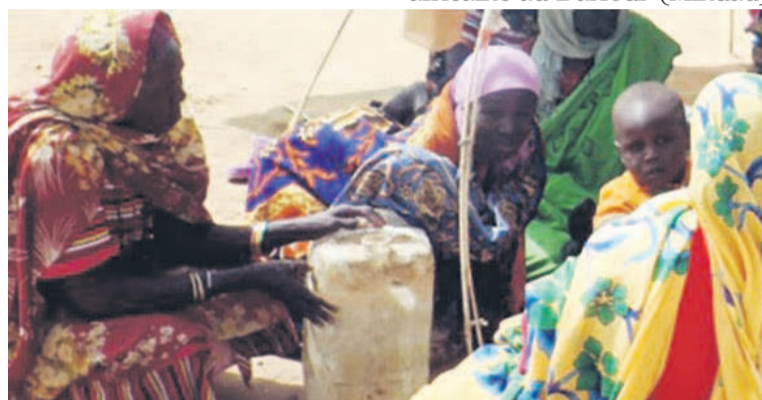
Des femmes et des enfants déplacés à la suite d'une escalade du conflit dans la région du Jebel Marra, dans l'État du Nord Darfour.

savoir qu'à l'heure actuelle, des affrontements et des bombardements aériens se poursuivent dans cette région du Darfour où le gouvernement a envoyé des renforts. « Les organisations humanitaires estiment qu'au 31 mars, au