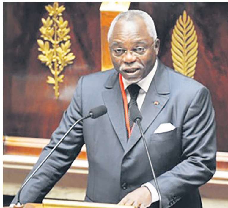
Guy Nzouba-Ndama, ancien président de l'Assemblée nationale, a décidé de présenter sa candidature à l'élection présidentielle gabonaise.

Signe que la sérénité n'est pas totale, Ali Bongo a tout de même reçu lundi une centaine de députés PDG - presque tous excepté les frondeurs - pour éviter d'autres mauvaises surprises et s'assurer le soutien de sa majorité jusqu'à l'élection. «Il y a beaucoup de mécontents, de gens qui regrettent le temps d'Omar, au Parlement comme dans les instances dirigeantes du Parti, ou au gouvernement», explique un observateur averti de la politique gabonaise. «Mais beaucoup savent aussi qu'ils ne doivent leurs postes qu'au PDG, et n'osent pas claquer la porte». Du côté de l'opposition, l'ambiance n'est pas vraiment à l'unité non plus, malgré les promesses d'«Union sacrée».