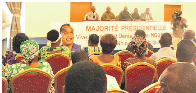
Une vue de la salle lors de la rencontre

Rappelant l'attachement constant du président de la République aux valeurs de dialogue, de paix et de démocratie et l'adhésion du peuple congolais à la tranquillité, la conservation des acquis, la concorde et l'unité nationales,