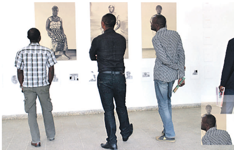
Quelques visiteurs lors de la Biennale

LDB : Comment avez-vous apprécié le travail artistique des artistes de Lubumbashi ?