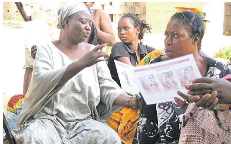
Des malades recevant des dépliants d'information

Chaque 7 avril de l'année, des centaines d'organisations internationales, les départements de santé dans chaque nation célèbrent la journée internationale de la santé en vue de sensibiliser la population, d'une part, sur les méfaits de chaque pathologie et, d'autre part, sur les stratégies mises en œuvre par l'OMS et les gouvernements pour y faire face.