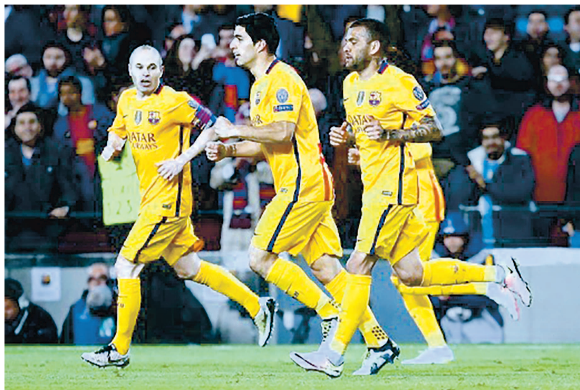
Iniesta et Dani Alves peuvent remercier Luis Suarez, auteur des deux buts de la victoire du Barça face à l'Atletico Madrid

« Avec cette équipe, j'irais au bout du monde. Nous abordons ce match (retour) dans une situation merveilleuse pour démontrer que nous sommes les meilleurs », a commenté l'entraîneur barcelonais Luis Enrique. Les Barcelonais ont eu le mérite