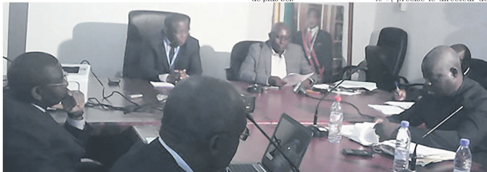
Les responsables de la SNE et ceux de l'ARSEL lors de la réunion

En ce qui concerne l'accès à l'électricité, la SNE et l'ARSEL ont convenu d'adapter une méthode visant le raccordement à faibles coûts ; de proscrire en bonne et due forme, l'acquisition hors SNE, du matériel de branchement par les clients. Cette mesure viendra mettre un terme définitif à ce grand manquement de la SNE d'après lequel depuis plusieurs années, les clients achètent eux-mêmes leurs poteaux et câbles électriques pour se connecter au réseau. Les deux parties devront cependant, mettre en œuvre un mécanisme approprié, destiné essentiellement au financement et à l'approvisionnement dudit matériel technique. Ainsi, un délai de raccordement