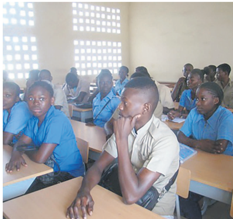
Les élèves dans une salle

côté de l'école publique car la quasi-totalité des établissements privés reçoivent leurs apprenants. Espérons que la