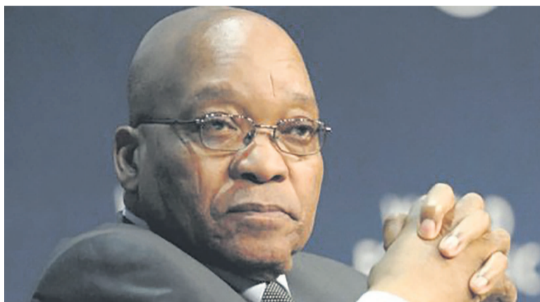
Le président Jacob Zuma

Le rejet de la destitution de Jacob Zuma par les députés de l'ANC, majoritaires au Parlement ne surprend guère puisque dimanche le porte-parole de l'Assemblée nationale, Baleka Mbete avait indiqué à la presse que « la procédure