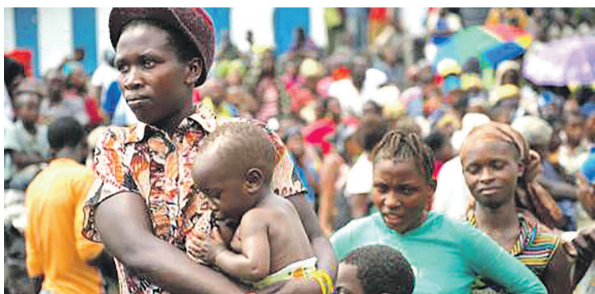
Des femmes congolaises

« Sept des victimes présumées ont accouché et quatre sont toujours enceintes », a précisé le porte-parole adjoint de l'ONU Farhan Haq.