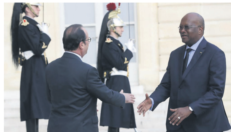
Le président Hollande a accueilli son homologue burkinabè Roch Marc Christian Kaboré à l'Elysée, le 5 avril 2016.

Au Burkina Faso, on pense que la présence des militaires français attire les jihadistes. Ce pays est divisé quant à la présence annoncée unilatéralement par le ministre français de l'Intérieur Bernard Cazeneuve, d'une équipe du GIGN pour traquer les groupes terroristes. Pour François Hollande, Roch Marc Christian Kaboré est le symbole de la démocratie. Il a affirmé la disponibilité de la France à accompagner le Burkina Faso dans ses défis, notamment sécuritaire, économique et démocratique. Il a aussi rendu hommage au président de la Transition Michel Kafando. Il a appelé à une « coopération exemplaire »