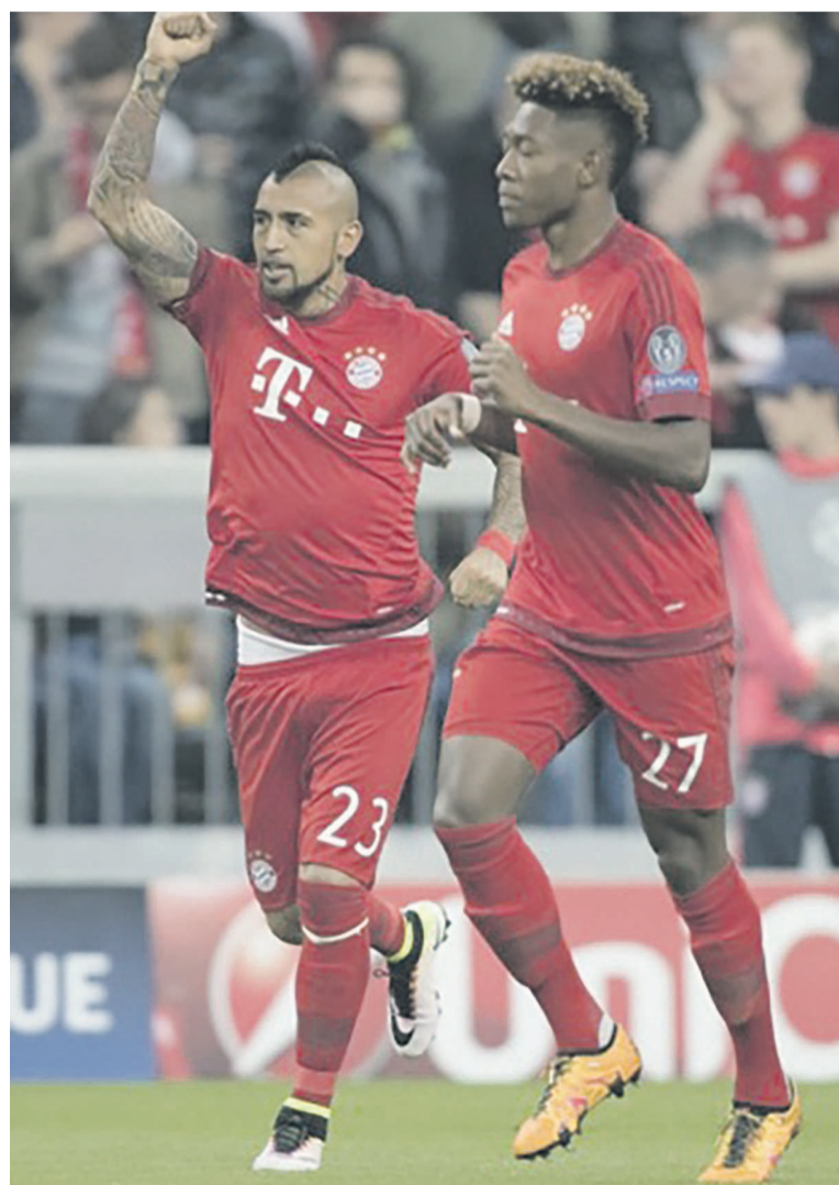
Arturo Vidal exulte après avoir ouvert le score à la 2 e , mais le Bayern Munich de David Alaba devra se méfier au match retour, à Lisbonne