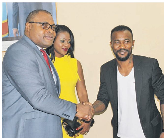
Didier Zokora et son épouse chez le ministre des Sports de la RDC Denis Kambayi

À 35 ans (1,79 m) et étant le joueur le plus capé des Éléphants de la Côte d'Ivoire avec plus ou moins 150 sélections, il a choisi de quitter la sélection et laisser la place aux jeunes après avoir disputé deux Coupes du monde et cinq phases