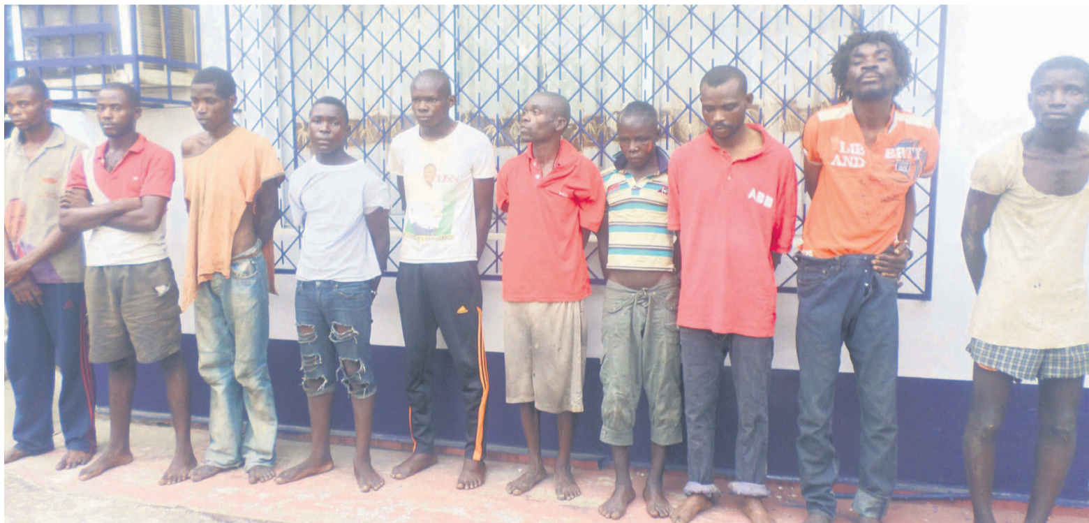
Des présumés Ninjas présentés à la presse

Après les affrontements ayant causé la mort de 17 personnes dans les quartiers sud de Brazzaville, la police a présenté à la presse des présumés Ninjas suspectés à l'origine des attaques des positions militaires. Selon le président de la commission mixte d'enquête, Thomas Bakala Mayinda, 55 personnes ont été interpellées parmi lesquelles des Ninjas, mais aussi des sujets étrangers.