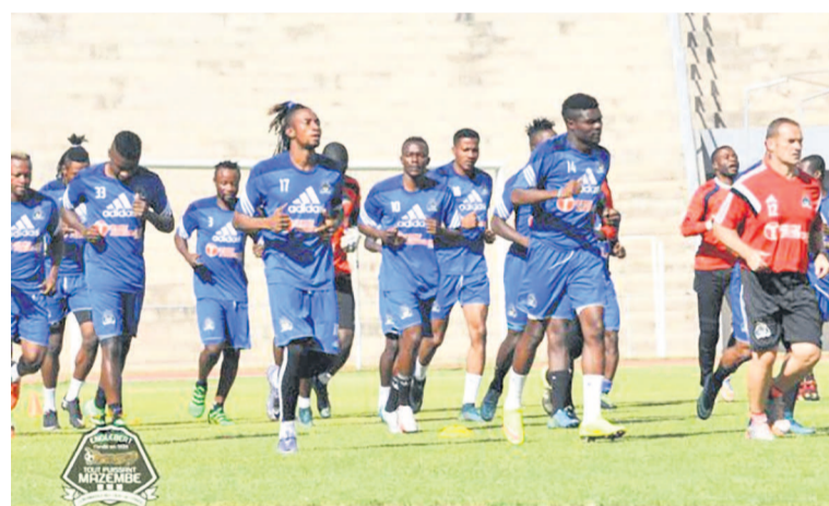
TP Mazembe de Lubumbashi bat Dauphin Noir avant d'aller défier WAC à Casablanca

à la conclusion d'un centre de Deo Kanda suivi d'une remise de la tête de Luyindama. À trois buts à zéro, les carottes ont été déjà cuites pour les joueurs venus de Goma au Nord-Kivu qui cependant ont sauvé l'honneur à la 79e minute en réduisant l'écart. Mais les Corbeaux vont corser l'addition avec le quatrième but de Roger Claver