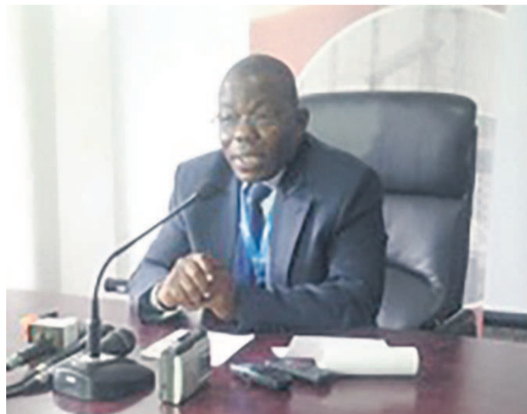
Le directeur général de la SNE

Outre la centrale de Côte Matève, la République du Congo