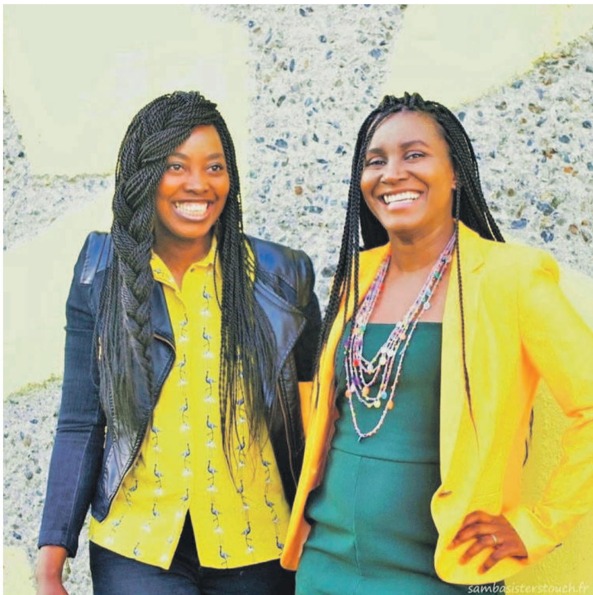
Vous pouvez les retrouver sur leur site: www.sambasisterstouch.frou , ou les suivre sur leur profil Facebook: https://www.facebook.com/profile.php?id=100009926387970&fref=ts