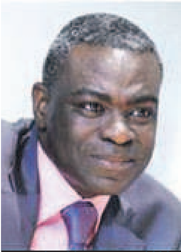
ANATOLE COLLINET MAKOSSO MINISTRE/CONGO-BRAZZAVILLE