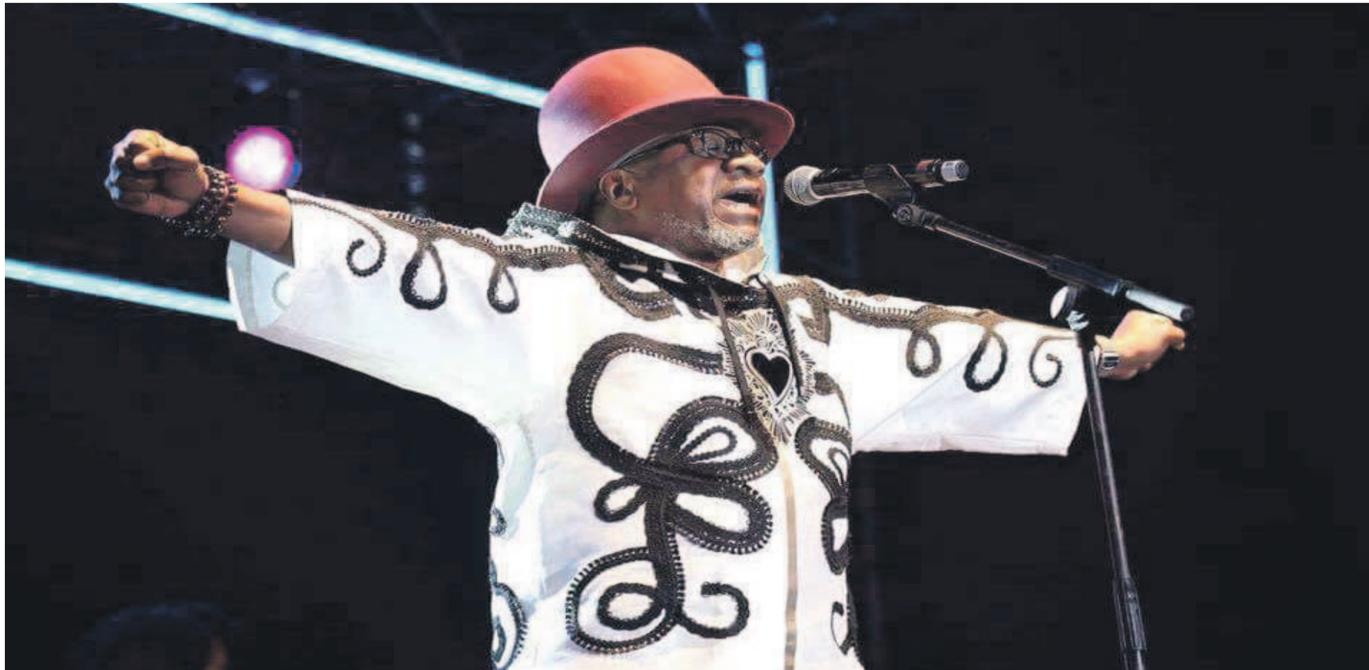
Papa Wemba lors de son dernier concert à Abidjan

Il détenait à lui seul plus de trois décennies de l'histoire musicale congolaise. Sa musique illustre les temps forts du passé, la vivacité du présent et les lueurs de l'avenir.