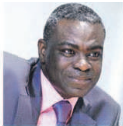
Anatole Collinet Makosso ministre de l'Enseignement primaire et secondaire, de l'alphabétisation, de la jeunesse et de l'éducation civique au Congo.

« L'heure n'est plus aux discours mais au travail, pour garantir l'avenir pédagogique, administratif et socioéconomique de notre beau pays le Congo ».