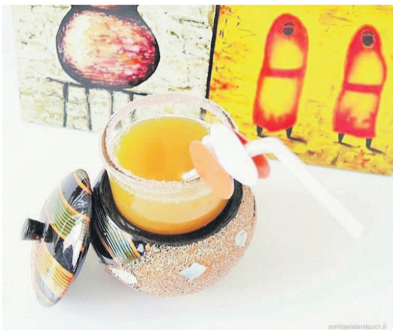
Recette et astuces à retrouver sur le blog www.sambasisterstouch.fr

Inspirées par leur mère, couturière, styliste, diplômée dans une prestigieuse école de couture berlinoise, ancienne ambassadrice d'une marque de produits cosmétiques, celle-ci leur transmet son goût à l'élégance et au raffinement.