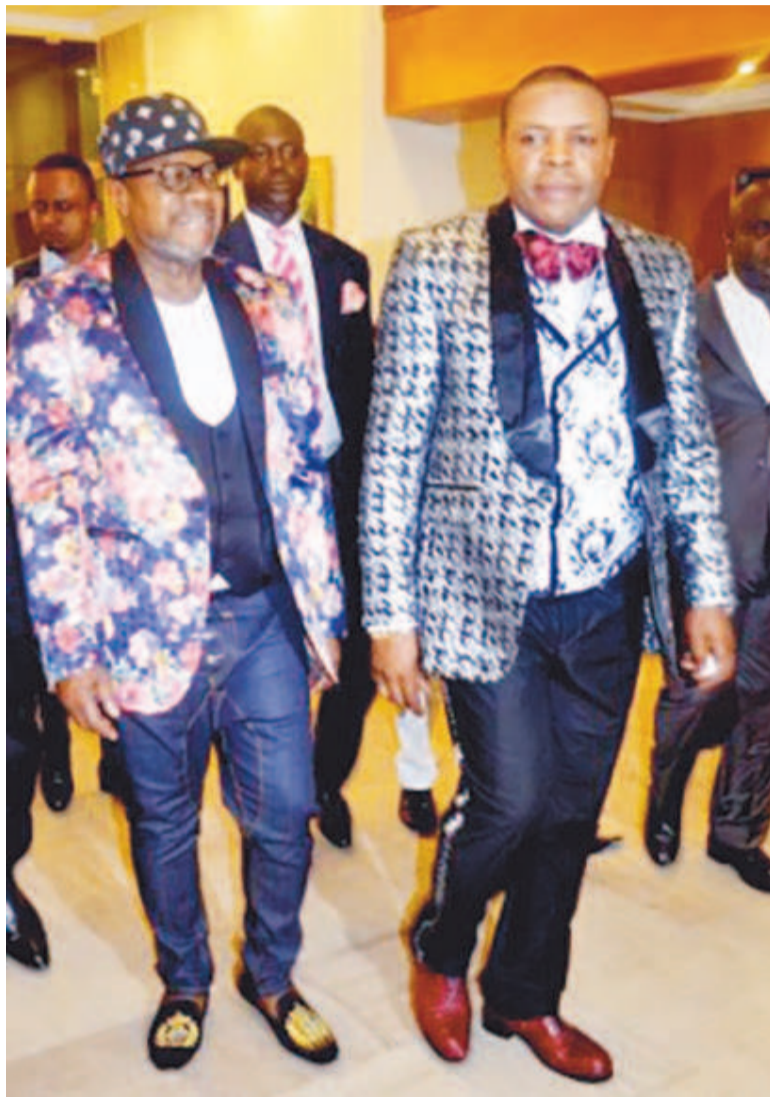
Papa Wemba et Ahmed Yala lors de la soirée du 8 mars 2016

certes le manager aujourd'hui, mais je ne suis pas le créateur, ni l'inventeur. C'est à travers le Congo -Brazzaville que j'ai