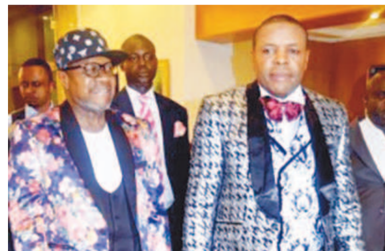
Papa Wemba et Ahmed Yala lors de la soirée du 8 mars 2016

A quelques heures de l'inhumation du Roi de la rumba congolaise ce 4 mai à Kinshasa, le sapologue et mécène congolais, Ahmed Yala, organisateur du festival de la Sape au féminin auquel participait Papa Wemba le 8 mars à Brazzaville, est revenu sur celui qu'il considère comme le plus grand sapeur de tous les temps. Invitant tous les sapeurs, à travers le monde, à venir rendre un dernier hommage au « Grand mo-