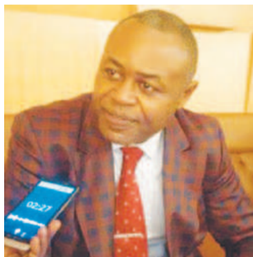
Léon Juste Ibombo

Dans la suite de la découverte des nouveaux ministres de l'équipe gouvernementale publiée le 30 avril, nous proposons dans ce numéro les portraits express