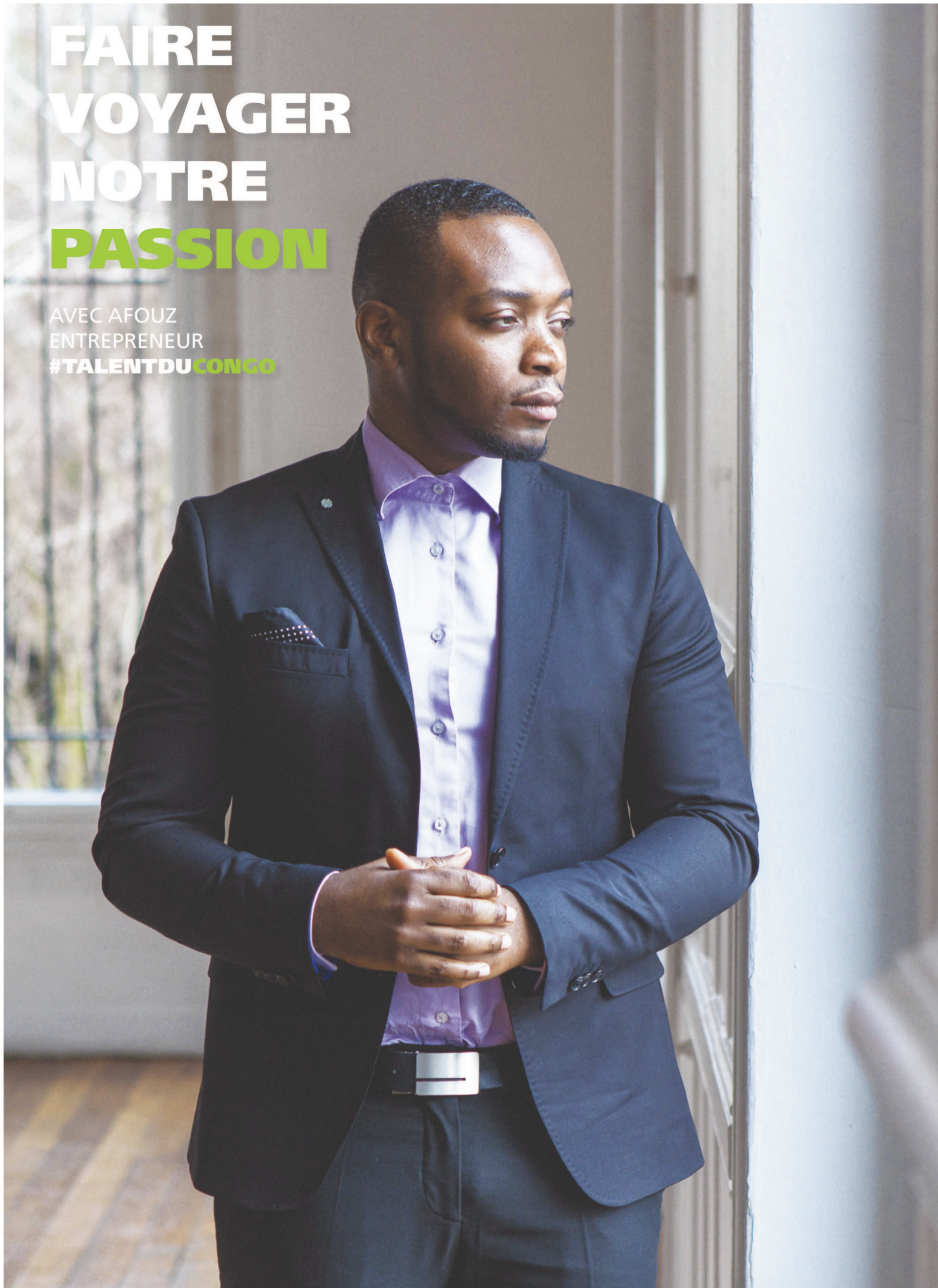
CONCEPTION GRAPHIQUE : THIRTY DIRTY FINGERS