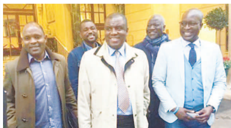
CDPAT à la sortie de la réunion de soutien au gouvernement de la 1 re République

Le collectif se réjouit tout d'abord de cet alliage de l'expérience et du renouveau qui mêle des hommes aguerris et de jeunes pousses en devenir, ce qui permet d'impulser une dynamique d'ensemble prenant appui sur la connaissance des rouages de l'Etat, l'expertise affinée, l'ardeur et la détermination couplées à la vigueur, l'impétuosité,