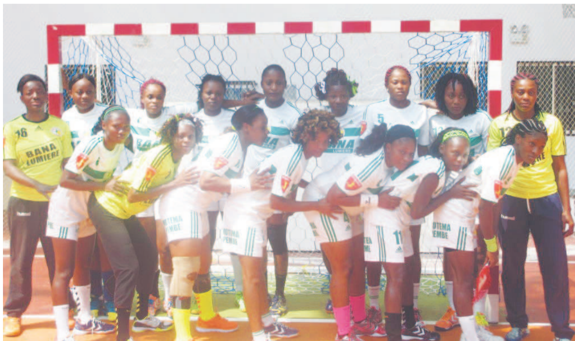
Les joueuses d'Asel

Les dames d'Asel sont logées dans le groupe A. Elles ont pour adversaires : Primeiro