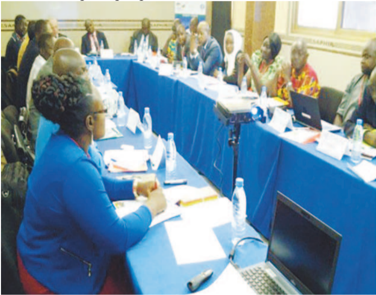
La société civile Congolaise et Tchadienne à l'ouverture de l'atelier