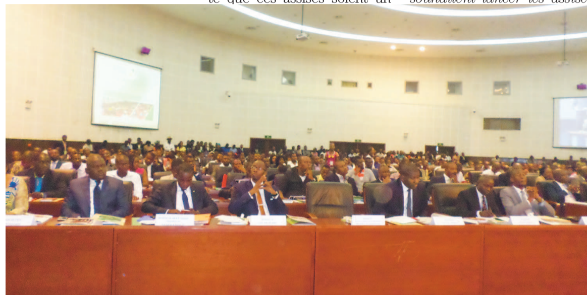
Les participants à la cérémonie d'ouverture

sés ont donné lieu à une série de recommandations. Il s'agit, entre autres, d'intégrer les questions d'emploi des jeunes dans toutes les politiques na-