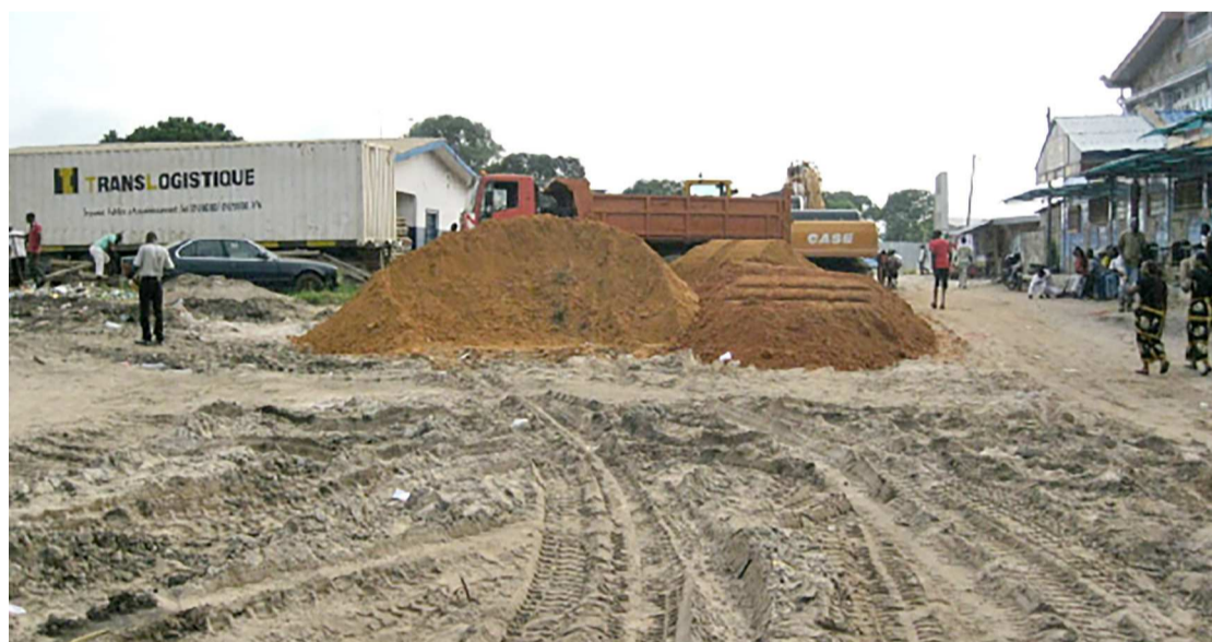
Les travaux d'aménagement sur l'avenue Émile-Biayenda

Située dans le sixième arrondissement Ngoyo, l'avenue Émile-Biayenda est un axe majeur de déplacement qui relie les quartiers Boutsia-boutsielé et Tchimagani au marché de la Liberté au Fond Tié-Tié. Cette voie sera bitumée sur une distance de 1 km 200. Les travaux ont démarré il y a quelque temps et sont exécutés par la société Translogistique.