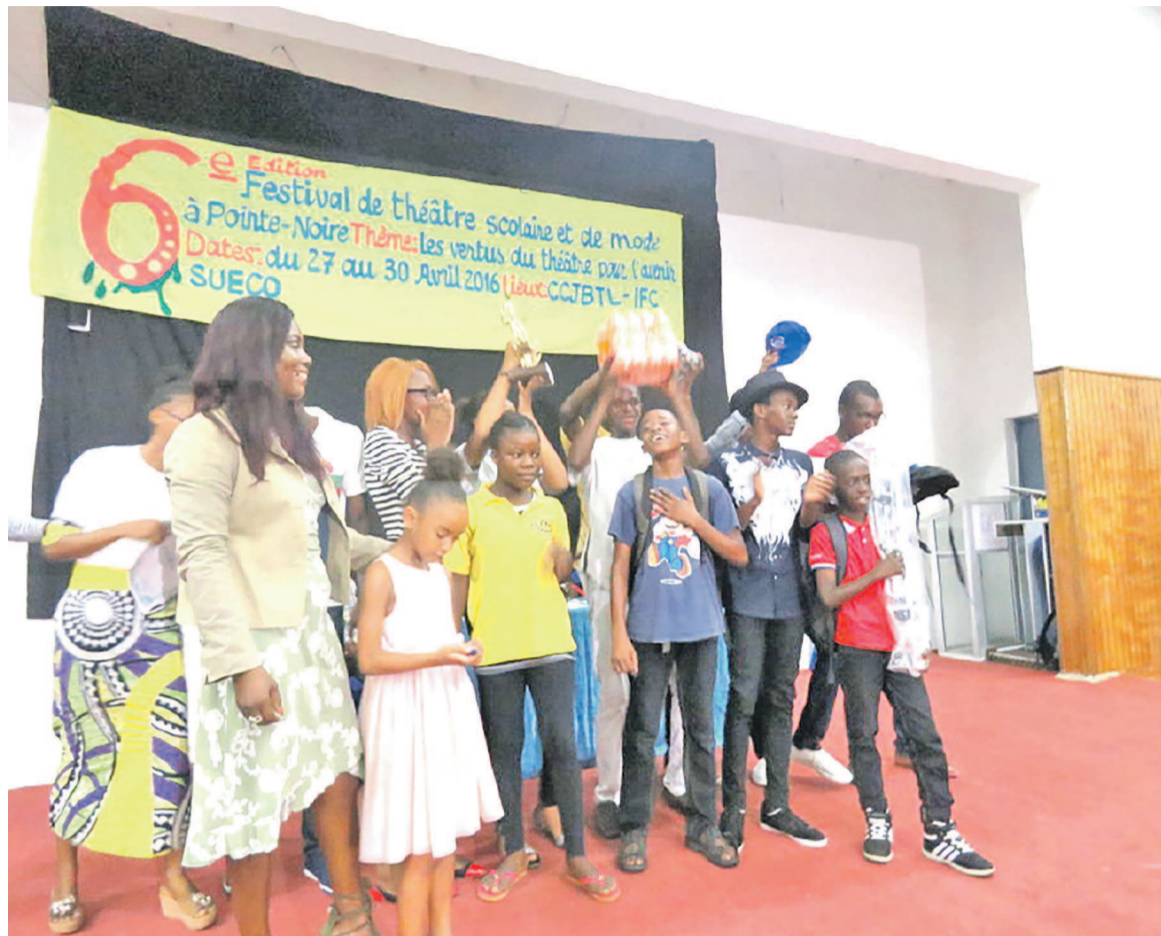
Les élèves du CEPL manifestant leur joie