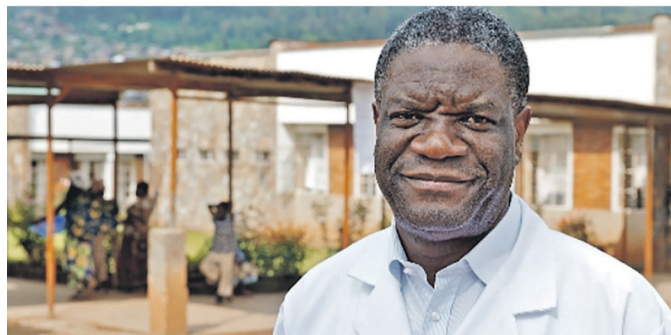
Dr Denis Mukwege

Le célèbre chirurgien espère que les Congolais vont se mobiliser « pour parvenir au changement tant attendu ».