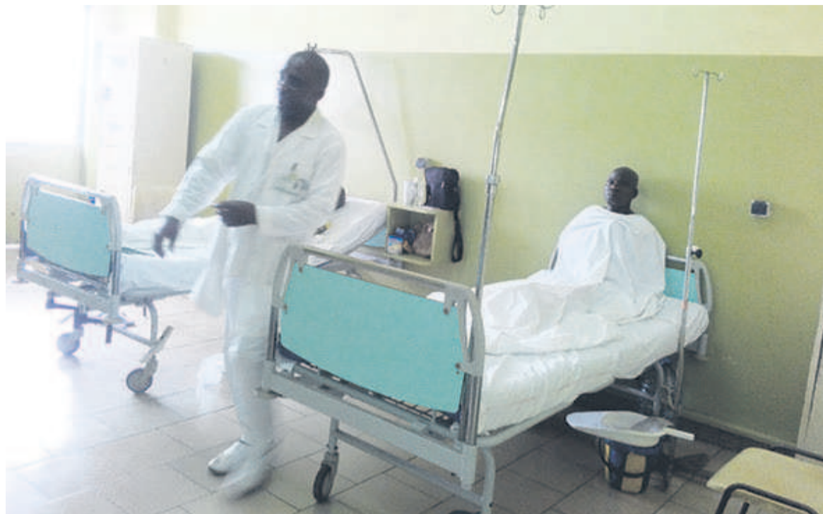
Une vue des patients opérés au CHU

Outre la chirurgie endoscopique, le professeur Redouane Rabié et son équipe vont également