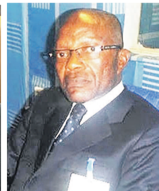
Le ministre du budget, Michel Bongongo

dés ont apprécié son engagement à trouver des solutions aux problèmes sociaux qui se posent dans la paie des fonctionnaires de l'État, il est mis à l'actif du second l'acqui-