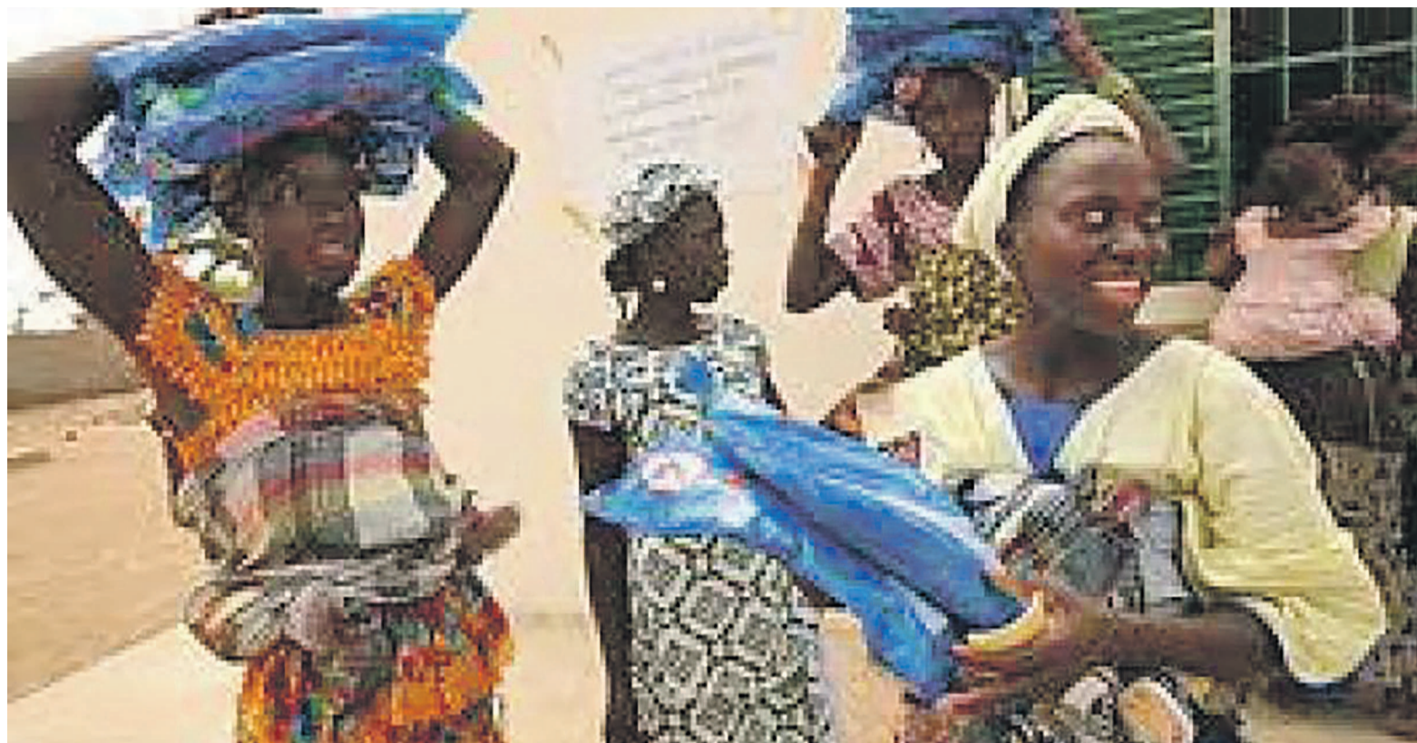
Dormir sous la moustiquaire imprégnée d'insecticide prévient la fièvre jaune

Même si la RDC n'a pas l'épidémie, elle court un grand risque au regard des mouvements de populations entre les deux pays. C'est pourquoi il faut renforcer la sensibilisation des communautés