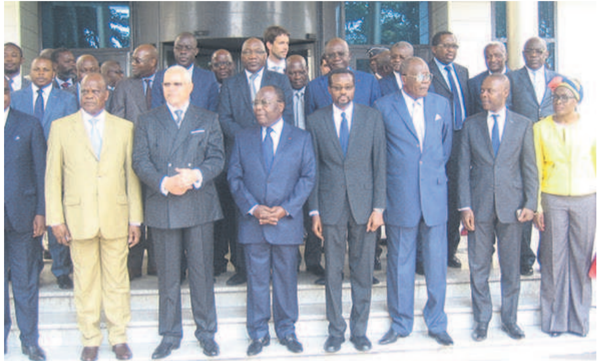
Le Premier ministre entouré des membres du gouvernement

Une économie verte, un développement durable