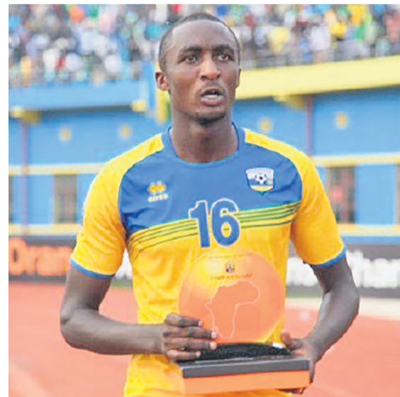
Ernest Sugira, l'attaquant international rwandais

Attaquant international rwandais de l'AS Kigali, Ernest Sugira pourrait signer un contrat de transfert avec V.Club dans les heures qui suivent. Le joueur révélé au quatrième Chan à Rwanda séjourne à Kinshasa pour des négociations avec les dirigeants de Dauphins Noirs de la capitale RD-congolaise.