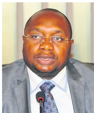
Dr Félix Kabange Numbi

À une période où les contacts politiques ont semblé prendre le dessus sur les activités ministérielles avec, en toile de fond, la quête effrénée de s'assurer une place dans