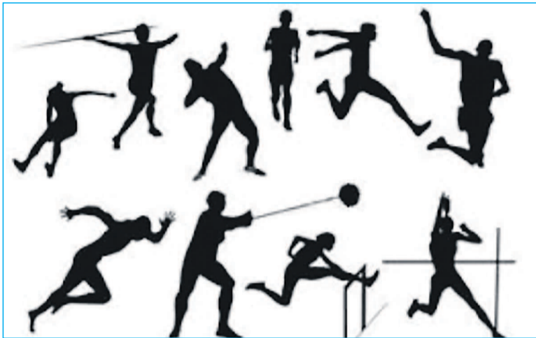
Les élèves ont appris les diverses disciplines de l'athlétisme

La Fédération d'athlétisme du Congo (Féaco) a célébré, le 14 mai, au stade des Martyrs de Kinshasa la 21 e Journée mondiale d'athlétisme, journée initiée par la Fédération internationale d'athlétisme.