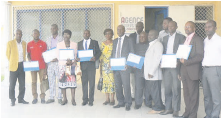
Les heureux récipiendaires affichent leurs diplômes.

En effet, le Campus Numérique est une plate-forme technologique et numérique de ressources et de compétences pour l'appropriation, de prospectives et d'intégration des technologies de l'information et de la communication (TIC) et des technologies de l'information et de la com-