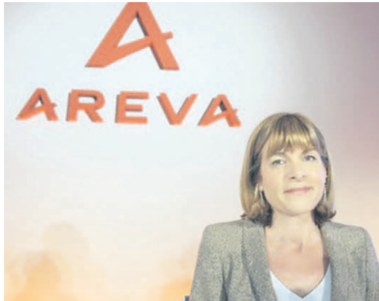
Anne Lauvergeon

A l'issue de 12 heures d'interrogatoire au Pôle financier de Paris, l'ancienne patronne d'Areva, en est ressortie avec une mise en examen pour « présentation de comptes inexacts et diffusion de fausses informations ». Rattrapée par l'affaire Uramin, une société minière canadienne dont les gisements se sont avérés inexploitable et soupçonnée d'être une vaste escroquerie.