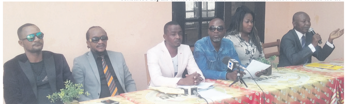
La coordination du collectif des artistes musiciens

La situation qui prévaut au sein de l'Union des musiciens congolais (UMC), a fait l'objet le 13 mai, d'une conférence de presse au cours de laquelle le collectif des musiciens a donné quelques informations sur les mesures prises en vue de relancer la structure.