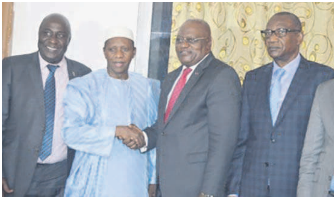
Le ministre des Sports et le président de la Fiba-Afrique se félicitent.