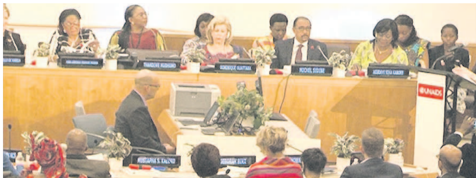
La tribune officielle

Réunie le 8 juin à New York, en marge du sommet de haut niveau sur le VIH, l'Organisation des premières dames d'Afrique contre le sida (Opdas) s'est engagée pour une nouvelle stratégie contre cette pandémie, en