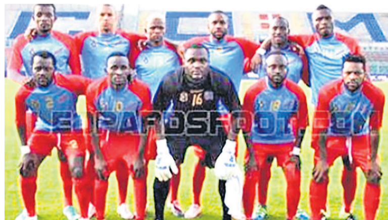
Les Léopards de la RDC

Le premier chapeau regroupe l'Algérie, la Côte d'Ivoire, le Ghana, le Sénégal et la Tunisie, les cinq pays formant le Top 5 continental. Le troisième chapeau met ensemble le Cameroun, le Ma-