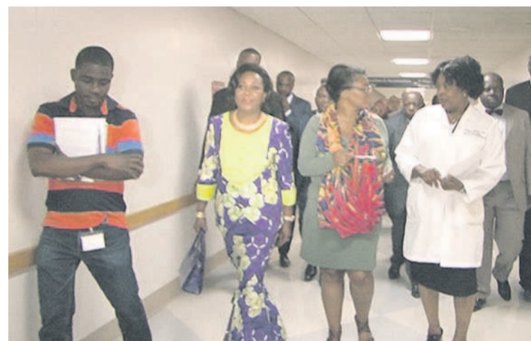
La visite de l'hôpital

Son engagement et celui de sa Fondation dans la campagne de sensibilisation sur cette maladie génétique dans plusieurs continents du monde, notamment, l'Europe, l'Asie, le Moyen Orient, l'Amérique, sans oublier l'Afrique, n'est pas passé sous silence.