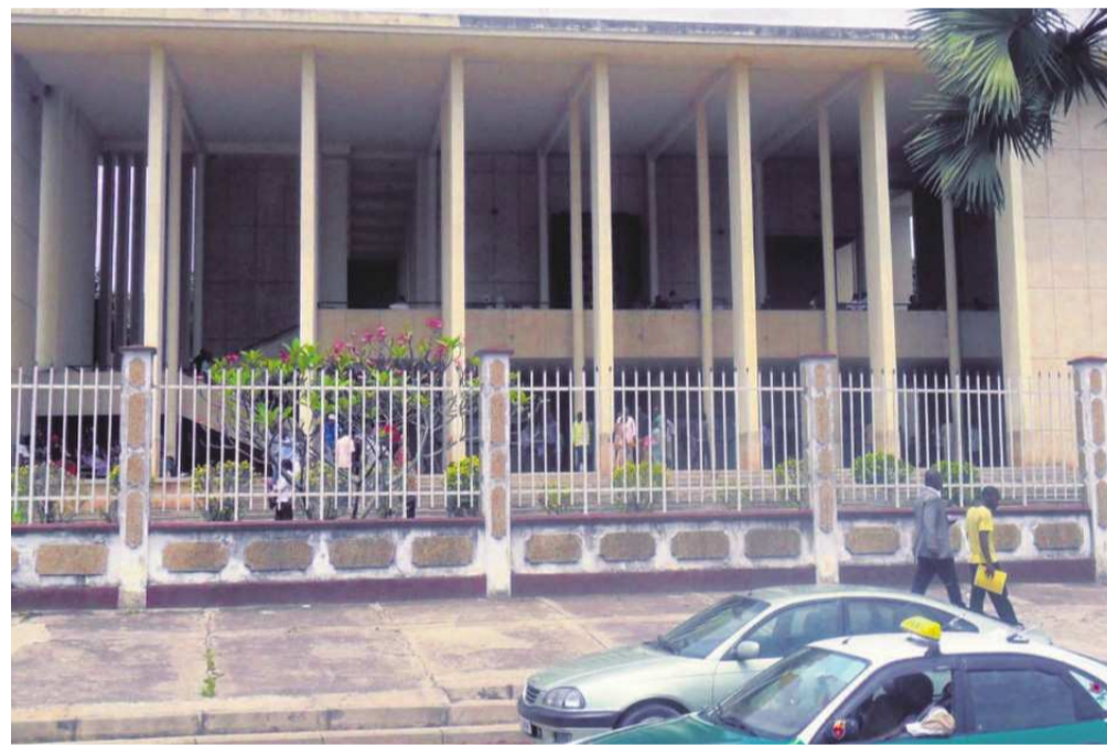
Palais de justice de Brazzaville

Le procès du président du parti d'opposition «Unis pour le Congo», poursuivi pour incitation aux troubles à l'ordre public et à l'insurrection, s'est ouvert hier au Tribunal de grande instance de Brazzaville.