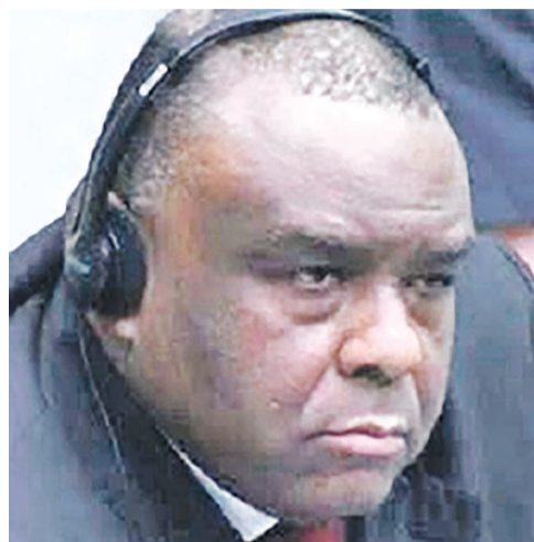
Jean Pierre Bemba

La Chambre de première instance III de la Cour pénale internationale (CPI) a annoncé qu'elle prononcera cette peine à cette date au cours d'une audience publique qui sera tenue au siège de la Cour à La Haye.