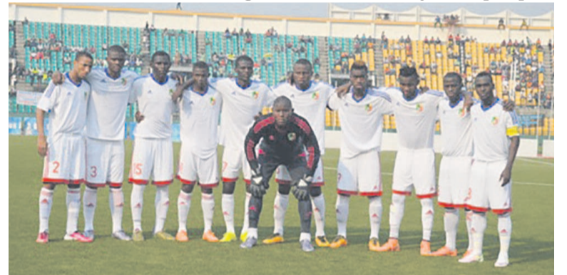
Les Diables rouges juniors

gestion du temps additionnel qui nous a coûté cher. Mais il faut dire les choses de manière claire. Le Burkina Faso a eu six mois de préparation avec quatre matchs internationaux. Nous avons juste quelques