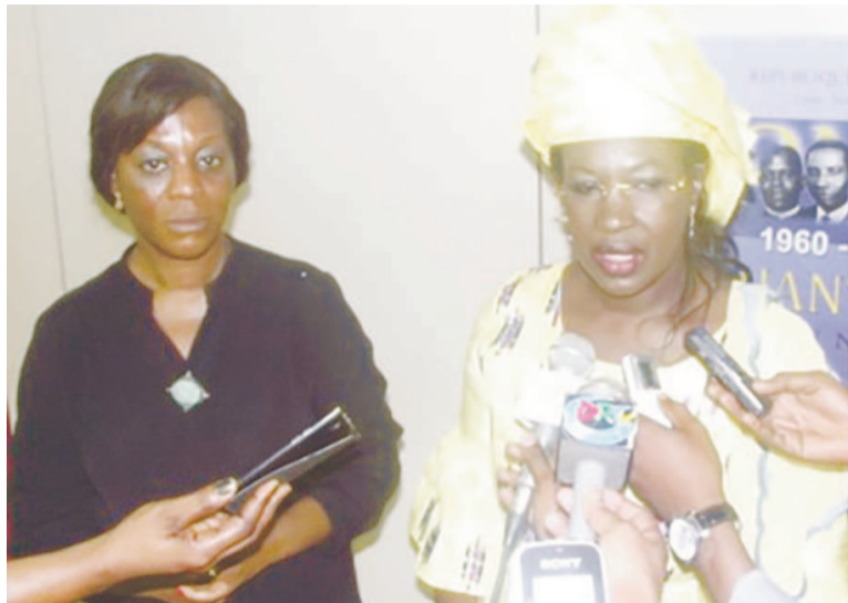
La ministre du Tourisme et des loisirs et l'ambassadeur du Sénégal au Congo

Les deux personnalités ont aussi échangé sur les sites et le potentiel touristique du Sénégal. A cet