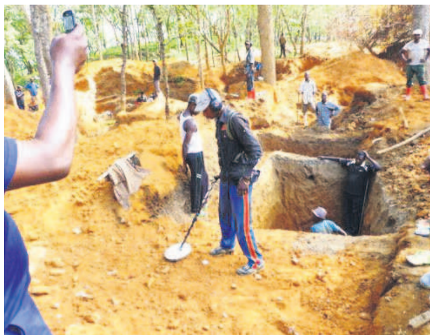
Une équipe d'orpailleurs à pied d'oeuvre dans une carrière à l'Est du pays

toire congolais en contrebande pour gagner les chaînes d'approvisionnement internationales, note le rapport. Une situation qui « porte directement atteinte aux efforts internationaux ainsi qu'à ceux du gouvernement national visant à réformer le commerce de l'or artisanal de l'est du Congo ». Des documents d'exportation officiels sont ainsi falsifiés pour dissimuler tout lien des minerais exportés avec Shabunda. Page 12