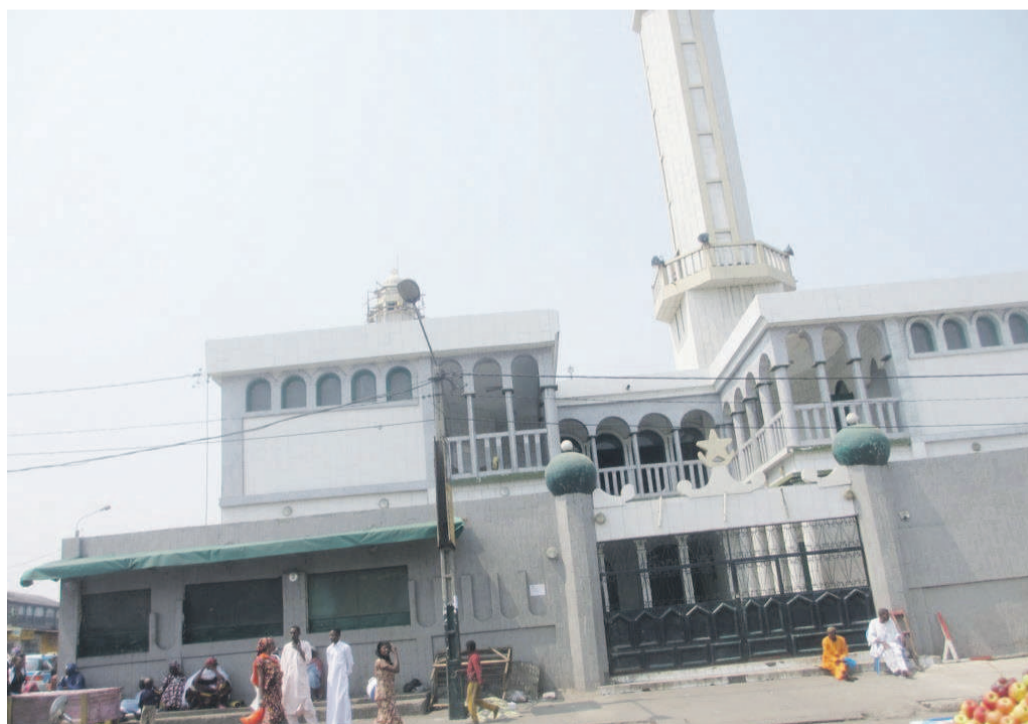
La grande mosquée de Pointe-Noire

Ce matin, la quasi-totalité des boutiques tenues par des Musulmans sont restées fermées à Pointe-Noire. Bien habillés, ces derniers se sont d'abord rendus à la grande prière du matin, puis ont visité leurs proches et amis afin de leur présenter les vœux de santé et de bonheur.