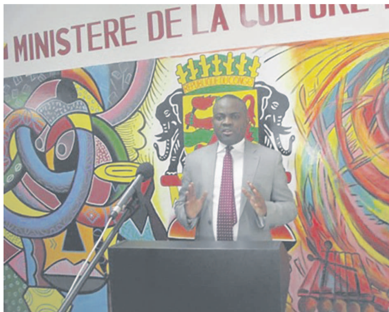
Le ministre de la Culture et des arts s'adressant aux cinéastes

La rencontre entre le ministre de la culture et des arts, Léonidas Carel Mottom Mamoni et les cinéastes, le 04 juillet 2016, a porté sur un échange objectif et constructif dans le but d'impulser un nouveau souffle au cinéma congolais.