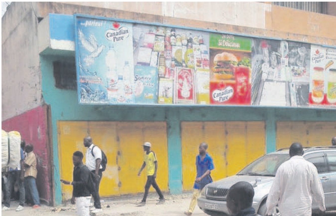
Magasins fermés dans le centre-ville de Kinshasa

Ils rédoutent les représailles des Kinois à la suite de l'assassinat d'une Congolaise en Inde.