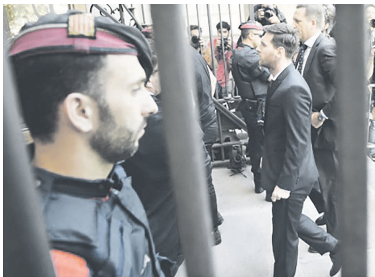
Lionel Messi à l'entrée du Tribunal

Les magistrats ont souligné qu'en cas de relaxe du joueur, les citoyens ordinaires auraient pu croire qu'il était préférable de se « désintéresser » des obligations fiscales plutôt que « de s'en inquiéter ». Le com-