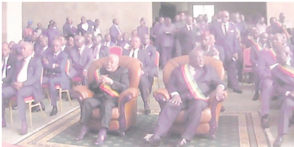
André Obami-Itou et Justin Koumba suivant l'oraison funèbre