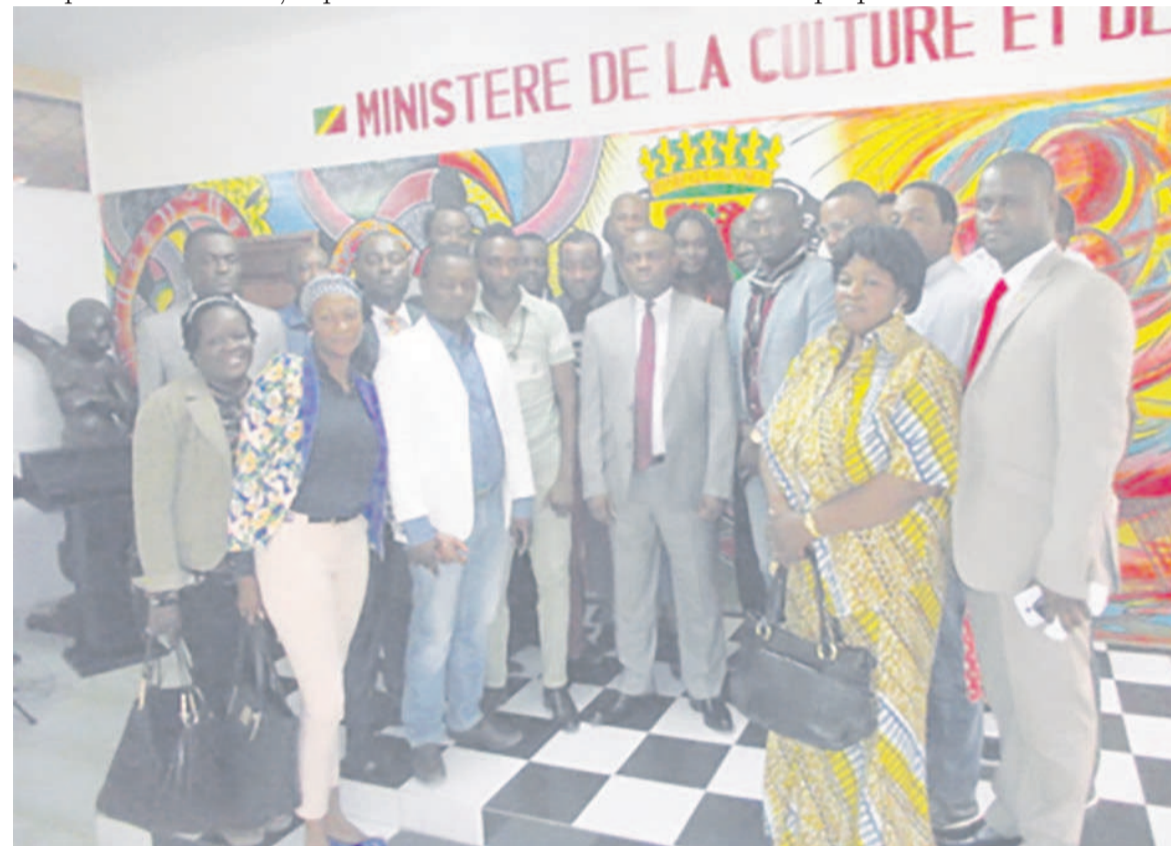
Photo de famille avec les cinéastes

Au sujet des salles de cinéma appartenant pour la plupart d'entre elles aux