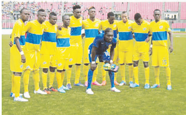
La JST retrouve sa deuxième place

alors que la contre-performance est prohibée chez ses poursuivants. La JST, l'actuelle deuxième avec 52 points a dépassé l'Etoile du Congo (49 points) de trois longueurs après sa victoire 2-1 sur la Jeunesse sportive de Poto-Poto. Entre l'Etoile du Congo (3 e ) et la JSP (4 e )