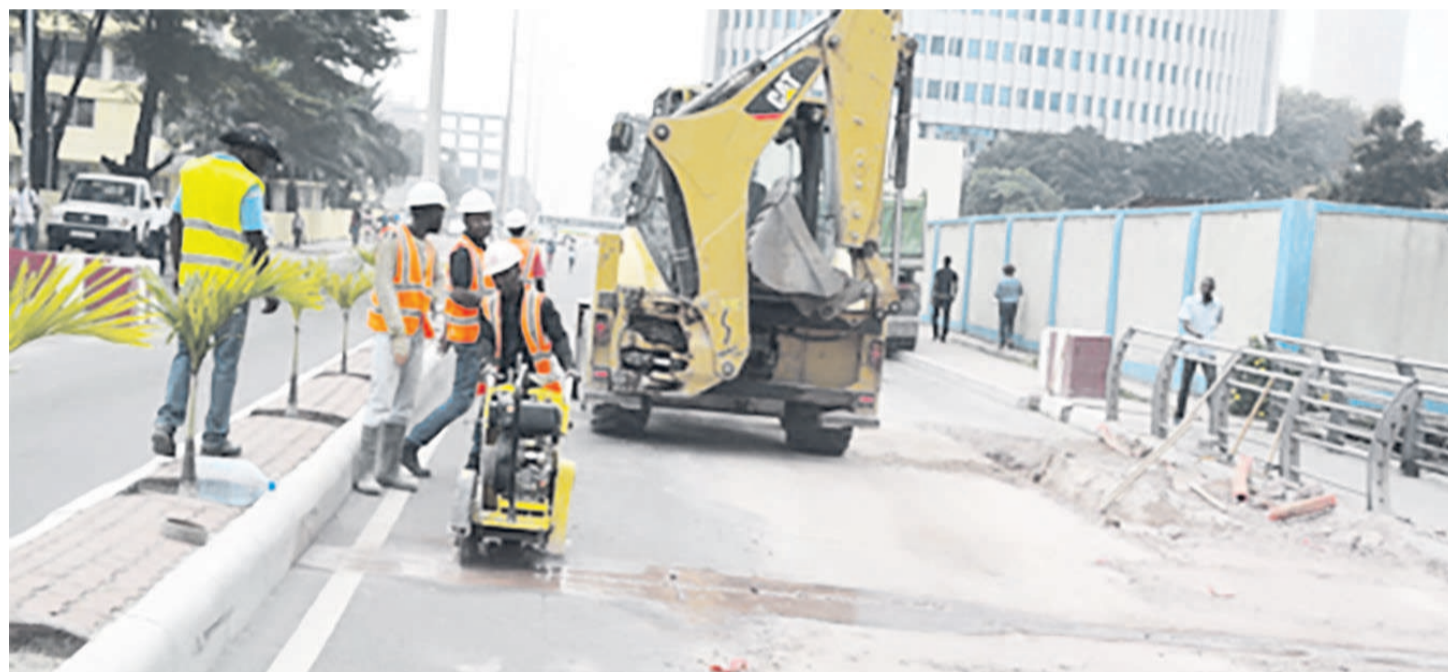
Les agents de la Société Eiffage à pied d'oeuvre

Les travaux d'utilité publique entrepris dans quelques artères du centre-ville de Brazzaville dont le tronçon reliant le siège de la Snpc au rond-point la Coupole, sur le boulevard Denis Sassou N'Guesso, rendent difficile la circulation routière dans ce périmètre.