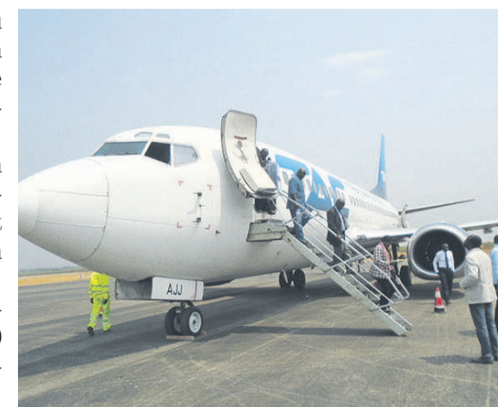
Le Boeing 737 sur l'aire de stationnement