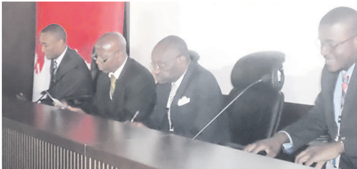
Les orateurs