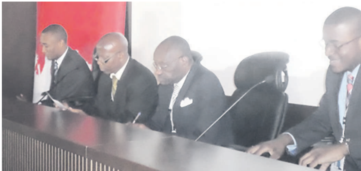
Les orateurs