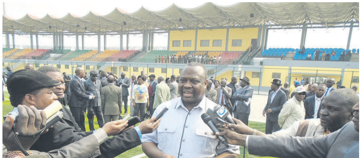
Jean Jacques Bouya répondant aux questions des journalistes dans le stade de Madingou

A trois semaines de la fête du 15 août, l'aéroport de Nkayi est déjà achevé à plus de 95%. Le vol inaugural effectué à bord du Boeing 737-300 de la société Trans Air Congo (TAC), a atterri avec succès le 20 juillet, après 30 mn. Parmi les occupants, le ministre de l'Aménagement du territoire et de la délégalation générale des Grands travaux, Jean Jacques Bouya, les techniciens des grands travaux et quelques cadres et parlementaires originaires de la Bouenza.