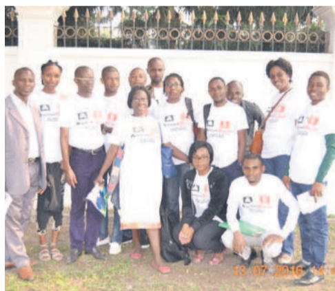
Les participants

La formation qui s'est déroulée du 4 mai au 13 juillet à l'ambassade des Etats-Unis, fait partie d'une série des Webinaires offerts par le gouvernement américain à des centaines de professionnels de l'enseignement de la langue anglaise dans le monde, le but étant de renforcer leurs capacités. La cérémonie de clôture a été une occasion pour les organisateurs de féliciter les 20 professeurs d'anglais qui ont suivi la formation en ligne sur les méthodes interactives de l'enseignement de cette langue, a-t-on appris de l'Association des professeurs de la langue anglaise.