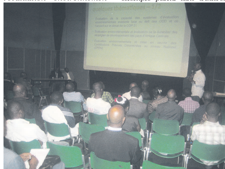
Les participants à la conférence-débat

La situation de Matombi est un exemple parmi tant d'autres