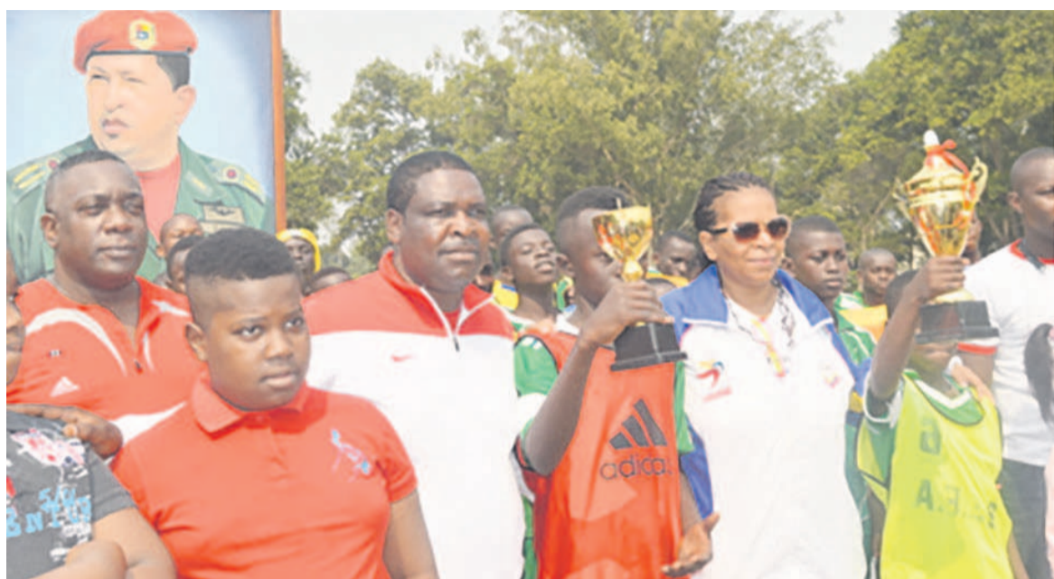
L'ambassadrice Norma Borges en compagnie des jeunes joueurs

L'équipe championne a battu Leister Sefa 3-0 en finale ce 21 juillet à l'esplanade du stade Alphonse-Massamba-Débat.