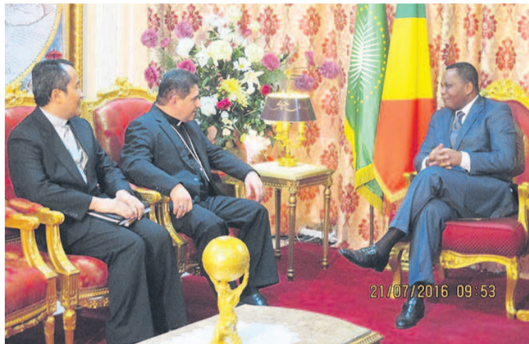
Le ministre Jean Claude Gakosso et Mgr Francisco Escalante Molina

Après sa nomination, le nonce apostolique, Francisco Escalante Molina, a présenté ses civilités au ministre des Affaires étrangères, Jean Claude Gakosso, le 21 juillet à Brazzaville.