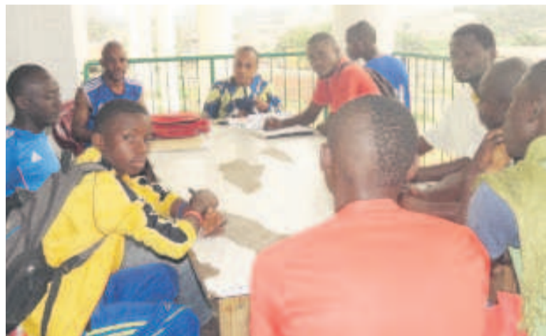
Le bureau de la sous-ligue de Loandjili et les responsables des clubs lors de la réunion technique «Adiac»

Notons qu'en première journée chez les minimales, Barça junior a été battue par Fraternité, 0-1, AS Bebeno ve a courbé l'échine face au Club des bons joueurs, 2-6. FC Avenir et FC Racine ont fait jeu égal, 1 but partout. Tellman FC a été battue par Atlético Vadicé, 1-4. En catégorie cadet, AS