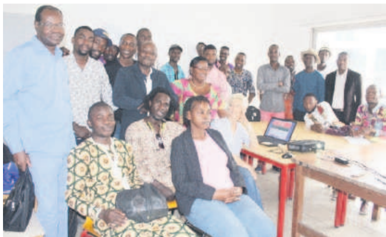
La photo de famille au terme de la rencontre

Bon nombre d'artistes et opérateurs culturels ont pris part aux retrouvailles d'échange et de partage axées sur le spectacle vivant (théâtre, danse live...) qui ont connu la présence de Marcel Poaty, conseiller socioculturel du maire de la ville portuaire. L'occasion a aussi permis à Fabienne