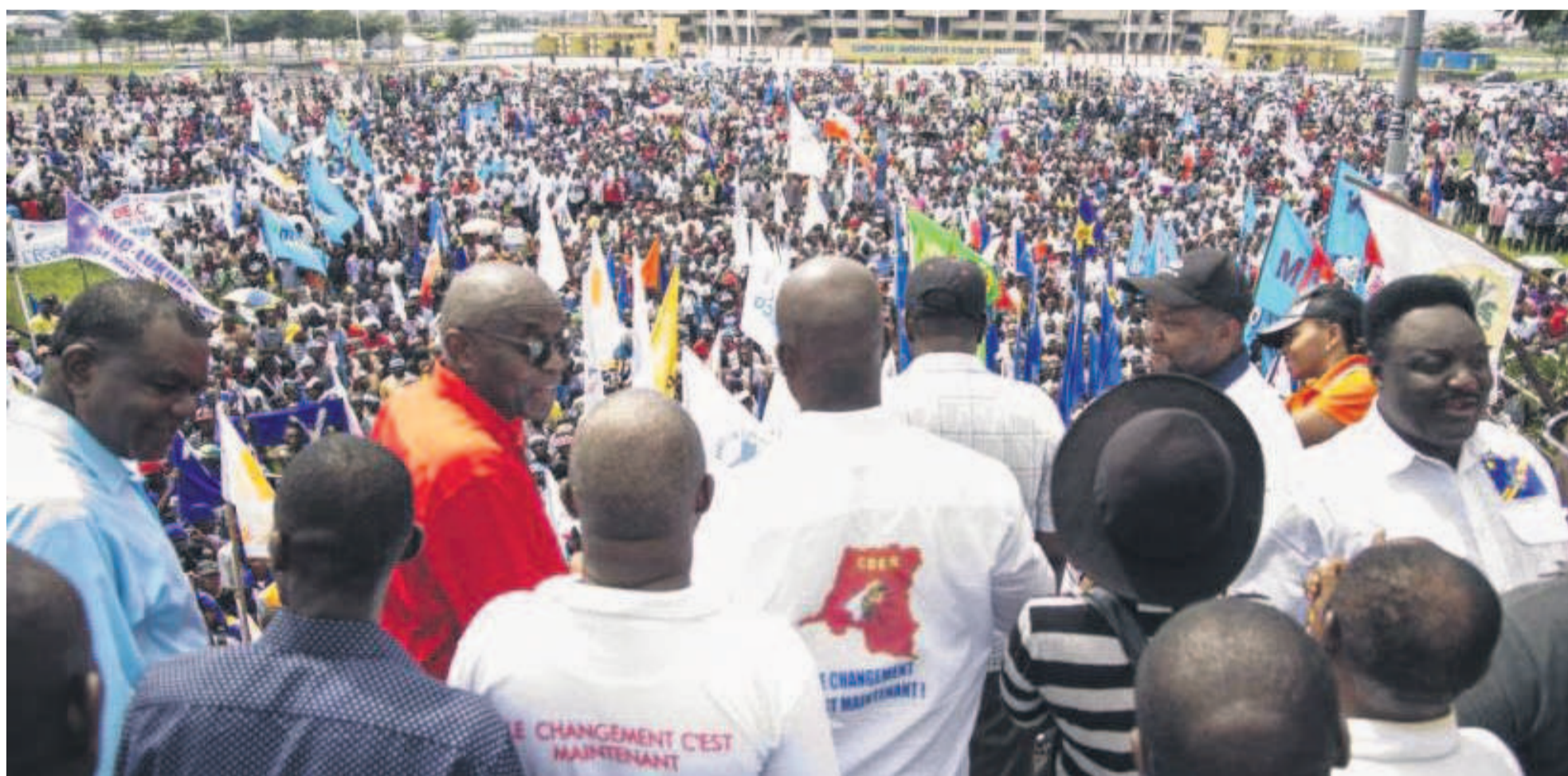
Un grand rassemblement de l'opposition à Kinshasa

La majorité au pouvoir appelle à manifester, le 29 juillet, à Kinshasa pour soutenir l'appel au dialogue inclusif convoqué par le chef de l'État précédant le grand meeting du rassemblement, la coalition des forces d'opposition nouvellement créée à Genval (Belgique) prévu le 31 juillet. Autant que l'opposition qui s'est investie dans une vaste