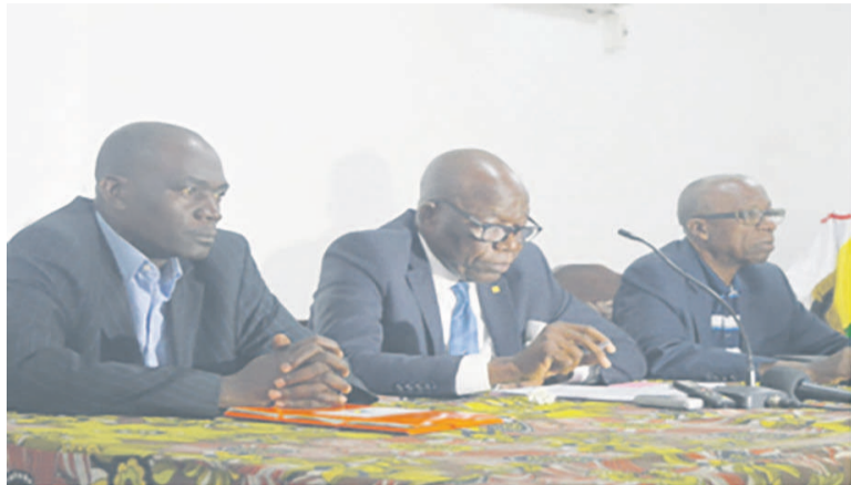
Le présidium des travaux des journées de réflexions

Les travaux des journées de réflexions initiées par le Comité national olympique et sportif congolais (Cnosc) ont permis aux participants d'émettre des suggestions en vue d'un avenir radieux du mouvement olympique et sportif congolais. Ces suggestions qui, assurément seront mises à la disposition du ministère des Sports et de l'éducation physique, n'ont pas été révélées à la presse. Ce qui est vrai, c'est que lors des travaux, les participants ont été scindés par commissions, entre autres, celle des athlètes, de la formation des entraîneurs en Sciences appliquées aux sports, de la révision des textes fondamentaux et dispositions pour les assemblées générales électorales... De quoi dire que les suggestions de ces acteurs sportifs vont dans le sens des thèmes traités en atelier. « Les conclusions auxquelles nous avons abouti nous aiderons à obtenir le changement tant souhaité pour l'olympisme et le sport au Congo », a déclaré Emmanuel Mpio qui clôturait les travaux au nom du président du Cnosc, Raymond Ibata, empêché. Selon lui, au cours de ces mois qui préparent la nouvelle olympiade 2017-2020, tout doit être fait pour que les conclusions de ces journées de réflexions soient concrétisées notamment par la tenue des conseils bilans et des assemblées générales électorales.