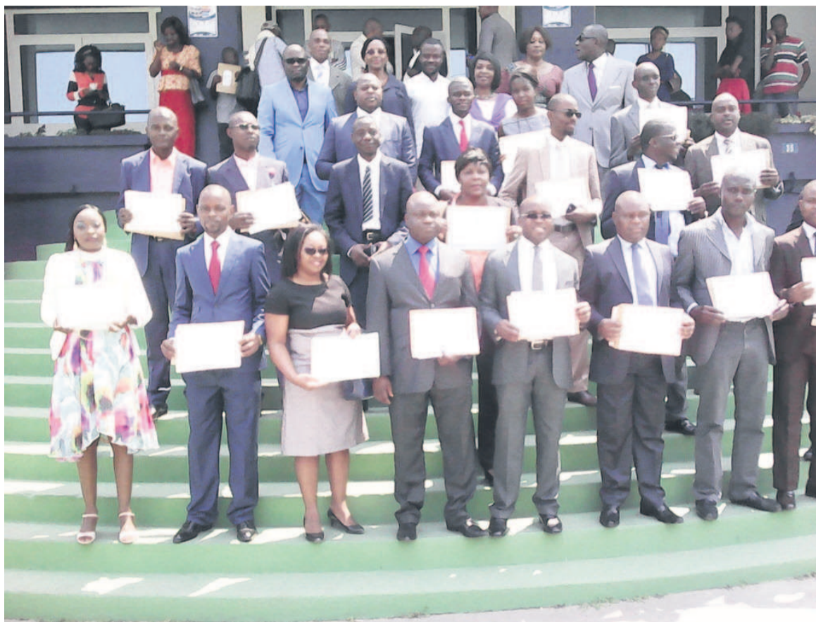
Photo de famille lors de la remise des diplômes de l'ESCIC