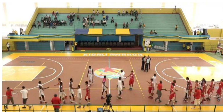
Vue d'un match de la CAN Basket-ball U18 à Kigali

Les Léopards basket-ball messieurs de moins de 18 ans participent, depuis le 22 juillet, à Kigali au Rwanda à l'Afrobasket (Coupe d'Afrique des nations) de la catégorie. La RDC se retrouve dans le groupe B, qualifié de la mort, en compagnie de l'Égypte vainqueur de l'édition précédente de cette compétition, de la Tunisie, de l'Angola, du Bénin et de l'Ouganda. Le groupe A se compose du Rwanda pays hôte du tournoi, du Mali, de la Côte d'Ivoire, du Burkina Faso, du Gabon et du Zimbabwe qui a finalement demandé forfait. C'est la première fois, fait-on remarquer, que les jeunes basket-ballers congolais prennent part à ce type de compétition. La RDC a battu, le 22 juillet, l'Ouganda en premier match