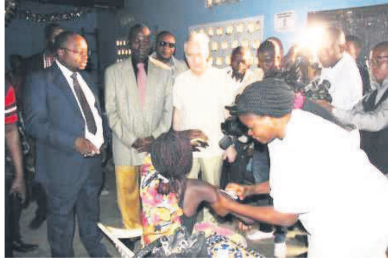
Legendes et credit photos: Le ministre de la Santé au site de vaccination de l'Église CAD

Cette campagne de vaccination qui se déroule en site avancé cible quatre cent soixante-quatre mille sept cent trente personnes. Les enfants de moins de neuf mois et les femmes enceintes ne sont pas concernés par cette campagne. Un site de conserva-