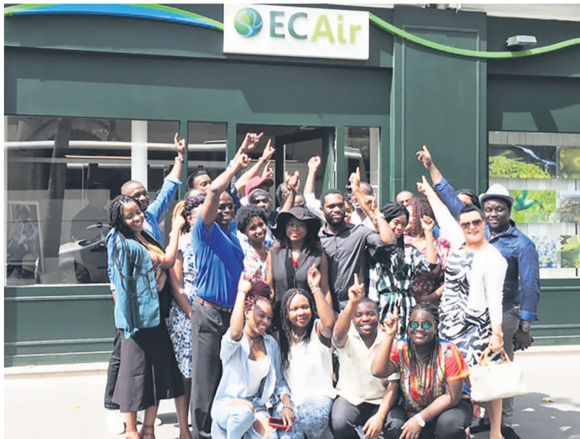
Des étudiants et stagiaires devant le siège d'ECAir à Paris

vé seulement en 1858, sous Napoléon II. Les visiteurs ont aussi appris, entre autres, que les reliques d'Aimé Césaire étaient entreposées au Panthéon. Que Cheikh Anta Diop, historien, anthropologue, égyptologue et homme politique sénégalais, qui a mis l'accent