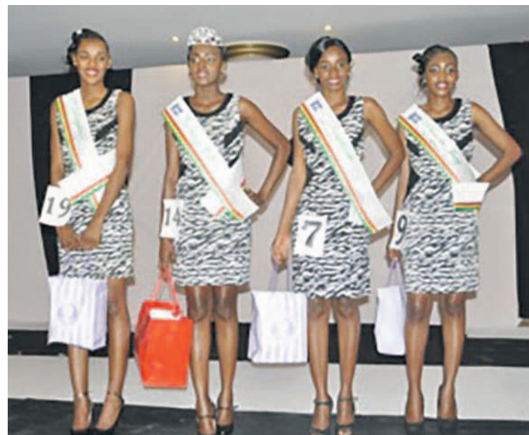
La miss entourée de ses deux dauphines. À l'extrême gauche, le prix du jury