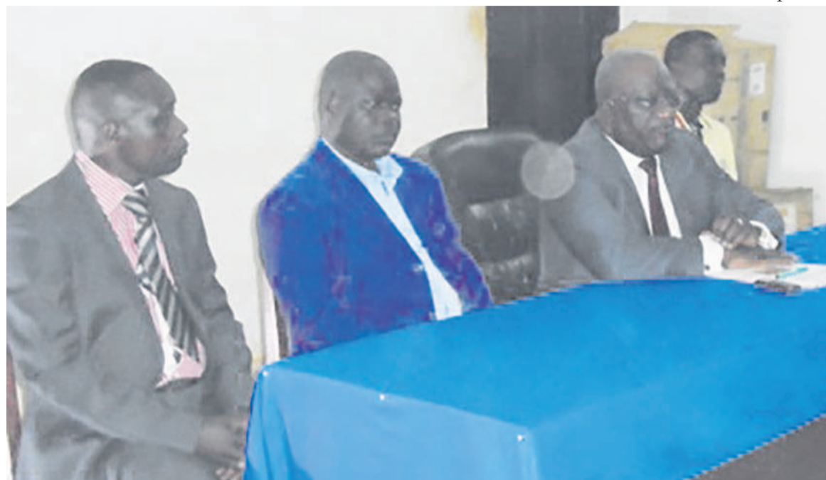
Léon Alfred Opimbat s'adressant aux cadres des sports de la Bouenza