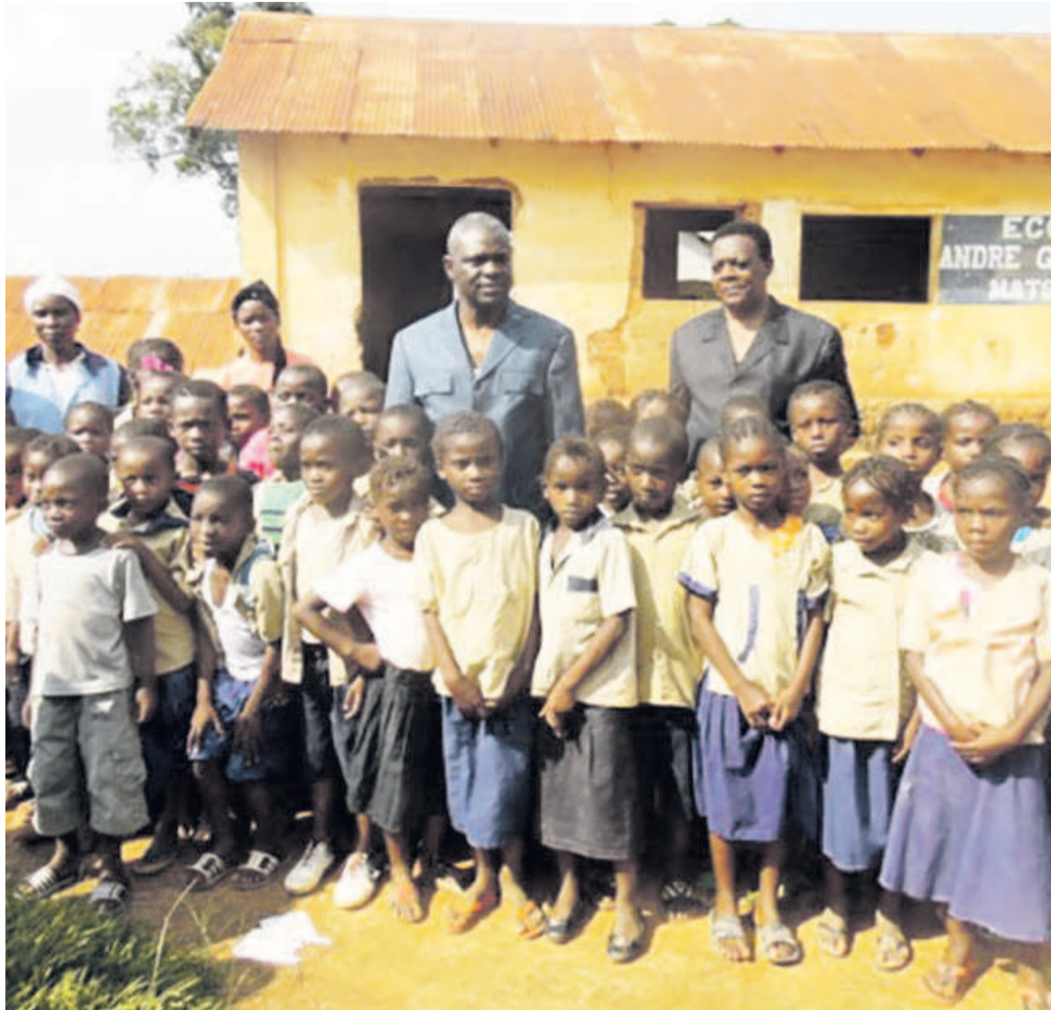
Le ministre Anatole Collinet Makosso et le préfet du Pool entourés des élèves de l'école primaire de Mindouli habillés en tenue recommandée