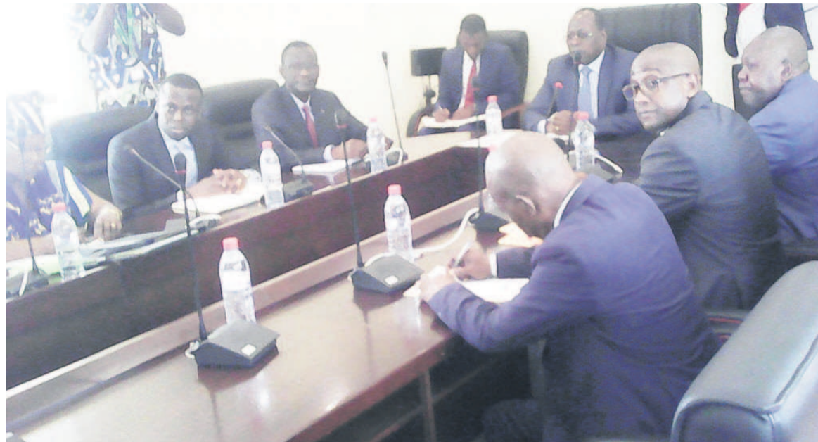
Le ministre Gilbert Mokoki ouvrant la réunion

Aussi les participants ont-ils souhaité que l'OMAOC retrouve tous ses pouvoirs en tant que leitmotiv de la sécurité maritime. « Il a été rappelé que le mémorandum d'entente encourage la mutualisation des moyens à permettre à un État de bénéficier de l'appui des autres États », a-t-il renchéri. D'autres décisions ont été prises lors de la table ronde. « La Banque africaine de développement (BAD) s'est proposé en relation avec l'OMAOC d'élaborer un plan d'action de mise en œuvre du réseau sous-régional intégré de la fonction de garde-côte à partir d'un diagnostic à établir des effets de la piraterie et des