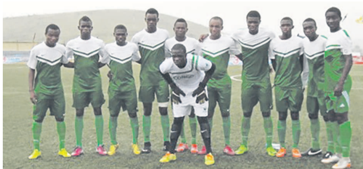
Les Diables rouges U-17, lors de la 3e édition de la Djiri Cup

teurs à revoir la formule de la compétition. Elle ne se jouera que sous forme d'un mini championnat. L'équipe qui aura plus de points sera sacrée championne de la compétition qui servira aussi à la préparation des éliminatoires de la Coupe d'Afrique des nations des moins de 17 ans. Programme des rencontres