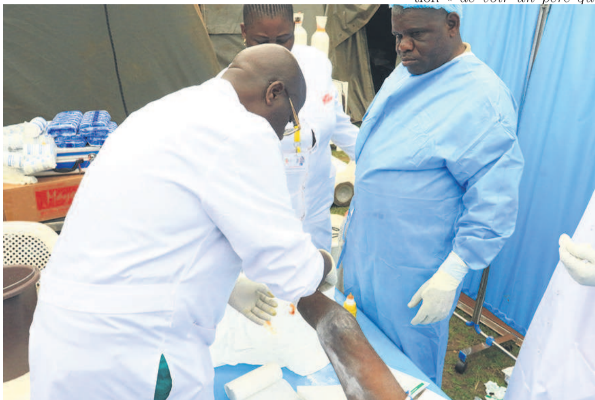
La campagne des soins s'achève le 10 août

Le programme de santé communautaire s'est assigné l'objectif d'assurer aux populations démunies un accès gratuit aux soins de santé de qualité, sans faire de longues distances. À Madingou, comme partout où ce programme est passé, le corps médical et la coordination technique mettent en commun l'ambition d'appuyer le système national de santé. Le superviseur de la mission,