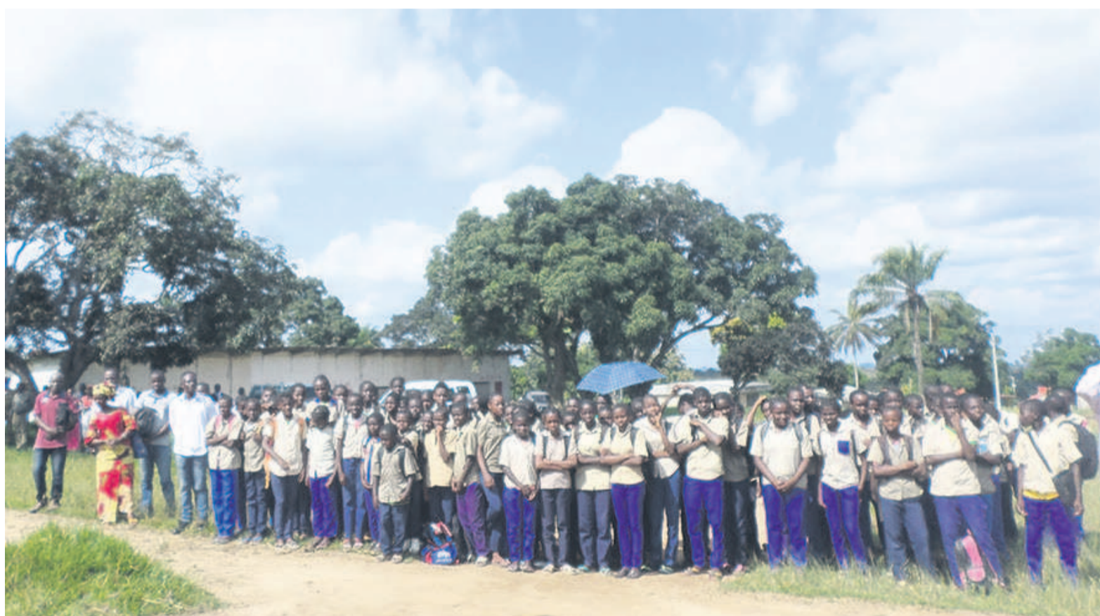
Au lycée : pantalon bleu sombre, chemise bleue ciel pour les filles ; pantalon et chemise kaki pour les garçons

Le ministère de l'Enseignement primaire, secondaire et de l'alphabetisation a officialisé l'uniformisation de la tenue scolaire