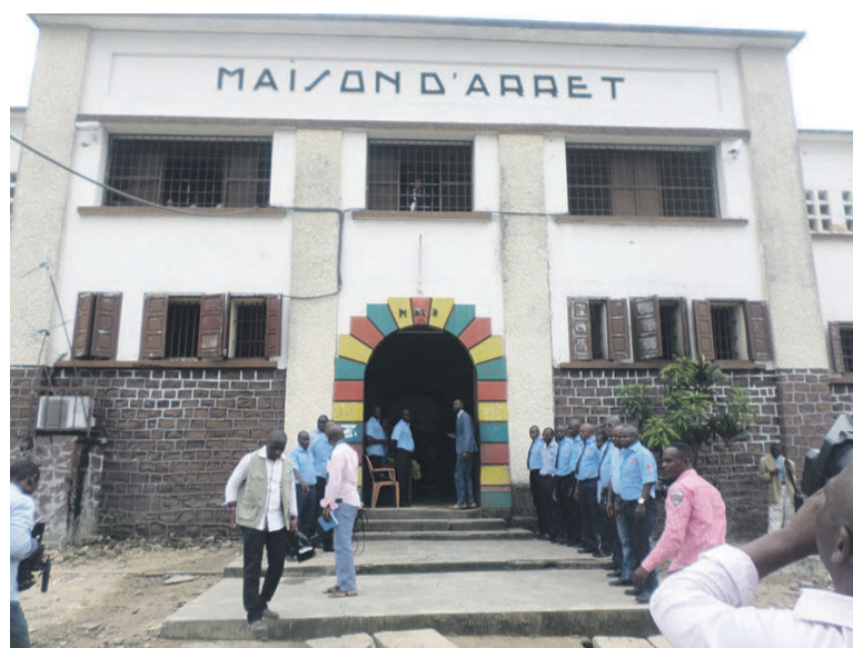
Une vue de la Maison d'arrêt de Brazzaville

cellule à la Maison d'arrêt de Brazzaville, tout en saluant ses militants qui l'ont soutenu jusqu'à cette dernière décision. Membre de l'UPC, Destin regrette quant à lui, une décision politique en dépit du manque d'éléments matériel et moral. « Même le ministère public était incapable d'apporter des preuves, tout ce que nous avons assisté, c'est une mascarade judiciaire. Nous regrettons une décision dictée de quelque part, mais nous sommes en politique, nous avons défendu une cause juste le 20 octobre 2015, qui était conforme à la Constitution du 20 janvier 2002, notre président a le moral, avec nos avocats,